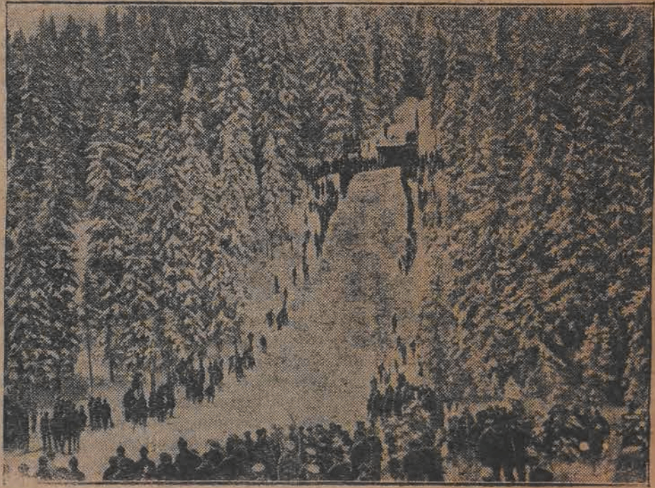
Stocznia Holmenkollen w Oslo gdzie się międzynarodowe zawody narciarskie. od 23 lutego do 3 marca odbywają a

Nietylko więc robotnicy ci nie znajdują w Belgii pracy, której szukają, ale narażają się na straty materialne, przykrości i poniewierkę wskutek braku odpowiednich dowodów podróży.