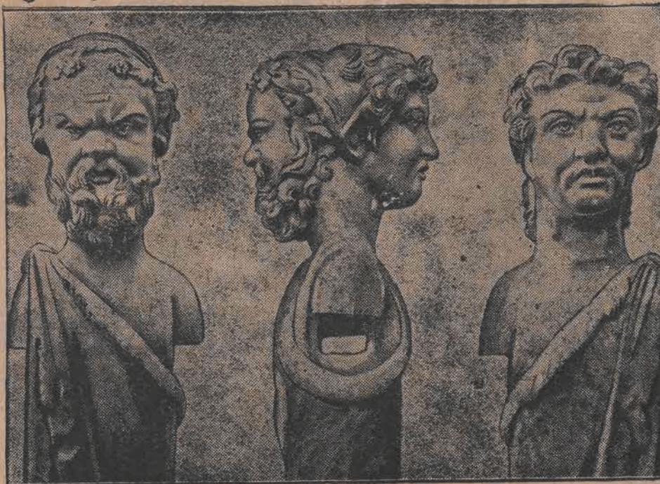
Bronzowa statua dwulicowa została osuszonego celem wydobycia określona znaleziona na dnie jeziora Nemi, tów Kaliguli.

MIOD KURACYJNY czysto pszczeliny z własnej pasieki sprzedaje 1 kg. 5,50 od 5 do 10 kg. po 5 zł. Pałac Piłsudskiego, ul. Sulejowska 2 I piętro k 2404