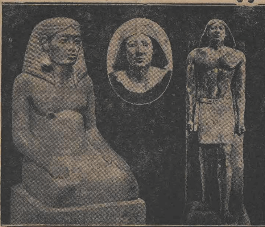
Na drodze wymiany popiersia Nefretete ma otrzymać muzeum berlińskie od Egiptu figury, wykute w piaskowca, Amenhotep (na lewo) i Ranofer (na prawo). W wycinku głowa Ranofera.