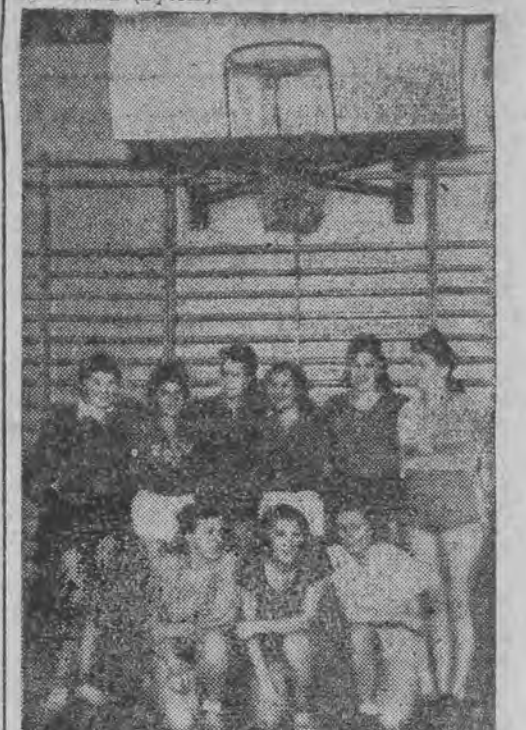
Koszykarki Zrywu triumfowały w mistrzostwach ZRSS, zdobywając pierwsze miejsce w turnieju przed TUR-em (Bytom)

W koszykówce kobiecej startowały 3 drużyny: Zryw (Łódź), TUR (Bytom) i Ruch (Chojnice). Pierwsze miejsce i tytuł mistrzowski zdobył Zryw (Łódź), zwyciężając TUR (Bytom) 27:9 i Ruch 40:4. Drugie miejsce zajęła drużyna TUR-u (Bytom).