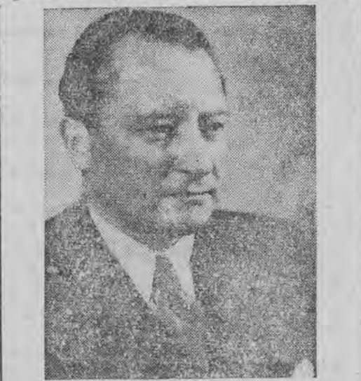
Vlado Clementis wiceminister spraw zagr. Czechosłowacji

Przypomnę tutaj fakt następujący: W grudniu 1943 r. podczas pobytu prezydenta Benesa w Moskwie została podpisana umowa sojusznicza między Czechosłowacją i ZSRR. W tym samym czasie w Słowacji zebrał się działacz podziemnego ruchu oporu w celu stworzenia Słowackiej Rady Narodowej, tej właśnie Rady, która przygotowała i prowadziła w 1944 r. masowe powstanie narodu słowackiego. Na owo zebrań przyjęto program walki o wyzwolenie, ustalono główne wytyczne budownictwa nowego naszego państwa. Pierwszym punktem tego programu była, oczywiście odbudowa Republiki Czechosłowackiej, jako państwa dwóch równouprawnionych narodów, Czechów i Słowaków; drugi punkt natomiast stwierdza, że nowa republika ma zawrzeć trwałe i nierozrwalny sojusz polityczny i wojskowy ze Związkiem Radzieckim. Następnym punktem programu było