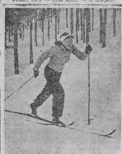
ZOJA BOŁOTOWA czołowa narciarka Związku Radzieckiego