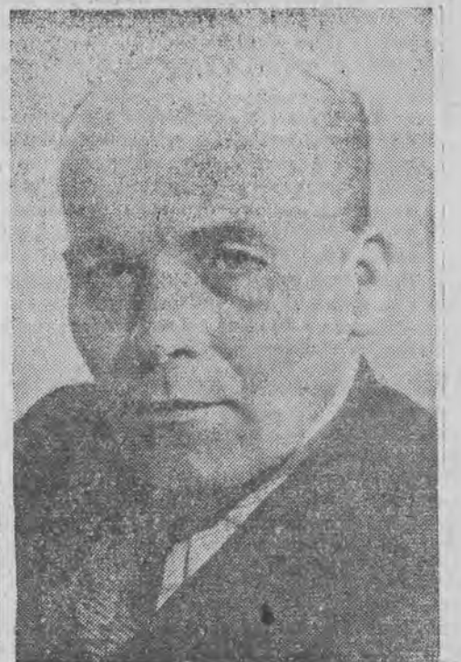
NIANIA PRZYJAŹNI Z NARODAMI ZW. RADZIECKIEGO JEST NAJLEPSZYM SPRAWDZIANYM EWOLUCJI IDEOLOGICZNEJ, JAKA ZACHODZI TAK W PPS JAK I W INNYCH PARTIACH BLOKU DEMOKRATYCZNEGO.

5 ROZWIJAJĄCY SIĘ WSPANIALE W NARODZIE POLSKIM PROCES ZACIEŚ-