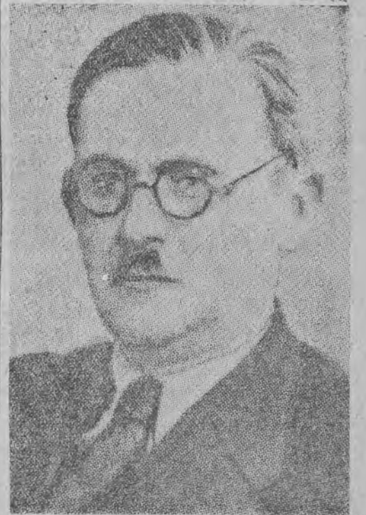
tem wzięcia stworzenia ścisłego gospodarczego polsko-czechosłowackiego sojuszu.

Wydaje mi się, że rada postąpiła słusznie, jeśli zwróci się do rządów obu krajów o wyłonienie specjalnej autorytatywnej komisji, której zleci w ciągu 3-4 miesięcy opracowanie dokładnego planu rozszerzenia gospodarczych stosunków polsko-czechosłowackich, pod ka-