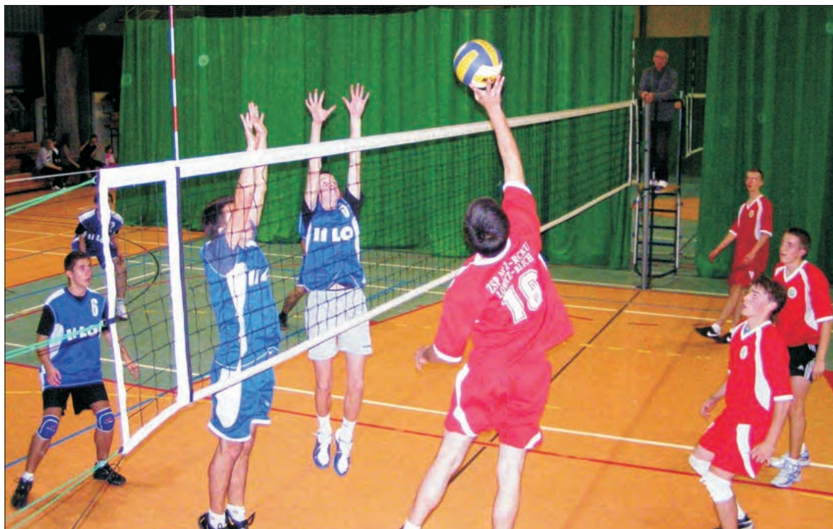
Po ciekawym meczu licealiści z „Medyka” pokonali rywali z Blichu.