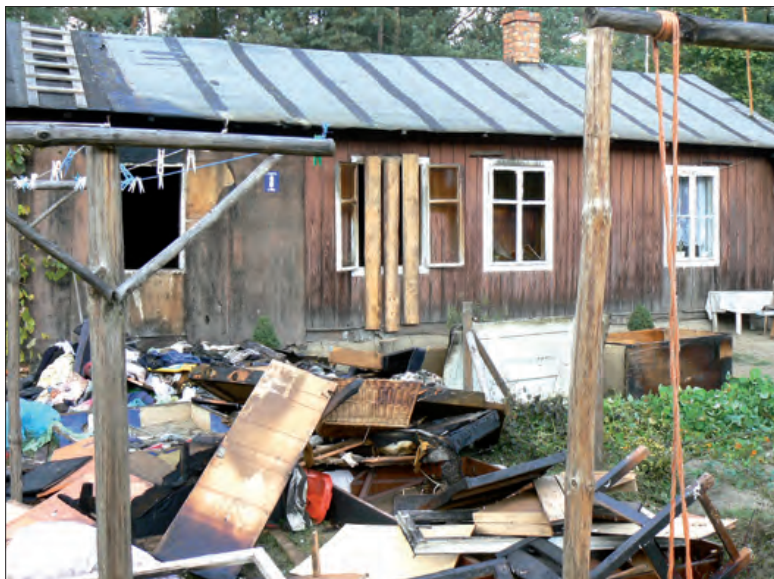
Drewniany budynek po pożarze nadaje się tylko do rozbiórki.

- Straciliśmy prawie wszystko. Zostaliśmy w tym, w czym wyszliśmy z domu. Cieszę się jednak z tego, że pożar nie wybuchł w nocy - dodaje poszkodowana. Obecnie cała rodzina przebywa w hotelu Mazowieckiej Wyższej Szkoły Humanistyczno-Ekonomicznej. Pokój opłaca gmina Łowicz