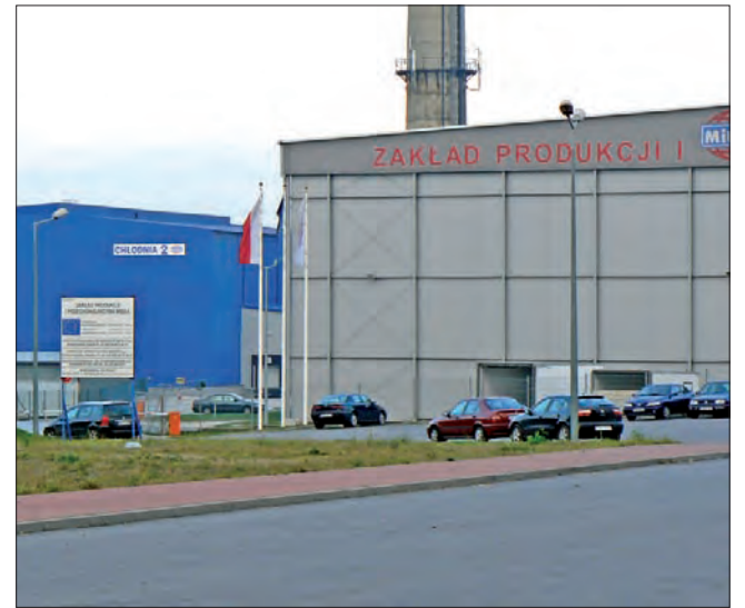
Mitmar - 100% własność Pamapol SA.