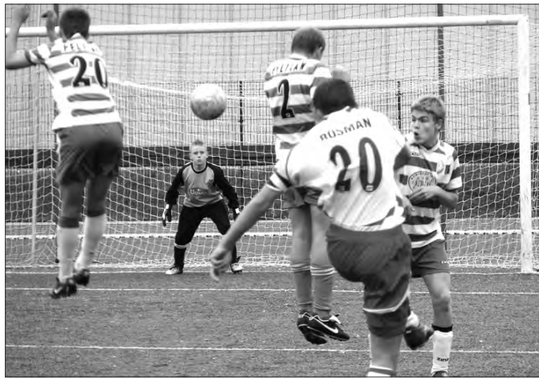
Ekipa Pelikana-95 nie zdołała obronić się przed atakami rywali z ŁKS.

W 11. kolejce juniorzy młodszy Pelikana zagrają w Piotrkowie Trybunalskim z Piotrcovią, gdzie na pewno powalczą o zwycięstwo.