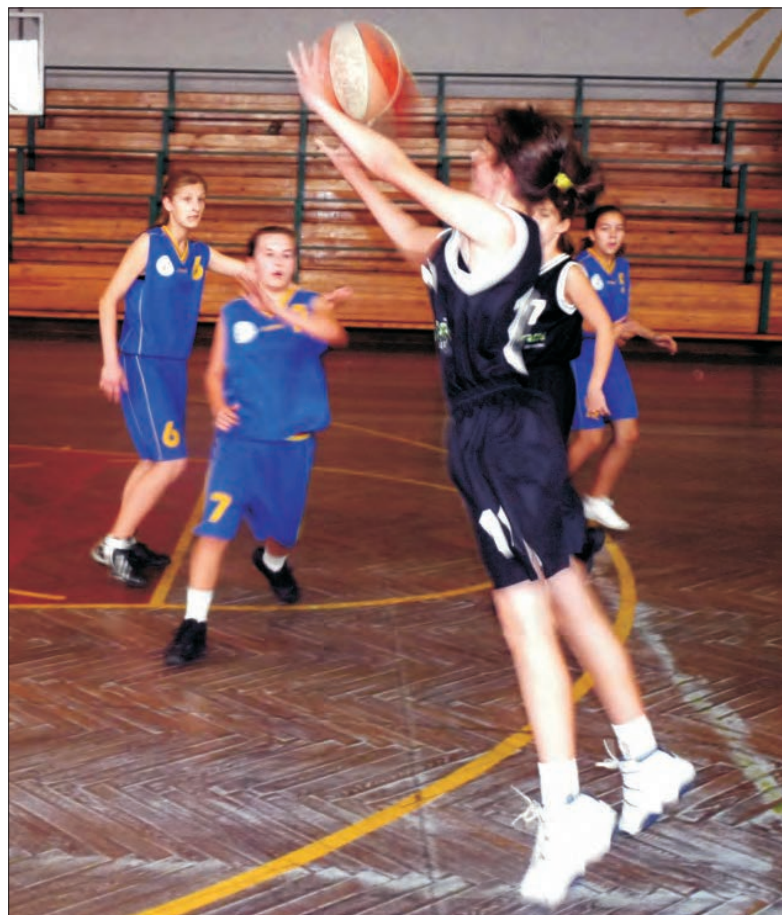
Młodziczki Księżaka przegrały, ale tym razem już powalczyły...

Koszykówka - 2. kolejka wojewódzkiej ligi młodzików U-14