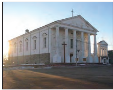
Kościół św. Józefa w Wołożynie w obwodzie mińskim.