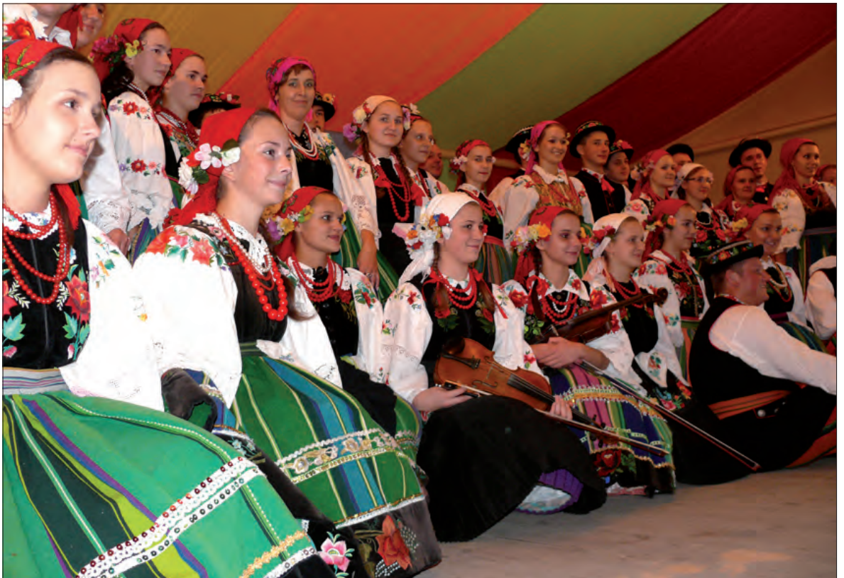
Zespół Boczki Chelmońskie świętował w niedzielę 35 lat istnienia. Przez półtorej godziny tańczył i śpiewał nie tylko obecny skład zespołu (na zdjęciu), ale i jego dawni członkowie - choć ruszali w tany niemal bez prób. Więcej na str. 23.

Ponadto burmistrz ujawnił kulisy dyskusji o podatkach i propozycji składanych przez dyrekcję Zakładu Usług Komunalnych i Zakładu Gospodarki Mieszkaniowej. - ZUK proponował podwyżkę cen wody i ścieków na poziomie 5%. Dyrektor Mika z ZGM najpierw proponowała podwyżkę czynszów w mieszkaniach komunalnych na poziomie około 10%, potem 7%, wreszcie 4,5% - mówił burmistrz. Jednocześnie nie ukrywał, że rezygnacja z proponowanych podwyżek, to uszczuplenie wpływów do budżetu miasta w wysokości około 1 miliona złotych w skali roku. (mak)