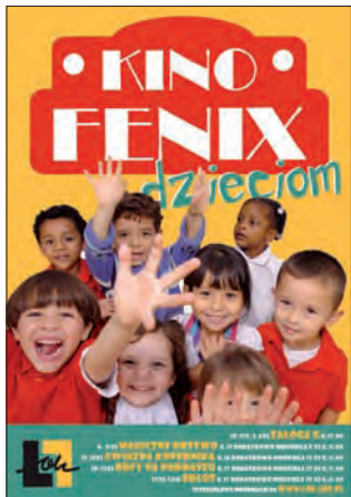
Nowa propozycja kina ma przyciągnąć młodych odbiorców.

- Chcemy do kina przyciągnąć całe rodziny i zarazić najmłodszych łowiczanków miłością do dużego obrazu - dodaje Malangiewicz. (jr)