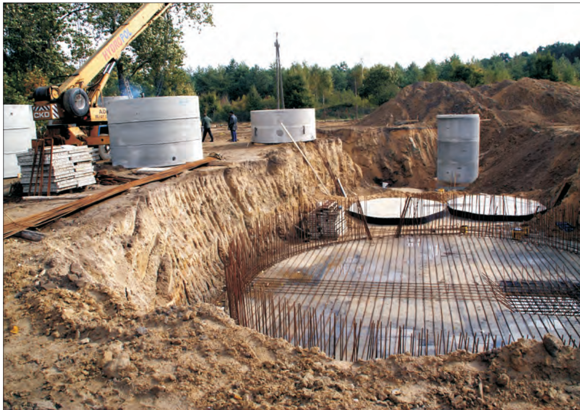
Fundamenty zbiorników kiernozkiej oczyszczalni ścieków.

Rada Powiatu głosowała najpierw wniosek radnego Andrzeja Figata na temat pozostawienia poradni chorób płuc. Poparło go 8 radnych, 9 wstrzymało się od głosu. Za likwidacją 7 poradni było 17 radnych, 1 osoba wstrzymała się od głosu. (mwk)