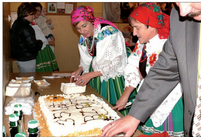
Pod koniec koncertu poczęstowano wszystkich gości specjalnie przygotowanym na tę okoliczność tortem.