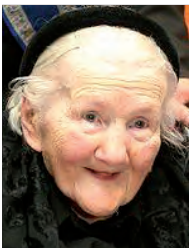
Irena Sendlerowa dożyła 98 lat.

W 1943 r. Sendlerowa została aresztowana przez Gestapo. Była więziona i torturowana. Udało jej się uniknąć wyroku śmierci dzięki pomocy ze strony „Żegoty”, która zdołała ją uratować, przekupując niemieckich strażników. Po wyjściu z więzienia ponownie zaangażowała się w pomoc dzieciom. Dzięki temu przez całą wojnę udało jej się ocalić ok. 2500 dzieci. Irena Sendlerowa również po wojnie pracowała na rzecz