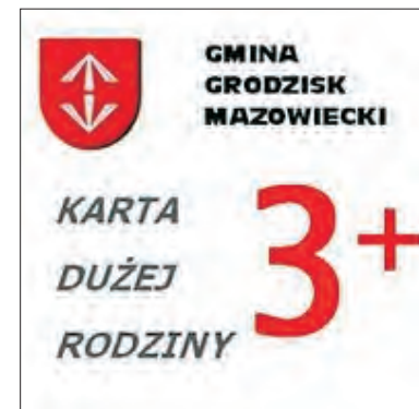
Tak wygląda Karta wydawana w Grodzisku.