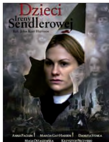
Film o polskiej bohaterce obejrzało w USA 10 mln widzów.

w Warszawie getta. W grudniu 1942 r. została szefową wydziału dziecięcego w Radzie Pomocy Żydom „Żegota”. Irena Sendlerowa organizowała ucieczki dzieci żydowskich z getta, umieszczając je później w przybranych rodzinach, domach dziecka i u sióstr katolickich w Warszawie, Turkowicach i Chotomowie.