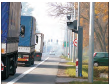
Fotoradar stanął na Poznańskiej.

M asz fotoradarowy zainstalowano przy drodze krajowej nr 2 w Łowiczu przy pasie ruchu samochodów jadących w kierunku Poznania, na wysokości magazynów Łowickiej Spółdzielni Mleczarskiej, w pobliżu ul. Chełmońskiego.