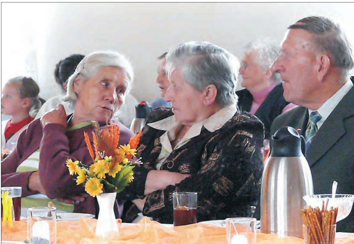
Seniorzy oglądający występ zespołu Kalina na bieżąco wymieniali swoje spostrzeżenia na jego temat.

śmiertelnych, m.in. jednego z udziałem motocyklisty. W tym samym czasie zainstalowane zostały także, o czym już pisaliśmy na łamach NL, dwa maszty na drodze nr 14 biegnącej przez wieś Jamno: jeden od strony Łowicza 200 m do drogi do Grudzy Starych i drugi od strony Łodzi, znajdujący się na wprost szkolnego budynku, 150 m od przejścia dla pieszych. (eb)