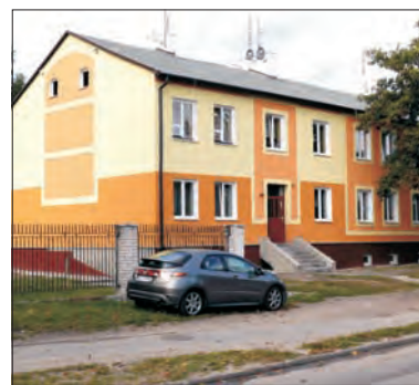
Budowane w latach 20. ubiegłego stulecia bloki wyglądają w końcu estetycznie.

ZGM kolejne 36 tys. złotych wydał w tym roku na remont mniejszego bloku -