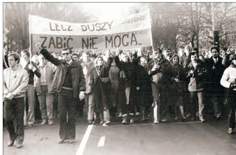
To jeden z tych transparentów, które wtedy takie wrażenie zrobiły na autorze relacji.

A kiedy są czytane wyjątki z homilii księdza Popiełuszki, wydaje się, że on stoi wśród nas przy ołtarzu i mówi jak 26 lutego br. na mszy św. za Ojczyznę: „... musicie mieć w sobie coś z orłów, serce orle i wzrok orli - jak mówił zmarły Prymas. Musicie ducha hartować i wznosić wysoko, aby móc, jak orły przelatywać ponad wszelkim innym ptactwem w przyszłość naszej Ojczyzny. Tylko będąc jak orły, potrafiacie przebić się przez wszystkie dziejowe przełomy, wichry i burze, nie dając się spętać żadną niewolą. Pamiętajcie, orły to wolne ptaki, szubują wysoko, a nie pelżają po ziemi”.