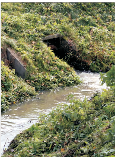
Kanał Malinówka wypełnił się w niedzielę ściekami płynącymi do Bzury.