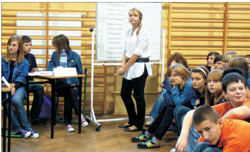
Po lewej stronie uczniowie Gimnazjum nr 2, którzy zwyciężyli w konkursie szkolnym wiedzy o patriotce, a w konkursie powiatowym byli ekspertami