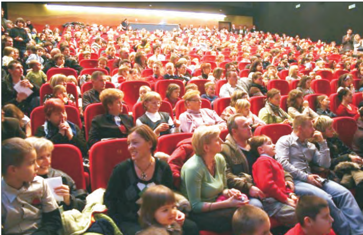
Nie jest prawdą, że duże rodziny to przeszłość. Przed rokiem, na uroczystej inauguracji Karty Dużej Rodziny w Grodzisku Mazowieckim, miejscowa sala widowiskowa, mająca 350 miejsc, pękła w szwach. Przyszło 800 osób.

Karta taka funkcjonuje już w kilku miastach, m.in. wprowadzono ją decyzją radnych w Grodzisku Mazowieckim, w Ty-