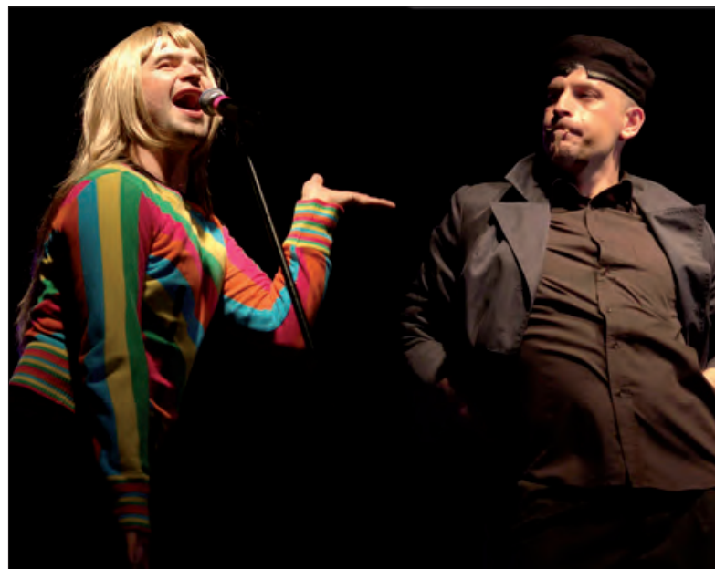
Na zdjęciu widoczny fragment najpopularniejszego skeczu Paranienormalnych - Mariolki.

Pierwszych pięciu czytelników NL, którzy pojawią się dziś w Biurze Ogłoszeń przy ulicy Pijarskiej w Łowiczu z papierowym wydaniem naszej gazety, otrzyma bezpłatne podwójne zaproszenia na występ Paranienormalnych. (jr)