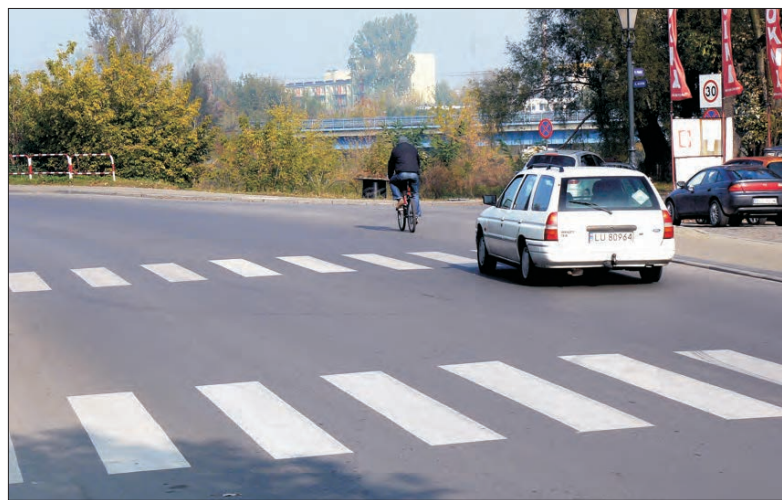
Docelowo na ul. Mostowej pozostaną tylko pasy będące na pierwszym planie, te bliżej mostu zostaną zamalowane.