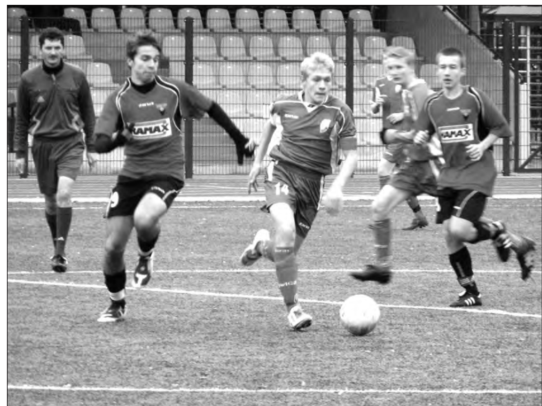
Juniorzy młodszy Pelikana przegrali w Łowiczu 2:4.