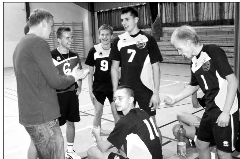
Siatkarze Korabki na razie mają jeden punkt na koncie.