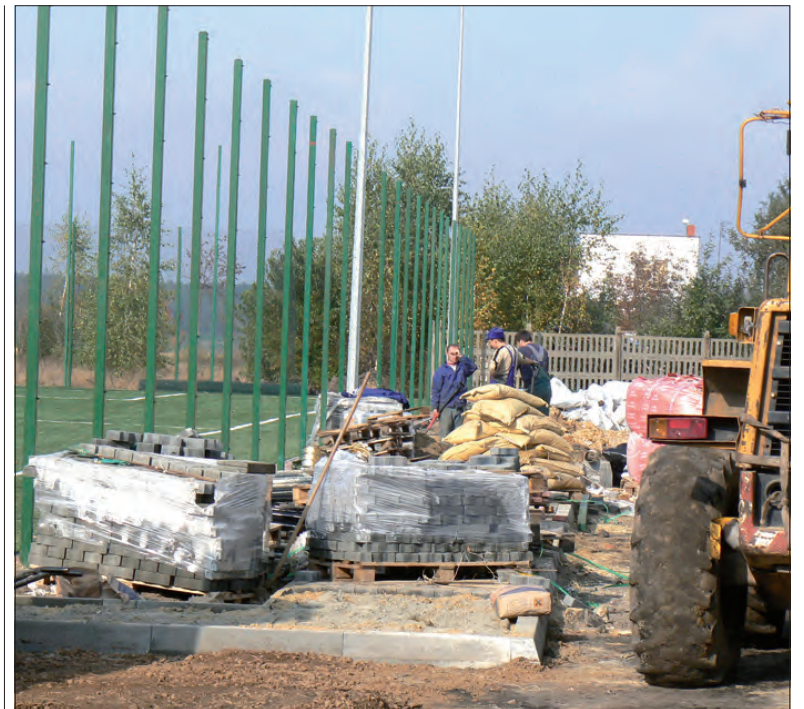
Prace na Orliku w Popowie, mimo upływu terminu 15 października, są jeszcze dalekie od ukończenia.

Firma Petrolis ze Zwolenia - ta sama, która wygrała przetarg na dostawę oleju opałowego do szkół na terenie gminy Łyszkowice - dostarczy olej na sezon grzewczy 2009/2010 w ilości 70 tys. litrów do kotłowni na terenie gminy Chaśno. Olej trafi do budynku Urzędu Gminy w Chaśnie, Szkoły Podstawowej w Błędowie, domu nauczyciela w Błędowie i Szkoły Podstawowej w Mastkach. Firma Petrolis złożyła ofertę z najniższą ceną spośród 7 oferentów. Gmina zapłaci za olej opałowy łącznie 142.618 zł. Najdroższa z ofert wynosiła ok. 158 tys. zł.