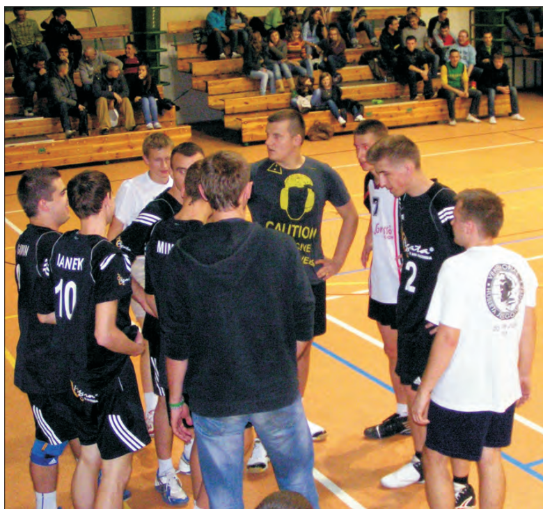
Drużyna Agata Team będzie jednym z faworytów grupy B.

ski tytuł na pewno będzie liczyło się kilka ekip. Wśród nich można wymienić Agatę Team, BS TKKF 45 Głowno i Skierniewicki Węgiel. Czy pojawi się jeszcze jakiś zespół, który dołączy do tej trójki? Pokażą