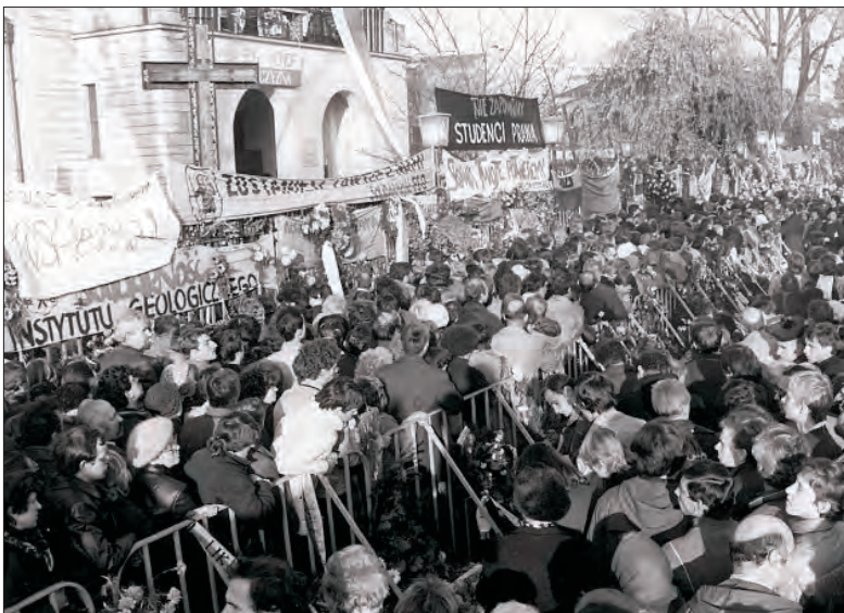
Dzień pogrzebu. Tłumy przed wejściem do kościoła św. Stanisława Kostki na Żoliborzu.

lewskiego, z kazaniem wikariusza ks. Zbigniewa Grankowskiego. W Kocierzewie ta msza była poprzedzona 5-minutowym biciem dzwonów, pieśnią „Boże coś Polskę” i właśnie tym wspomnieniem uczestnika pogrzebu. Oto ono.