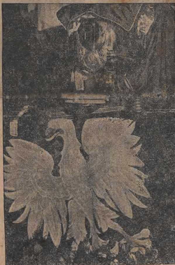
Urna z sercem Marszałka. Na tle sztandaru z godłem Państwa, maciejówka i buława (zdjęcie lewe). Kaplica Obrońców Wilna i mogiły na cmentarzu Rossa, wśród których spoczęło serce Marszałka (zdjęcie prawe).

W kilka minut później przy był samochodem, zatrzymując się przed Ostrą Bramą, Pan Prezydent Rzeczypospolitej w otoczeniu domu cywilnego i woj-