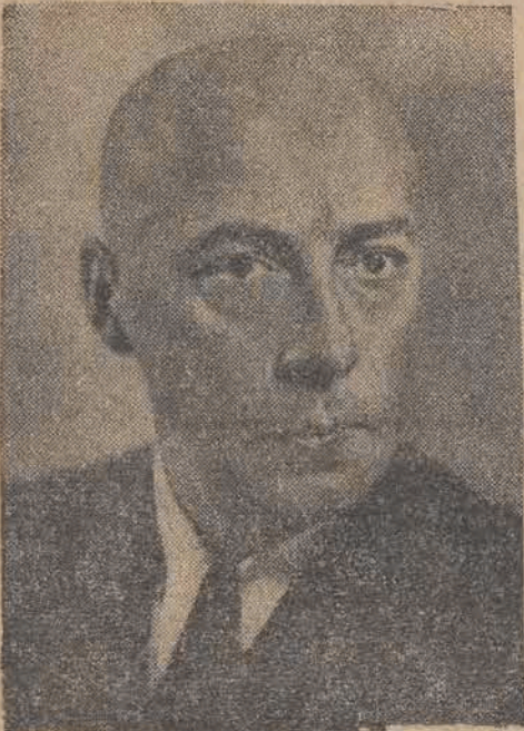
Obywatelu Prezydencie! Mili Goście!

Do zebranych wygłosił przemówienie Premier tow. J. Cyrankiewicz oraz Prezydent Ob. Bolesław Bierut.