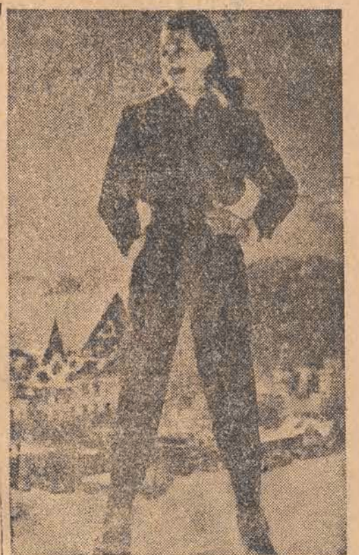
St. Moritz w chwili obecnej jest na ustach wszystkich sportowców świata. Fragment klimatycznej miejscowości w Szwajcarii widzimy na drugim planie. Ale nawet ta uroczą narciarka nie załamie uroku gór i słońca

POLSKA UCZESTNICZY W OLIMPIJSKIM TURNIEJU HOKEJOWYM Reprezentacja hokejowa Polski została ostatecznie zgłoszona do udziału w zimowych