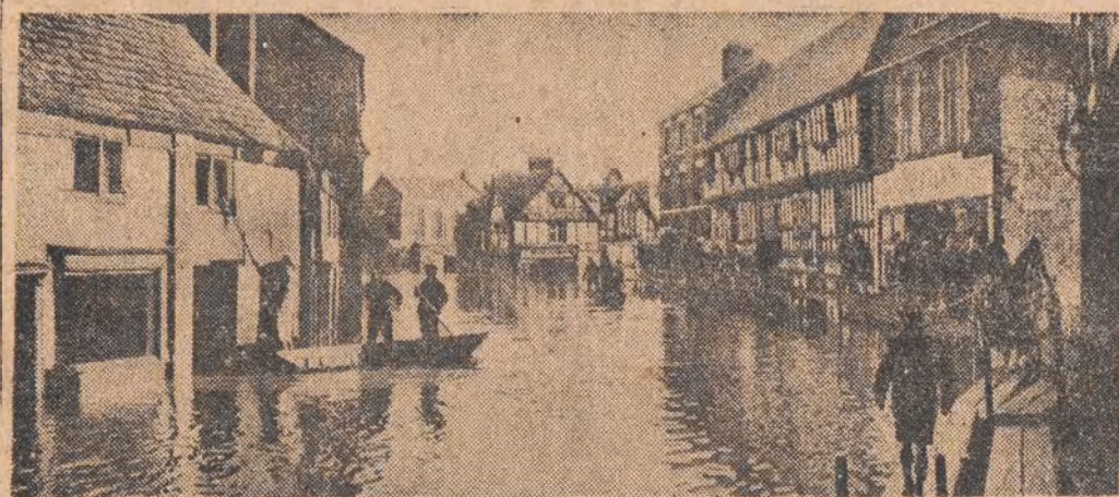
Na skutek długotrwałych deszczów szereg rzek w Anglii wystąpiło z brzegów. Szczególnie silnie wylała rzeka Severn w hrabstwie Shrewsbury i Worcester. Na il. — miasto Shrewsbury pod wodą.