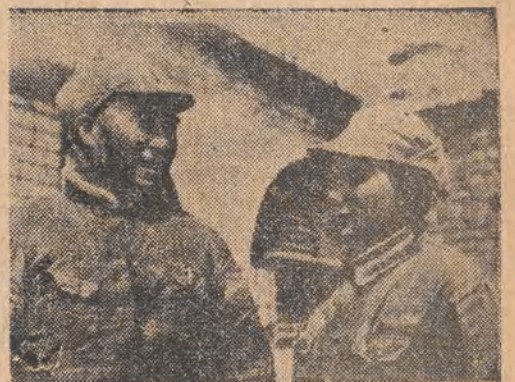
Wódz naczelny chińskiej armii ludowej general Czu-Tej — wraz ze swoją żoną Kang-Kej-Czing kieruje operacjami na siedmiu tronach w Mandżurii i w całych prawie Chinach.

WARSZAWA PAP. — Wobec beznadziejnej sytuacji wojsk Czang-Kai-Szeka otoczonych w rejonie Mukdena — rozpoczęła się ewakuacja dostojników kuomintangowskich i ich rodzin z Mukdena drogą powietrzną do Pekinu. Dzienniki donoszą, że bilet na samolot do Pekinu kosztuje w Mukdenie 40 milionów dolarów chińskich.