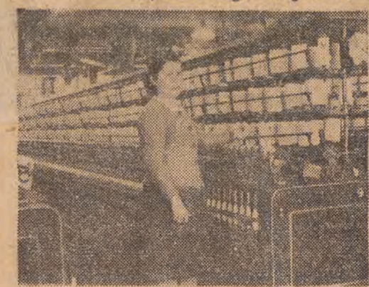
Fragment halli fabrycznej „Częstochowianki”

(Od specjalnego wysłannika „Głosu Robotniczego”)