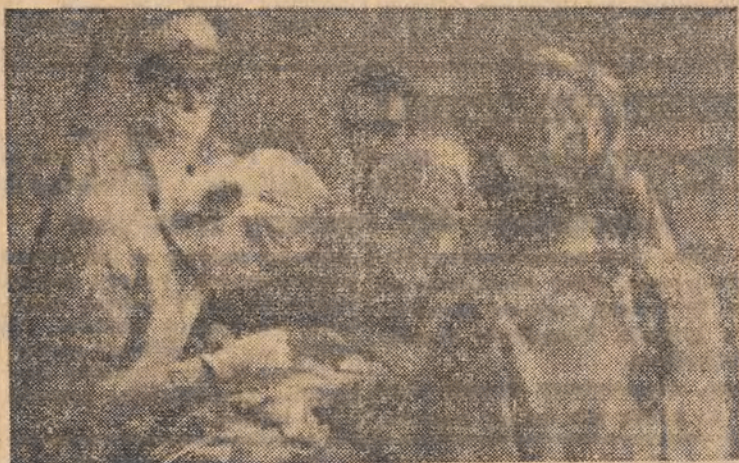
Pierwsza operacja w nowym szpitalu.

Do niedawna nie było w Zgierzu szpitala, a to z braku lokalu. Dzięki staraniom Zarządu Miejskiego i przychylności Rady Zakładowej PZPB w Zgierzu, zorganizowano szpital miejski przy zakładach bawełnianych w dawnej willi fabrykanta.