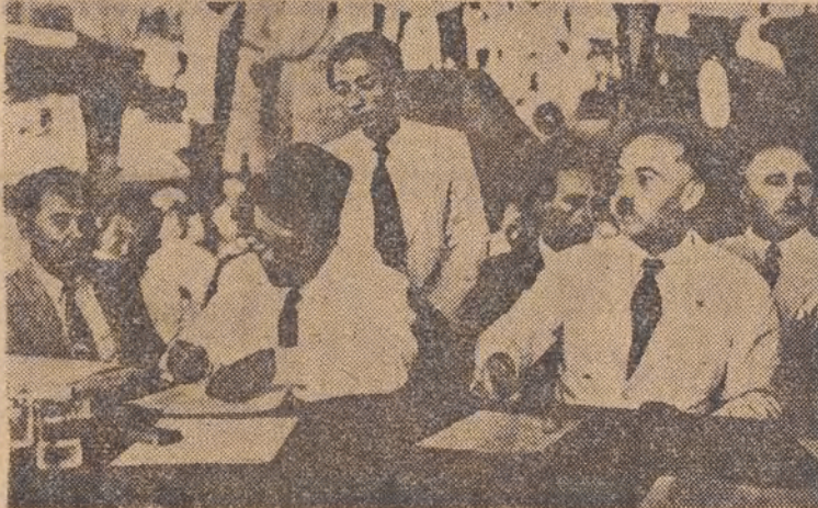
Podpisanie „układu” holendersko-indonezyjskiego na brytyjskim pancerniku „Renville”.

Już wtedy okazało się, że niektóre państwa, reprezentowane w Radzie, nie mają zamiaru przeciwstawić się agresji holenderskiej.