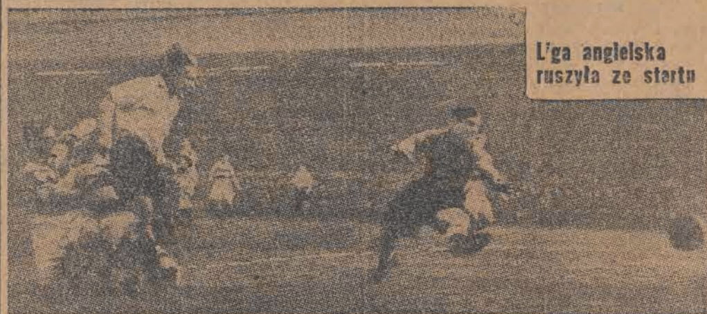
Liga angielska ruszyła ze startu

Bokserki mecz powyższych zespołów zakończył się zwycięstwem Szkoły Polit-Wychowawczej. Charakterystyczne, że żadna z walk nie została zakończona po trzech rundach, a wszystkie przez k. o., ewentualnie przez podanie się.