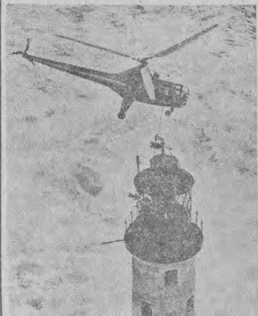
Powietrzna taksówka — helikopter — zapatruje mieszkańców latarni morskiej w żywność i pocztę.