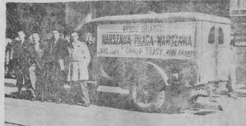
Wóz Komisji Technicznej wyścigu kolarskiego Warszawa — Praga przed redakcją „Głosu Robotniczego”.

Jakżeśmy już donosili, w tych dniach bawiła w Łodzi Komisja Techniczna objeżdżająca trasę wyścigów Warszawa — Praga i Praga — Warszawa organizowanych przez redakcję pism „Głos Ludu” i „Rude Prawo”.