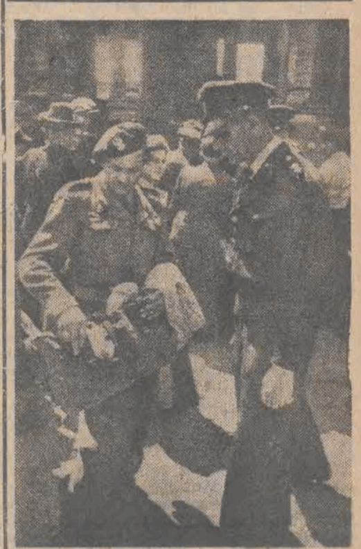
Polscy żołnierze z b. armii Andersa — rewidowani przez żandarma na ulicy w Hamburgu — oto los tułaczy, zgotowany Polakom przez kilkę emigracyjną.