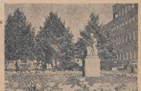
W Gliwicach otwarty został Instytut Radowy do walki z rakim. Monumentalna siedziba Instytutu mieści się przy Wybrzeżu Armii Czerwonej.