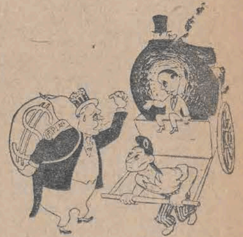
„Plan”, dla którego nie ma już miejsca na francuskim wózku, dźwigającym własnych bankierów. „Action”

dlug „France Soir” zapowiedział, że grecki rząd demokratyczny będzie mógł rozpocząć swe funkcje około połowy października br. Dodał on, że nie wie, czy będzie premierem tego rządu.