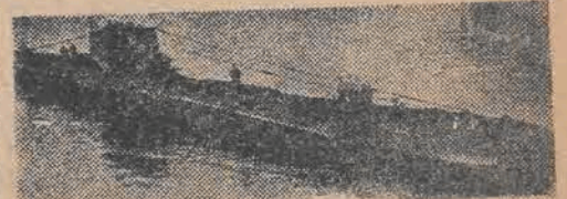
Ostatnie zdjęcie ORP „Orla”, bohaterskiego okrętu podwodnego polskiego, który na skutek omyłki został storpedowany podczas wojny na Atlantyku przez holenderski okręt podwodny, przy zamianie akcji patrolowej

wysokich ex-dygnitarzy hitlerowskich przez ich amerykańskich przyjaciół zawiodła w całej pełni. Stała się ona jeszcze jednym dokumentem, oskarżającym Niemców i ich amerykańskich protektorów.