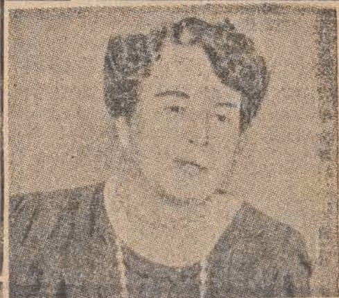
Przemawiając w komisji wolności zgromadzenia Narodów Zjednoczonych, pani Eleanor Roosevelt przyznała, że tzw. „wojna” prasa amerykańska podlega wielu presjom i wpływom. Pani Roosevelt dodała, że prasa taka rzadko odnosi skutek.

Min. Wyszyński podkreślił, że sprawa obecnej sytuacji w Grecji jest daleko ważniejsza niż problem incydentów granicznych, czy nawet sprawa stosunków pomiędzy Grecją a jej sąsiedzimi państwami. Sytuacja wewnętrzna Grecji jest jednym z poważnych zagadnień międzynarodowych mających znaczenie światowe