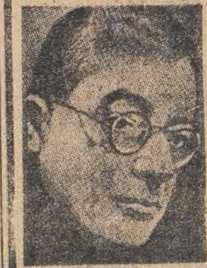
Palmiro Togliatti konferuje z Wallace'm

Saillant weźmie również udział w uroczystościach urządzonych z okazji 30-lecia rewolucji listopadowej. Punktem kulminacyjnym tych uroczystości będzie wielki wiec w Bukareszcie na którym wygłosi przemówienie premier Groza, minister przemysłu i handlu oraz generalny sekretarz partii komunistycznej.