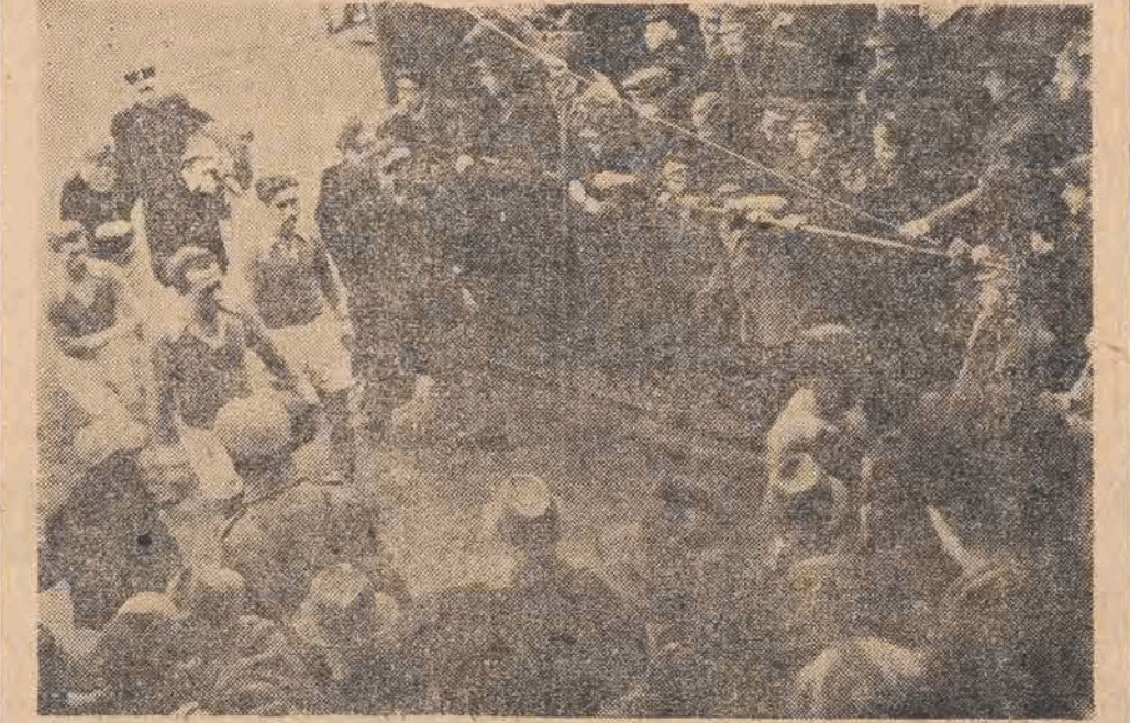
ŁKS w drodze do szatni. W środku Baran — zdobywca dwóch bramek.