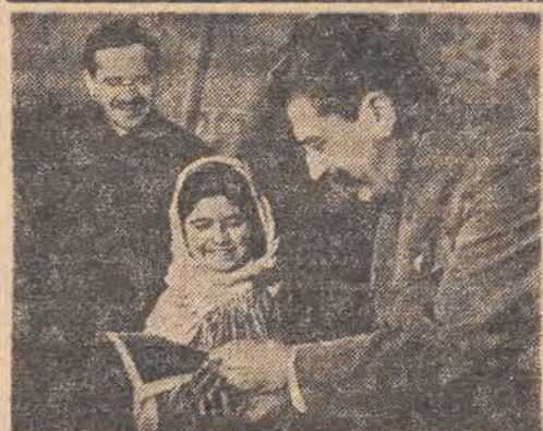
GENERALISSIMUS JÓZEF STALIN wielki budowniczy Związku Radzieckiego, jest szczerym przyjacielem dzieci i młodzieży