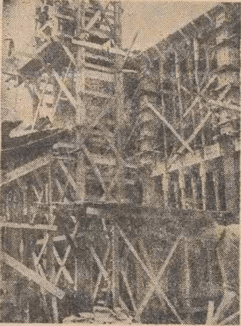
„Elektrobudowa” rośnie. W tym roku fabryka powiększy się o 20 tysięcy metrów sześć.

„Elektrobudowa” wzywa do współzawodnictwa