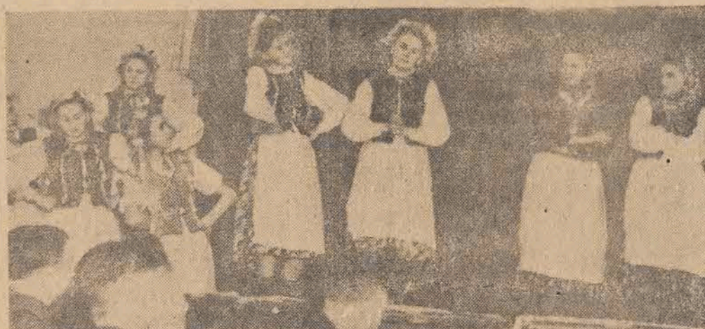
Po części oficjalnej — występy artystyczne. — Oto fragment „Franusiovej doli” w wykonaniu zespołu ZWM-ego.