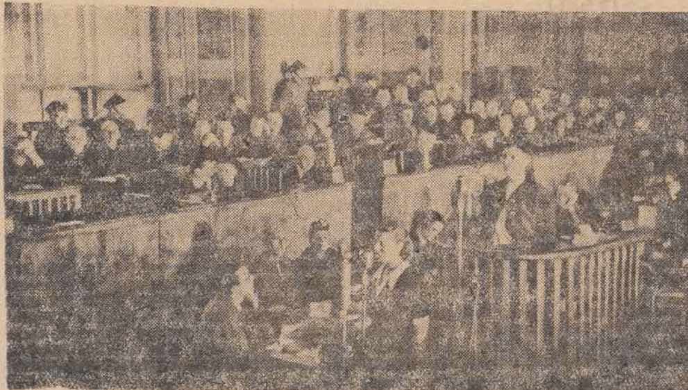
Hildegard Lachert zeznaje

Wstrząsające szczegóły katuszy i tortur w zeznaniach ocalałych ofiar (Od specjalnego wysłannika „Głosu Robotniczego“)