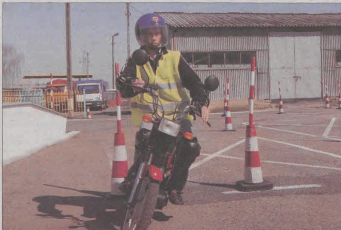
Większość uczestników na co dzień jeździ motocyklami, jednak według organizatorów motorower jest bezpieczniejszy.