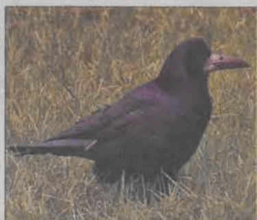
Jeden ze zduńskich gawronów.

Wnioskodawcą był powiat łowicki, który wystąpił o to do gminy po wielu powtarzających się apelach ze strony kierownictwa ośrodka. Drzewa, głównie topole, swoim układem korzennym zaczęły niszczyć konstrukcję ogrodzenia. Dodatkowo konary stanowiły zagrożenie dla przebiegającej obok linii na-