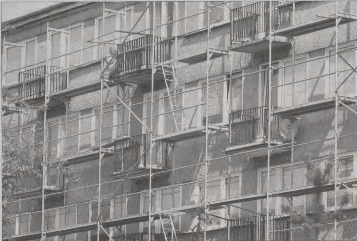
Po nowelizacji ustawy poszczególne bloki mogą stać się wspólnotami mieszkaniowymi.

Oznacza to, że średniej wielkości mieszkanie w Łowiczu (np. 50 m 2 na osiedlu Starzyńskiego) można będzie „zamienić” z lokatorskiego na w pełni własne za około kilkadziesiąt złotych + wszystkie opłaty notarialne związane z nabyciem własności, które obecnie wynoszą około 900 złotych, a mają zostać obniżone. Obecnie cena wykupienia 50-metrowego mieszkania od LSM waha się w Łowiczu od kilku do kilkunastu tysięcy złotych (przy uwzględnieniu usta-