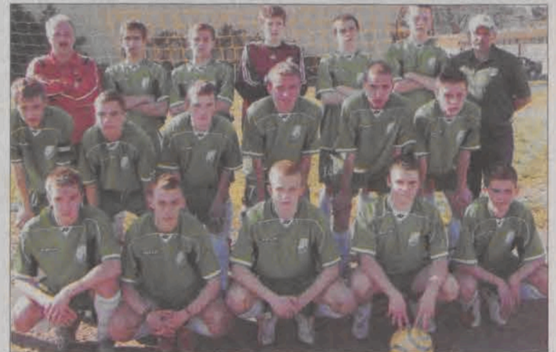
Zespół juniorów młodszych Pelikana - rocznik 1990.