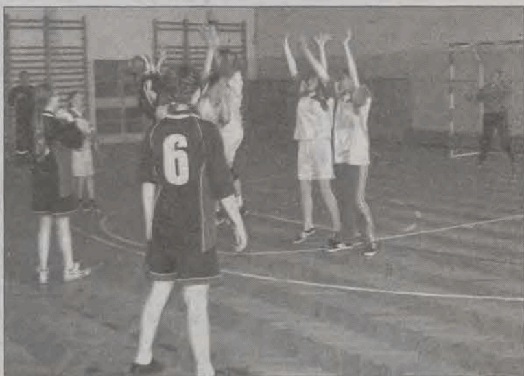
Bardzo zacięty był finał mistrzostw powiatu łowickiego dziewcząt, w którym ekipa SP Nieborów minimalnie pokonała ekipę SP 4 Łowicz.

Wyniki: SP Bielawy - SP Nowe Zduny 3:5, SP Nowe Zduny - SP Popów 6:1, SP Bielawy - SP Popów 7:0.