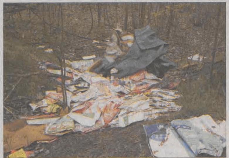
W kilku miejscach lasek za kościołem jest usiany takimi stertami śmieci.

Spotkana tam na spacerze z psem mieszkanka położonej obok ul. Strzeleckiej powiedziała nam, że samochody, które przywoziły śmieci nadjeżdżały od ulicy Małszyce, by nie jechać przez zamieszkałą część ulicy Strzeleckiej i nie być narażonym na zapamiętanie. Widokiem terenu za kościołem jest wstrząsająca. - Najpierw kopali tu okopy żołnierze z byłej jednostki, potem sami mieszkańcy wybierali piach na budowy, a teraz te dziury zasypywane są śmieciami. Przecież tu jest tak ładnie, rosną tu brzozy i inne drzewa, śpiewają ptaki, dłużego nam