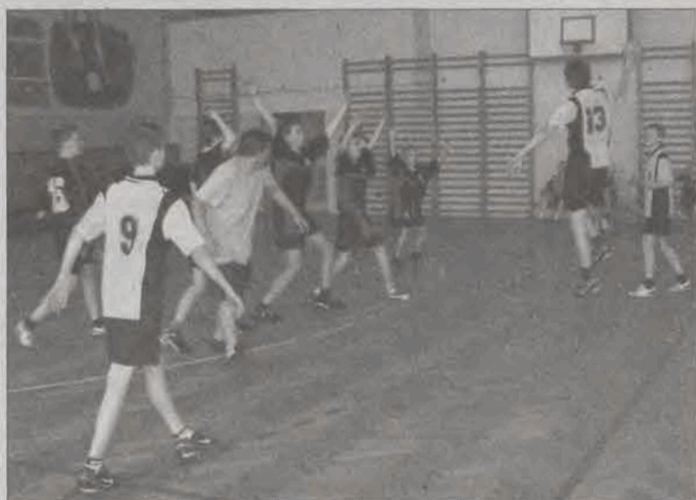
W finale turnieju chłopców „Trójka” ograla „Czwórkę” 10:6.

■ SP 4 Łowicz - SP Mysłaków 15:6 (7:5); br.: Łukasz Wójcik 10, Mateusz Koza 3, Tomasz Adamas i Przemysław Kaczor -