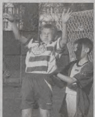
W Tomaszowie Mazowieckim łowiczanie przegrali z Lechią 1:2.