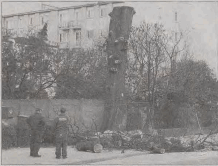
Ścięcie wiązu przy Sikorskiego sprawiło wiele problemów wynikających przede wszystkim z jego ogromnych gabarytów.