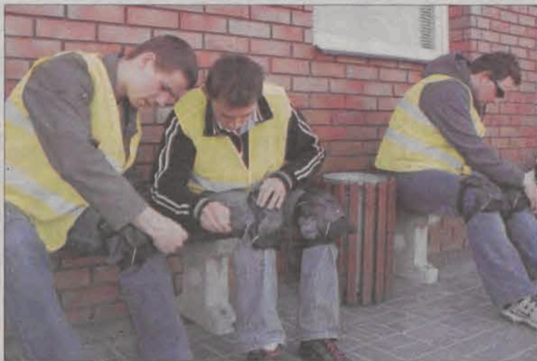
Drużyna z ZSP 1 podczas przygotowań do jazdy motorowerem.

Do etapu wojewódzkiego zakwalifikowało się 6 drużyn: pierwsze miejsce zajęła drużyna LO im. Bolesława Prusa ze Skierniewic, drugie ZSP 1 z Kutna, trzecie ZSP 2 w Łowiczu, czwarte ZSP 1 w Łowiczu, piąte ZSP 1 w Brzezinach i szóste Zespół Szkół Ogólnokształcących ze Skierniewic. Zwycięzcy zdobyli 55,28 punktów. Drużyna z Blichu zgromadziła punktów 40,25, z Podrzecznej 39,83 punktów. (wcz)