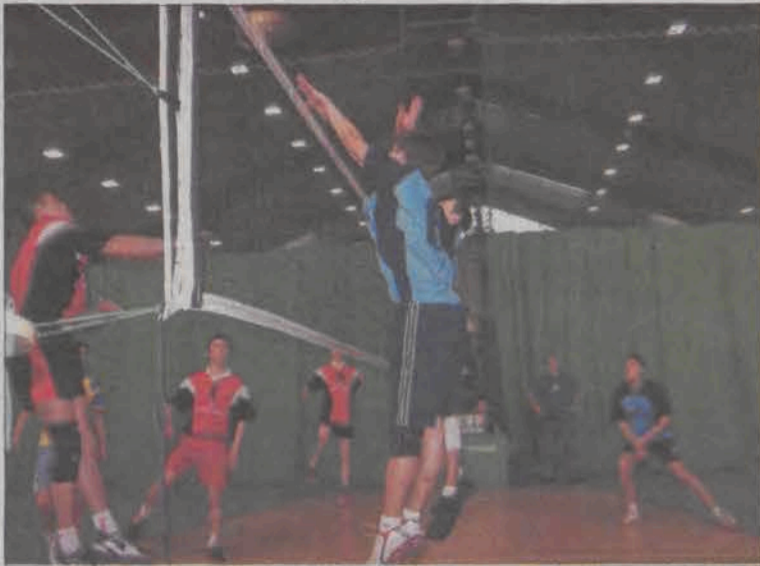
W finale ekipa I LO w dwóch setach ograla rywali ze Zduńskiej Dąbrowy.