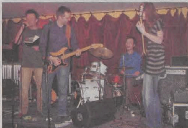
Perkusista śpiewa zamiast wokalisty, klawiszowiec gra na perkusji... tak może być tylko na koncertach „Kobiet”.