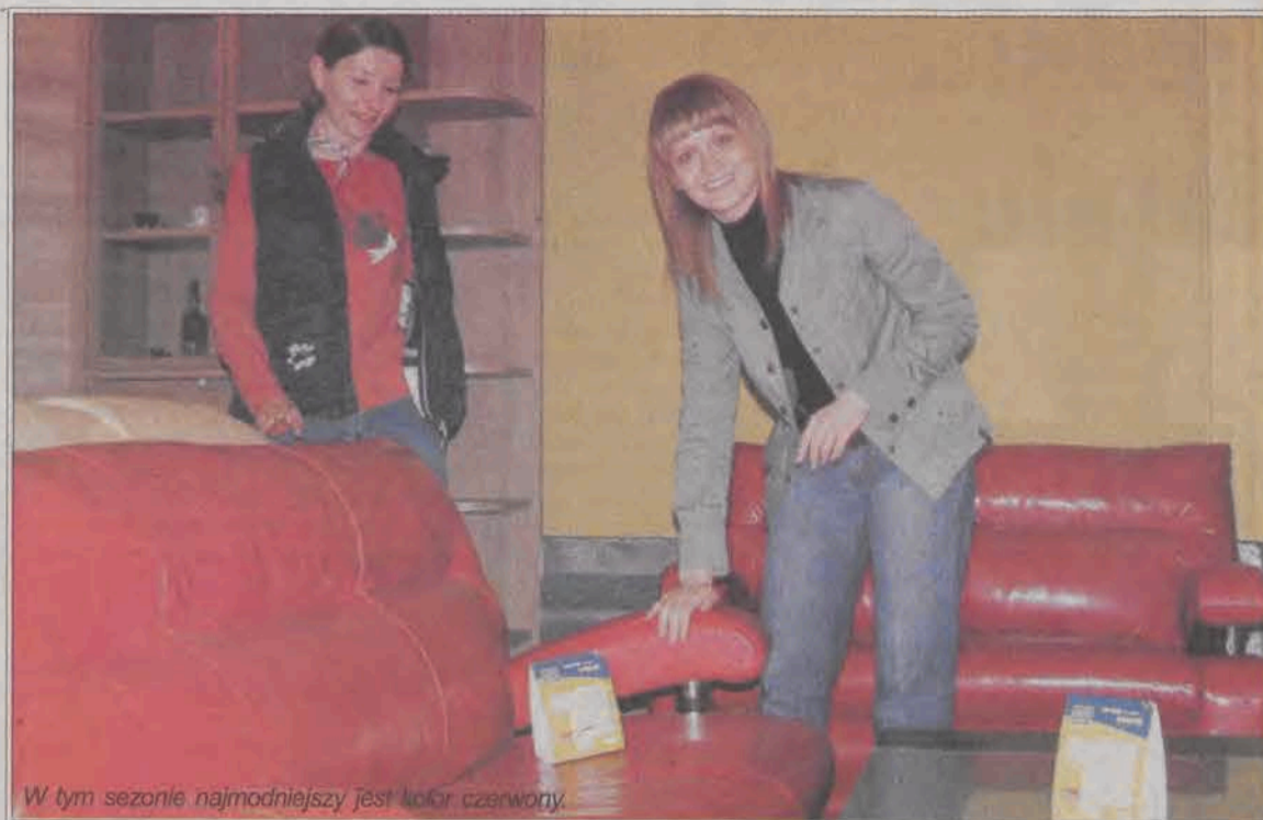
W tym sezonie najmłodniejszy jest kolor czerwony.