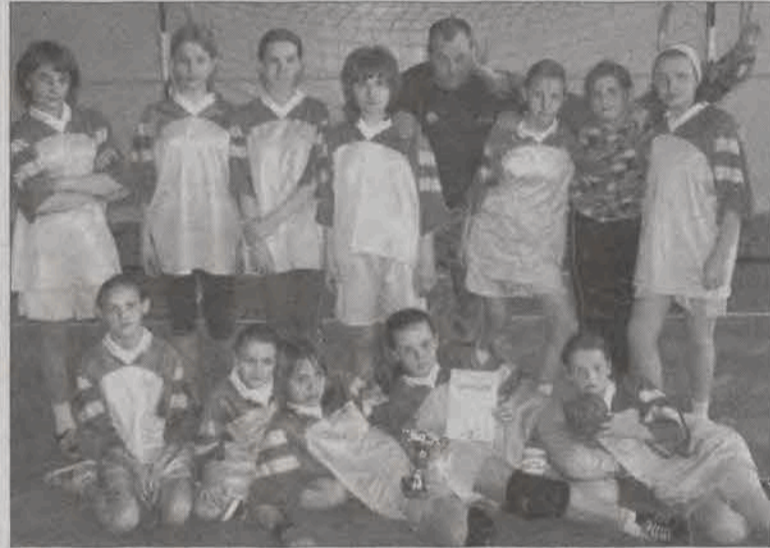
Mistrziami powiatu łowickiego zostały uczennice SP Nieborów.