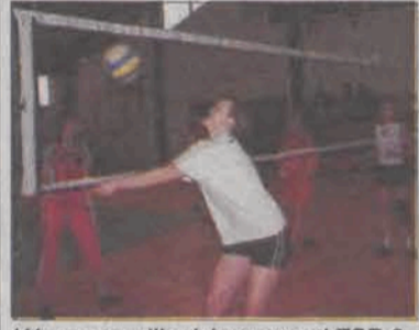
W meczu o III miejsce wygrał ZSP 3.