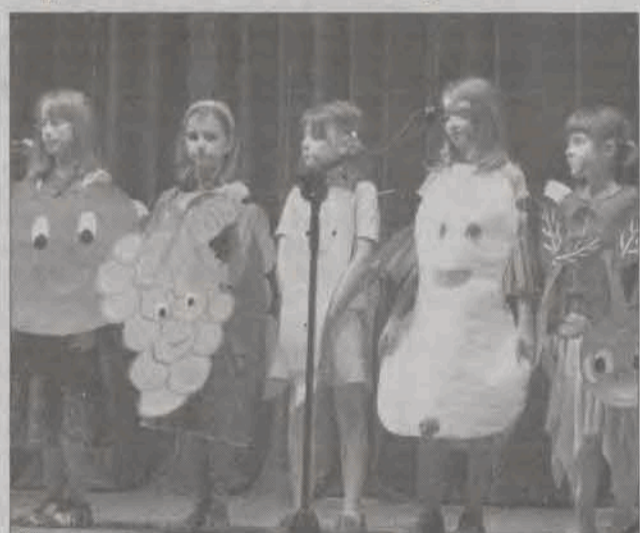
To właśnie „Siódemka” za „Witaminową piosenkę” otrzymała I miejsce.