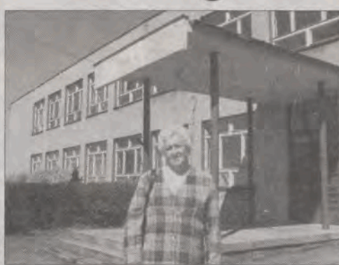
Właścicielka Domu Opieki „Bona” przed budynkiem Szkoły Podstawowej w Borówku.

Nas z kolei zadziwia beztroška, z jaką traktuje się w Urzędzie Wojewódzkim temat ośrodków opieki, a więc i życia osób starszych, niedołężnych, schorowanych. Mimo informacji o otwarciu nowego ośrodka i braku jakiegokolwiek dokumentacji, wcześniejszych problemów z Boną, urzędnicy z WPS UW nie podjęli żadnych działań, by sprawdzić, co dzieje się w Bonie. Dyrektorka powiedziała nam, że nie ma żadnych informacji, co się stało z pensjonariuszami z łódzkiego domu, czy dalej on działa w wcześniejszym miejscu, ani jak wygląda adaptacja szkoły w Borówku. Przyznała, że doszło tu do zaniedbania, starała się jed-