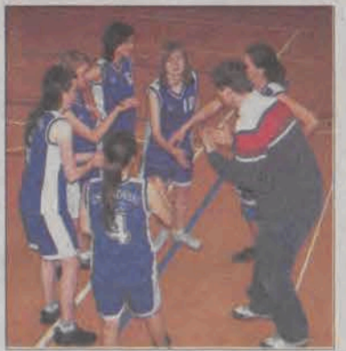
Tytuł wywalczyła ekipa I LO Łowicz.