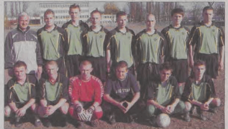
Zespół juniorów starszych Pelikana - rocznik 1988-89.