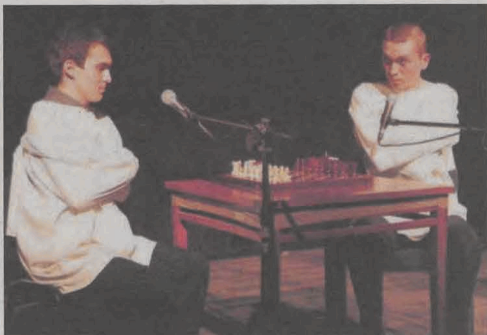
Kabaret Czesuaf z Poznania po raz pierwszy wystąpi w Łowiczu.