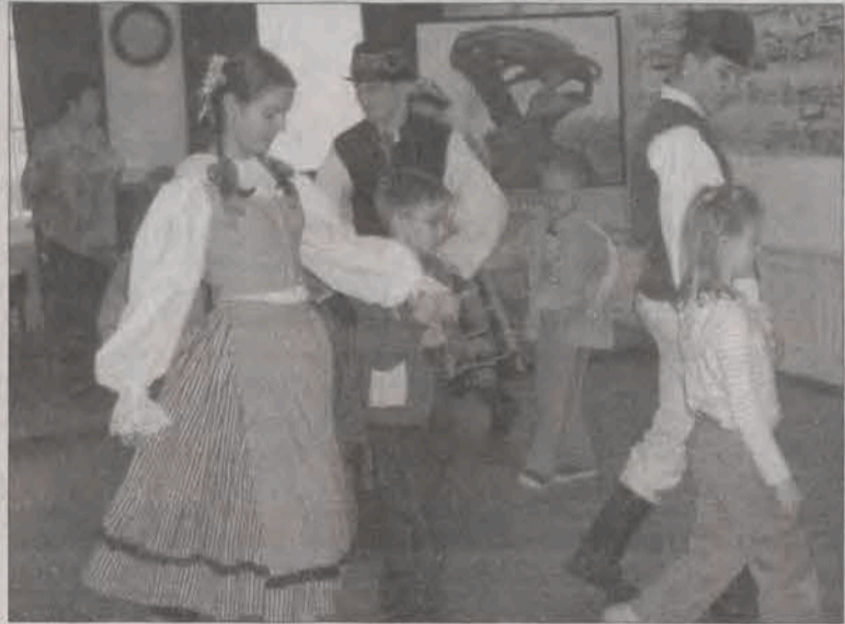
Tancerze w parach z dziećmi z widowni tańczyli polskie tańce narodowe.

Mieszkańcy skarżyli się na to, że mło- dzież pije alkohol i zachowuje się wulgarnie, przesiadując na ławkach na Nowym Ry- nku. - Mamy nadzieję, że teraz kiedy ruszą ogródki będzie lepiej - mówił Bończak. - Ich właściciele są bowiem zobowiązani do utrzy- mania porządku. A będzie in na tym zale- żeć, ponieważ taki jest warunek uzyskanej licencji.