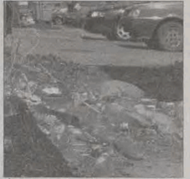
Śmieci w centrum Łowicza przy ul. Kurkowej, których nie ma komu sprzątać. (tb)

W sprawie tego bałaganu zadzwoniła do nas jedna z mieszkank os. Noakowskiego - Dziewięć, że nikt tego nie widzi; ani służby miejskie, ani Zakład Energetyczny; a tym bardziej właściciel posesji; bo ja bym się po prostu wstydziła, gdyby przy mojej posesji leżały takie śmieci - stwierdziła.