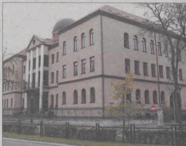
Mocną stroną łowickiej uczelni są warunki studiowania, słabszą - siła naukowa i prestiż.

W tegorocznym rankingu najlepszych uczelni akademickich nie ma rewolucyjnych zmian. Uwzględniono w nim 89 uczelni, choć maksymalna liczba punktów za poszczególne cechy była nieco inna niż w rankingu uczelni niepaństwowych. I miejsce w tym gronie zajmuje po raz kolejny Uniwersytet Warszawski, II - Uniwersytet Jagielloński, III - Szkoła Główna Handlowa, IV - Politechnika Warszawska, V - Uniwersytet im. Adama Mi-