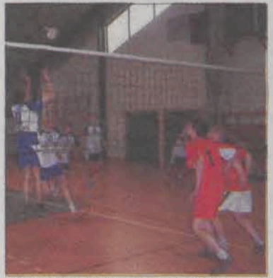
W „małym finale” siatkarze ZSP 4 okazali się lepsi od rywali z ZSP 2 Łowicz, ale dopiero w trzech setach.