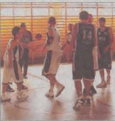
II liga wciąż nie dla Księżaka...

Szkoda tego meczu, bowiem Politechnika zagrała najsłabszy mecz w turnieju i przy