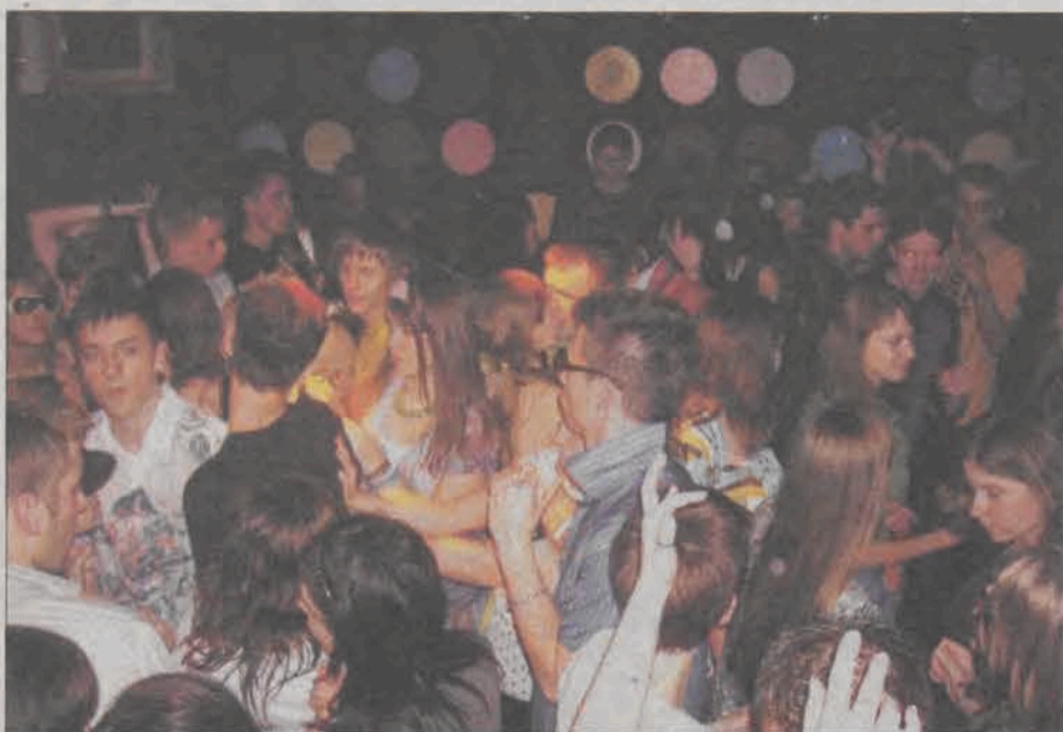
Jak widać, lata siedemdziesiąte wśród młodzieży są ciągle bardzo popularne.