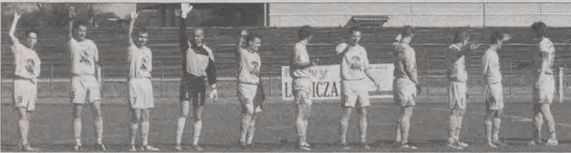
Pilkarze Pelikana II wciąż mają cztery punkty przewagi nad Unią II Skiemiewice i już dziesięć nad Widokiem.

Piłka nożna - 17. kolejka ligi okręgowej seniorów