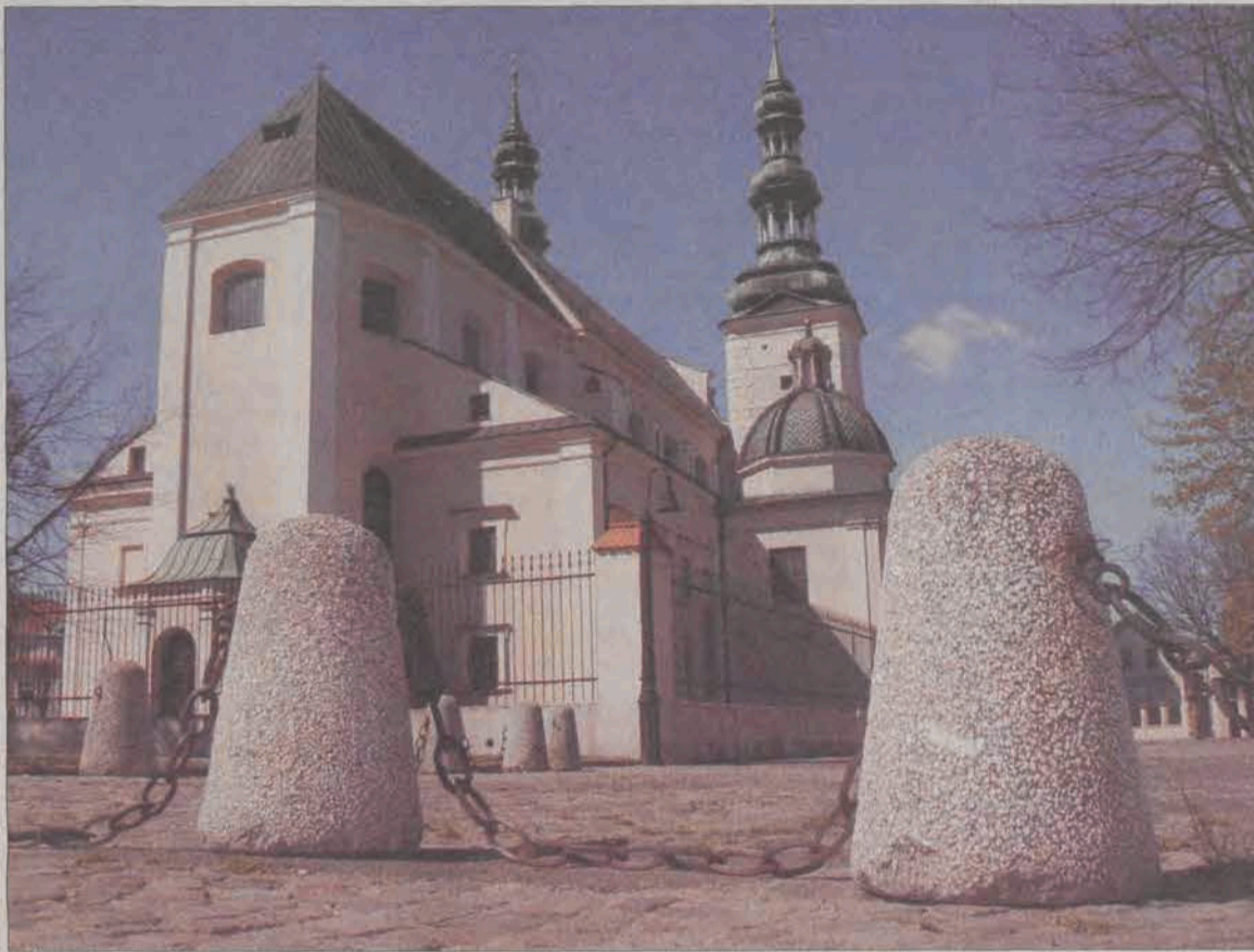
Betonowe słupki spięte łańcuchami znikną w maju i będziemy mogli przejechać z ul. Mostowej Starym Rynkiem do ul. Podrzecznej.