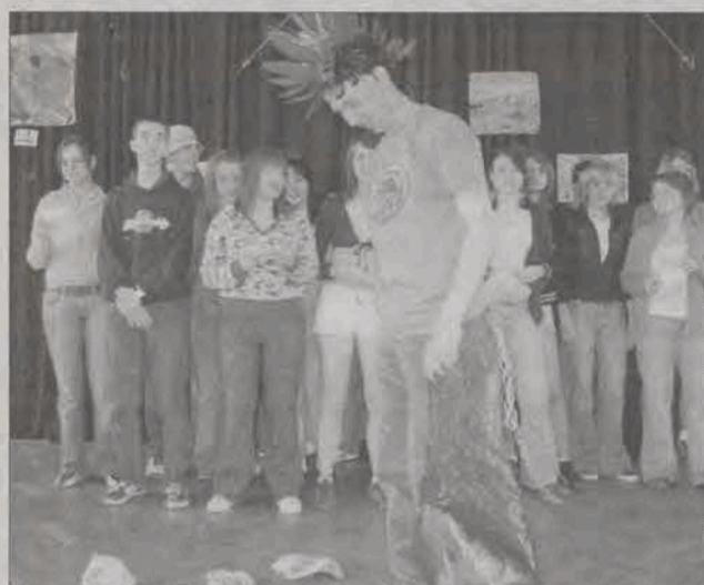
Nawet punk rockowiec przekonał się, że należy sprzątać śmieci.

profilowanego, a trzecie - II LOa. Najbardziej zaangażowani uczniowie ze wszystkich klas drugich biorących udział w turnieju zostali nagrodzeni książkami o tematyce przy-