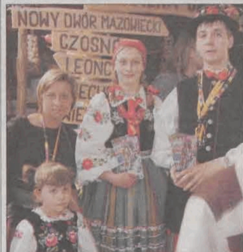
Podczas targów chętnie fotografowano się z parami łowickimi.