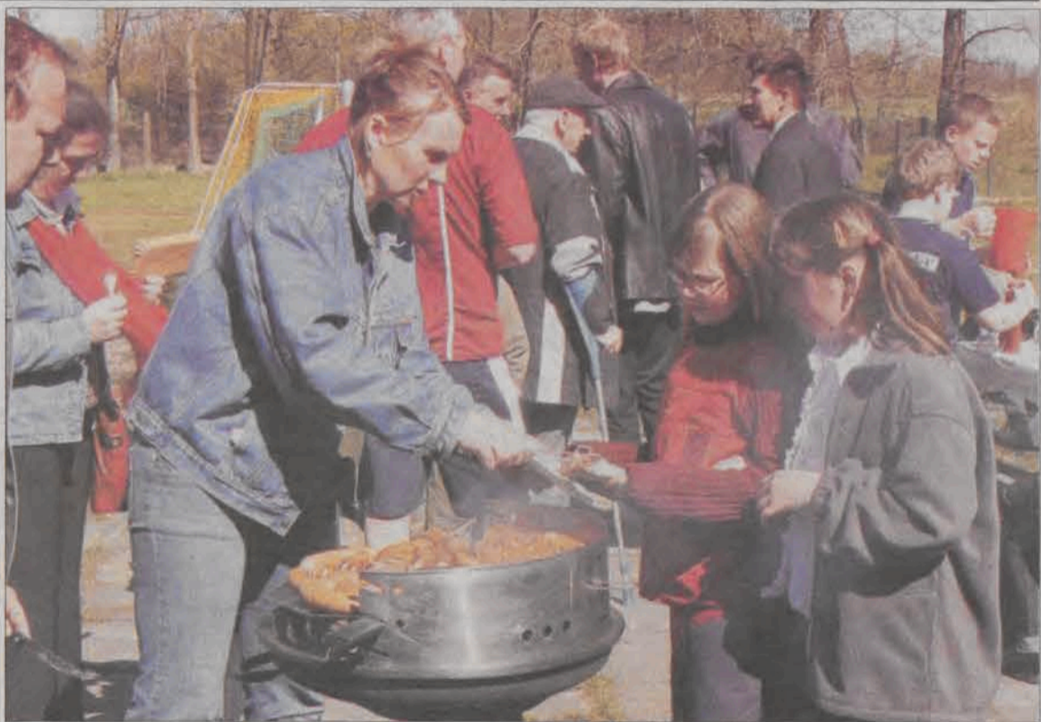
Dla tych osób, które nie przepadają za zdrową żywnością był grill i gorące kielbaski, chętnych też nie brakowało.

Zawodom towarzyszyło spore zainteresowanie miejscowej publiczności, głównie ze względu na obecność znanego aktora i zapalonego koniarza Marka Siudyma. (tb)