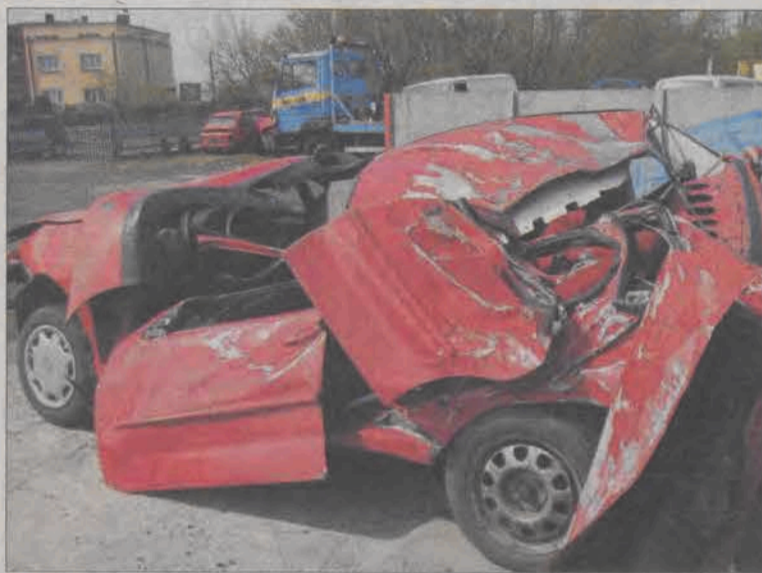
Po wypadku trudno poznać, że był to Volkswagen Polo.