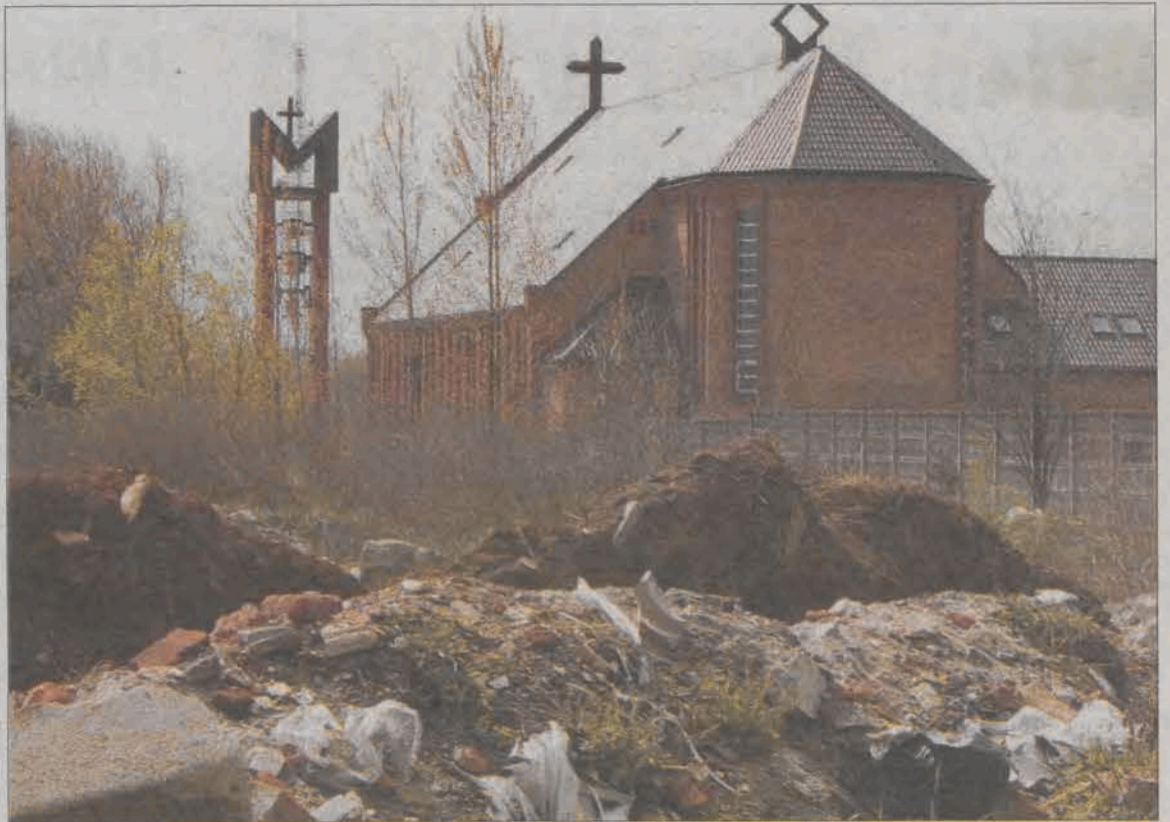
Śmieci za kościołem na Korabce to poważny problem, jest ich tak dużo, że sprzątnięcie ich będzie kosztować nawet 20 tys. zł.