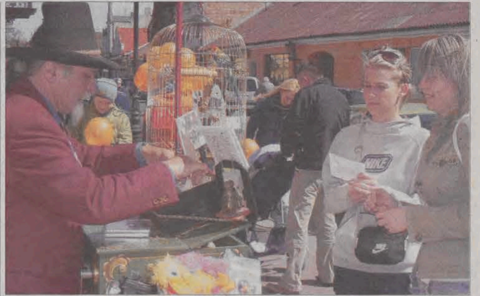
U katarzyniarza łowiczanie mogli kupić wróżbę i los na loterii, ale przede wszystkim posłuchać zaczarowanych melodii.