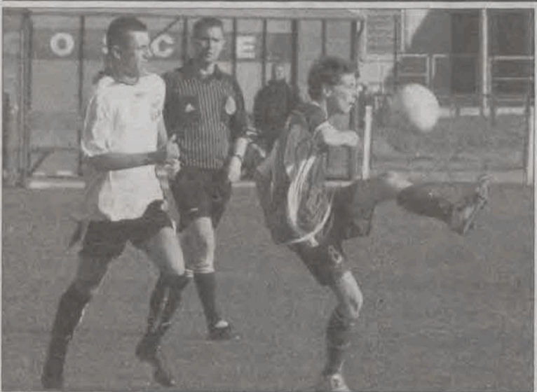
Pelikana-92 nie dał rady rywalom z MKP.

Piłka nożna - 14. kolejka wojewódzkiej ligi „Michałowicza”