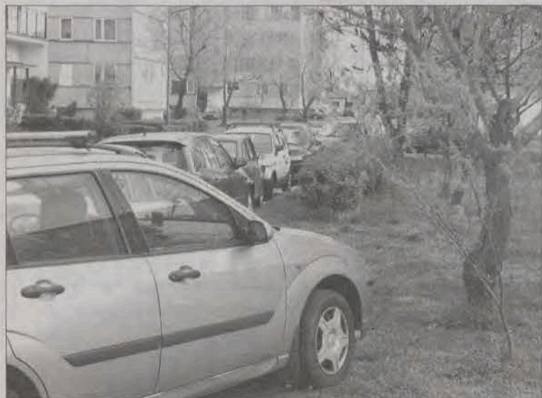
Niektóre samochody i tak parkują na zielonym placu przed blokiem nr 32 na Bratkowicach. Może jednak warto wygospodarować fragment na parking?

do Łowicza, okazało się, że z samochodu zginęło wiele rzeczy, a przyczepa jest pusta. Zgłoszona została kradzież lewarka, apteczki samochodowej, kompletu kluczy, kluczyków do auta oraz towaru z przyczepy - elementów metalowych. Policja podejrzewa, że to sam kierowca - ten, który wysłał SMS-a - okradł samochód, którym jechał. (mak)