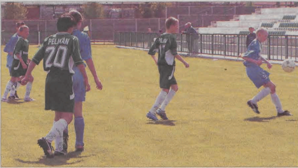
W meczu na szczycie ligi okręgowej Górskiego zespół Pelikana minimalnie słabszy od skierniewickiej Unii.