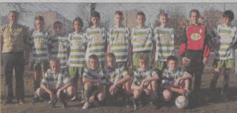
Zespół Pelikana z kategorii Kuchara - rocznik 1993.