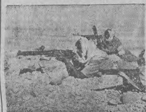
Na pograniczu Transjordanii.

LONDYN (PAP). — Specjalny korespondent Reutera, akredytowany przy sztabie generalnym armii arabskiej w Damaszku, podaje, że do Transjordanii przybyła zmotoryzowana brygada z Iraku. Brygada ta kończy przygotowania do podjęcia marszu na Palestynę. Oficerowie sztabu generalnego armii arabskiej podają, że w najbliższym czasie rozpocznie się inwazja na Palestynę. Termin inwazji został ustalony na ostatniej konferencji w Amman.