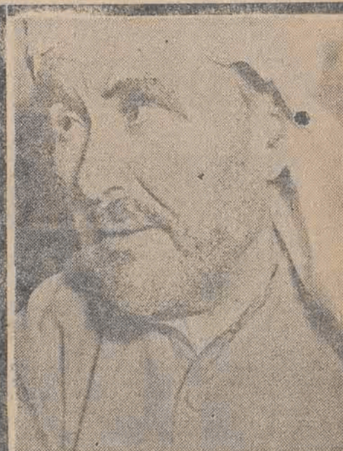
ABD-EL-KRIM — przywódca marokańskiego ruchu niepodległościowego — zamierza udać się do Stanów Zjednoczonych by wziąć udział w sesji ONZ.

Gaulle'a. „Humanite“ przypominając, że jeszcze w połowie maja w cyklu artykułów wskazywała na istnienie tajnej organizacji, dążącej do obalenia ustroju republikańskiego i będącej przedłużeniem przedwojennego spisku kagulardów, w następujący sposób pisze o Loustaneau Lacau, jednym z przywódców spisku: „Loustaneau Lacau, czynny kagulard.