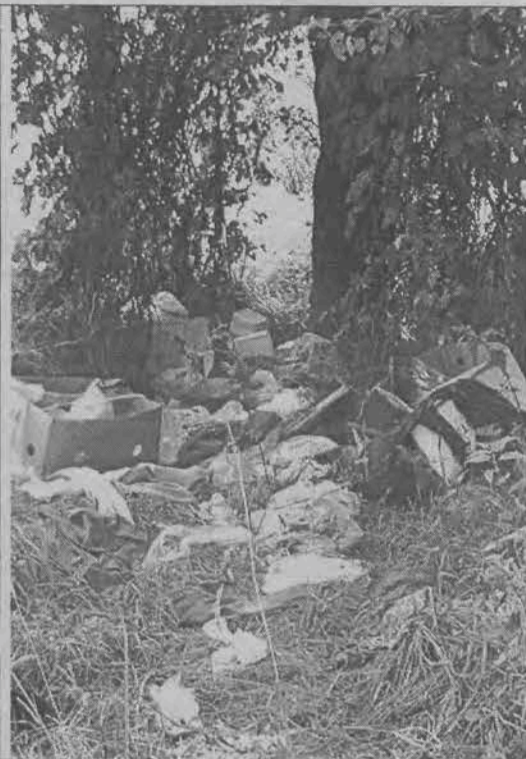
Takie widoki nie umilają wypoczynku głowieńskim letnikom.