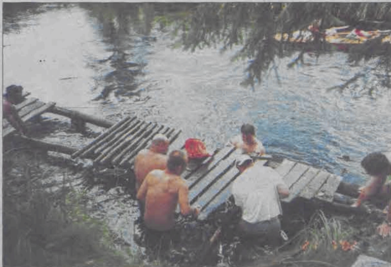
Chłopcy odbudowują pomost na rzece Czarna Hańcza.

Najmłodszym uczestnikiem kajakowej wyprawy na Pojezierze Augustowskie był 11-letni chłopiec, z którym pojechał 36-letni tata - najstarszy spośród kajakarzy, byli też studenci i młode małżeństwa. Trasa spływu wiodła z Augustowa przez jez. Necko, rzeki Rozpludę, Bliznę, jez. i rzekę Blizno, jez. Wigry, rzekę Czarną Hańczę, jez. Mikaszewskie, Krzywe, Płaskie, Orle, Paniewo, Kanał Augustowski, jez. Studzienne, Białe - którym dopłynęli z powrotem do Augu-