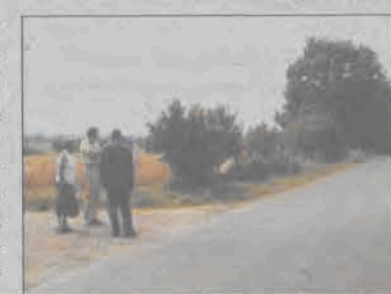
Oznakowanie skrzyżowania ma na celu zapobieżenie wypadkom.