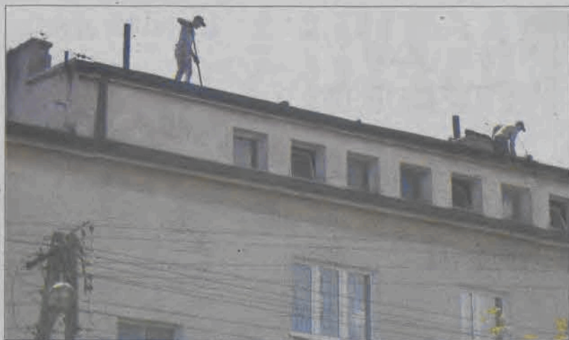
Letnie smarowanie dachów.