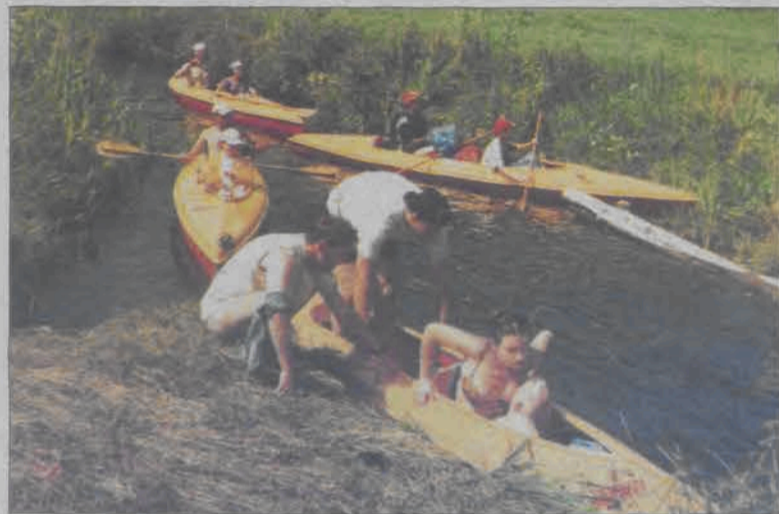
Krótki odpoczynek i przenoszenie kajaków obok metrowej tamy na rzece Bliznie.