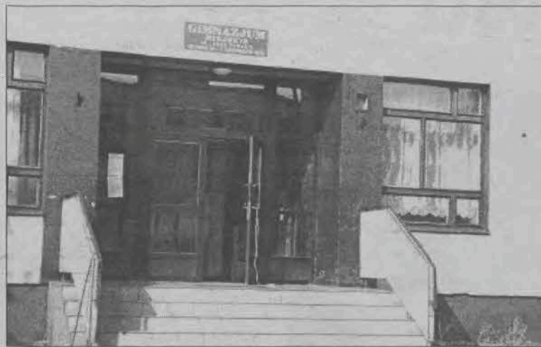
Lamperie zostaną odnowione przed rozpoczęciem roku szkolnego.

WFOŚ pożyczki miastu 350,2 tys. zł na termomodernizację. Całość inwestycji, której realizacja rozłożona będzie w czasie przynajmniej na 5 lat, pochłonie 833,72 tys. zł i obejmie modernizację kotłowni węglowej, naprawę i ocieplenie stropodachu, docieplenie ścian, wymianę okien oraz budowę kanału ciepłowniczego pod ulicą. Te ostatnie prace mają na celu zapewnienie ogrzewania