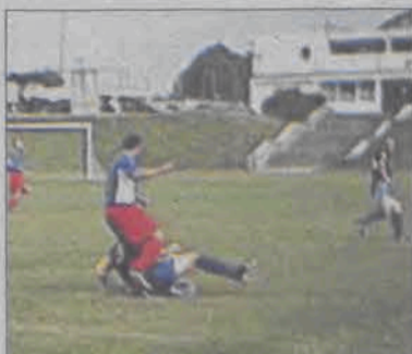
Fragment meczu MKP Zgierz - Stal III Głowno. Zawodnicy Stali w niebieskich koszulkach.