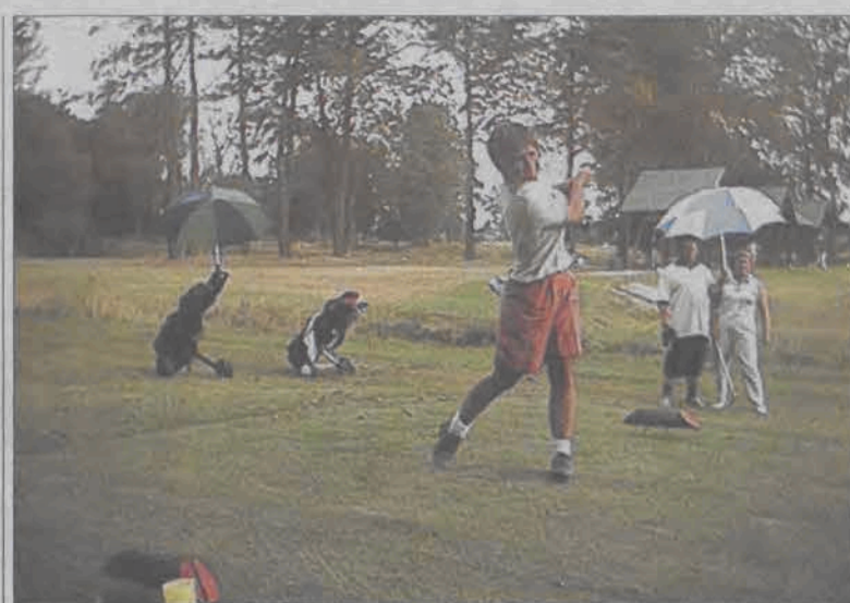
Nie najlepsza pogoda nie odstraszyła zawodników od uczestniczenia w Turnieju Trzech Kijów.