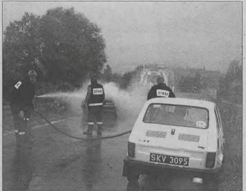
Strażacy z jednostki OSP w Bielawach jako pierwsi pojawili się na miejscu i opanowali sytuację.

Pierwsza przybyła na miejsce jednostka Ochotniczej Straży Pożarnej z Bielaw.