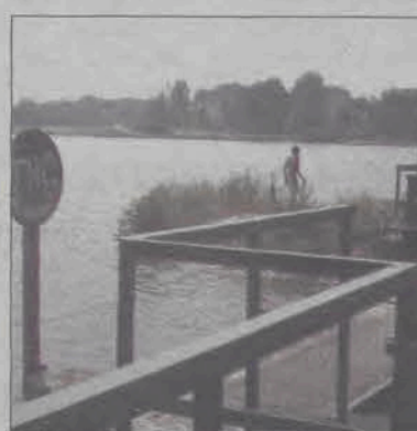
Kąpią się mimo zakazu.

3 metry głębokości, mętna woda, nie zbite dno, metalowe kraty zabezpieczające funkcjonującą po drugiej stronie betonowej ściany elektrownię wodną przed nieczystościami niesionymi przez wodę - to otchłań, w którą dzień w dzień rzucają się kilkunastoletni amatorzy mocnych wrażeń. Na widok skaczących do wody tuż przy tamie na Zalewie Mroźyczka w Głownie, nieopodal siedziby Urzędu Miejskiego chłopaków aż ciępnie skóra. Nie zważając na zakaz skoków do wody, który dzięki miejscowym wandalom, a być może dzięki samym „skoczkom” wygląda już teraz tylko jak ciemna plama, bez zastanowienia zdejmują ubranie na cypelku w pobliżu tamy i skaczą do wody. Jak dotąd mają ogromne szczęście, każdy z nich wypływa, ale tragedia wisi w powietrzu. Po pierwsze nasuwa się pytanie, gdzie są rodzice tych młodych ludzi, bo jeżeli nawet pracują, to czy zupełnie nie interesuje ich jak dzieci spędzają wolny czas? Po drugie: gdzie są osoby odpowiedzialne