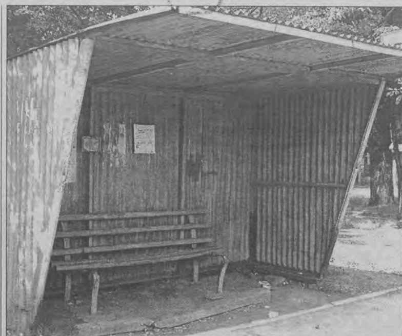
Na tej ławce przystanku MZK, przy Dworcu PKP trudno byłoby usiąść.

W poniedziałek, 5 lipca, do Komisariatu Policji w Głownie wpłynęło zgłoszenie o kradzieży saszetki obywatela Szwajcarii, do której doszło w niedzielę, 4 lipca, podczas Regionalnych Wyborów Małej Miss organizowanych przez Miejski Ośrodek Kultury nad zalewem Mroźyczka. Szwajcar, jeden z opiekunów na młodzieżowym polsko - szwajcarskim obozie odbywającym się w Zespole Szkół Specjalnych w Głownie, o którym szerzej napiszemy za tydzień, na chwilę zostawił bez opieki przy stoliku saszetkę z dokumentami. To wystarczyło złodziejowi - saszetka z za-