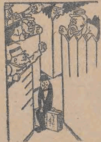
Unia celna państw zachodnich według projektu Marshalla.

razie Francję, która będzie musiała płacić wysoką cenę za węgiel niemiecki. Uważa się, że Amerykanie nie podniosą zarzutów przeciwko projektowi angielskiemu. Podwyżka cen węgla niemieckiego nastąpi już w najbliższym czasie.