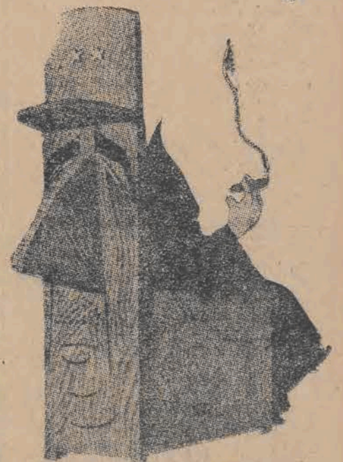
Co kryje się za de Gaulle'm? Najbardziej reakcyjna — faszystowska — „Action”