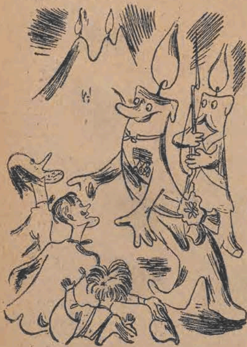
108. Wódz Gromnica, wraz ze świtą, Uroczyście ich powitał, I poprosił, by zechcieli Miasto zwiedzić przy niedzieli.