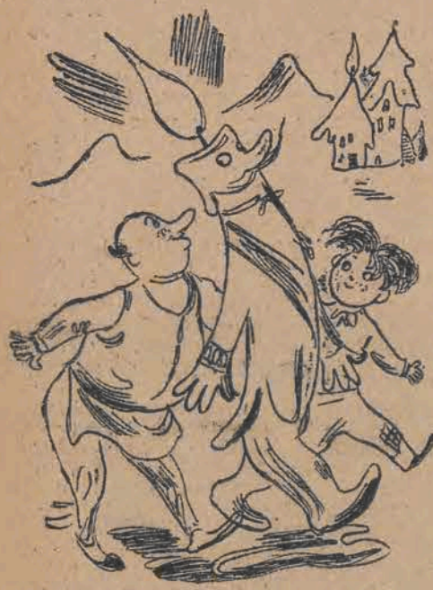
109. Za Gromnicą szła ulica Cała pokapana świecą, A za nimi tłum miejscowy. Same zapalone głowy.