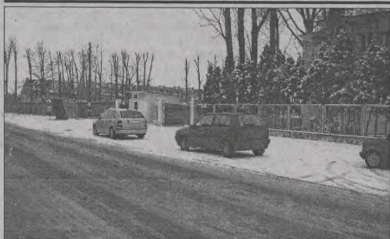
Tym razem zima zaskoczyła wiosną. Tak wyglądała rano w poniedziałek, 7 kwietnia, większość ulic. Mało gdzie drogi były czarne, w większości pokryte śniegiem, który przemieniał się powoli w błoto. Duży problem mieli kierowcy, którzy zbyt wcześnie zmienili opony zimowe na letnie. W tym wypadku okazało się, że nie warto było się spieszyć. (aw)

Uczniowie różnie oceniali sprawdzian. Dla jednych był prosty, innym przysporzył nieco problemów. Na pewno znacznie różnił się od pisanego w lutym próbnego sprawdzianu, na którym dominowały pytania z przyrody. Na prawdziwym egzaminie zadanie dotyczyło w większości tylko dwóch przedmiotów - języka polskiego i matematyki. (eb)