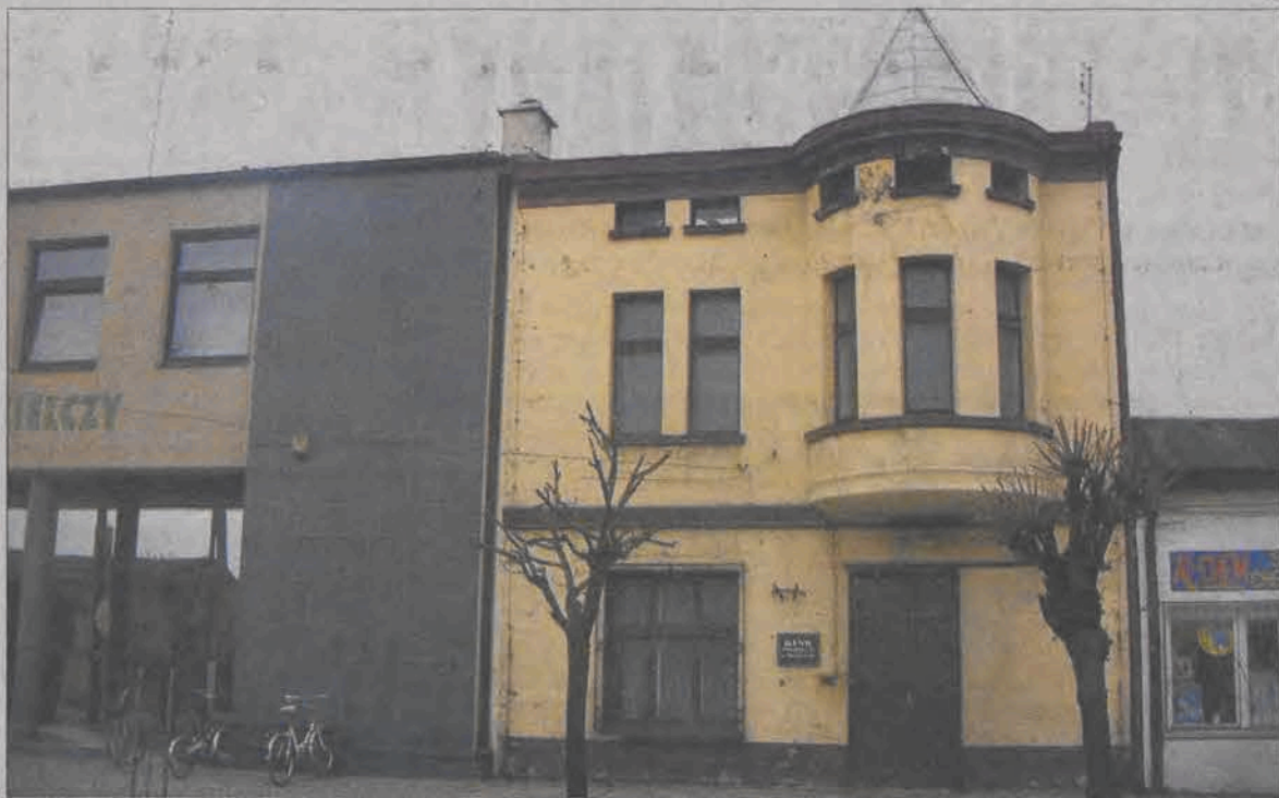
Teraz, kiedy bank ma nowoczesną siedzibę - zaczęła się batalia o stary budynek.