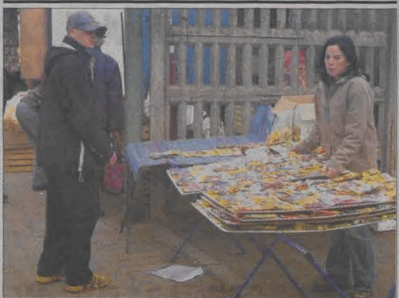
Kilka stoisk na miejskiej targowicy prowadzi sprzedaż nasion.