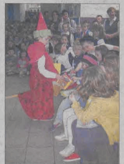
Wszyscy uczniowie mieli ochotę na paluszki rozdawane przez Lajkonika.