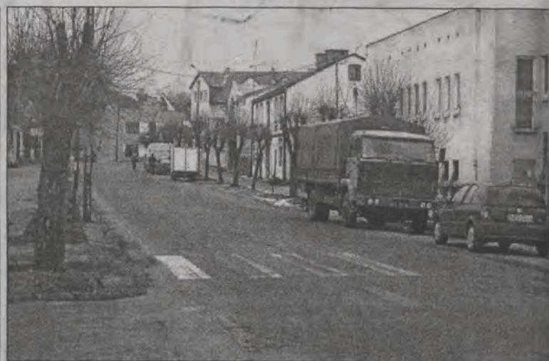
Głowna ulica w mieście aż prosi się o generalny remont.

Radni dopytywali się, czy firma będzie zainteresowana wykupieniem terenów, po których będzie przechodzić linia gazociągu. Gazownicy wyraźnie określili, że tereny rolnicze, na których przeprowadzona zostanie linia gazociągu nie zmienią swojego charakteru, będzie można nadal na nich prowadzić gospodarke, a oni sami są firmą prowadzącą gazyfikację, a nie zajmującą się pośrednictwem nieruchomości. Wyjaśnili także, że gospodarstwa domowe zapłacą jedną stawkę bez względu na sprawę czy są usytuowane bezpośrednio przy linii gazociągu, czy położone są w znacznej linii od niej. (aw)