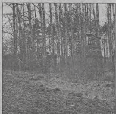
Poletko przy domku myśliwskim Koła Łowieckiego „Orzeł” w Kalinowie zostało już zaorane

Myśliwi zakończyli już prace na śródleśnych łąkach, w pierwszej kolejności na tych położonych najbliżej ostoi zwierzyny płowej. Jest już po bronowaniu i nawożeniu. Łąki zostaną niebawem obsiane mieszanką roślin motylkowych i traw. Początek kwietnia to czas na ogradzanie poletek łowieckich. Wysokość ogrodzenia zależy od gatunku zwierzyny, przed jakim myśliwi chcą uchronić daną uprawę. Na poletkach zakładanych na dotychczasowych nieużytkach przygotowywane są ziemie pod uprawę. Poletka, które były zaorane jesienią, w kwietniu myśliwi kultywują, bronują. Polet-