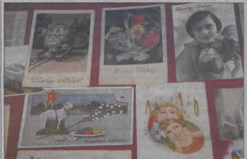
Najstarsza z prezentowanych kart świątecznych pochodzi z 1907 roku.

tomiasz wymagana jest co najmniej dobra ocena pracy. Dodatek motywacyjny obecnie będzie przyznawany na okres nie krótszy niż pół roku, żeby można nim uhonorować wszystkich nauczycieli, dotychczas przyznawany był na rok. Dyrektorowi placówki z chwilą zakończenia kadencji nie będzie już przysługiwało prawo do dodatku motywacyjnego, kształtującego się w wysokości 300 - 600 zł, który otrzymywał pełniąc funkcję dyrektora. Dodatek funkcyjny w przypadku dyrektorów placówek integracyjnych został zwiększony o 10%. (mko)