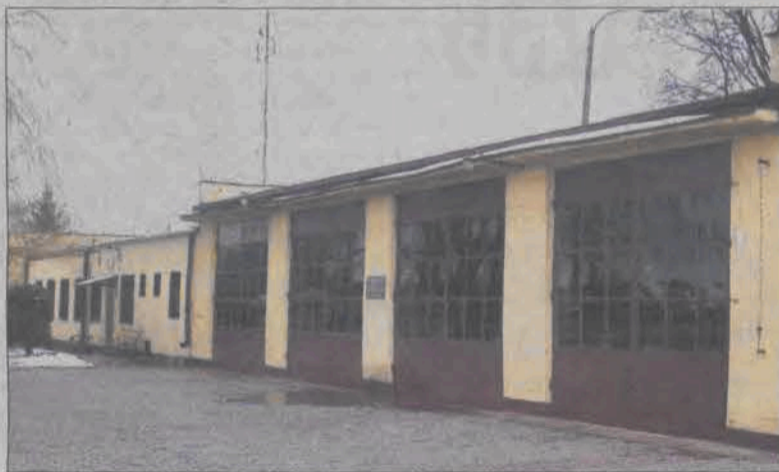
Jak podzielić opłaty za ten budynek, aby było sprawiedliwie?

Sprawą dyskusyjną był sam metraż, za którego ogrzewanie ma płacić miasto. Do tej