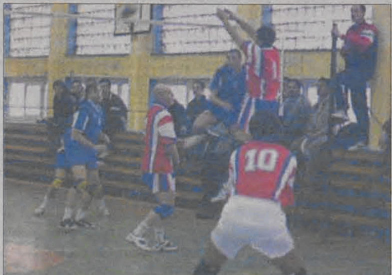
Półfinałowe mecze piłki siatkowej o puchar Burmistrza Główna były emocjonujące i stały na bardzo dobrym poziomie.

Zatem w meczach finałowych spotkają się Rzemiosło i TKKF Bank Spółdzielczy. Decydujące mecze odbędą się w najbliższą sobotę, 12 kwietnia o godzinie 16:00. (ak)