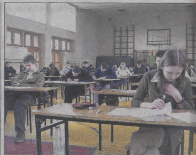
Uczniowie gimnazjów i szkół średnich spotkali się na II Powiatowym Konkursie Matematycznym w „Chelmońskim”.