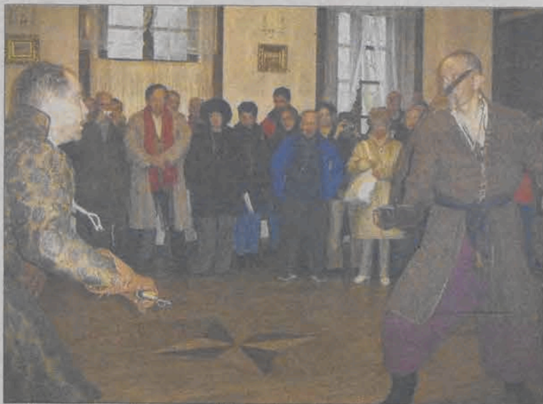
Takiego pokazu jeszcze w Kiernozi nie było - pokaz szermierki historycznej w sali balowej w zabytkowym pałacu.