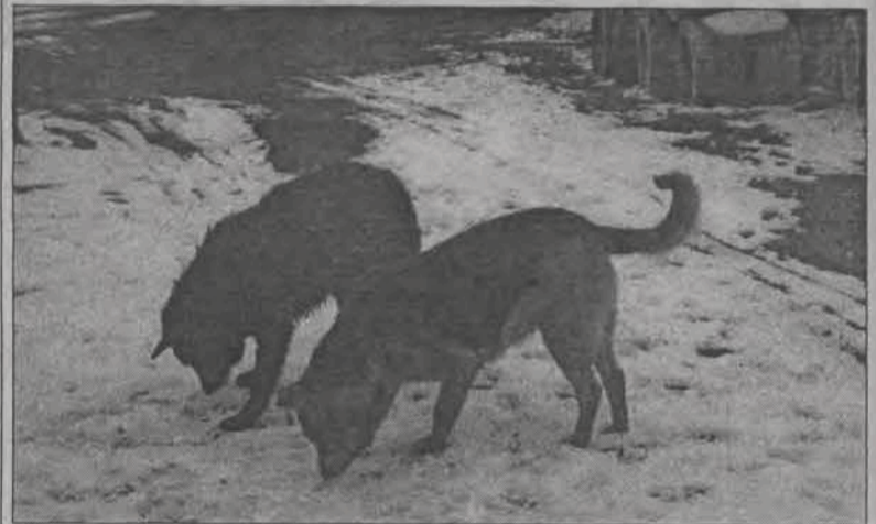
Widoczna na zdjęciu psia para czeka na nowego właściciela

Osoby, które chciałyby przygarnąć zarówno „Sunie” jak i „Murzyna” wszelkich informacji zasięgną pod numerem telefonu 719-21-43. Towarzystwo oferuje pomoc weterynaryjną dla tych zwierząt. (eb)