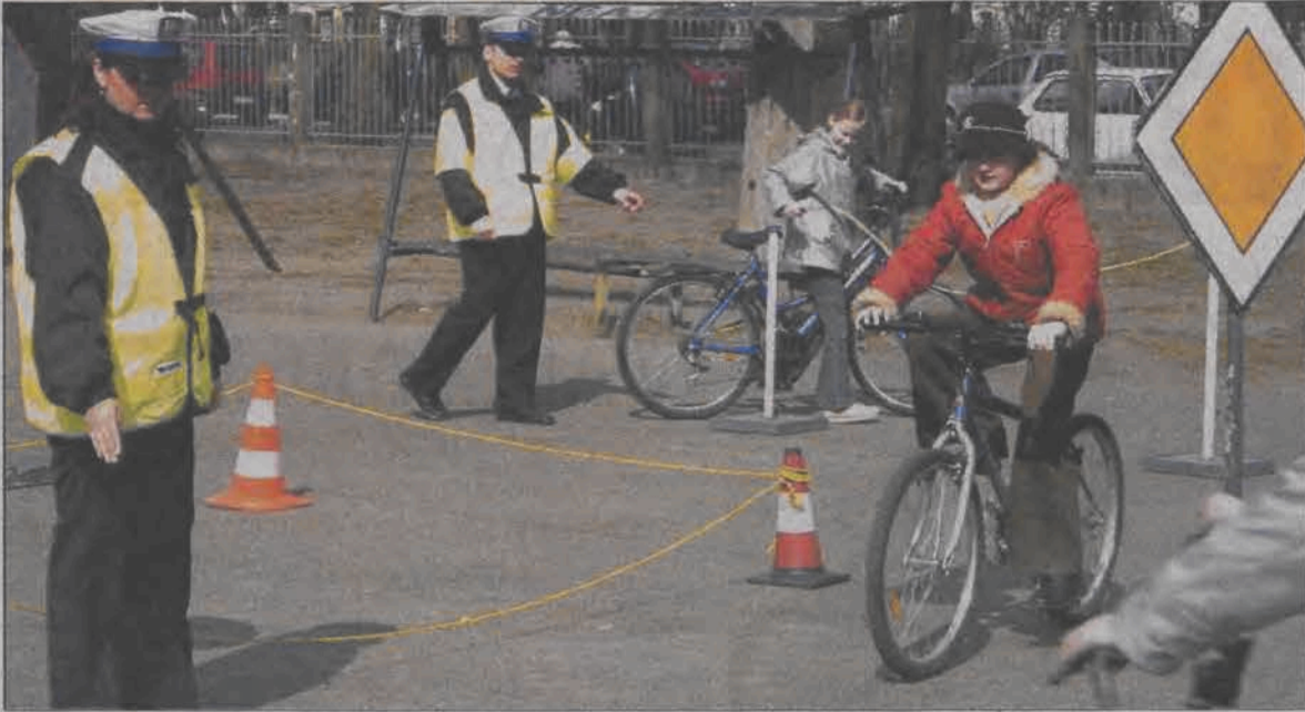
We wtorek 1 kwietnia dzieci z klas IV Szkoły Podstawowej nr 2 w Łowiczu ćwiczyły pod okiem policjantów przed czekającym ich wkrótce egzaminem na kartę rowerową. Na specjalnie wyznaczonych uliczkach, z roztawionymi znakami drogowymi - które urządzono przed budynkiem szkoły, uczniowie poruszali się na rowerach, zatrzymywali się, skręcali i wyprzedzali, ucząc się prawidłowego sygnalizowania manewrów.