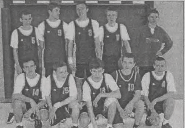
Koszykarze Gimnazjum Miejskiego z Głowna. (ak)