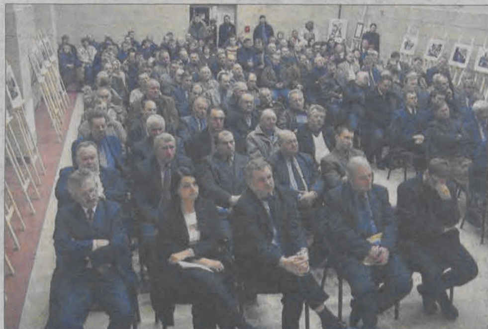
Spotkanie cieszyło się tak dużym powodzeniem, że konieczne okazało się dostawienie krzeseł.

- Czy dopłaty będą tylko do gruntów trwałych, czy np. do łąk też?