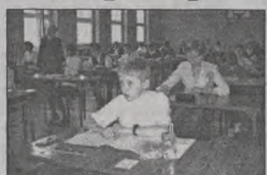
Szóstoklasiści ze Szkoły Podstawowej nr 1 w Głownie tuż po godzinie 9.00 zaczęli wypełniać arkusze egzaminacyjne.

W Szkole Podstawowej nr 1 na sali gimnastycznej i w dwóch salach lekcyjnych sprawdzian pisało 74 uczniów, w „Dwójce”