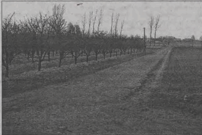
Droga Brodne - Chrusle od strony Brodnego Towarzystwa. Jak widać pierwsze zabudowania są kilkaset metrów dalej.