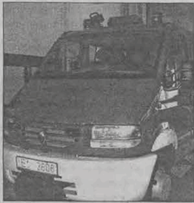
Nowy Renault już stoi w garażu i niedługo będzie gotowy do akcji.

Całkowity koszt samochodu wynosi około 200.000 zł, jednostka PSP pokryła z tego 90.000 zł, przy udziale starostwa