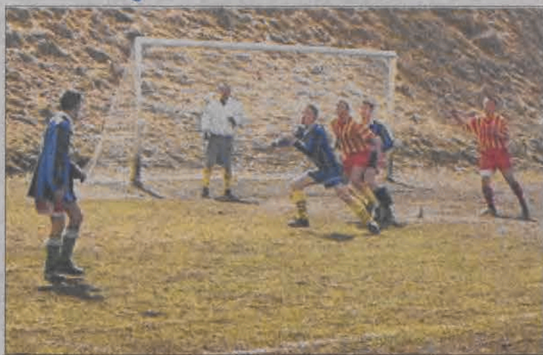
Piłkarze ZSR Bratoszewice (w niebieskich koszulkach) nie dali rady mistrzom powiatu ZSZ z Ozorkowa.