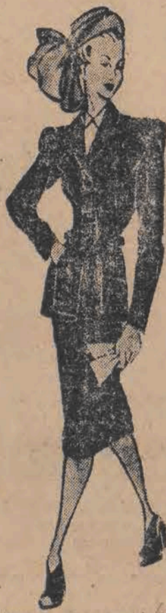
sienną i zimową garderobę i zastanawia się nad tym, jakim przeróbkom należy ją poddać.