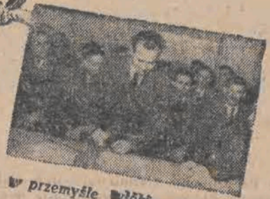
w przemyśle włókienniczym