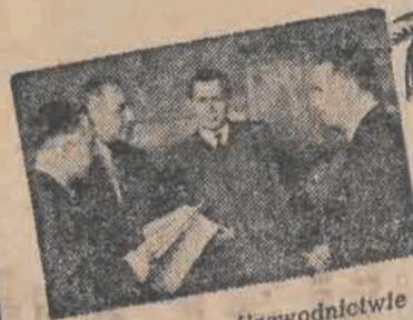
Umowa o współzawodnictwie