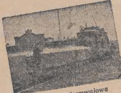
Nowa remiza tramwajowa