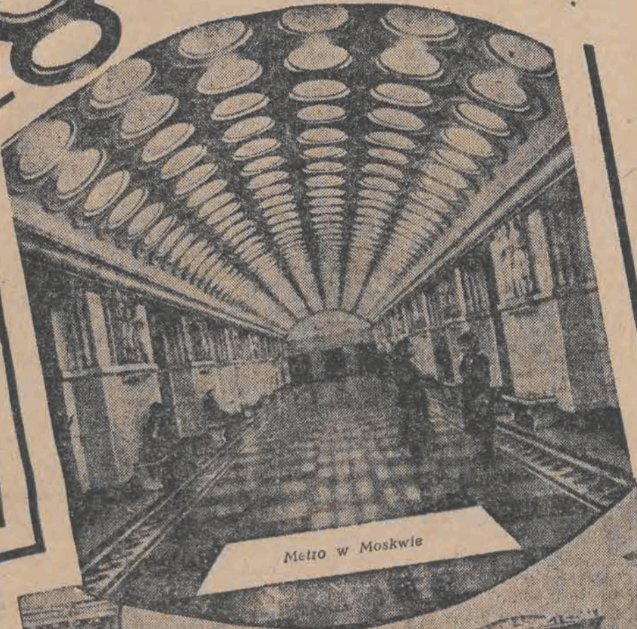
Metro w Moskwie