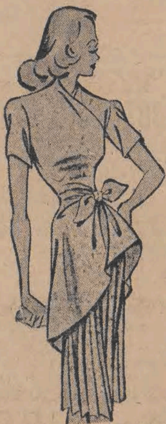
Znajdujemy się w okresie, kiedy każda z nas musi poddać przeglądowi posiadaną, jesienią i zimową garderobę i zastanawia się nad tym, jakim przeróbkom należy ją poddać.