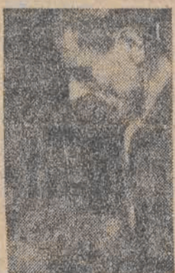
Tow. Edmund Pietrzak przystąpił do wyścigu pracy

W początkach listopada br. zebrał się robotnicy PZPD Nr 1 w Łodzi, towarzysze-członkowie PPR i PPS oraz bezpartyjni, na wielką naradę.