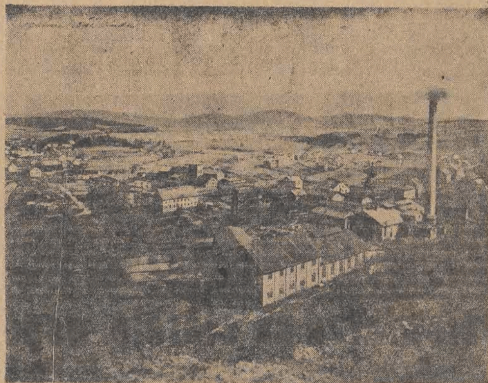
Kopalnia „Nowa Ruda” na Dolnym Śląsku

W tych dniach odbyła się w Wałbrzychu narada, zwołana przez Z.Z.G. i poświęcona sprawom współzawodnictwa pracy na terenie Dolno-Sląskiego Zjednoczenia Przemysłu Węglowego.