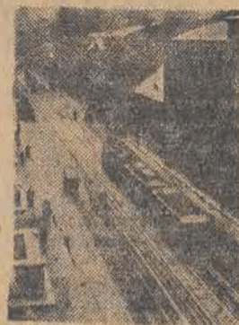
Szron pokrył ulicę i dachy Łodzi.