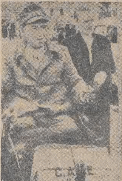
Czułe serca amerykańskie zwalczają „głód” w Niemczech.