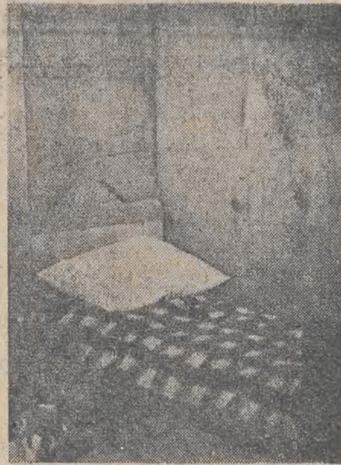
Skromne drewniane łóżko, na którym spiał Lenin w czasie swego pobytu w Poroninie.