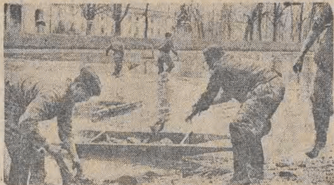
Rybaczy wysiadają godzinami nad wodą, aby schwycić na wędki parę marnych płoć lub „okonków”. Robotnicy w parku łaźniakowskim są praktyczniejsi i nie lubią marnować czasu: spuszcili wodę ze stawów i rękami chwytają tysiące łuszczyk, dużych karpia.