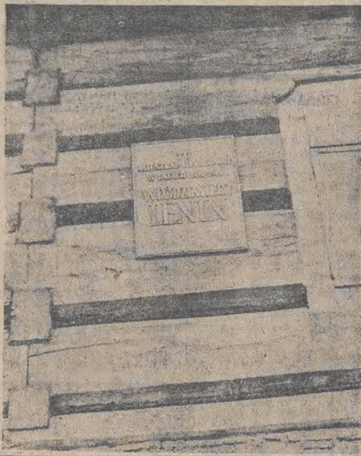
Na ścianie muzeum umieszczono pamiątkową tablicę: „Tu mieszkał i pracował w latach 1912—1914 — Włodzimierz Lenin”.