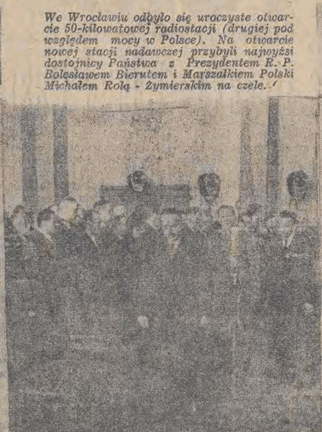
na zajęciu ob. Prezydent i ob. Marszałek wchodzi do studia radiostacji wrocławskiej, aby posłuchać finałowego koncertu radiowego festiwalu muzyki słowiańskiej).