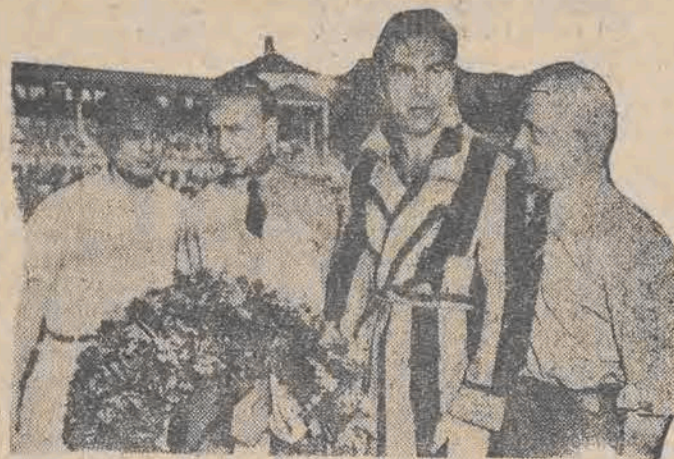
Ten goryl na zdjęciu to znany bokser hitlewski i b. SS-man, Max Schmelling. Amerykanie szybko umożliwili mu „denazyfikację” i występy na ringach. Drab bije narażenie — w rękawicach...