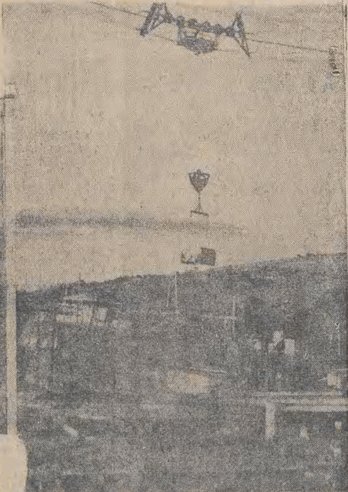
Rożnów Nr. 1 nie wystarczy dla naszych potrzeb elektryfikacyjnych i „ambicji energetycznych”: w Czechowie (województwo krakowskie) buduje się zapórę wodną drugą pod względem wielkości w Polsce. Otwarcie jej przewiduje się już na r. 1948.