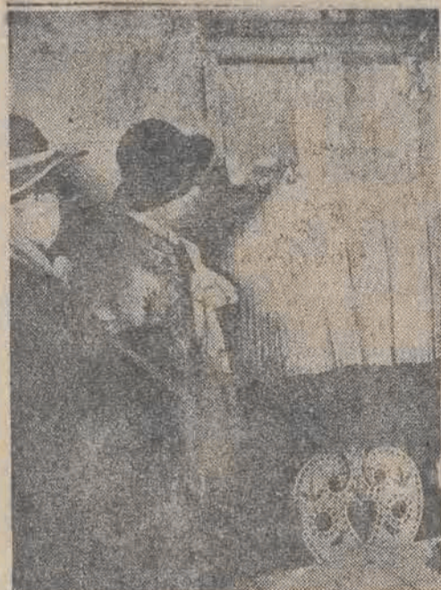
Górale z Zakopanego i okolic oglądają z zainteresowaniem nowootwarte muzeum.