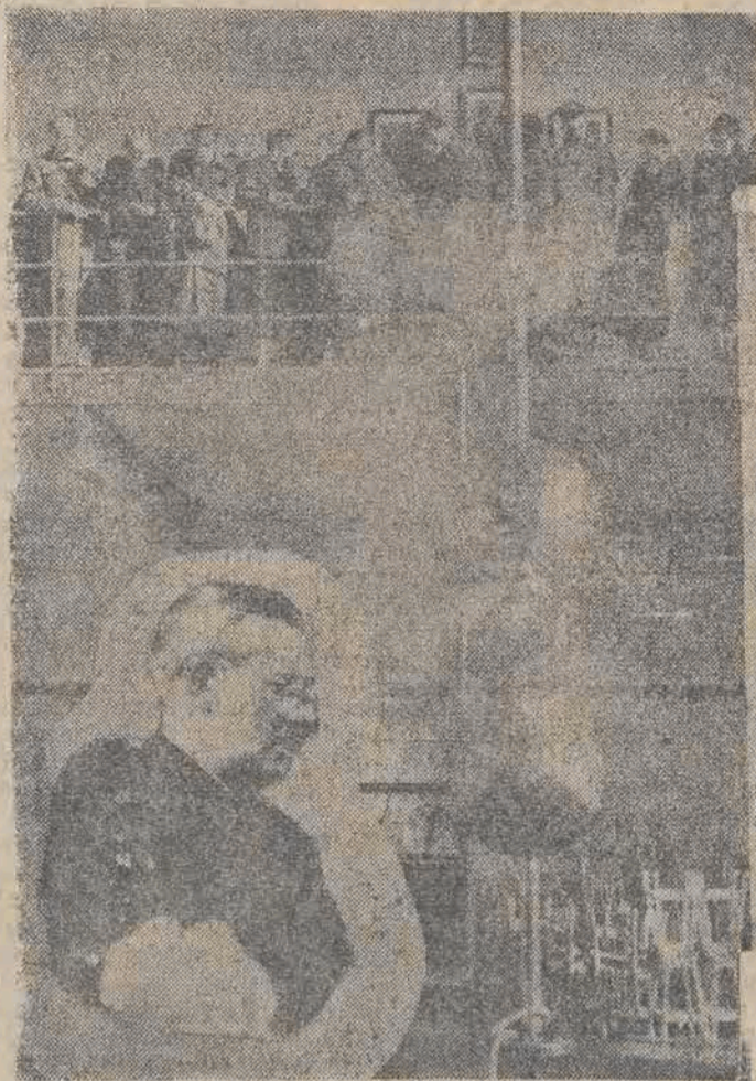
W Warszawskim Instytucie Elektrotechnicznym została wybudowana specjalna hala t. zw. „najwyższych napięć”. (Na zdjęciu fragment hali oraz monier odbudowy naszego przemysłu, min. Hilary Minc, którego przemówienia z okazji otwarcia hali wysłuchano z zainteresowaniem).