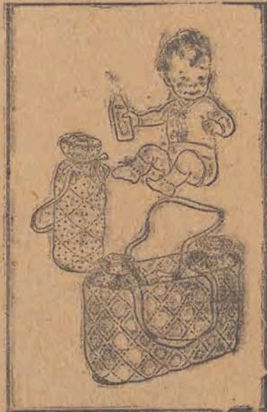
Na załączonych rysunkach przedstawiamy kilka drobiazgów i przedmiotów codziennego użytku, które mogą zostać własnymi siłami wykonane w domu przy minimalnym nakładzie pieniędzy.

Własnymi siłami wykonane drobiazgi domowe