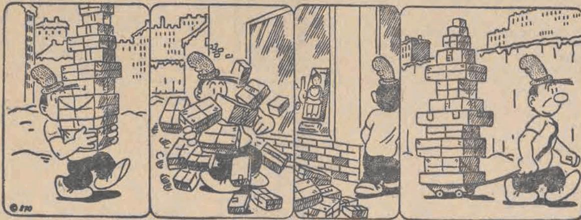
D — 018594