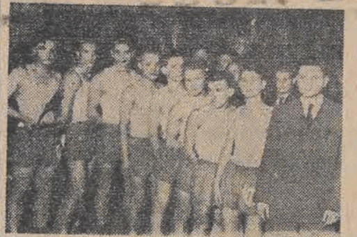
Reprezentacja XI Państwowego Gimnazjum i Średniej Szkoły Przemysłu Poligraficznego spotkały się w niedzielę w ringu. Zwyciężyli uczniowie XI Gimnazjum 10:6.