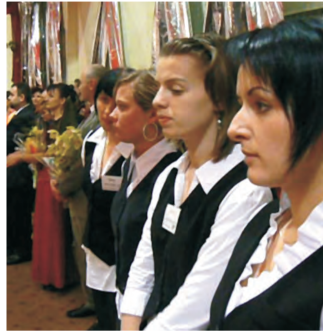
Tegoroczna studniówka na Blichu. Jeszcze we własnej sali, ale z pełną obsługą firmy cateringowej.

2 na Blichu i szefowa komitetu organizującego studniówkę. – Mamy piękną dużą salę i odpowiednio zaplecze, z którego można skorzystać.