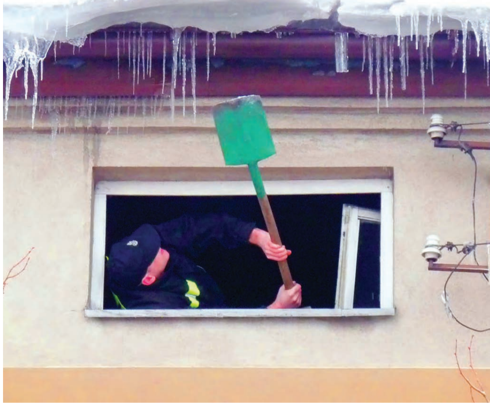
Nie zawsze z podnośnika. W taki sposób 13 stycznia strażacy OSP Głowno usuwali sople zwisające z dachu jednej z kamienic przy ul. Łowickiej w Głownie.

– Pomoc PSP może być i jest dysponowana do zagrożeń, które wynikają z możliwości zsunienia się nawisu śnieżnego lub oderwania sopli na osoby znajdujące się pod budynkiem. Interwenujemy także, gdy na skutek zalegającego śniegu dochodzi do odkształcenia konstrukcji dachu, trzeba wyznaczyć strefę zagrożenia, ewakuować mieszkańców. Typowe odśnieżanie należy do właścicieli obiektów. Mogą je wykonywać wyspecjalizowane firmy, które zatrudniają pracowników z uprawnieniami do pracy na wysokości. Każdy, kto odśnieża dach, musi być zabezpieczony, najlepiej specjalnymi szelkami zakotwiczonymi o jakiś stabilny element np. komin. – podkreśla dowódca strykowski strażaków. ewr