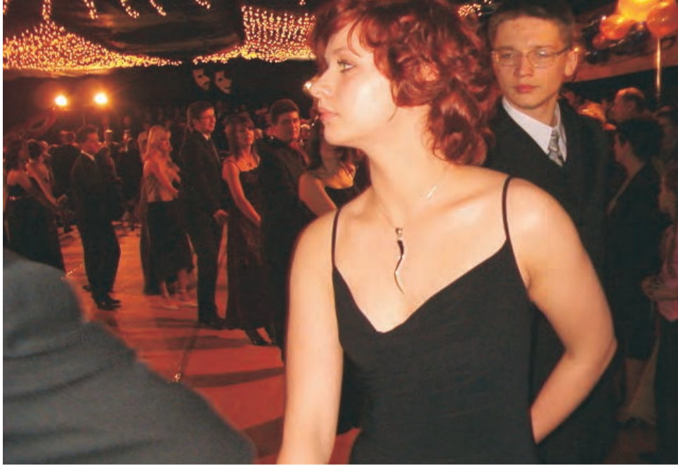
To już historia. Jedną z poprzednich studniówek w murach I LO przy ul. Bonifraterskiej. Przygotowanie sali było zadaniem uczniów i rodziców.