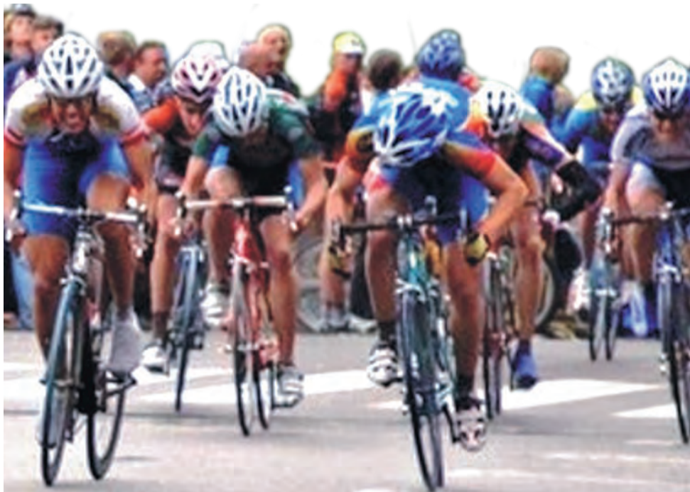
Kolarze ŁUKS Dwójki Stryków z reguły dobrze radzili sobie w końcówkach wyścigu