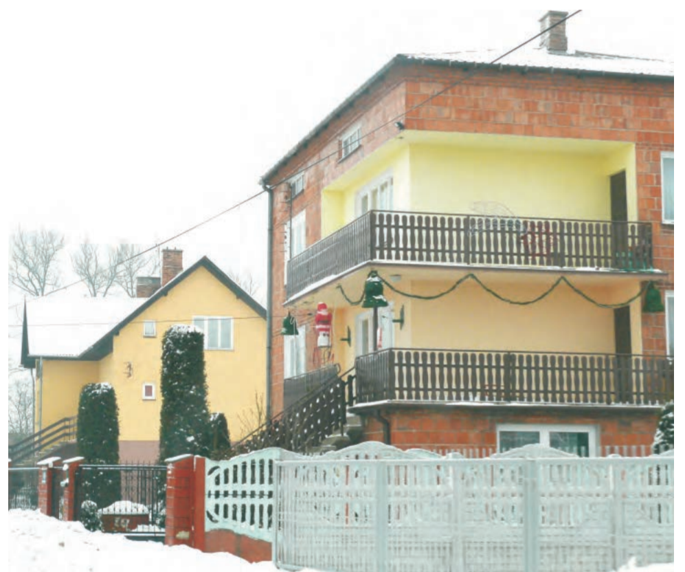
Zabudowa w Zielkowicach, gmina Łowicz, na jej terenie rolnicy nie płacą podatku od nieruchomości na terenach rolnych.

Obecnie stawka podatku wynosi 0,37 zł za 1 m 2 . W ubiegłym roku z tytułu tego podatku do budżetu wpłynęło około 34 tys. zł - z około 92 tys. m 2 powierzchni mieszkalnych.