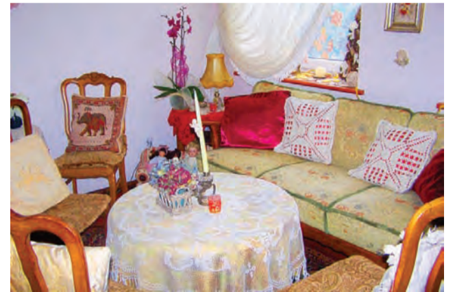
Wnętrze herbaciarni Ambrozja.