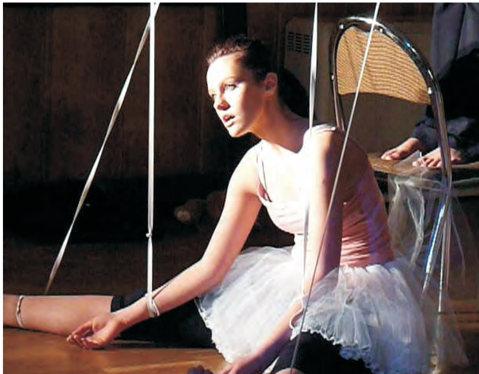
Sterowane niczym marionetki , których każdy ruch jest kontrolowany - fragment spektaklu.

– Chciałam pokazać dziewczętom, że można zrobić coś więcej niż tylko figury taneczne. Jestem z nich dumna, szczególnie z pracy, jaką wykonałyśmy przez te kilka miesięcy. Publiczność była pod wrażeniem układu, w którym dziewczęta wcieliły się w role marionetek