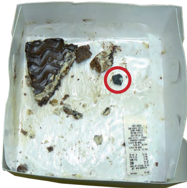
Pechowe ciasto. Po prawej stronie od ciasta, zaznaczony na czerwono, widoczny kawałek metalu, który się z nim znajdował.

Gdy z pytaniem o sposób załatwienia reklamacji zwróciliśmy się do Cafe Bordo, dowiedzieliśmy się, że „sprawa jest w toku” i odesłano nas do Stacji Sanitarno-Epidemiologicznej oraz do dostawcy ciast – kutnowskiej firmy cukierniczej Wsiakowie. Z właścicielką kawiarni nie udało nam się porozmawiać. Pracownicy deklarowali, że przekazali jej, że chcemy się skontaktować i jeśli uzna za stosowne, to sama do nas zadzwoni. Nie zadzwoniła.