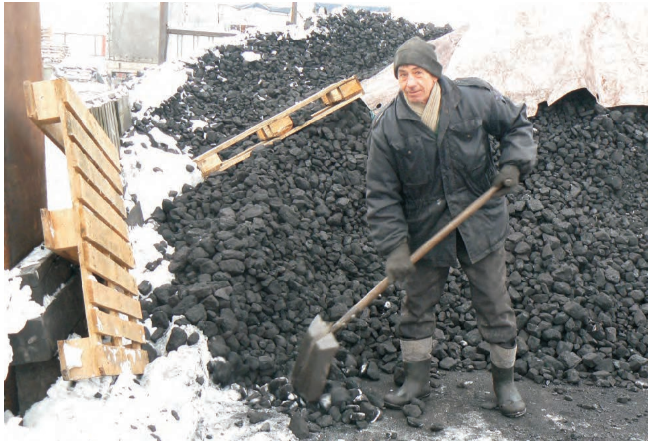
Skład opału w Nowych Zdunach ma wiele zamówień, ale niewiele z nich to zamówienia większe niż 500 kg węgla.

– Handel węglem to niewdzięczne zajęcie. Normy z kopalni mówią, że w tonie węgla dobrej jakości może być nawet 80-100 kg miału. To dużo i potem klienci narzekają, że dostali „piochu”. Mam na to odpowiedź, że „pioch” to jest na żwirowni, ale jeden zrozumie, a drugi będzie narzekał – usłyszeliśmy w innym składzie węgla. Potwierdza to żona właściciela składu z Nowych Zdun. – Trafiają się klienci, którzy by chcieli, żeby kawałki węgla były tej samej wielkości, jeden chce,