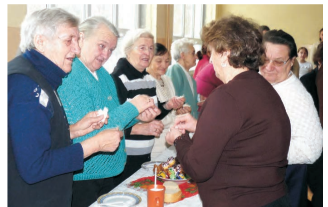
Serdecznościom przy opłatkach nie było końca.