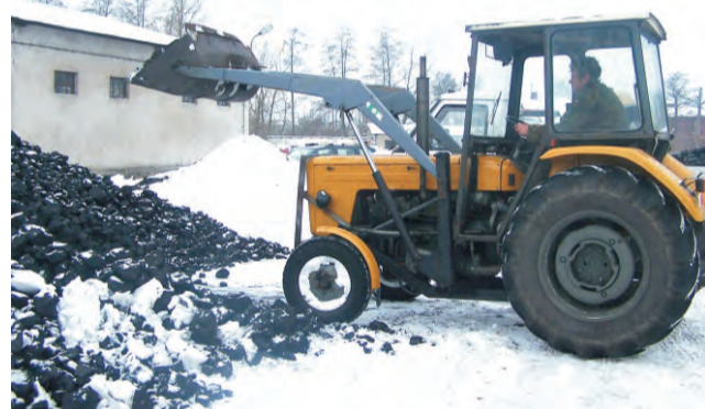
Ładowanie węgla. Skład Agro w Dmosinie Drugim.

ton mieszkańcy Głowna i okolice mogą liczyć na transport gratis.