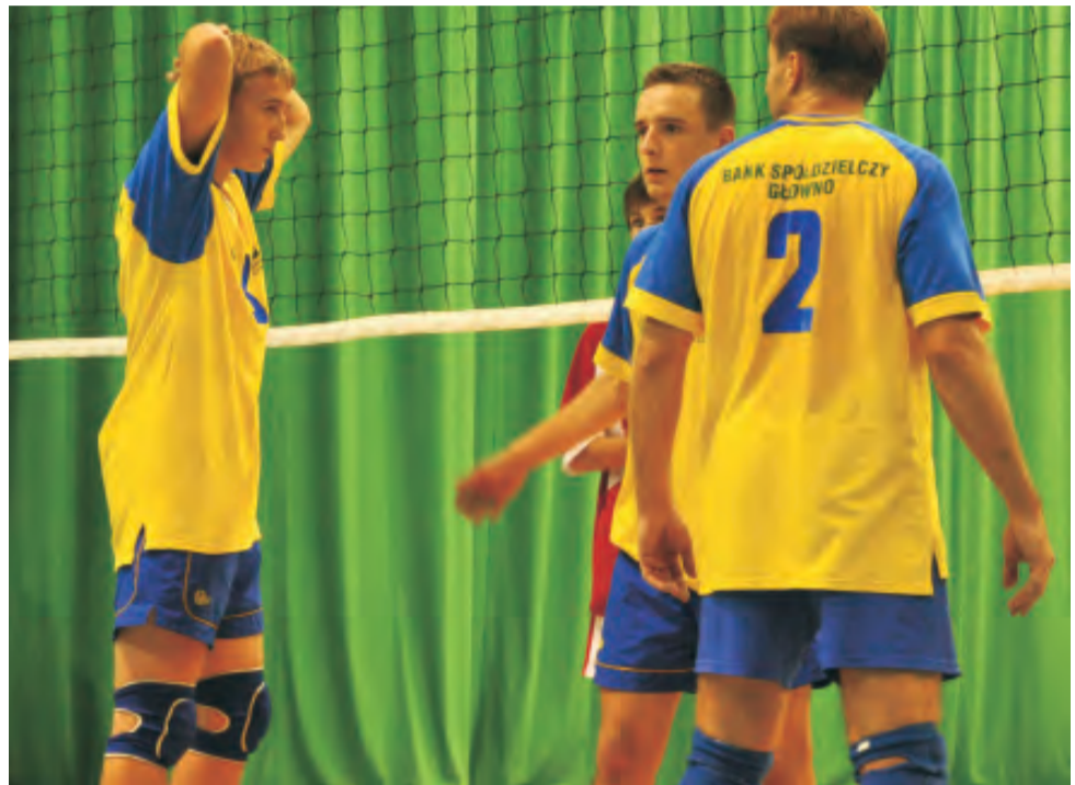
Siatkarze 45 TKKF 45 Głowno pokonali Pijarską Łowicz 3:1 i awansowali na trzecie miejsce w tabeli grupy mistrzowskiej „A”.