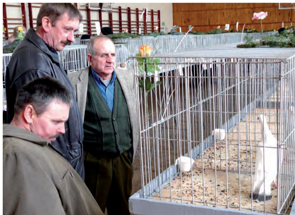
Gołębie, przez wielu odwiedzających wystawę, były bardzo dokładnie oglądane.

W czasie wystawy, już po ocenie, ptaki były przedmiotem handlu i wymiany, zainteresowanych gołębiami ideałami było wielu.