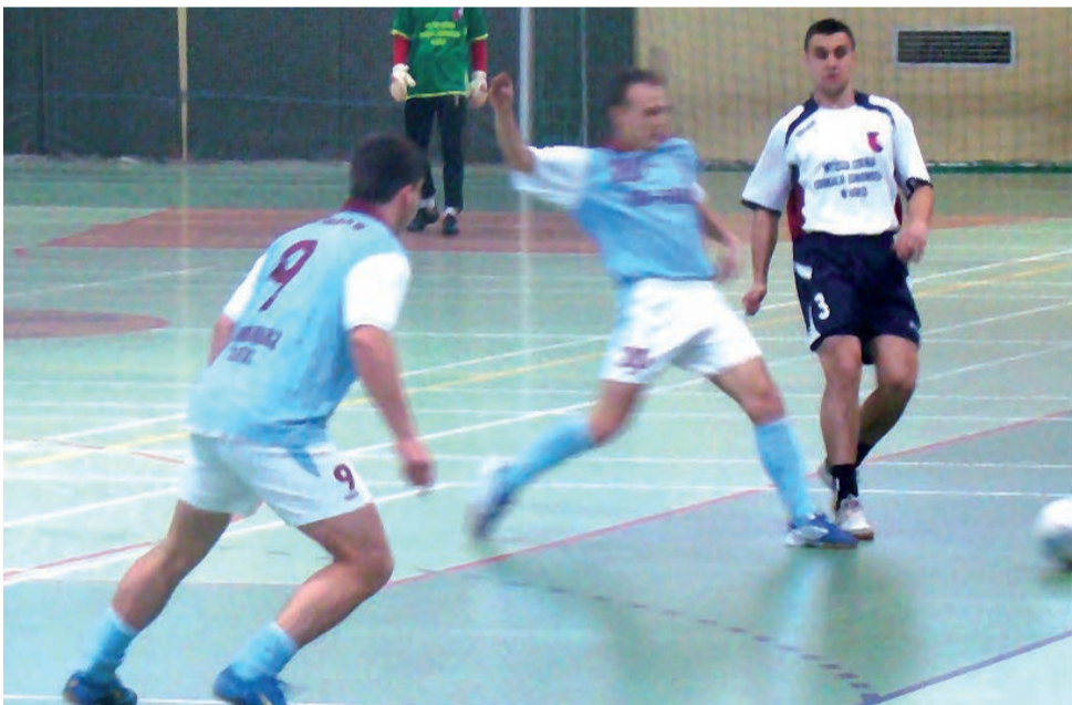
Piłkarzom Zjednoczonych Stryków nie udało się obronić tytułu mistrza powiatu zgierskiego w halowej piłce nożnej.

Mecz o I miejsce: Włóknierz Zgierz – Kolejarz Łódź 1:0