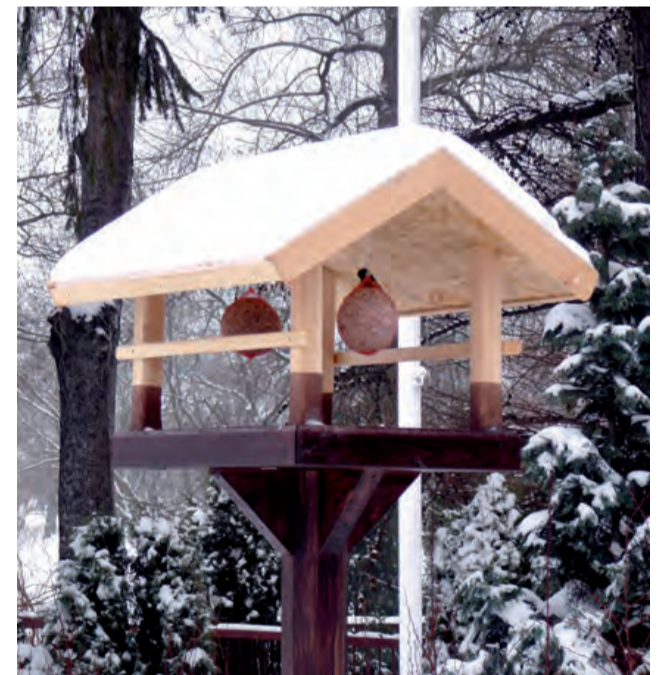
Karmnik przed magistratem. Zwyczaj zimowego dokarmiania ptaków nieobcy jest także głowieńskim urzędnikom. Dokarmia je nie tylko burmistrz. rpm

Friday Night Fever czyli gorączka piątkowej nocy – pod takim hasłem 22 stycznia Miejski Ośrodek Kultury w Głownie organizuje dyskotekę. Poprowadzi dj Ziarno. Początek imprezy o godz. 17.00, wstęp 4 zł. rpm