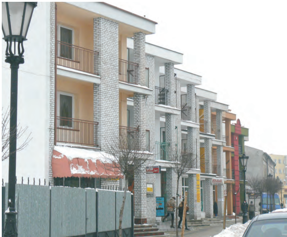
Domy w centrum Łowicza. Ich właściciele płacą podatek od powierzchni, na której mieszkają.

W 2009 roku obowiązywała stawka 40 groszy za m 2 , wpływy do budżetu, które gmina sobie wyliczyła, to 92.751,98 zł. Pod koniec ubiegłego roku sekretarz powiedział nam, że faktycznie wpłynęło 88% tej kwoty. Radni przyjęli na sesji w listopadzie stawkę na rok 2010 od budynków mieszkalnych wynoszącą 45 gr.