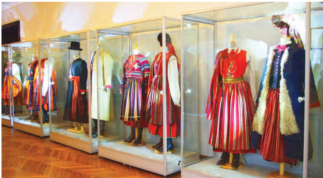
Nowocześnie oświetlone eksponaty na wysywie w muzeum. W nowych gablotach i na nowych manekinach prezentowane są obecnie zabytkowe stroje łowickie.

Najpierw opracowany został scenariusz wystawy oraz aranżacji plastycznej, przygotowane zostały projekty prac technicznych. Projekt zakłada nie tylko wymianę gablot i odpowiednie oświetlenie, ale także remont oświetlenia, malowanie ścian, wykonanie fotogramów, zakup gablot, wykonanie podestów oraz ścianek działowych, przygotowanie prezentacji fil-