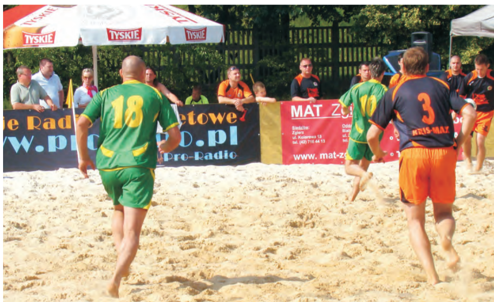
KS Piórkowscy Wola Cyrusowa największe triumfy święcił w plażowej piłce nożnej.

Rozgrywki zostały zorganizowane przez Polski Związek Piłki Nożnej. W turnieju brało udział 4 najlepsze drużyny w Polsce. W finale KS Piórkow-