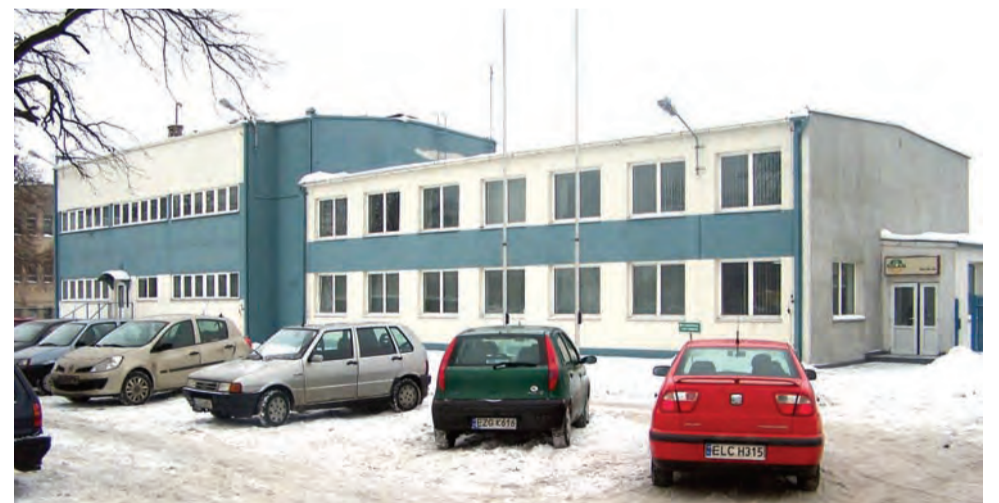
Solan Głowno. Firma szuka inwestora strategicznego.