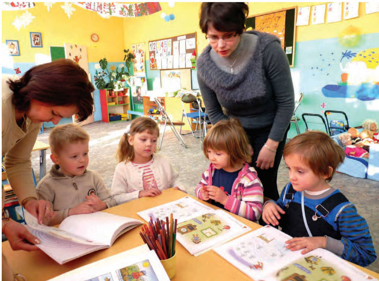
W Przedszkolu nr 3 w Głownie – na zdjęciu grupa najmłodszych dzieci – na liście rezerwowej wciąż oczekuje na ewentualne zwolnienie w nim miejsca ponad dziesięcioro dzieci.

Ponieważ Przedszkole nr 3 jest jedyną placówką, której warunki lokalowe mogą pozwolić na utworzenie dodatkowego