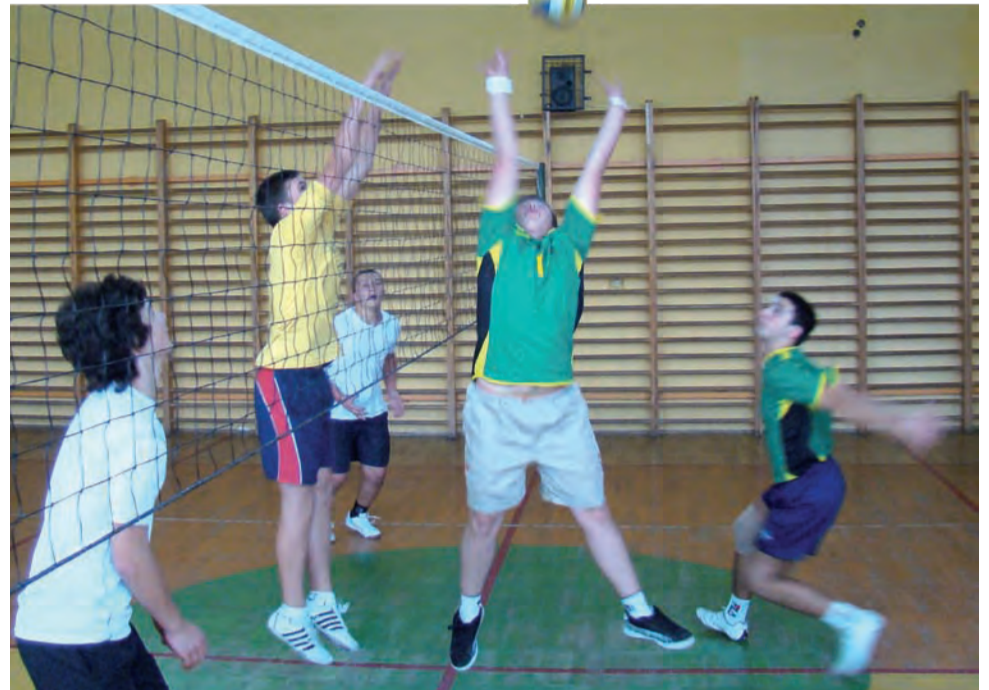
Siatkarskie rozgrywki szkolnej ligi chłopców nabierają tempa.