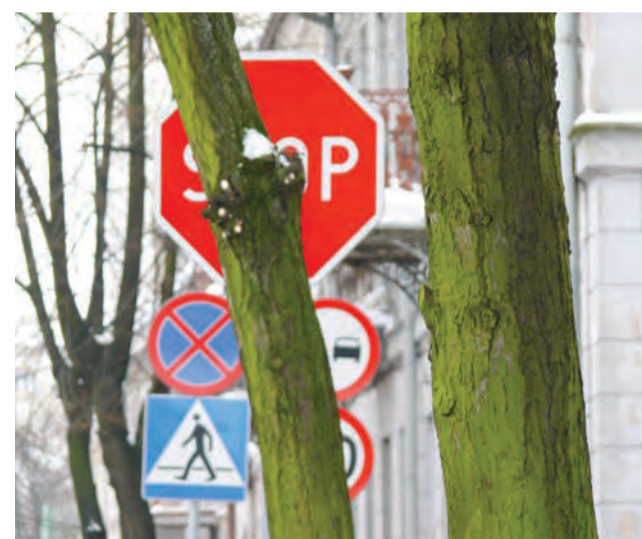
Niektórzy kierowcy uważają, że oznakowanie jest słabo widoczne.