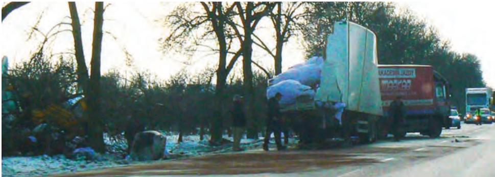
Uszkodzony tir zatarasował jeden pas. Jeszcze przed godziną 14.00 w na krajówce Kadzielinie samochody puszczano ruchem wahadłowym.