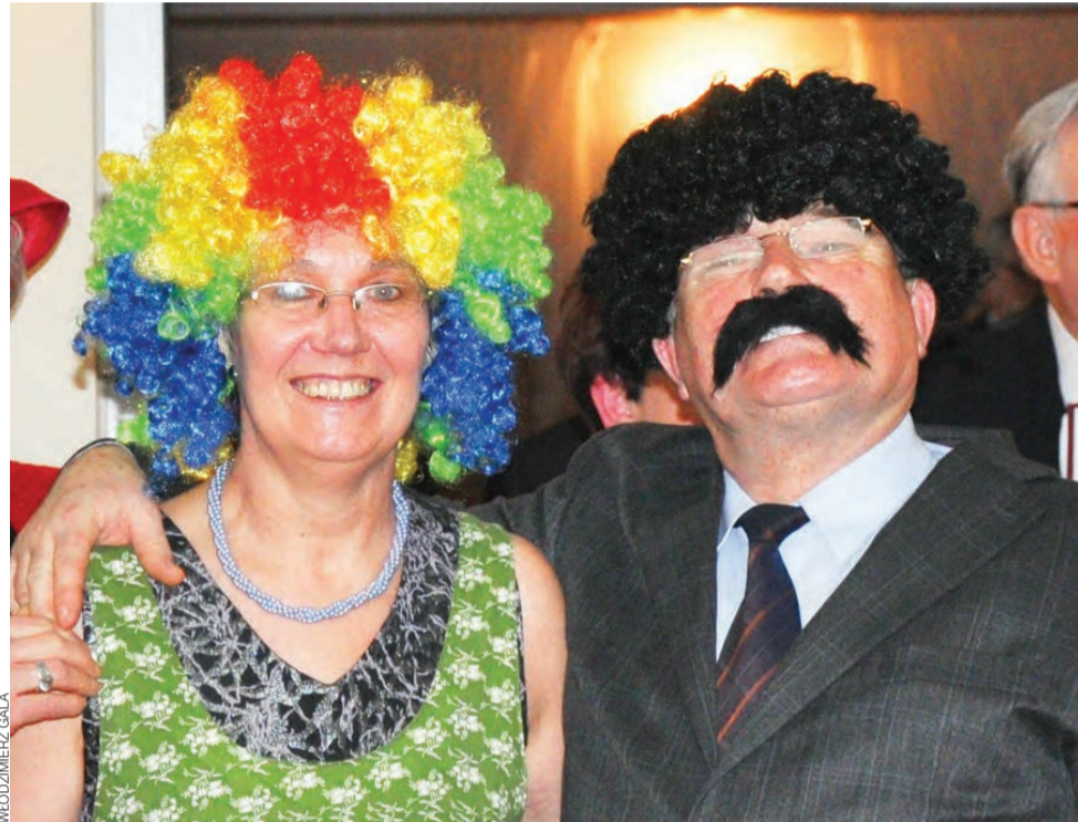
Bal w Nieborowie. Seniorzy potrafią się bawić.

Karnawał w łowickim Klubie Seniora zakończy się 15 lutego baleń ostatkowo-walentynkowym w restauracji Polonia. mwk