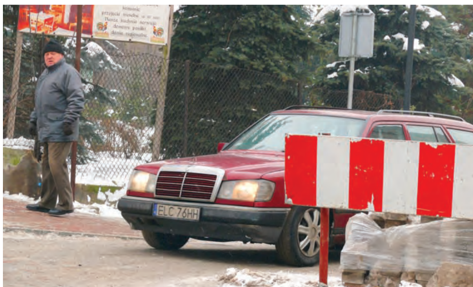
Te pozostałości po budowie także nie polepszały widoczności. Szybko je jednak usunięto.