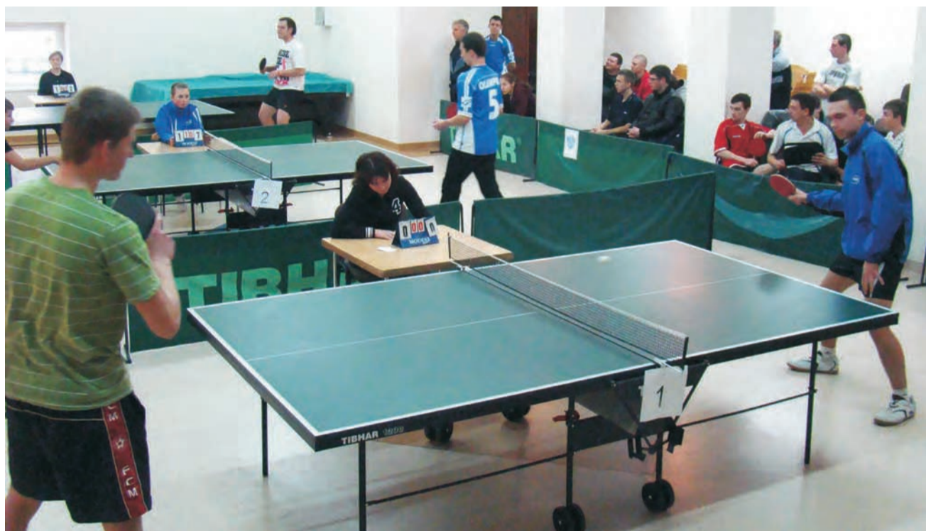
Tenisiści pierwszej i drugiej drużyny LUKS Koźle jeszcze nie należą do ścisłej czołówki czwartoligowych rozgrywek. Jednak czas pracuje na korzyść młodych zawodników z Koźla.

Pierwsza drużyna LUKS-u Koźle zajęła ostatecznie dzie-