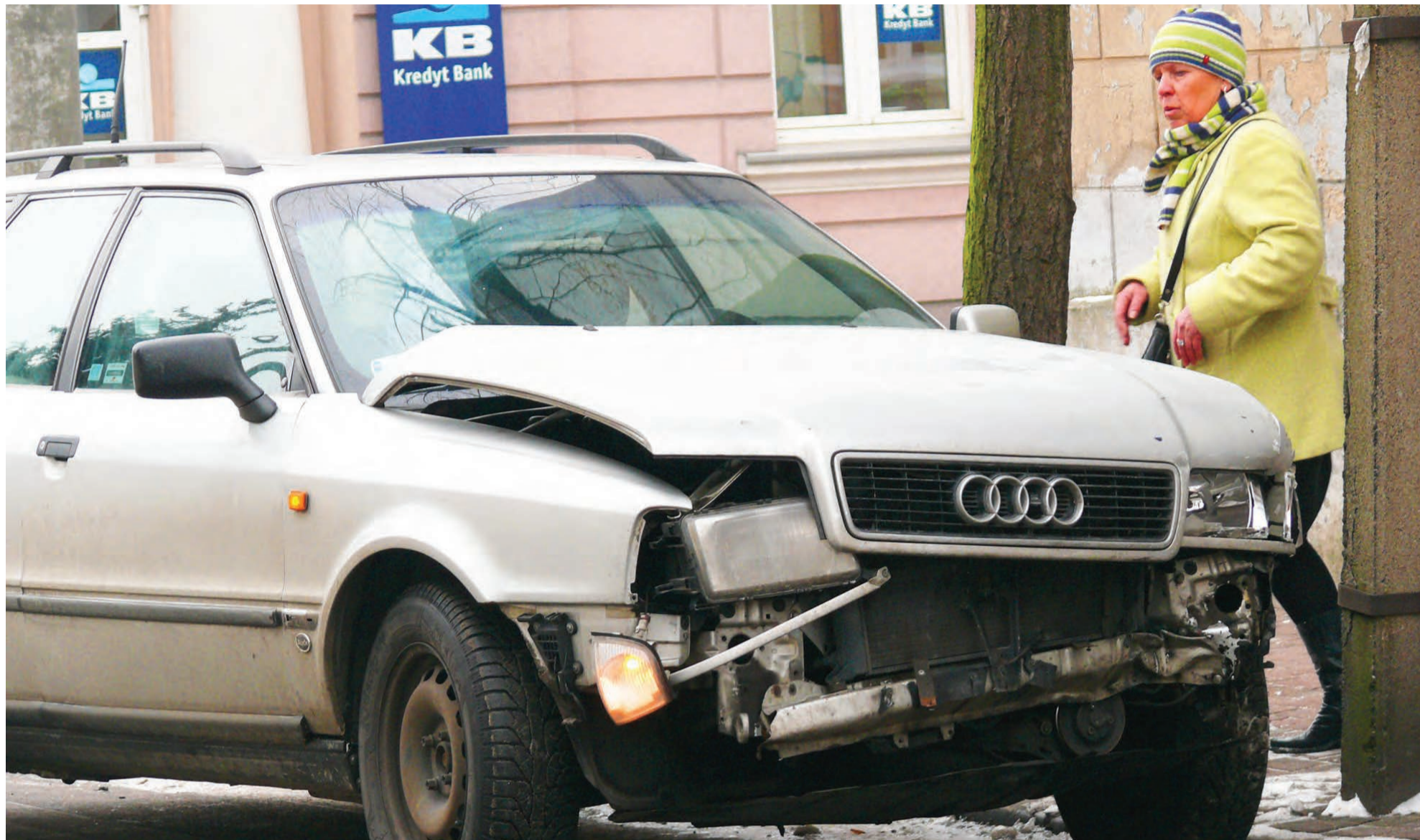
Ten samochód nie miał pierwszeństwa, ale na skrzyżowanie wjechał. Jak się skończyło – widać.