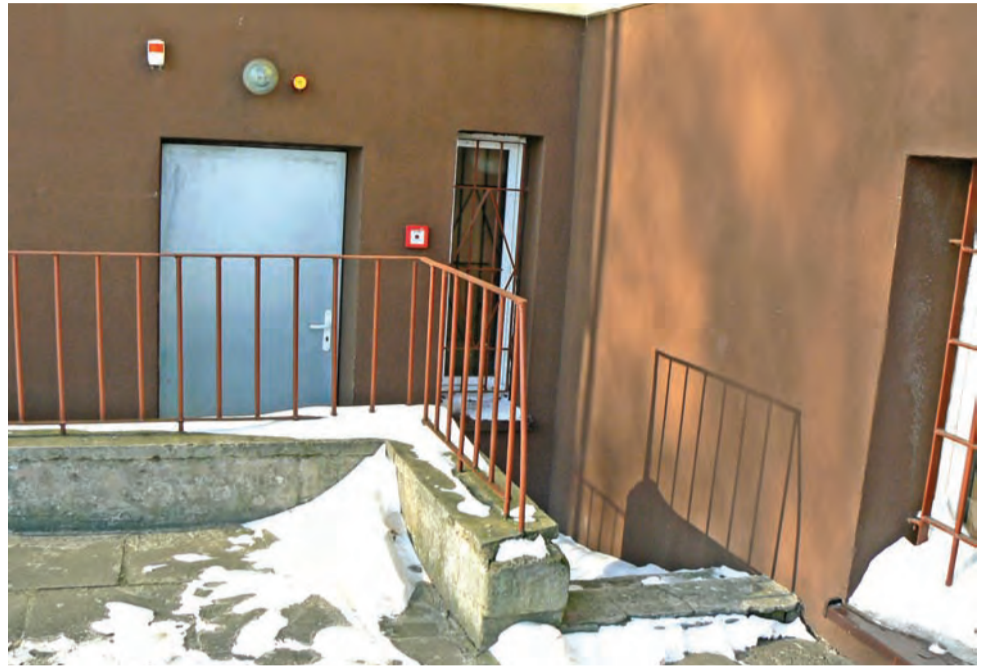
Schody prowadzące do kotłowni. W czasie ulewnych opadów deszczu tędy dostaje się woda. Nie jest to jednak problem tak uciążliwy jak cofanie się fekaliiów.