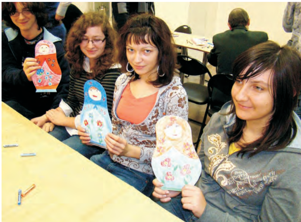
Uczniowskie matrioski. Na zajęciach w RONiK uczono się o technikach tworzenia i wzornictwie tych najbardziej na świecie znanych rosyjskich pamiątek.