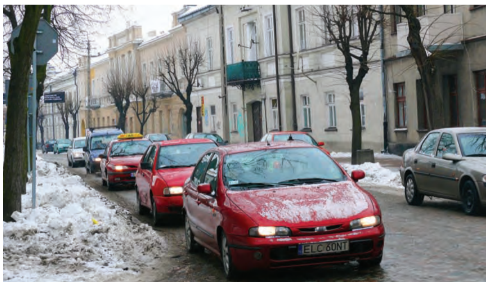
Najłatwiej było zauważyć zmianę kierowcom jadącym Podrzecznią jeden za drugim. Gdy pierwszy zatrzymał się na stopie, następni siłą rzeczy też musieli.