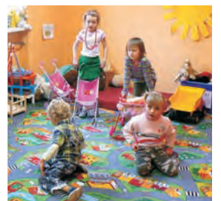
Gmina Stryków dotuje m.in. przedszkolaki uczęszczające do nowego przedszkola niepublicznego w Niesułkowie.

W zależności od tego, czy we wrześniu będzie ich mniej, czy więcej, kwota dotacji może ulec zmianie. Miesięczny koszt utrzymania dziecka w Przedszkolu Samorządowym to 841,89 zł, czyli dofinansowanie dla przedszkoli niepublicznych stanowi kwotę 631,41 zł. Wydatki na Przedszkole Samorządowe, do którego uczęszcza 60 dzieci, a od września – kiedy ruszy rozbudowane przedszkole przy ul. Targowej – ma ich być 80,