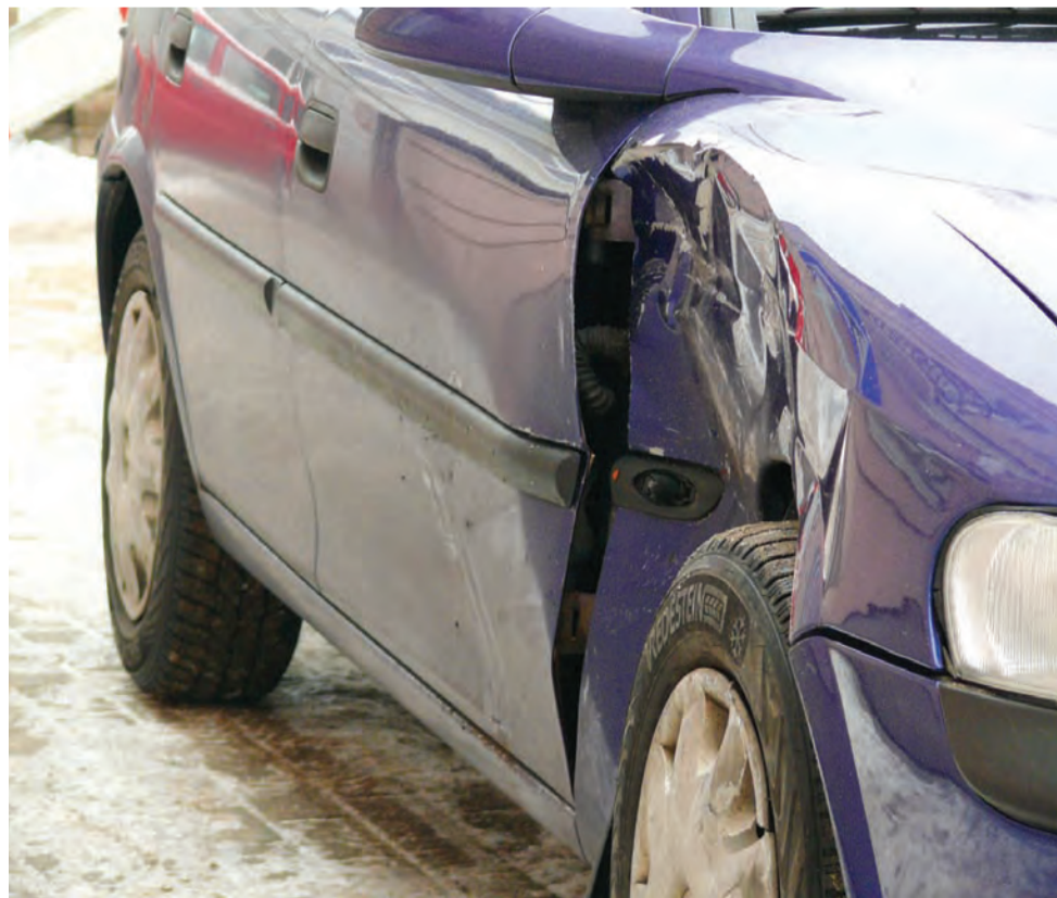
Ślad po jednej z pierwszych stłuczek. Mogło być gorzej.

Trzeba jednak wziąć pod uwagę, że ul. Starorzecze otwarta jest dopiero od trzech dni. Wiele osób jeszcze o tym nie wie, a inni nie mieli okazji nią jechać. Intencja zmian jest taka, by Podręczną odciążać. Jak mówił na konferencji prasowej we wtorek burmistrz Kaliński, tak już pozostanie, zmiany nie zostaną cofnięte. mak, eb