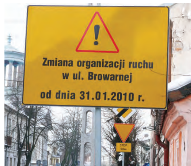
Oznakowanie było wyraźne, mimo to nie wszyscy zwracali na nie dostateczną uwagę.