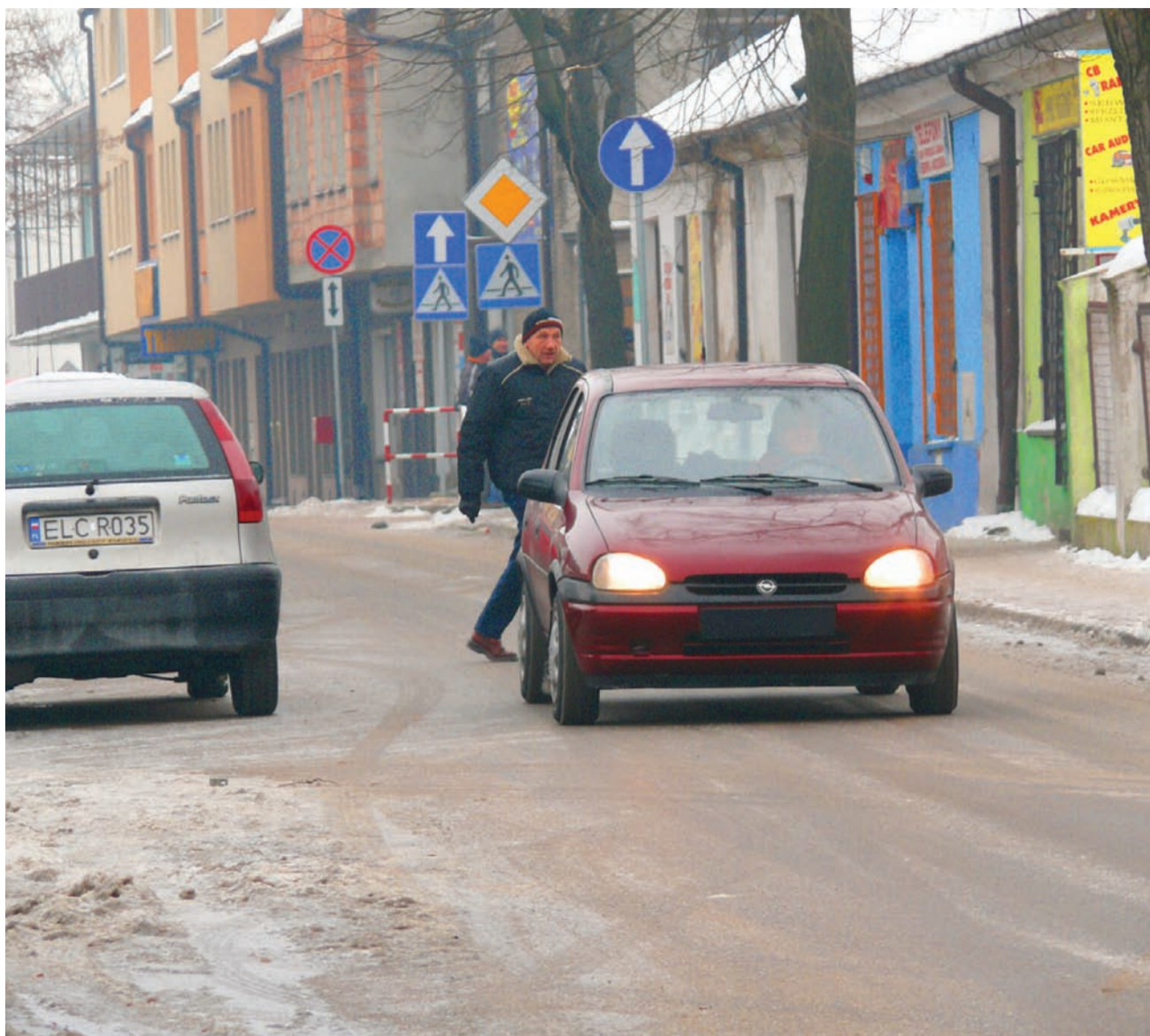
Kierowca tej Corsy także jechał Browarną na pamięć, w stronę Podrzecznej, pod prąd.