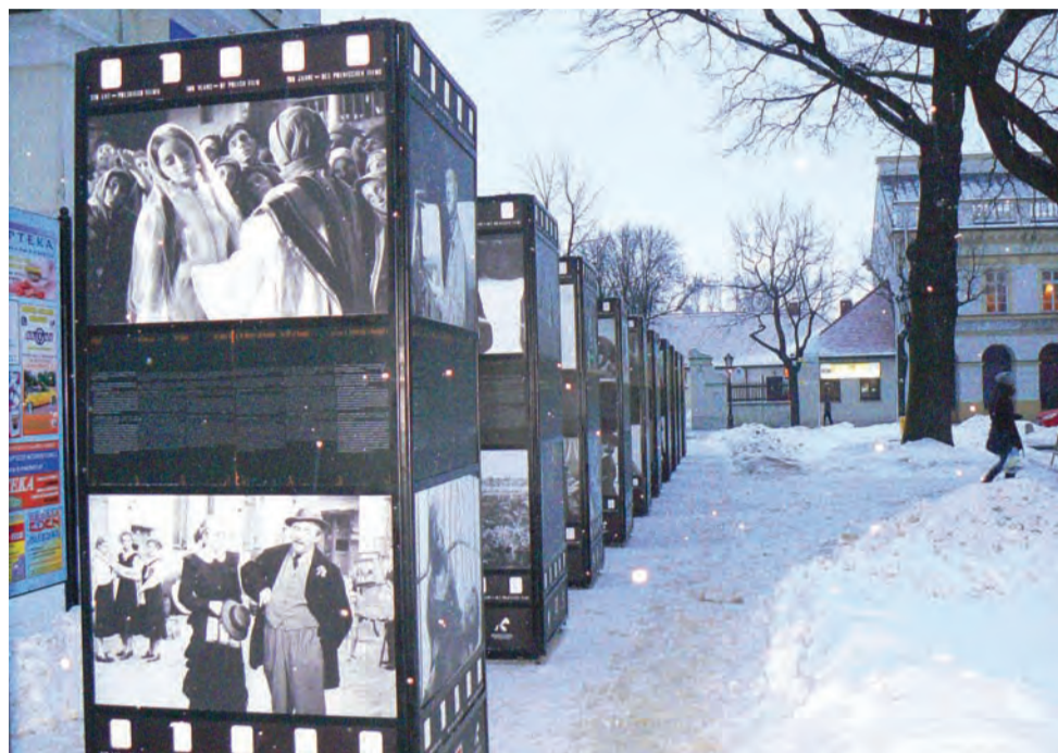
Wystawa na Starym Rynku. Do końca lutego można oglądać podświetlane zdjęcia scen filmowych, które zapisały się w historii polskiego kina jako te najwybitniejsze.