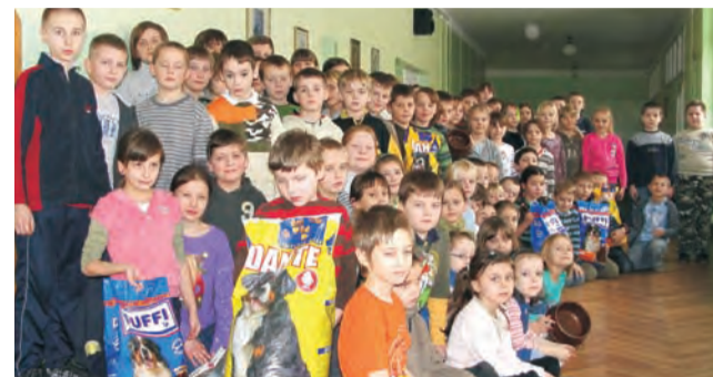
Szkoła Podstawowa nr 3. Dzieci z karmą dla zwierząt dla łowickiego schroniska.