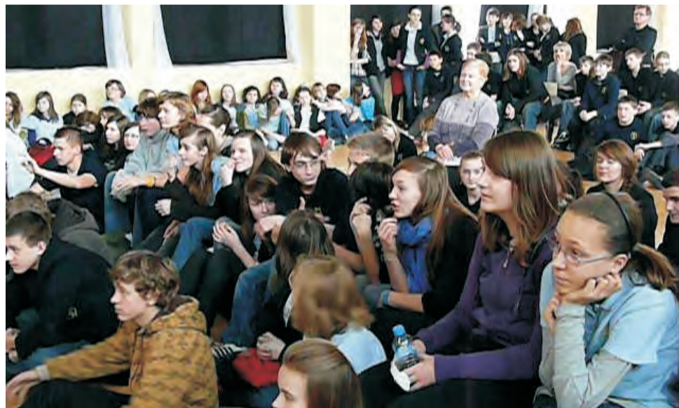
Festiwal Nauki. Na widowni zasiedli gimnazjaliści i licealiści, którzy kibicowali swoim drużynom.