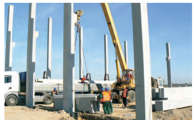
Pierwsze słupy budynku, który zostanie zbudowany na planie krzyża.

zuje się na rok 2013. Obecnie poszukiwani są robotnicy zainteresowani pracą na budowie pod Strykowem. Ma tu powstać najbardziej rozbudowane centrum handlowo-serwisowe firmy Truck&Trailer. Swoje miejsce znajdą tu salon oraz stacja serwisowa. Prowadzona będzie tu sprzedaż części zamiennych do samochodów i nacze- najem i naprawa nacze- Inwestycja obejmuje także montownie nacze- salon sprzedaży i punkt obsługi samochodów Mercedes-Benz. Podstrykowski Tulipan Park to przegląd wielu branż. Niedawno zbiegu autostrad postanowiły ulokować się m.in. takie firmy jak produkujący światłowody amerykański Corning, produkujący tekturę niemiecki Prowell, sprzedający wykładziny Komfort, jak również na przykład handlujący wysyłkowo książkami Azymut.