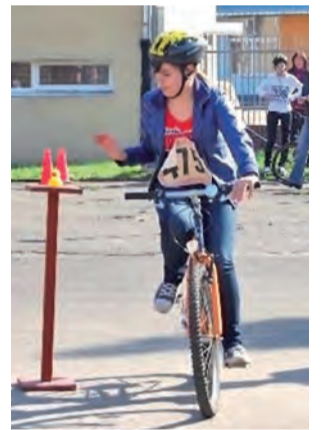
W części praktycznej pokonać trzeba było tor rowerowy.