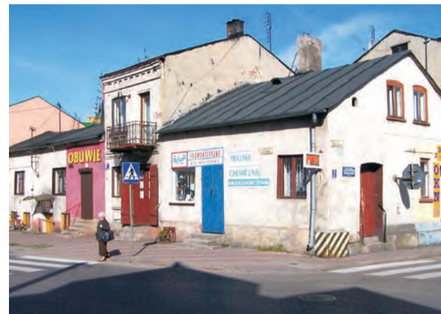
Tegoroczny plan remontowy zakłada m.in. remont dachów i elewacji tych dwóch budynków komunalnych w centrum miasta.

W pierwotnym planie remontowym ani remont narożnika budynku przy Leśnej, ani remont w budynku przy ul. Kościuszki nie były przewidziane. Do planu – jako pilne – włączone zostały dopiero po interwencjach mieszkańców na forum rady oraz po naszych publikacjach. Remont budynków przy Zgierskiej poprawić ma estetykę centrum miasta, a budowa nowych toalet jest niezbędna. Te, z których obecnie korzystają, urągają swym stanem. rpm