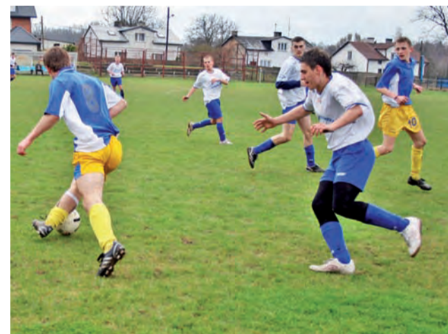
Juniorzy Stali Głowno ulegli na własnym boisku LKS-owi Różycy 1:2

Kolejno w tabeli: liczba meczów, liczba punktów, stosunek punktów zdobytych do straconych, współczynnik – punkty zdobyte/punkty stracone.