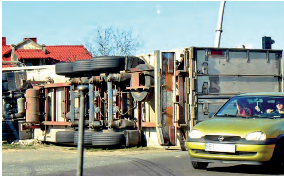
Przewrócony TIR. Tym razem obyło się bez ofiar.

Tym razem na utrudnieniach się skończyło. Obyło się bez