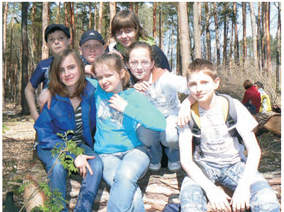
Rajd z okazji Dnia Ziemi. Na polanie w okolicach gajówki Siwica uczniowie z SP w Dzierżgówku.

Rajd zakończył się ogniskiem przy zajeździe Rozdroże w Nieborowie, w którym wzięli udział organizatorzy oraz uczestnicy. Po nim grupa z Łodzi odwiedziła park i pałac Radziwiłłów w Nieborowie. mwk