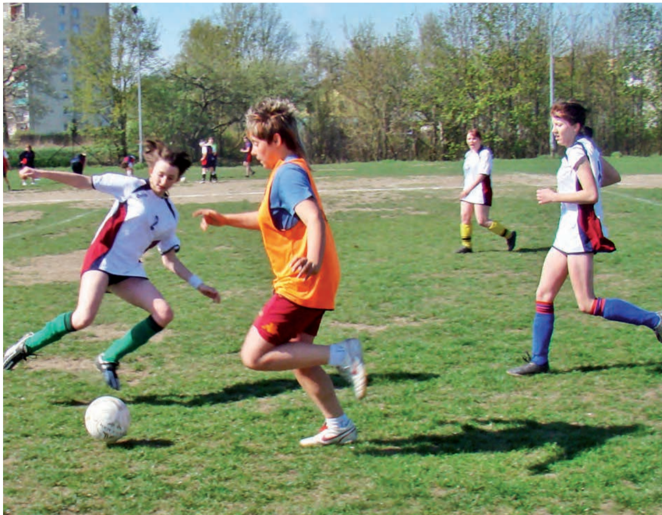
Uczennice ZS nr 1 w Bratoszewicach tym razem słabiej zaprezentowały się podczas mistrzostw powiatu zgierskiego w piłce nożnej szóstek. Bratoszewiczanki nie przebrnęły przez eliminacje i zajęły dalsze miejsce.

■ OSTATECZNA KOLEJNOŚĆ: 1. ZZSP Zgierz, 2. ZS nr 1 Zgierz, 3. ZSZ Ozorków, 4. LO Staszic Zgierz