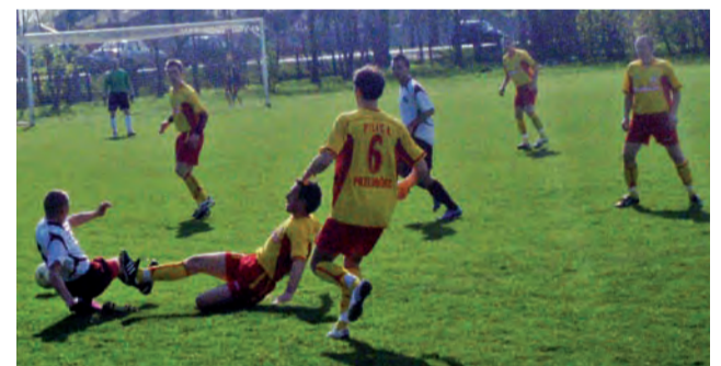
W spotkaniu z Pilicą strykowianie napotkali na twardy opór.