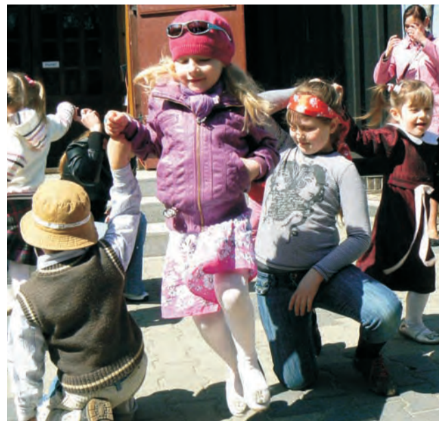
Występy przedszkolaków. Dzieci z Niesułkowa pokazywały to, czego nauczyły się na rytmice.