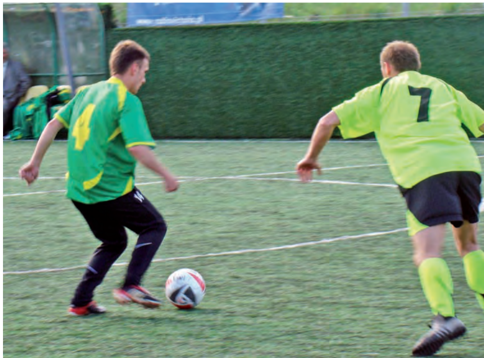
Ekipa UD Piórkowscy wysoko pokonała głównieński Michtrans 12:1 i awansowała na II miejsce w tabeli I ligi Chicken Gold.