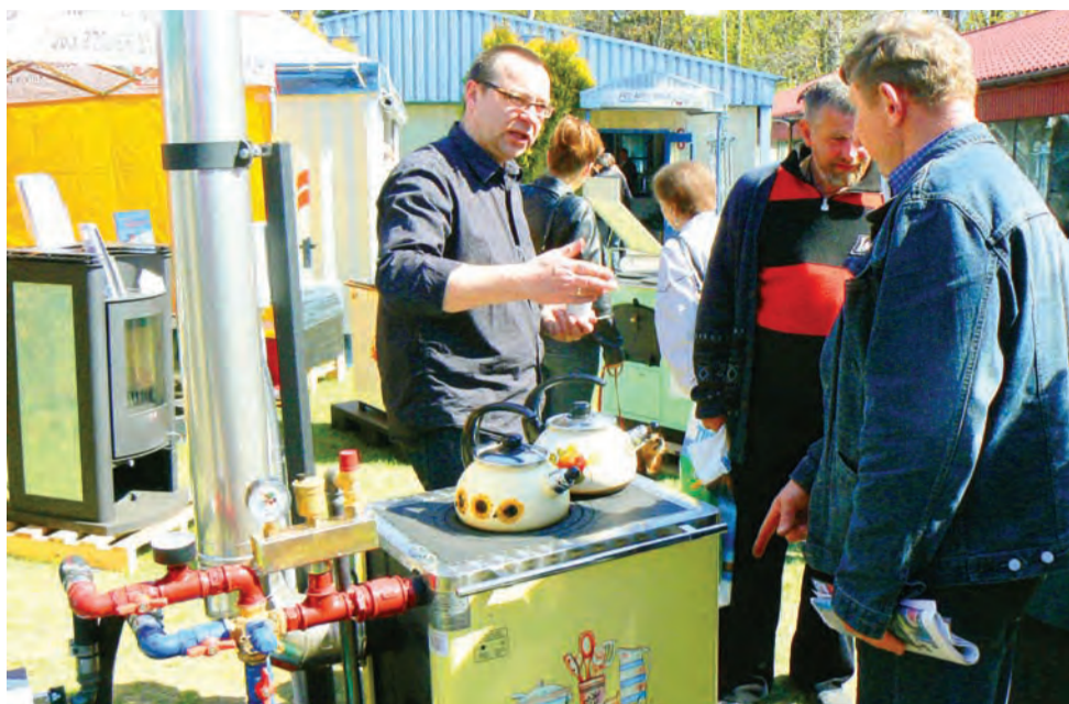
Kup pan piecyk! Na tegorocznych targach prezentowano szereg sprzętów i urządzeń przydatnych nie tylko w rolnictwie, ale i w gospodarstwie domowym.