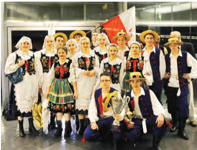
Dwa puchary. Szczęśliwi Mrożanie po ogłoszeniu wyników.

Stowarzyszenie marzy o sprostowaniu w przyszłości międzynarodowego festiwalu do budowanego w Nagawkach Żywego Skansenu – Centrum Folkloru Polskiego. ewr