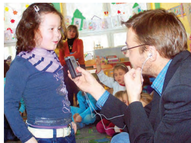
Przedkolaki opowiadały reporterowi radiowemu m.in. o tym, dlaczego w przedszkolu jest fajnie.