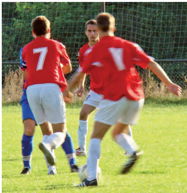
Piłkarze Stali tym razem przegrali. Wyprawa do Parzęczewa zakończyła się wysoką porażką podopiecznych trenera Szadkowskiego.

Na drugą część piłkarze z Głowna wyszli zdecydowanie bardziej skoncentrowani. Pierwsze pół godziny gry to zdecydowana przewaga Stali. Jednak wciąż brakowało celnych