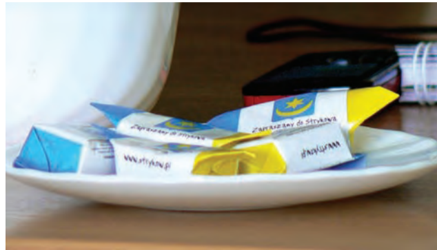
Reklamowe krowki stały się gwoździem programu obrad strykowskiej komisji budżetu.

Ale chciałbym zwrócić uwagę, że już więcej na dożynkach gminnych darmowej degustacji być nie powinno. W ubiegłym roku w Smolicach sam byłem świadkiem, jak ludzie zabierali ze stołów całe torby jedzenia i odjeżdżali samochodami – skłonił do przemyśleń