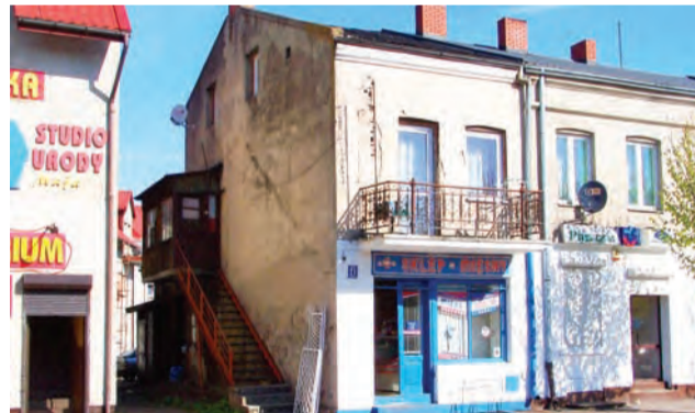
Ten narożny budynek z numerem 21 miasto zamierza sprzedać.

Władze miasta liczą, że sprzedaż ta pozwoli – ze względu na lokalizację działki – uzyskać spore wpływy do budżetu, a także poprawi estetykę tej części centralnego placu miasta. Nabywca nieruchomości będzie zobowiązany do rozbiórki istniejących na niej budynków oraz do budowy nowej plomby przyległej i podobnej do tej na rogu Placu Wolności i ul. Strazackiej.