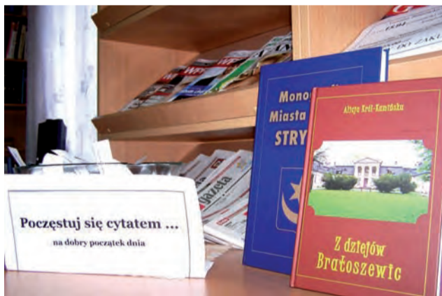
Osoby zainteresowane zakupem monografii, mogą je najpierw dokładnie obejrzeć przy specjalnych stoiskach utworzonych w bibliotekach.