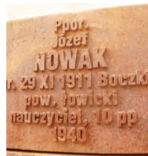
Jedna z „łowickich” tablic w Katyniu.