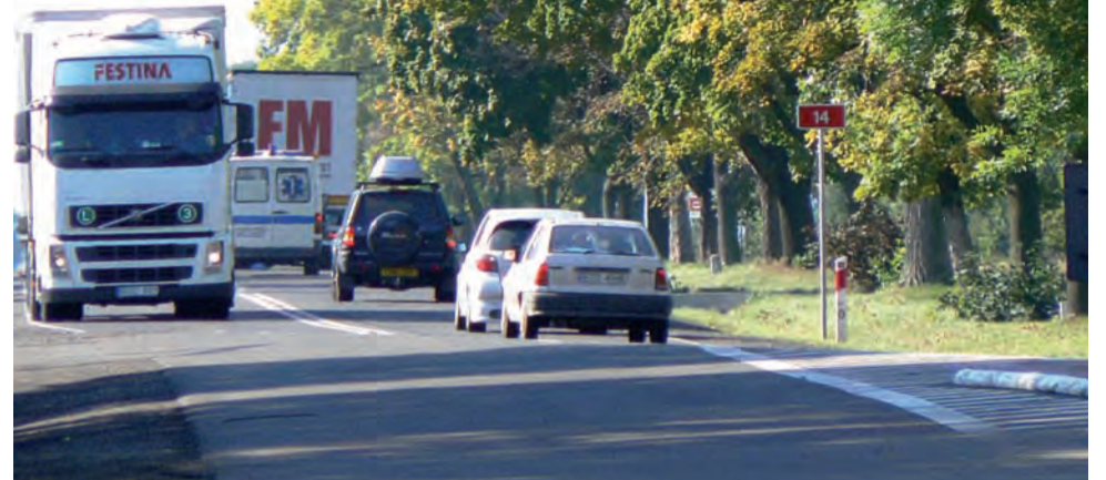
Trasa krajowa w Bratoszewicach. Na zmniejszenie ruchu nie ma w najbliższym czasie co liczyć.

Kiedy jednak przyszło do głosowania nad przyjęciem do realizacji wniosku, czyli innymi słowy przekazania burmistrzowi konkretnej wytycznej gdzie i o co ma się zwracać w tej sprawie, zaczęły się schody. Radni sami stwierdzili, że uzależnienie ograniczania prędkości na trasie krajowej od lokalnych imprez jest bezsensowne. Poza tym nie byli przekonani, czy prędkość, której ograniczenie w Bratoszewicach i tak wymusza już teren zabudowany i skrzyżowanie z sygnalizacją świetlną, można jeszcze