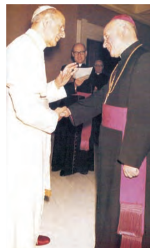
Audiencja u Papieża Pawła VI podczas beatyfikacji o. Maksymiliana Marii Kolbego w Rzymie – rok 1971.