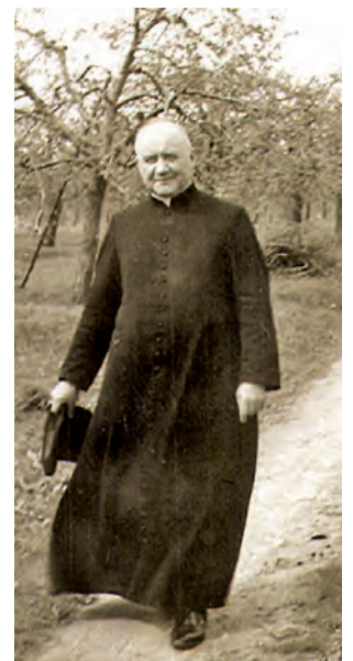
Ks. Rektor Wł. Miziołek spaceruje w kompińskich sadach – rok 1966.

Biskup Władysław Miziołek zawsze starał się być do dyspozycji różnych grup zawodowych, także warszawskiego środowiska twórczego, a jeszcze przed 1980 rokiem często uczestniczył w nabożeństwach i spotkaniach patriotyczno-religijnych z okazji ważnych, a tęponych przez komunistyczne władze, świąt: 3 Maja, 11 Listopada albo rocznicy wybuchu Powstania Warszawskiego. Wymagało to nie tylko odwagi, ale i rozważań, by nie ściągnąć na Kościół oskarżeń o podburzanie do niepokojów. Było to tym trudniejsze, że po wprowadzeniu stanu wojenne-