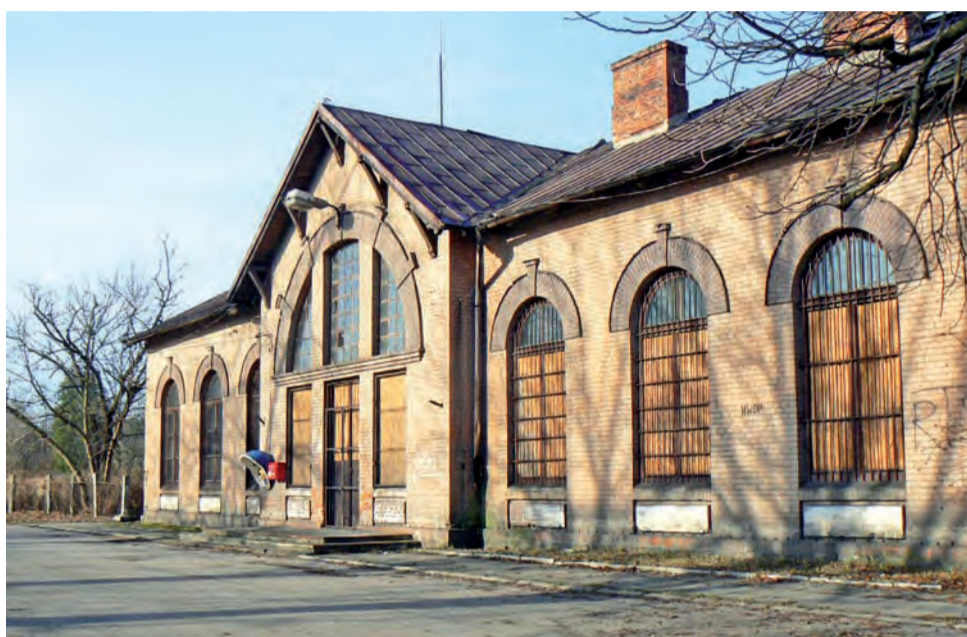
Remont stacji w Głownie kosztować ma ponad 8 mln zł, w tym remont samego tylko budynku dworcowego 720 tys. zł.

Zacznijmy od najbardziej wysuniętego w kierunku Łodzi przystanku w gminie Stryków. Łączny koszt modernizacji przystanku w Swędowie – bo o nim mowa – to niespełna 440 tys. zł, z czego nieco ponad 305 tys. zł to wydatki PKP PLK, 122,5 tys. zł – to wydatki PKP S.A., wydatki budżetu województwa łódzkiego na tej i innych stacjach mają być znikome. Przewiduje się budowę dwóch wiat peronowych, punktowych, wiaty rowerowej, dojść pieszych, podjazdu i parkingu o powierzchni 350 m 2 oraz na remont schodów z obarierowaniem. Kolejny na tej linii postój to stacja Stryków. Koszt jej mo-