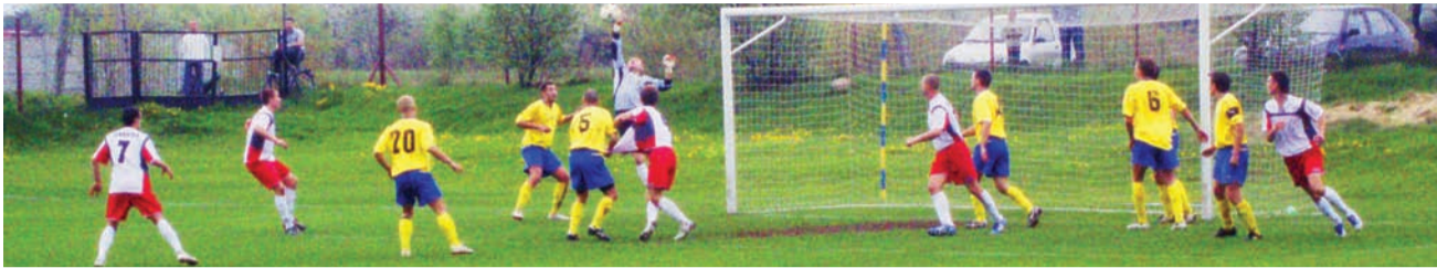
Piłkarze Zjednoczonych Stryków zremisowali z liderem Ceramiką Opoczno 1:1.