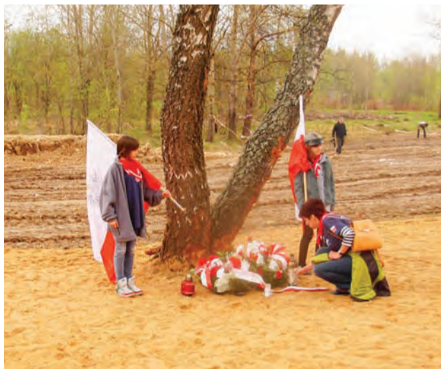
Blisko lotniska pod Smoleńskiem. W kilku miejscach położone są wieńce, palą się znicze, są również zdjęcia pary prezydenckiej.

Przez te kilka dni młodzież zwidziła także: Zaosie, Świtez, Nowogródek, Mir, Nieśwież, Mińsk, Kuropaty, Smoleńsk. Jednak wrażenia z miejsca tragedii pod Smoleńskiem były na tyle silne, że praktycznie wszystkie inne odczucia zeszyły na drugi plan.