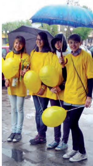
Żółta koszulka i żonkile to znak rozpoznawczy wolontariuszy.

Deszcz w sobotę 1 maja nie przstraszył około 90 wolontariuszy – uczniów Gimnazjum Miejskiego w Głownie i głowieńskich Szkół Podstawowych nr 1 i 2 – którzy kwestowali na ulicach Głowna na rzecz budowy stacjonarnego hospicjum w Zgierzu.