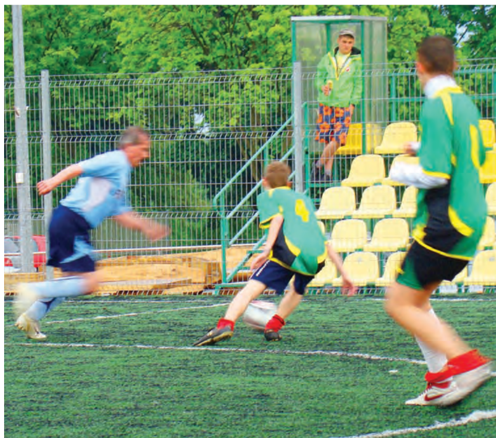
Piłkarze WZS Stryków tym razem nie musieli rozgrywać spotkania, by zainkasować komplet punktów. Drużyna Straży Pożarnej z Brzeziny nie stawiała się na mecz. Zatem Arka Brzeziny ma nadal 2 pkt. straty do WZS.