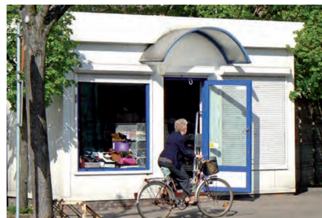
Kiosk przy ul. Rynkowskiego może tu stać przez najbliższe 10 lat.

Na organizację referendum rada przeznaczyła 22 kwietnia 35 tys. zł. rpm