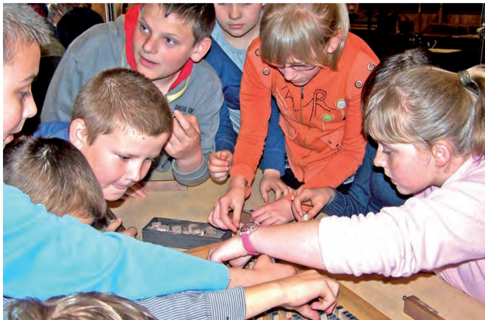
Użyć swoje imię z metalowych czcionek. Wydawałoby się, że nie ma nic prostszego, a jednak nie wszystkim wychodziło za pierwszym razem.

Dzieci odciskały swoje imiona na pamiątkowych certyfikatach uczestnictwa w warsztatach, a następnie odbijały na nich pieczęcie lakowe zabezpieczające ich oryginalność suchym tłokiem. Dzieci miały również okazję przejść przez tzw. ilustratornię, gdzie uczyły się prostej ale efektownej metody tworzenia artystycznych plakatów za pomocą kalkomanii. I choć wszyscy dochodzili do wniosku, że pracując tak jak pracował Gutenberg, wydawaliby jedną szkolną gazetkę na rok, z warsztatów wychodzili zadowoleni, bo pełni nie książkowej, ale zdobyte z własnym udziałem, wiedzą. Ijs