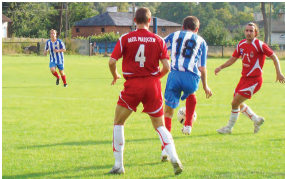
Mało brakowało, by piłkarze Stali Głowno wywalczyli jeden punkt w konfrontacji z wiceliderem piątej ligi Startem Brzeziny.

Podopieczni trenera Szadkowskiego osiągnęli przewagę,