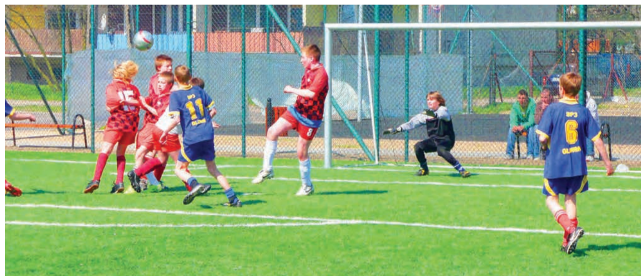
Gimnazjaliści z Głowna okazali się najlepsi podczas turnieju Coca-Cola Cup.