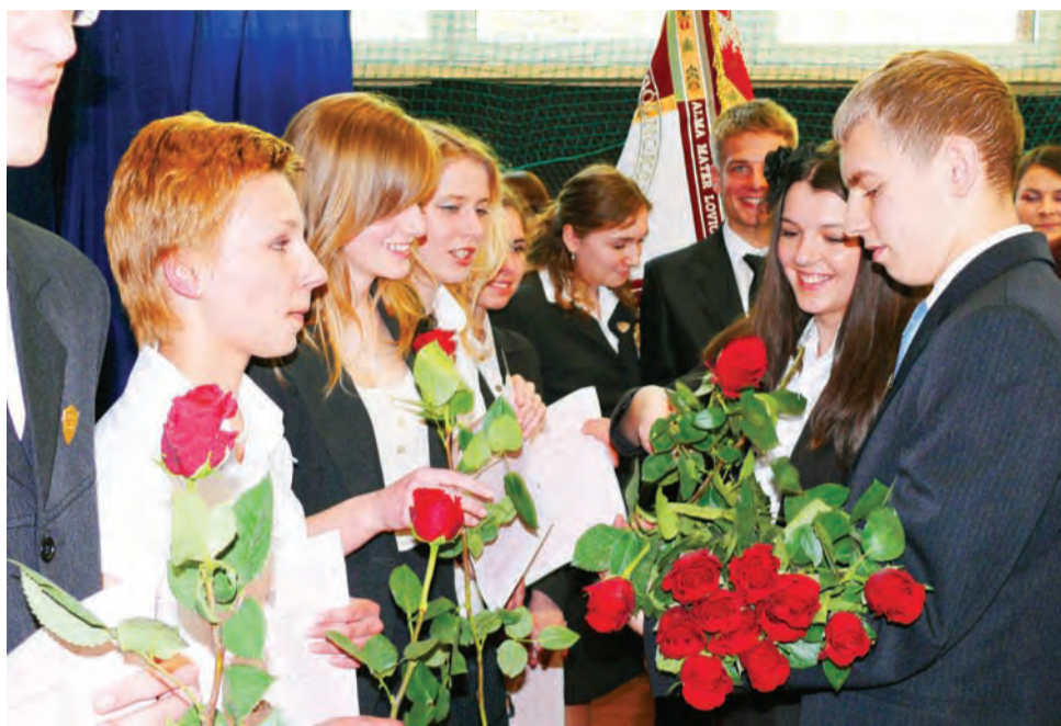
W I LO w Łowiczu wszyscy przyszli maturzyści otrzymali świadectwa oraz róże. Na zdjęciu klasa III humanistyczna.

I Liceum Ogólnokształcące tradycyjnie już, żegnając swoich maturzystów, wręczyło najlepszym uczniom nagrody, w tym