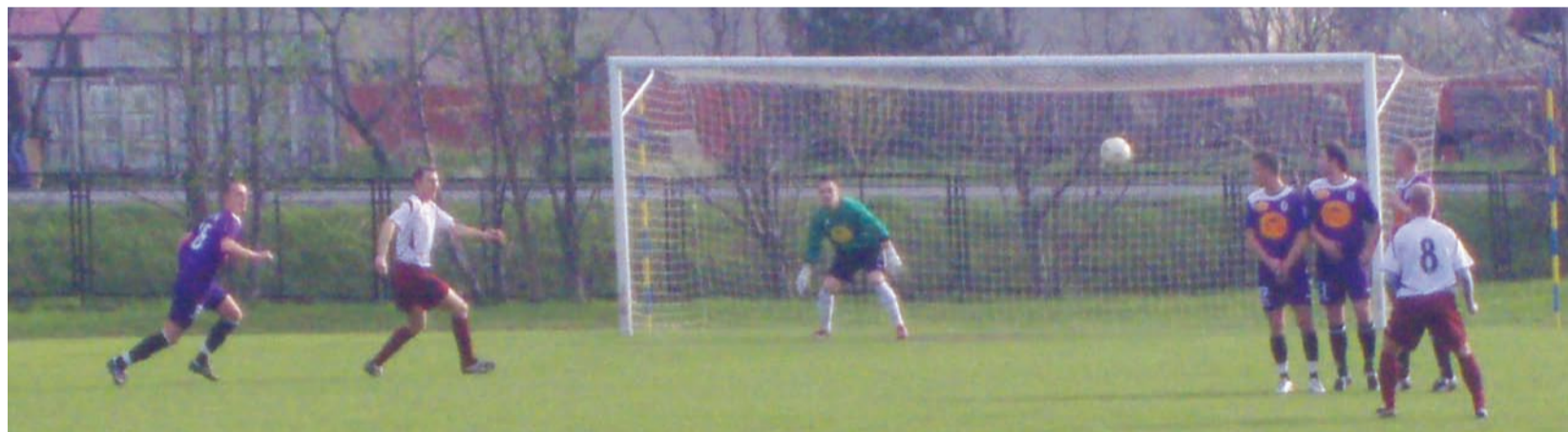
Piłkarze Zjednoczonych Stryków nie spisują się najlepiej w rundzie wiosennej czwartoligowych rozgrywek. Tym razem podopieczni trenera Tomasza Szcześniaka tylko zremisowali w Bukowcu Opoczyńskim, mimo że prowadzili na 30 minut przed końcem meczu 2:0.

Drużyna WOY-a podbudowana zwycięstwem pierwszej bramki uwierzyła, że w tym meczu nie wszystko jeszcze stracone. Ich wiara przerodziła się w rzeczywistość dość szybko. W 77 minucie mieliśmy już remis, a bramka na 2:2 padła po kombinacyjnej grze z szybkiego kontrataku. Zjednoczeni mogli ten mecz jeszcze przegrać, ale w 80 min. skórę zawodnikom ze Strykowa po raz kolejny uratował Śniady, nie dopuszczając do straty trzeciego gola. Widać, że strykowianie nie osiągnęły jeszcze wysokiej formy. Niestety kolejne punkty uciekły piłkarzom Zjednoczonych. ak, wp