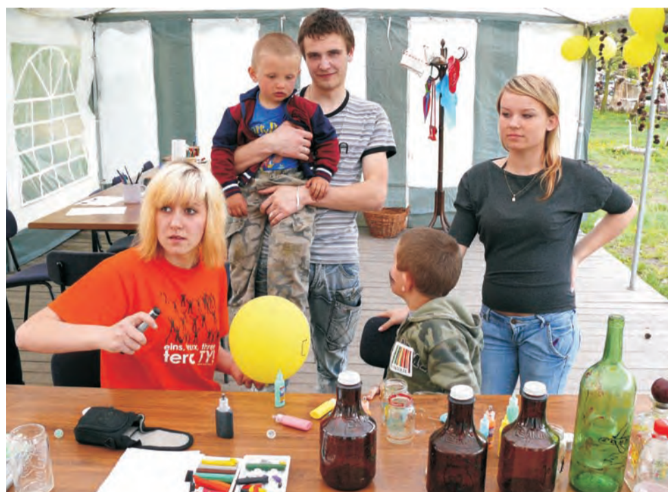
Wolontariusze ze szkoły w Zduńskiej Dąbrowie zajmowali się dziećmi od 10.00 do 19.00