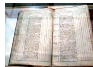
Księgi metrykalne zawierają m.in. akt urodzenia Chopina.