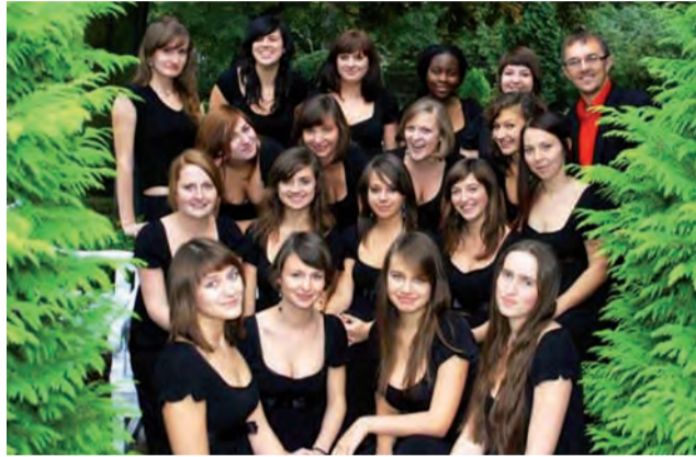
Koncert w muzeum. Oprócz chóru mieszanego wystąpi także chór żeński - „Presto”.