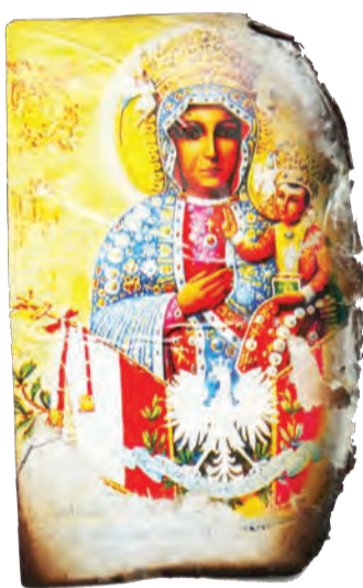
Ten znaleziony w ziemi obrazek należał do bp Tadeusza Płoskiego.