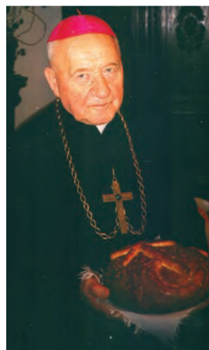
Z symbolicznym chlebem podczas ekumenicznego nabożeństwa w kościele św. Marcina w Warszawie – rok 1995.