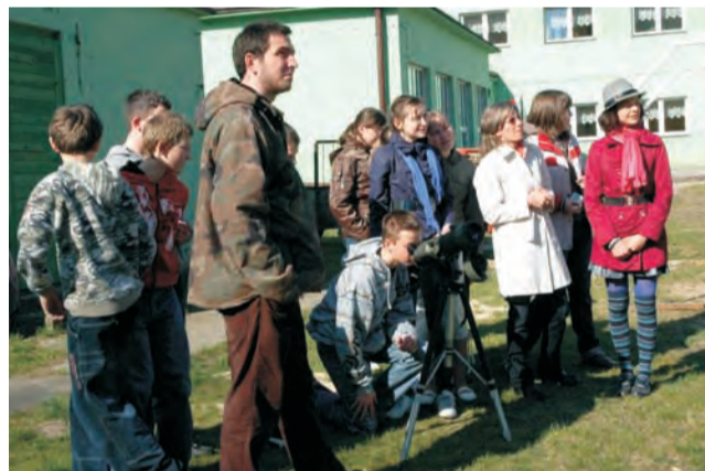
Uczniowie z Koźła wypróbowywali sprzęt do obserwacji ptaków.

Można było dowiedzieć się m.in. że nasza zwykła kura domowa tak naprawdę pochodzi z Azji, że kiluletnie gniazdo bociana może ważyć nawet kilka ton, a żaby wcale nie są jego przysmakiem i że je tylko w ostateczności, że czapla biała ma rozpiętość skrzydeł ok. 140-160 cm, a jej waga to zaledwie ok. 700-1600 g, że żuraw przedstawia najpiękniejsze spektakle godowe, a remiz buduje najbardziej zmysłne gniazda, że sowa uszata lata bezszelestnie – nawet gdy będzie leciała blisko naszej głowy, będziemy ją widzieć, ale nie będziemy słyszeć, że język ma tak specyficznie zbudowane nogi, że wszystkie 4 palce skierowane są do przodu, w końcu – że dzierzba, czyli jeden z najmniejszych ptasich drapieżników, buduje specyficzne spizarnie, a mianowicie nabija upolowane gryzonie, owady itp. na ciernie lub ostre gałązki. ljs