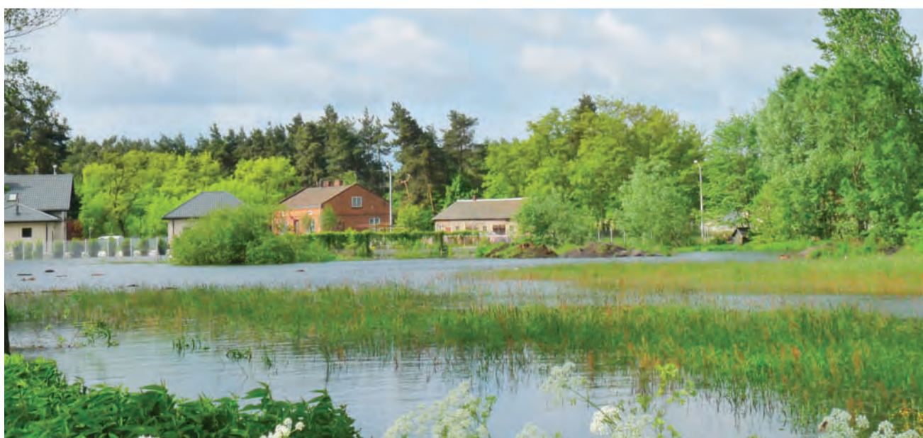
Otolice. Woda podeszła pod budynki mieszkalne i gospodarcze.