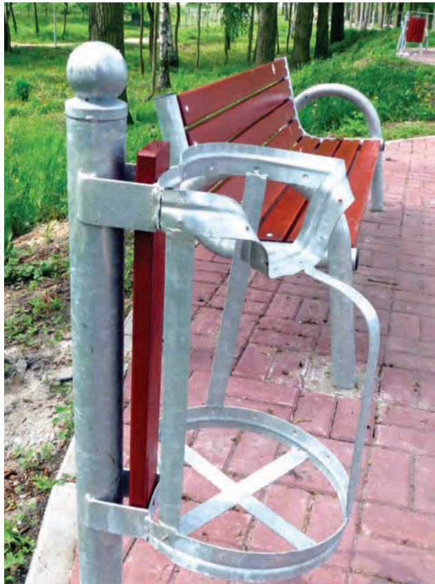
Wandale – nie da się ich upilnować, ale kamery na pewno pomogłyby utrzymać ich w ryzach.

Burmistrz, pytany przez nas kilkakrotnie, czy najniższe położone ścieżki zostaną podniesione – dotyczy to przede wszystkim wykonanej z kruszywa ścieżki wzdłuż wału – odpowiada, że nie jest to przewidziane. Dlaczego? – Tego się nie dowiedzieliśmy wprost, choć ze słów burmistrza wynika, że byłoby odstępstwo od projektu, a co za tym idzie ryzyko utra-