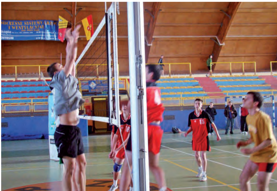
W Licealiadzie 2009/2010 szkolne reprezentacje szkół ponadgimnazjalnych naszego regionu dzielnie spisywali się podczas zawodów powiatowych i rejonowych. ZS nr 1 im Cebertowicza Głowno, LO Głowno oraz ZS nr 1 Bratoszewice po raz kolejny stanęły do szkolnej rywalizacji.

W mistrzostwach powiatu zgierskiego w piłce siatkowej w której szkoły z Ozorkowa są nadal po za zasięgiem w tej konkurencji, a chłopcy ZSZ przewyższają pozostałych o klasę jednocześnie zdobywając brązowy medal w finale wojewódzkim. Jednak i tutaj świetnie radzili sobie uczniowie z Głowna. Drużyna ZS nr 1 im Cebertowicza Głowno znalazła się w