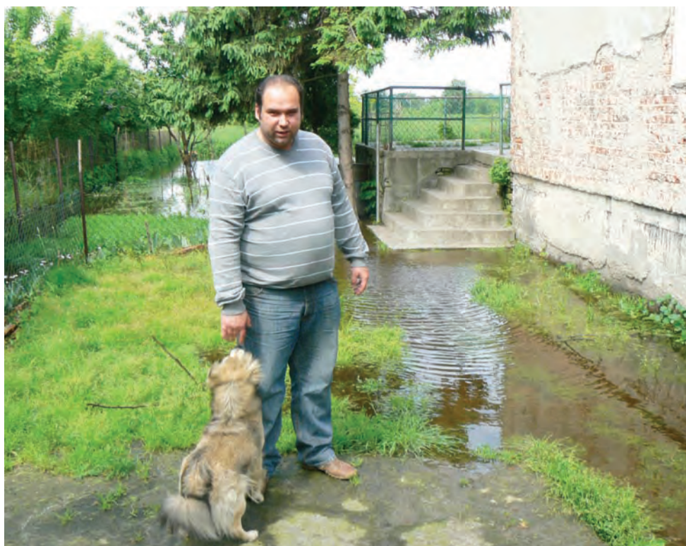
Zalane podwórze przy ul. Gdańskiej w Łowiczu w posesji Diowizosa Theodorokpoulos.