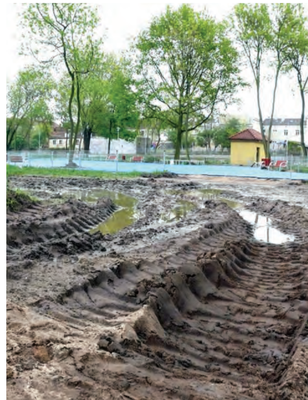
Ciężki sprzęt budowlany w czasie przygotowywania placów zabaw musiał dojeżdżać na miejsce przez wykonane wcześniej ścieżki.

Dodatkowo trzeba wziąć pod uwagę, że w tym miejscu dochodzi do przesiąkania wód wezbranej w czasie wiosny Bzury. Naczelnik Pełka przekonywał nas, że nie ma to większego znaczenia i jest to zjawisko marginalne. Wał powstał w czasie II wojny światowej i nie był remontowany na szerszą skalę. W czasie prac nawet nie brano pod uwagę usunięcia rosnących po obu jego stronach topól,