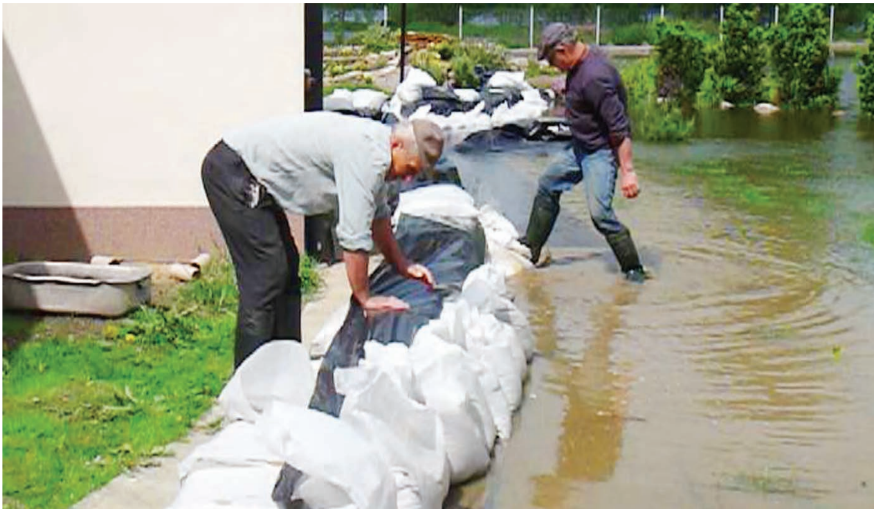
Wtorek, obrona zagrożonego podtopieniem domu w Otolicach za pomocą wału z worków z piaskiem.