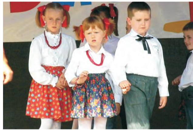
Dzieci z zerówki odtarńczyły kujawiaka.

Oprócz miasteczka drogowego, WORD ufundował także nagrody dla wszystkich uczniów, którzy z powodzeniem egzamin praktyczny na kartę rowerową udało się zdać. A udało się całej jedenastce. Otrzymali oni świadectwa odblaskowe, plany lekcji i miniaturowe samochodziki. Dla wielu uczniów bratoszewickiej szkoły uzyskanie karty rowerowej jest przepustką do tego, by właśnie na rowerze – zwłaszcza