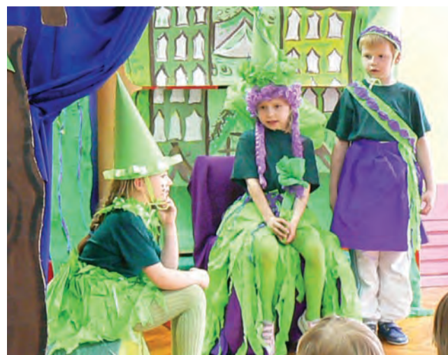
Skrzacie porady. Cennych rad dotyczących m.in. tego, żeby myć ręce, nie krzyknąć i nie marudzić, udzielała krasnalom leśna wróżka.