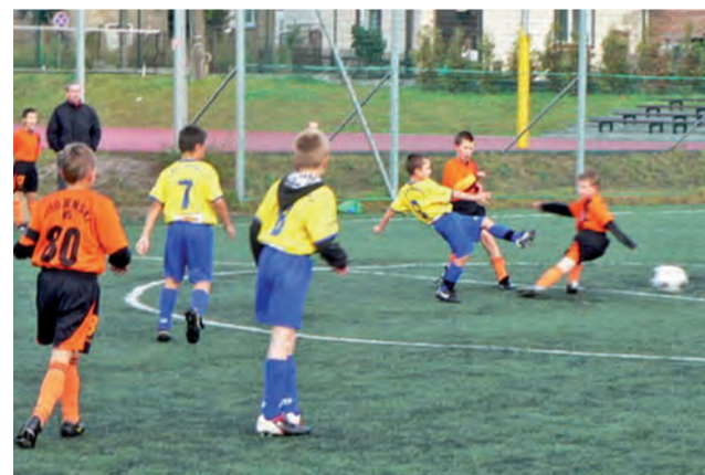
Strykowska młodzież nigdy się nie poddaje. W tygodniu w swoich ligach walczyli młodzi piłkarze klasy Deyna i Górski.