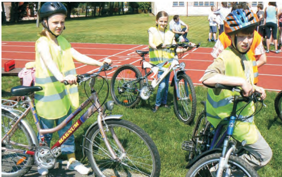
Tradycyjnie już w Dniu Bratoszewic odbył się egzamin na kartę rowerową.