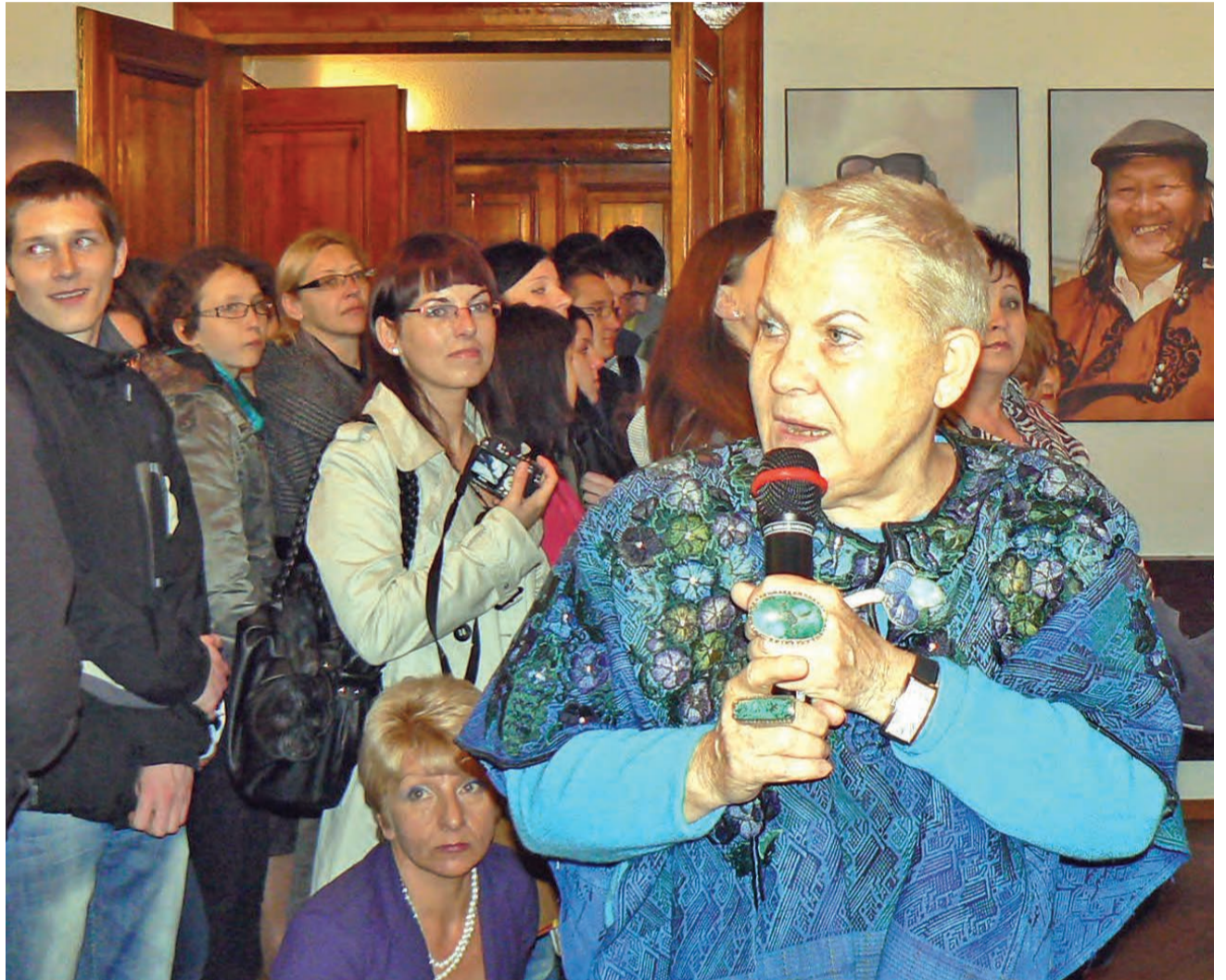
Na spotkaniu z podróżniczką było naprawdę tłoczno.

– Uśmiech jest portretem duszy. Można sobie poprawić humor patrząc na tych ludzi uśmiechniętych, chociaż pochodzących z krajów o wiele biedniejszych niż Polska – zachęcała podróżniczka, która zapelowała, byśmy uśmiechali się częściej, a mniej narzekali. Podkreśliła, że uśmiech to najkrótsza droga do serca drugiego człowieka. Przekonywała, że uśmiech upiększa, odmładza i regeneruje pamięć.