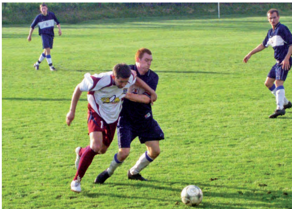
Piłkarze Zjednoczonych Stryków wydaje się, że mają kryzys formy poza sobą. Podopieczni trenera Tomasza Szcześniaka odnieśli trzecie kolejne zwycięstwo. Tym razem Zjednoczeni pokonali SMS Łódź 3:1.

Do przerwy strykowianie prowadzili zatem 3:0 wykazując się wysoką skutecznością, bo 3 spośród 4 celnych strza-