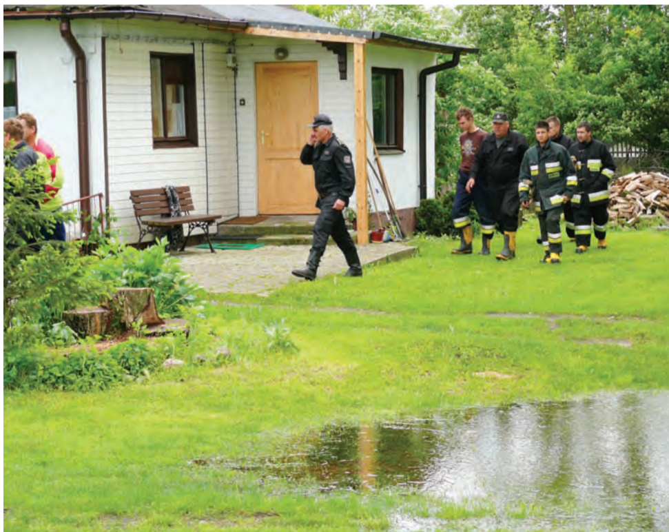
Strażacy dokonują oględzin jednego z domów na ulicy Wiatrakowej, do którego we wtorek niebezpiecznie zbliżała się woda.