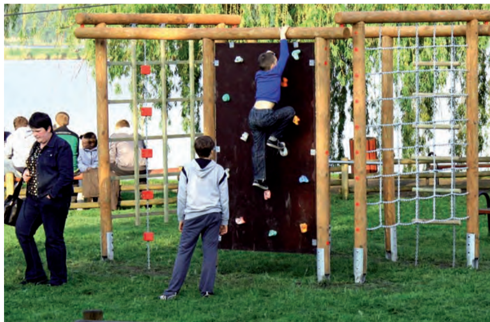
Od 18 maja dzieci korzystać mogą z nowych sprzętów zamontowanych na placu zabaw nad głowieńską Mroźyczką. Są to ścianki i drabinki do wspinaczki. Kosztowały miasto 11 tys. zł, a zamontowała je – tak jak poprzednie sprzęty placu zabaw – firma Fior z Kobierzyc w woj. dolnośląskim. rpm