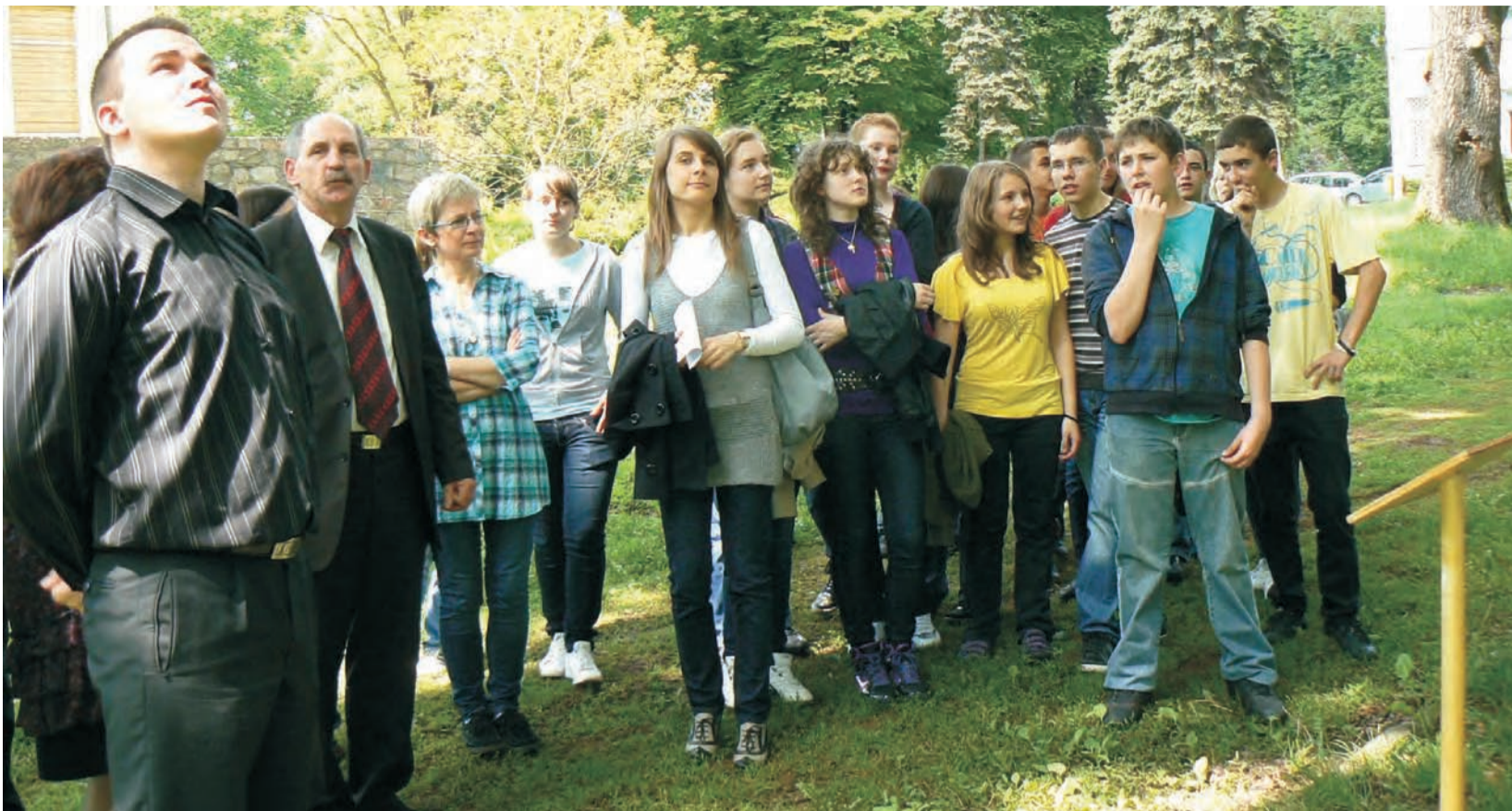
Jeden z pierwszych przystanków pod okazałym dębem, pomnikiem przyrody.

Dyrektorka szkoły na ławie oskarżonych. Miejski radny też. str. 12-13 oraz 17