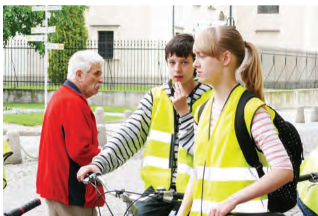
Uczniowie klas I-III Gimnazjum nr 2 przed startem.

francuskiej – przygotowany przez nauczycielki z pijarskiego liceum, w którym należało do znanego malarza dopasować nazwę obrazu. Po nim odbyło się przedstawienie „Królewna Śnieżka i siedmiu krasnoludków” w języku niemieckim i francuskim – będący adaptacją znanej baśni braci Grimm. Dzień zakończył się koncertem i pokazem menueta w wykonaniu licealistów. jr