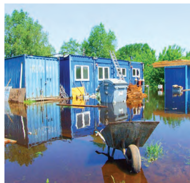
Zalane zaplecze budowy nowego mostu w Strugienicach.