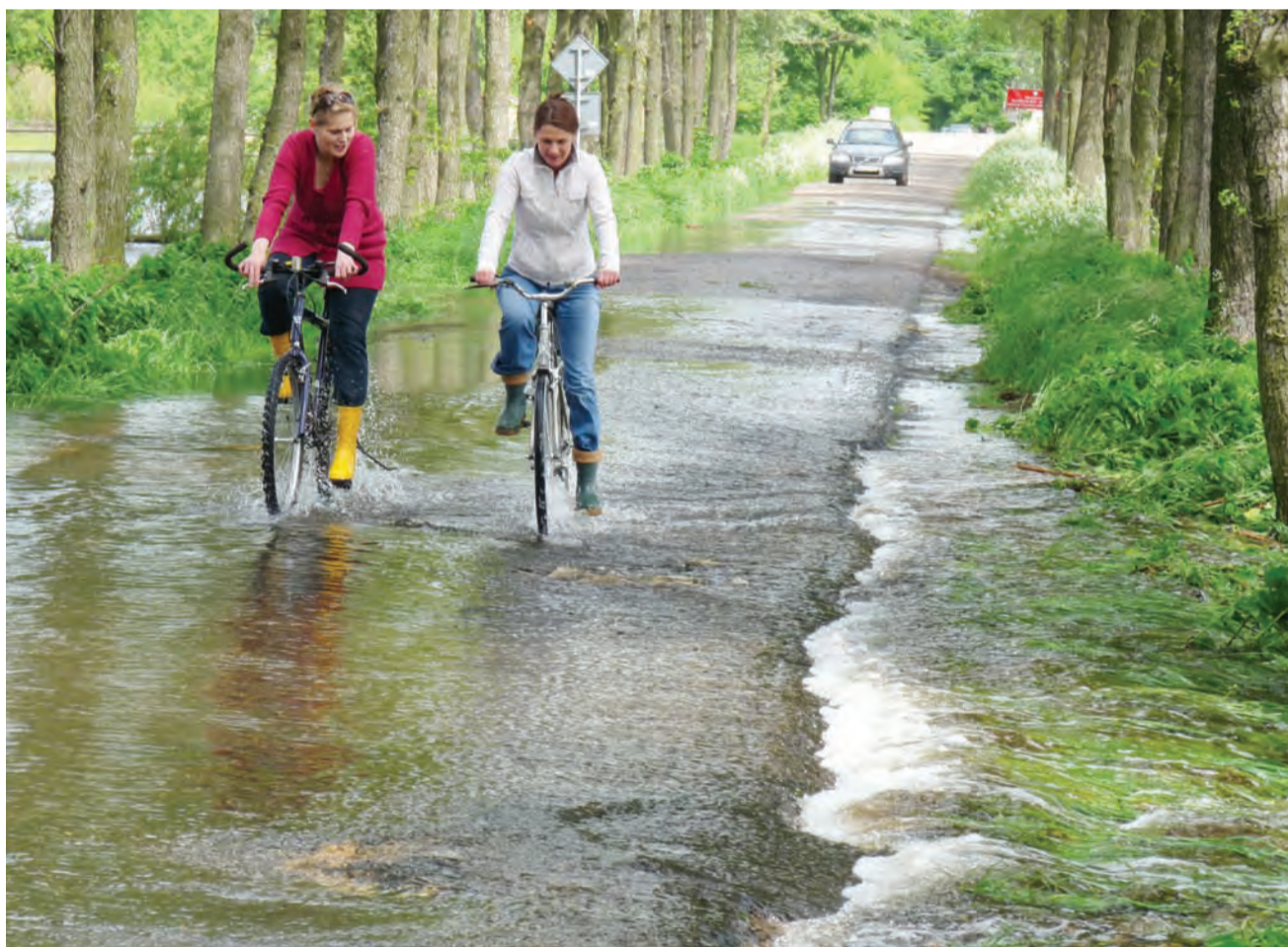
Wtorek przed południem. Woda bystrym nurtem przelewa się przez drogę z Otolic do Szczudłowa.