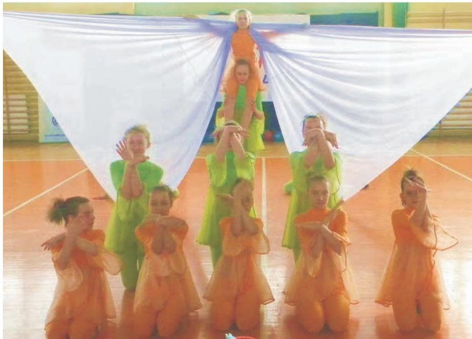
Zespół Gold I w układzie „Jak motyle”.