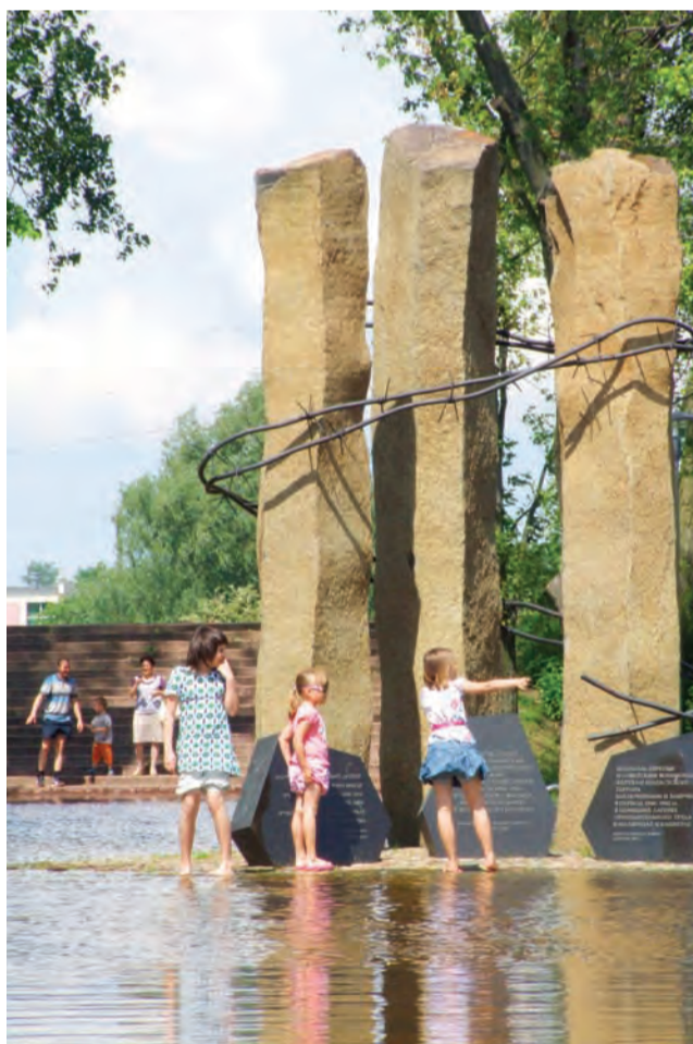
Centralny placyk na Błoniach całkowicie pod wodą.