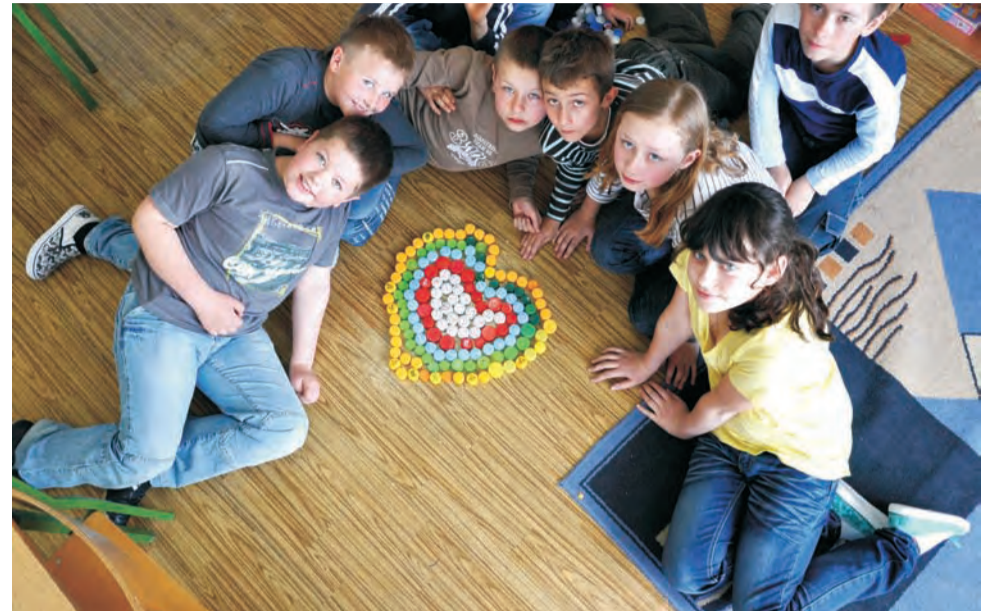
Projekt realizowany przez wolontariuszy ze strykowski SP2 znalazł się na liście 45 zwycięskich. IJS

i miłosierdziu, zbiórka dla schroniska zwierząt, czynny udział w WOŚP, zbiórka zabawek dla hospicjum, uczestnictwo w akcjach internetowych, pomoc ludziom starszym, pomoc dla ofiar trzęsienia ziemi w Haiti, zbiórka na misje, listy do dzieci nieuleczalnie chorych, korepetycje za uśmiech, trening obrony przed agresją, czytanie młodszym kolegom, klub nordic walking i wiele innych ciekawych przedsięwzięć. Większość z nich trwa nadal, bo uczniowie SP2 mówią, że zdążyli się uzależnić od pomagania. IJS