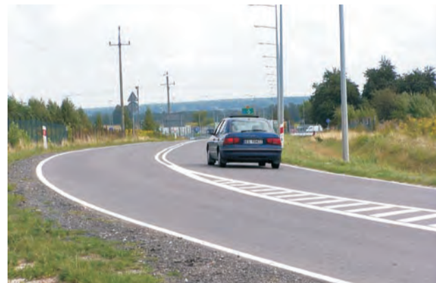
Mieszkańcy Sosnowca domagają się chodnika po prawej stronie widocznej na zdjęciu drogi dojazdowej do ronda. IJS

– Przecież to człowiekowi ręce opadają. Nie bardzo wierzę już ani w zapewnienia jednych, ani w tłumaczenia drugich. Logika wskazywała, że to powinno być zrobione od razu, bo chodzi o bezpieczeństwo ludzi.