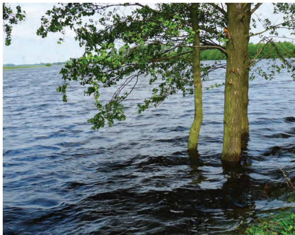
Woda zalała kilkaset hektarów. Tak wyglądały pola w Otolicach rano 25 maja.