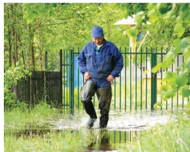
Pracownicy ZUK, musieli założyć wodery, aby sprawdzić, co dzieje się w zalanej przez wody Bzury przepompowni ścieków na Wiatrakowej.

Wielka powódź nas oszczędziła, nikt nie zginął, żaden dom nie został zalany tak, jak tego doświadczyło tylu mieszkańców innych rejonów Polski. Mimo to woda podeszła wysoko, zalała dziesiątki hektarów łąk i pól, przelewała się przez drogi. Jak wyglądały najbardziej zagrożone miejsca w Łowiczu i okolicy w minionych dniach, pokazują zdjęcia wykonane przez dziennikarzy NŁ i nadesłane przez naszych czytelników.