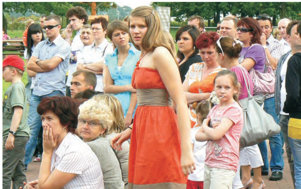
Na festyn przybyły całe rodziny.