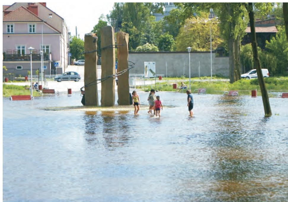
Woda na całym głównym placu parku, ławki zalane po siedziska... Uporanie się z wodą, zalewającą Błonia, stanowić będzie wielkie wyzwanie dla władz miasta. Inaczej co rok będziemy liczyć straty.