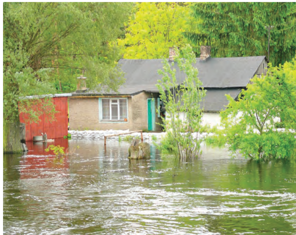
Ten dom zazwyczaj stoi 20 metrów od koryta rzeki poniżej mostu w Maurzycach, w niedzielę od rana strażacy z PSP i OSP obłożyli go workami z piaskiem, właściciele sami pompowali z wnętrza zbierającą się wodę.