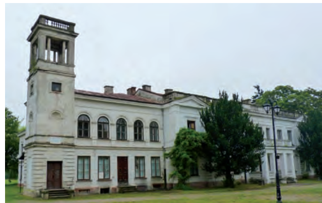
Pałac w Sannikach. Remont planowany w tym budynku ma przywrócić dawny blask tego obiektu.

W ramach projektu powstanie krąg taneczny przy muszli koncertowej, nagłośnienie tejże muszli, montaż ławek przy niej – 80 sztuk i w pozostałej części parku – 100 sztuk. Powstaną