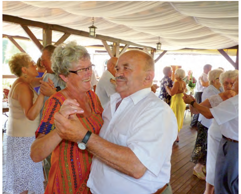
Na pikniku w Nieborowie. Tańce i biesiada, czyli dobra zabawa.

Na Pikniku Rodzinnym 21 sierpnia będzie można zobaczyć część efektów trwających obecnie zajęć. Wesele Sannickie i przedstawienie na podstawie tekstów młodego Witkiewicza. mwk