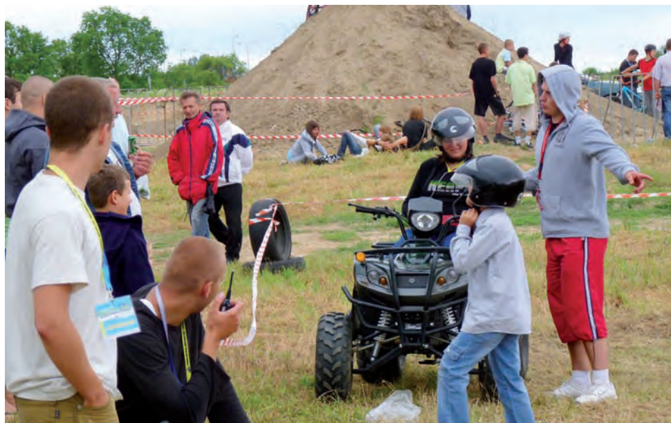
Tym razem z dmuchanymi zjeżdżalniami, trampolinami i przejażdżkami kucykiem wygrywały przejażdżki wozami terenowymi lub quadami.