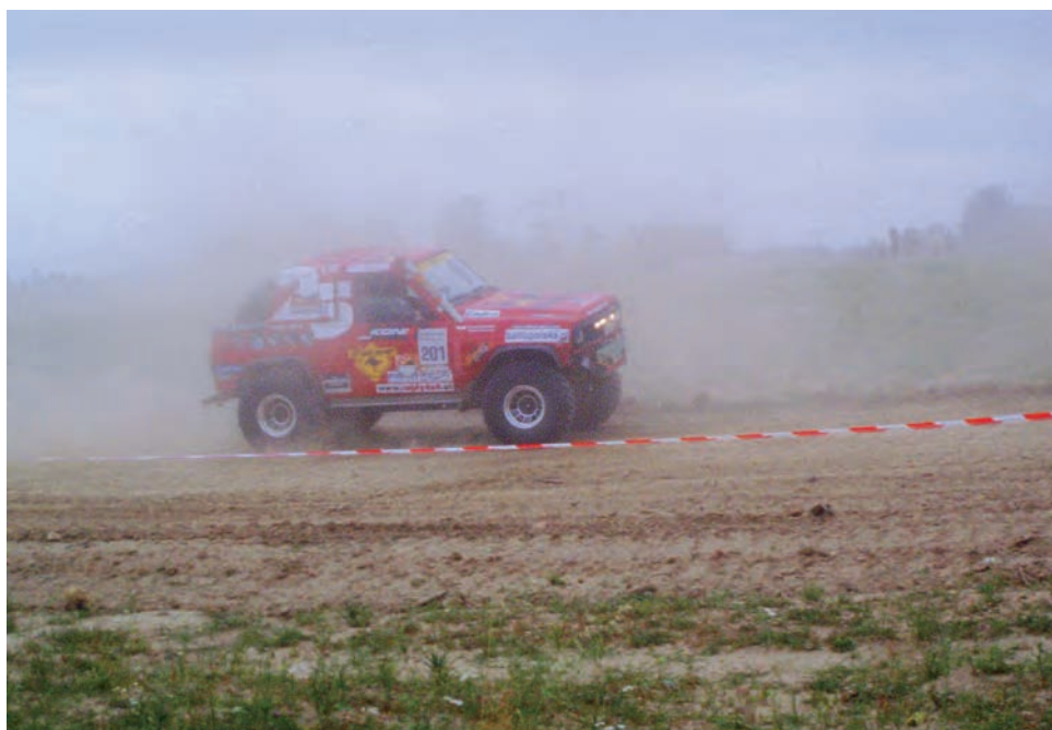
Widowiskowy rajd A2Cross zorganizowany w ramach Festiwalu „Marynarze Szos – Skrzyżowanie Stryków” był jedną z większych atrakcji imprezy.

Do rajdu zgłosiły się m.in. załogi z Łasku, Częstochowy, Zgierza i Łodzi. W sobotę 24 lipca od południa kierowcy przez 8 godzin mogli testować swoje auta, aby jak najlepiej przygotować się do niedzielnych zmagania. Dzień zawodów rozpoczął się o godz. 10 od przejazdu zapoznawczego kierowanego przez pilota. Później kierowcy rozpoczęli zmagania od pierwszego i drugiego OS-u, które były czasówką po torze motocrossowym. OS nr 3 i 4 rozgrywane były już poza tor, gdyż był to tzw. trial. Jesz-