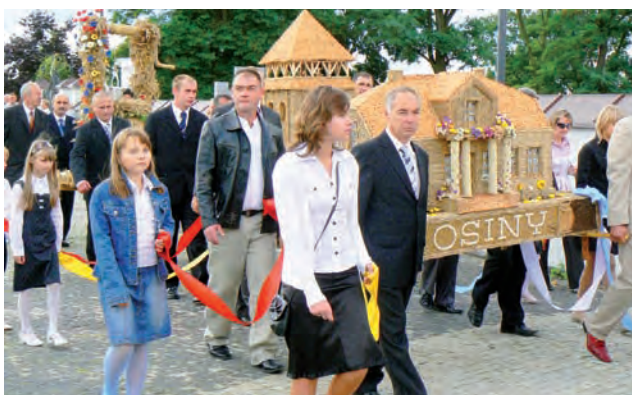
Korowód z wieńcami dożynkowymi. W naszym regionie działalność rolnicza i okołorolnicza stanowi podstawę utrzymania wielu rodzin. Warto wiedzieć, z jakiej pomocy można skorzystać.

W działaniu Korzystanie z usług doradczych przez rolników i posiadaczy lasów zmiany dotyczą m.in.: umożliwienia rolnikom skorzystania w 2010 r. z dodatkowych usług doradczych przed wydaniem ostatecznej decyzji o przyznaniu pomocy