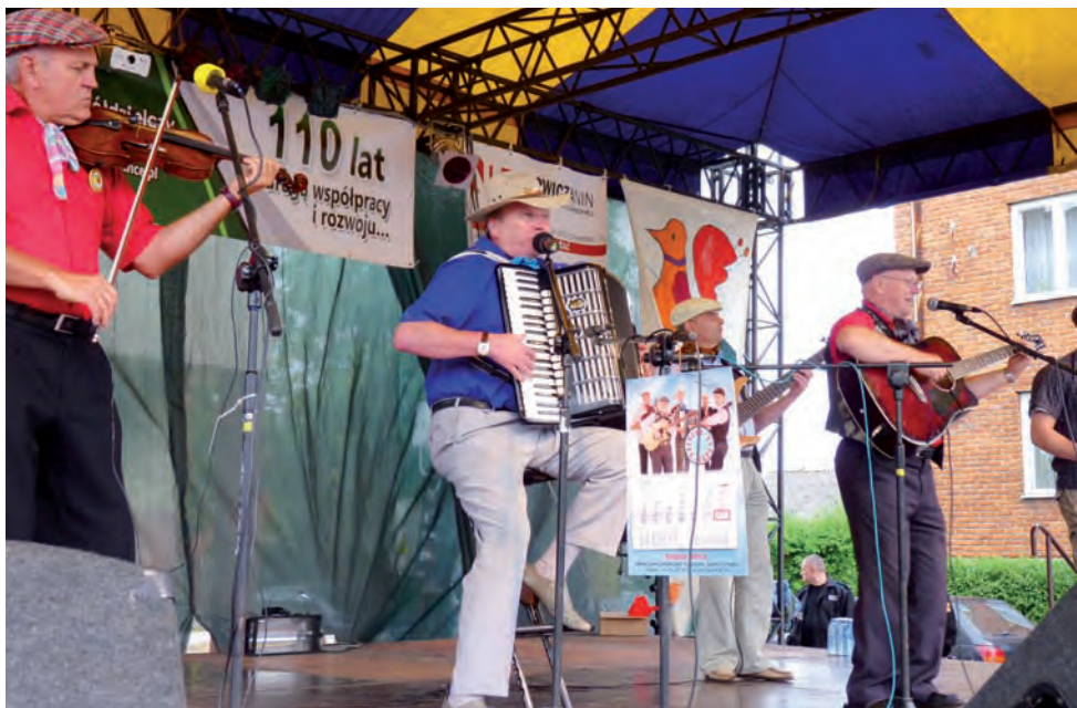
Bałucka Kapela Podwórkowa z Łodzi. Łódzkie piosenki rozruszały bolimowską publiczność.