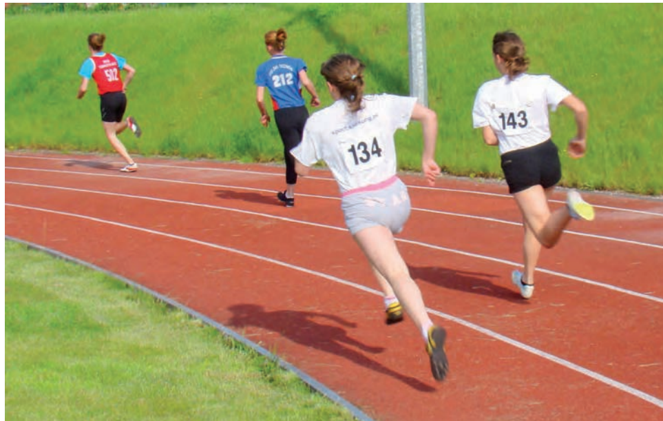
Tylko uczennice i uczniowie Szkoły Podstawowej nr 2 z Głowna znaleźli się w pierwszej dziesiątce rankingu sportowego Szkół Podstawowych za rok szkolny 2009/2010.

Z kolei na osiemnastym miejscu w sportowym rankingu zostali sklasyfikowani uczniowie i uczennice Szkoły Podstawowej z Mąkolic. Drużyna chłopców zajęła pierwsze miejsce w po-