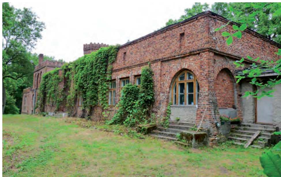
Zameczek w Sobocie. Jego historia sięga aż XV wieku.

Tego dnia zostanie w głównym kościele odprawiona także „normalna” msza o godzinie 9.00 przez proboszcza z Soboty. – Koło kościoła z pewnością też pojawią się kramy, ale nie przewidujemy jakiegokolwiek jarmarku – dodaje proboszcz z Soboty.