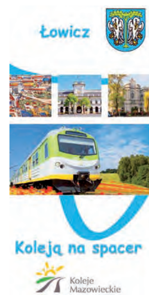
Ulotkę przygotowała spółka Koleje Mazowieckie we współpracy z miastem.

Ulotki są dostępne od 16 lipca do 19 września w kasach Kolei Mazowieckich na stacjach