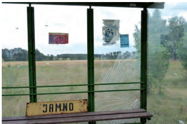
Przystanek w Jamnie. Widać, że szyba została celowo zniszczona. Kto za to zapłaci?

– Nie mam już siły przeznaczać kolejnych pieniędzy na inwestycje, którą już wykonałem – dodaje Barylski. – Ale ostatecznie znowu naprawimy, by przystanek miał wszystkie szyby całe. Pytanie na jak długo to starczy? jr