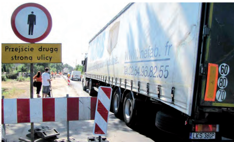
Remontowe utrudnienia na drodze wojewódzkiej nr 708 na odcinku Niesułek - Brzeziny.

Dla pojazdów o dopuszczalnej masie całkowitej, nie przekraczającej 3,5 tony, wyznaczono objazd następującymi ulicami Brzezin: Kościuszki (DK 72), 1 Maja, Piłsudskiego, Św. Anny, Reformacką (DK 72), Sienkiewicza (DK 72), Modrzewskiego (DW 704), Wojska Polskiego (DW 704), Skłodowskiej-Curie i Kilińskiego.