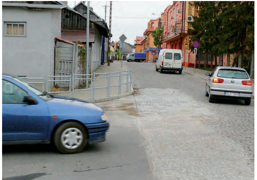
Na zdjęciu widoczny ślad, gdzie wymieniono już kostkę. Wkrótce cała ul. św. Floriana będzie tak poprawiona.

Od wtorku 3 sierpnia ulica św. Floriana w Łowiczu zostanie najprawdopodobniej zamknięta dla ruchu samochodowego na okres nawet tygodnia.