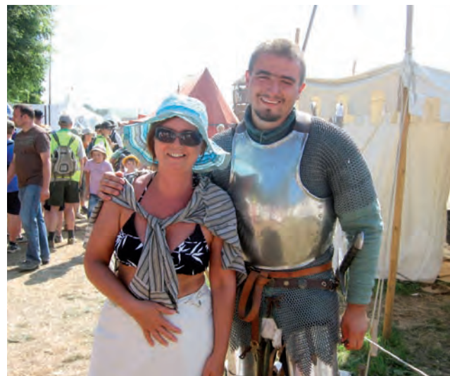
Strykowskie białogłowy chętnie fotografowały się z męznymi rycerzami.

Na ostatni dzwonek – Zaniepokojeni napływającymi z mediów wieściami o coraz większym zainteresowa-