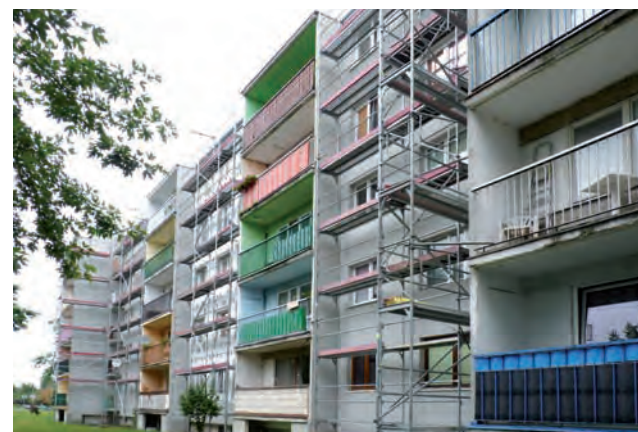
Aktualnie trwa docieplenie elewacji balkonowej bloku.