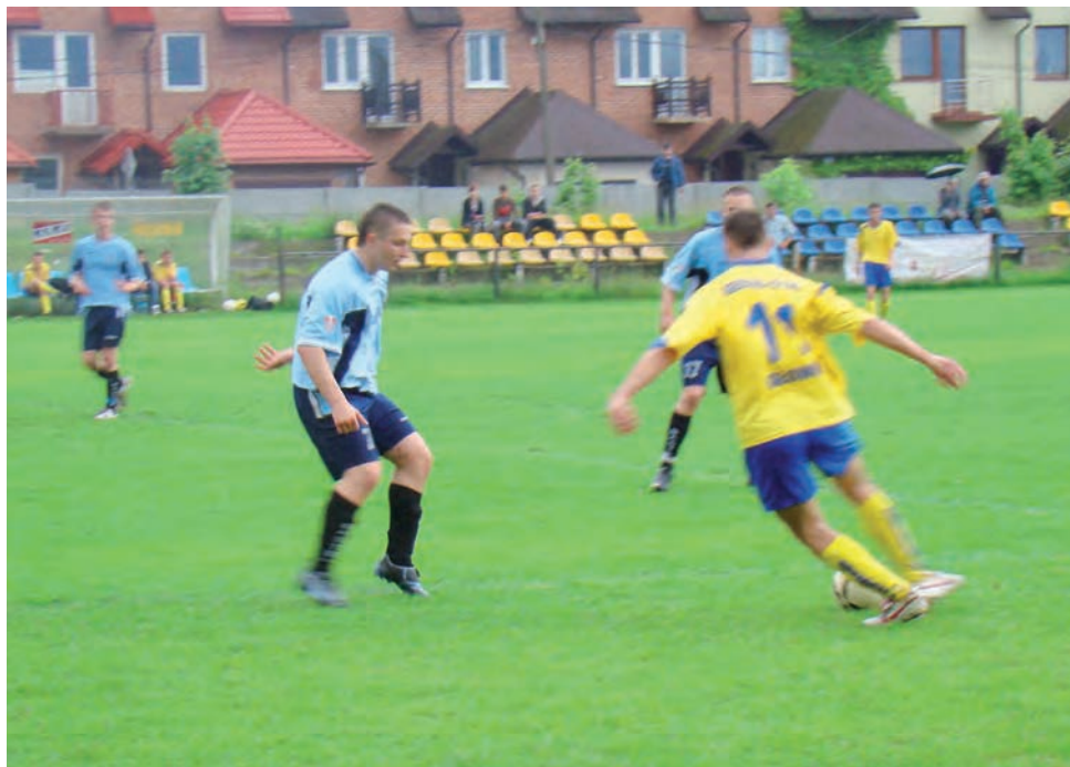
Piłkarze Stali Główno w rundzie wiosennej odnieśli 12 zwycięstw, dzięki czemu szybko opuścili strefę spadkową i ostatecznie zajęli dziewiąte miejsce w końcowej tabeli V ligi.

Także „włókniarze” zanotowali najmniej porażek, bo tylko 4. W 22 meczach triumfowali piłkarze wicelidera PTC Pabianice, a oprócz zgierzan najrzadziej schodzili z boiska pokonani gracze LKS-u Różyca, którzy doznali sześciu porażek. Z kolei 21 razy wygrywali piłkarze Startu Brzeziny, dla których był to kolejny przegrany sezon w wal-