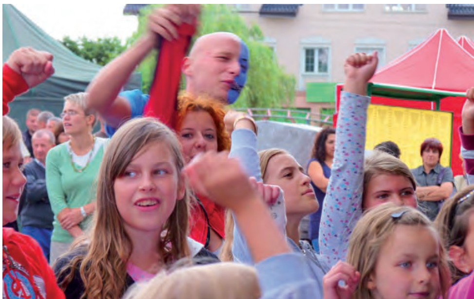
Dzieci i młodzież z ochotą uczestniczyli w zabawach aranzowanych przez Teatr Małgo z Krakowa w ramach przygotowanego programu estradowego „Bajkowy przekładaniec”.