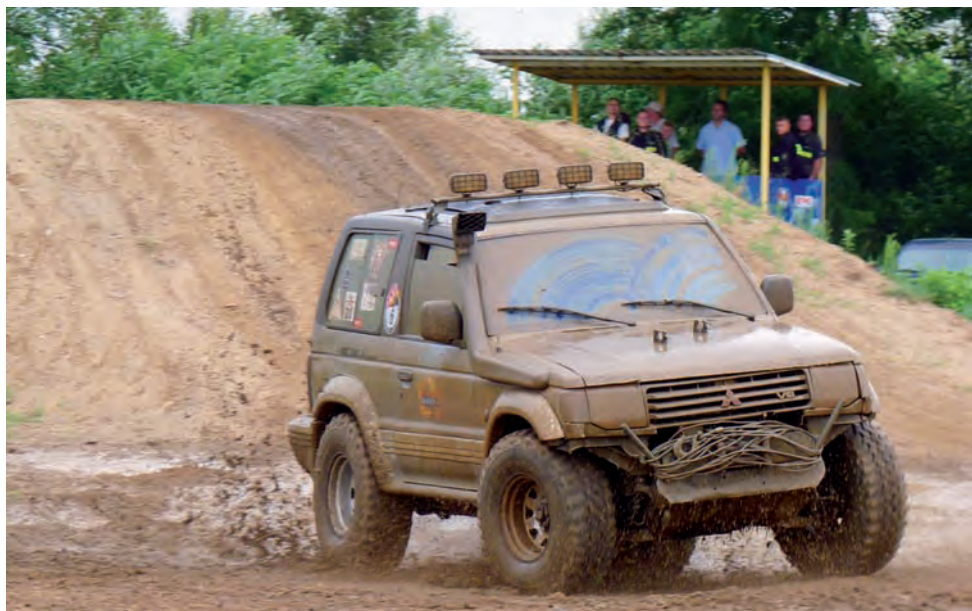
Już w sobotę na torze motocrossowym śledzić można było przygotowania do niedzielnego Rajdu A2 Cross. Więcej na jego temat piszemy w oddzielnym materiale na str. 37.