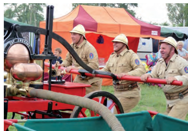
Strażacy ochotnicy ze Sworawy pod Poddębicami zaprezentowali próbkę XIX-wiecznej akcji gaśniczej z wykorzystaniem zabytkowej i wciąż sprawnej sikawki konnej. Druhowie wystąpili w mundurach z tamtej epoki.

Adrenalinę podnosiły także eskapady na torze przygotowanym przez dealera samochodów marki Jeep, Chrysler, Dodge i Suzuki, firmę Autotraper. Zawodowi kierowcy pokazywali, jak poradzić sobie z niemal pionowym wjazdem i zjazdem czterotonowego auta. Z takiej