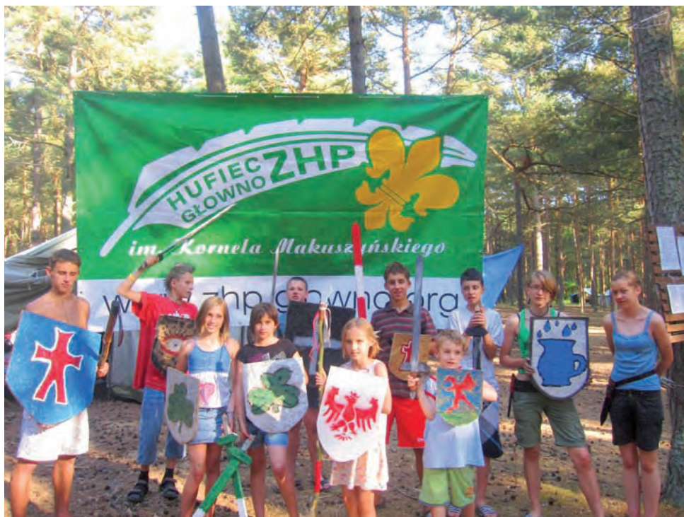
Obozowe życie głownian tym razem nawiązywało do 600-lecia Bitwy pod Grunwaldem. Stąd też i widoczne na zdjęciu rycerskie atrybuty.

Tyle wspomnień o Grunwaldzie. Nie zabrakło wycieczek do Darłowa i Darłówka. Wizyta w Aquaparku szczególnie wrażenie zrobiła na młodzieży z Rosji i Ukrainy. Zjeżdżałnie różnej długości, jacuzzi, bieżnie wodne, rzeka z rwącym prądem oraz basen o wymiarach