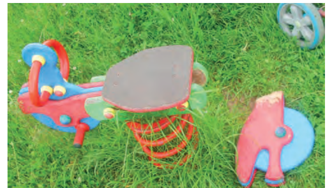
Połamane zabawki, tyle zostało z placu zabaw na os. Kopernika.

ców przeznaczyło je na: budowę chodnika wzdłuż ul. Kopernika I etap – 19.430,30 zł, zakup ławek (400 zł) i koszy na śmieci (1.100 zł) na ul. Kopernika – razem 1.500 zł oraz zakup sprzętu i doposażenie z utrzymaniem placu zabaw – 6.500 zł. tjs