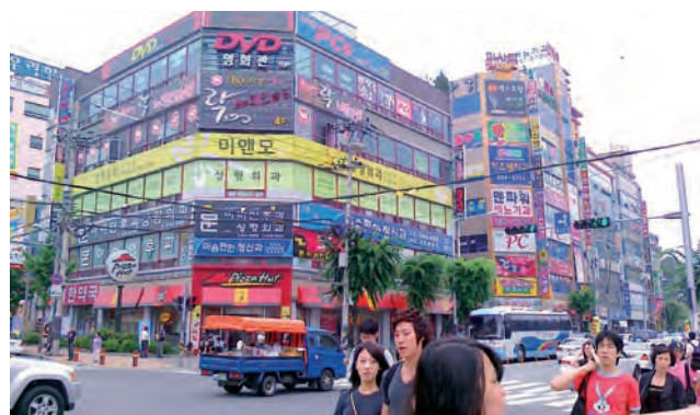
Centrum Cheongju. Kolorowo, egzotycznie, ale przede wszystkim bardzo nowoczesnie.