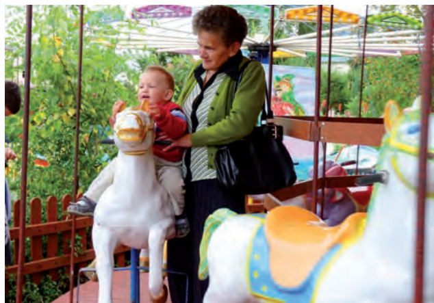
Karuzela z konikami. Wśród najmłodszych uczestników zabawy to ona cieszyła się największą popularnością.

Na koniec zagrał skierniewicki zespół Drugi Tydzień, który publiczność zachęcał do wspólnej zabawy coverami polskich i zagranicznych przebojów muzyki pop i dance. Dni Bolimowa zdążyły zakończyć się przed opadami deszczu, kilkanaście minut przed północą. jr