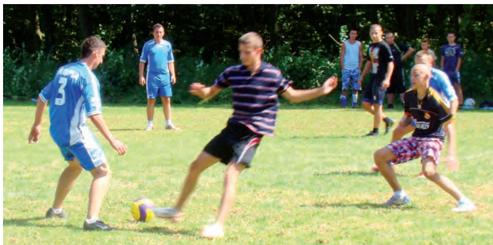
Pędzące Żółwie i strykowski LUKS Dwójka okazały się najlepsze podczas piłkarskich mistrzostw gminy Stryków w ubiegłym roku.

W poprzednim sezonie także na boisku w Dobieszkwie odbyły się mistrzostwa Gminy Stryków w piłce nożnej sześciuosobowej. Wtedy w szranki stanęli piłkarze seniorzy i młodzicy, a rozgrywki rozgrywane były oczywiście w dwóch osobnych turniejach. Do zawodów, w którym rywalizowali młodzicy zgłosiło się osiem zespołów, jednak ostatecznie w niedzielnych spotkaniach rywalizowało sześć ekip (z udziału w zawodach ostatecznie zrezygnowali młodsi piłkarze z Bratoszewic i Dobieszkowa). Po meczach eliminacyjnych do półfinałów awansowali piłkarze LKS-u Wysokoki, Olimpii Tymianka, Huraganu Swędów i Pędzących Żół-