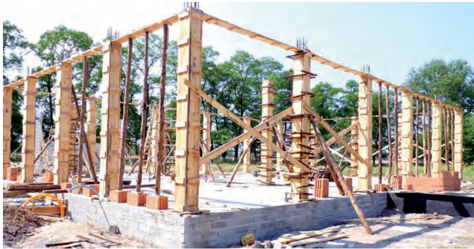
Budowa w Ciołku. Już w listopadzie to będzie świetlica wiejska.

W związku z modernizacją sieci energetycznej, dziś, 29 lipca, bez prądu w godzinach od 8.00 do 14.00 pozostawać będą mieszkańcy bloków nr 1,2,45 i 6 na osiedlu Swoboda w Głownie, a jutro, 30 lipca, mieszkańcy bloku nr 3 na tym samym osiedlu. Od poniedziałku 2 sierpnia do piątku 6 sierpnia w podobnej sytuacji znajdą się mieszkańcy posesji położonych przy ul. Swoboda od numeru 1 do 33 oraz mieszkańcy ul. Wodnej. rpm