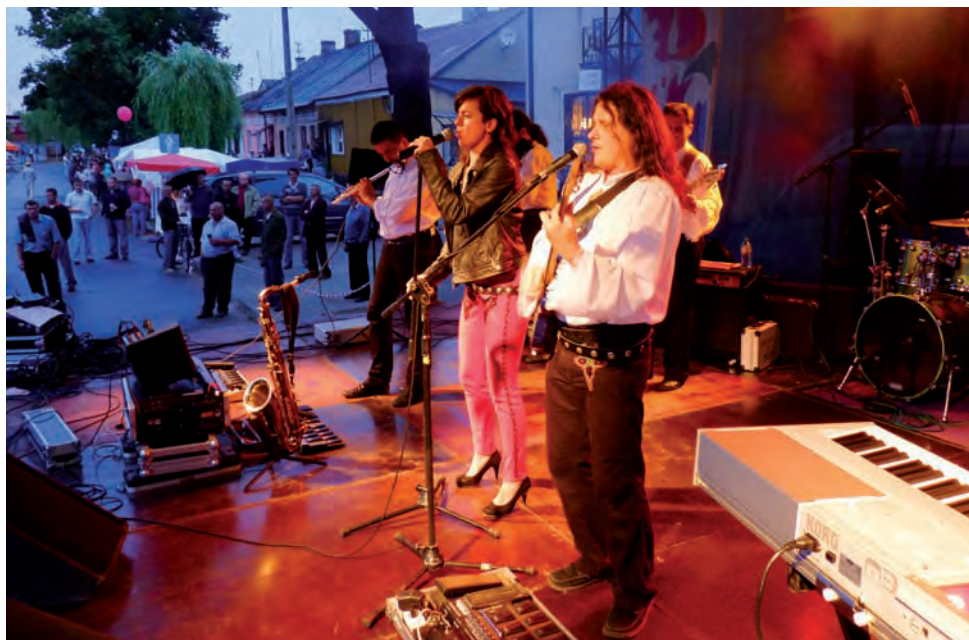
Turnioki udowodniły, że nawet deszcz nie może przeszkodzić muzyce folkowej.