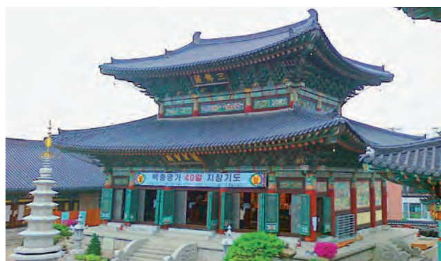
Kamil dużo zwiedzał. W Korei bardzo podobało mu się typowe stare budownictwo – tu jedna ze świątyń.