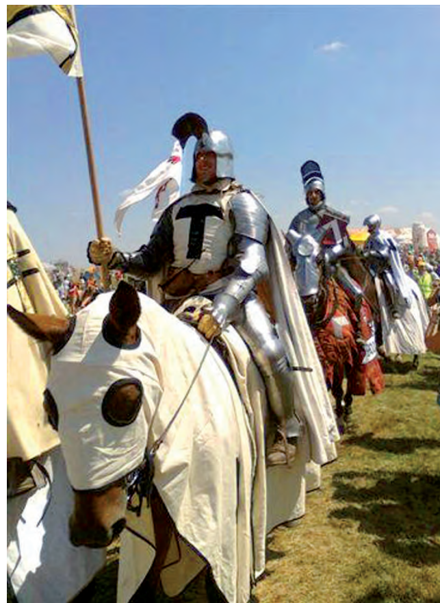
Zbrojni Wielkiego Mistrza Zakonu Krzyżackiego.