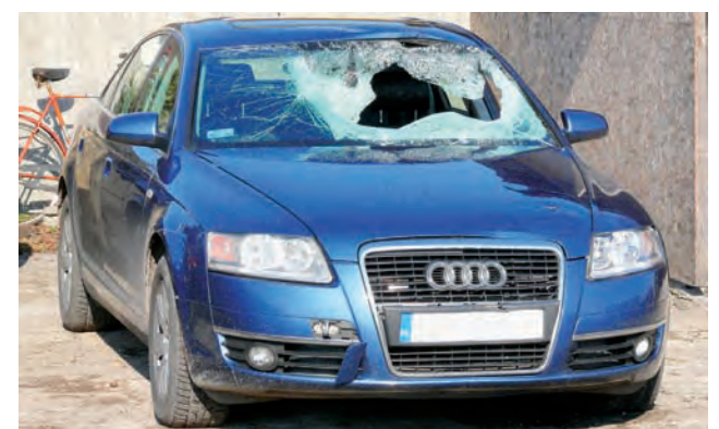
Audi, które uczestniczyło w wypadku w Brodnym, miało wybitą szybę i wgnieciony dach.

Ustalono, że samochód przed wypadkiem był sprawny technicznie, a obydwoj uczestnicy