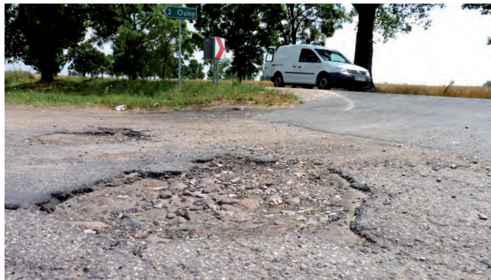
Zjazd na Osiny. Dwie dziury na głębokości kilku centymetrów stwarzają poważne zagrożenie dla bezpieczeństwa kierowców.

– Obiecuję, że w najbliższym czasie naprawimy wskazane