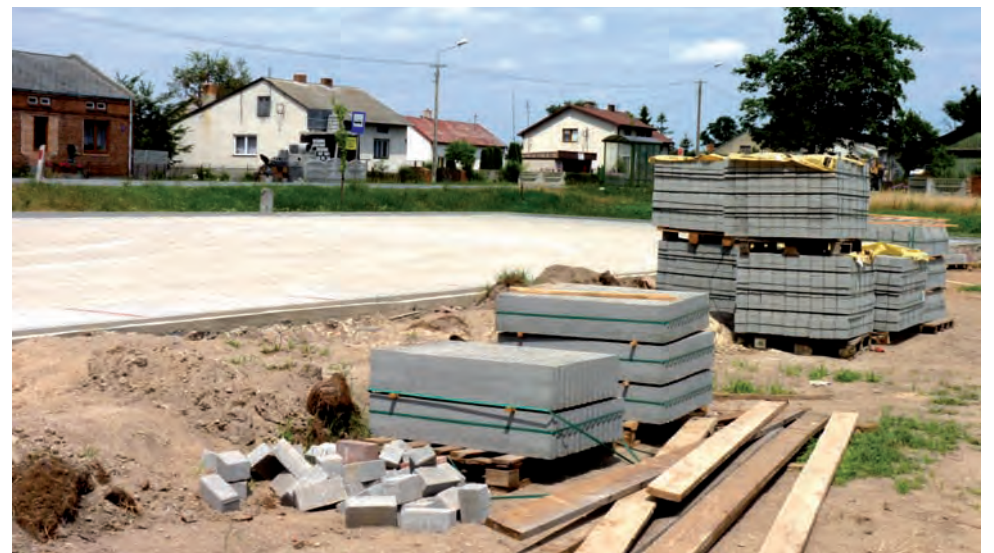
Parking widać bardzo dobrze z drogi nr 14. Blisko niej będzie znajdował się cały kompleks.

Łączny koszt budowy kompleksu sportowego to ponad 1 milion 115 tys. zł. jr