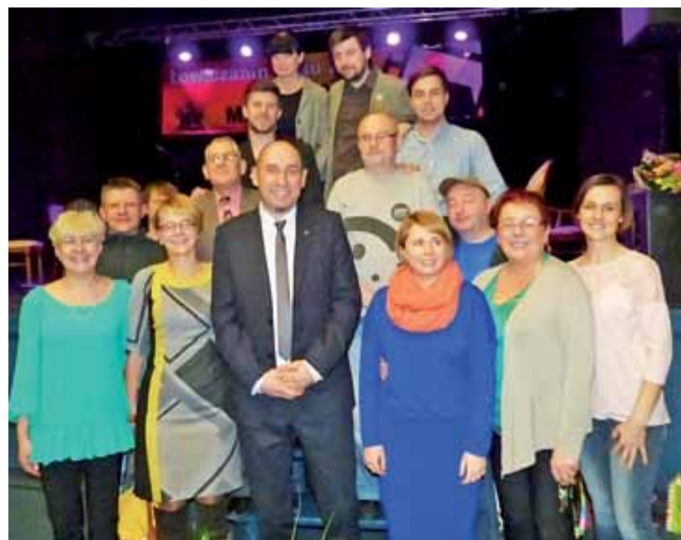
Ekipa ŁOK w komplecie. Nie mogło być inaczej. Każdy tego dnia chciał być w kinie, aby osobiście cieszyć się z uhonorowania szefa. Każdy z nich ma swój wkład w jego sukces.