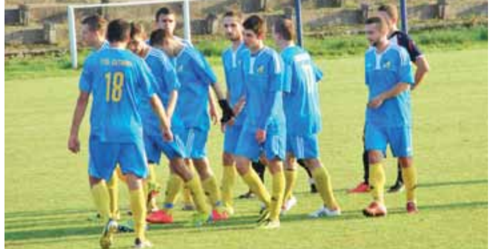
Drużyna Stali Głowno ma zamiar powalczyć o upragniony awans do IV ligi.