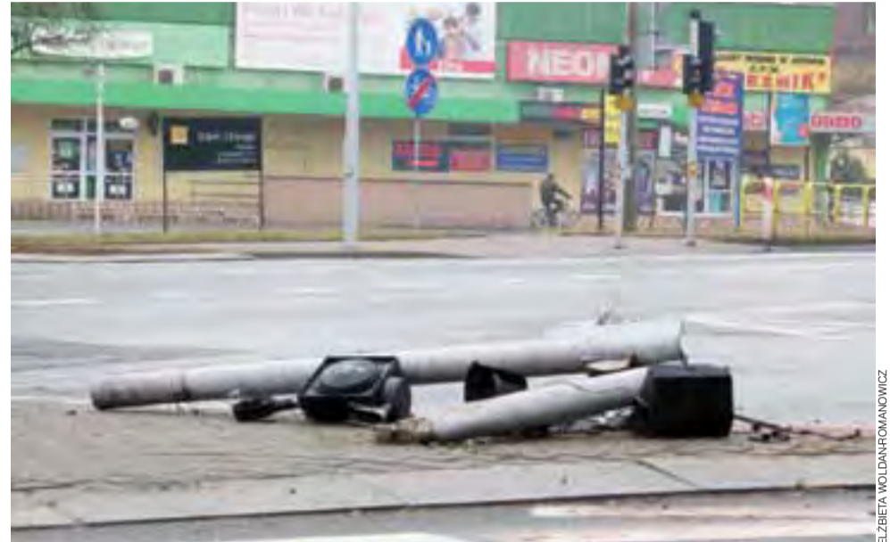
Głowno, 1 stycznia 2015. Skasowany sygnalizator na skrzyżowaniu Sikorskiego z krajową 14-stką.

7 stycznia oficer prasowy KPP w Zgierzu, Liliana Garczyńska, poinformowała nas, że ustalono, iż Hondaiem w chwili zdarzenia kierował 17-latek bez uprawnień. W organizmie miał około 2 promili alkoholu. ewr