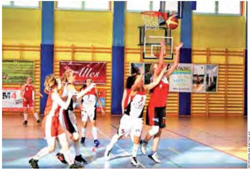
Młode koszykarki TK Alles Głowno (białe stroje) zagrają.