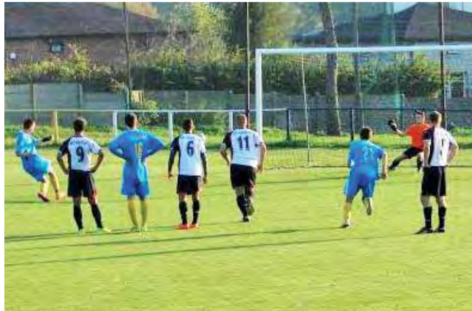
Piłkarze Stali Głowno (niebieskie stroje) znajdują się w dogodnej pozycji do ataku o najwyższe cele.