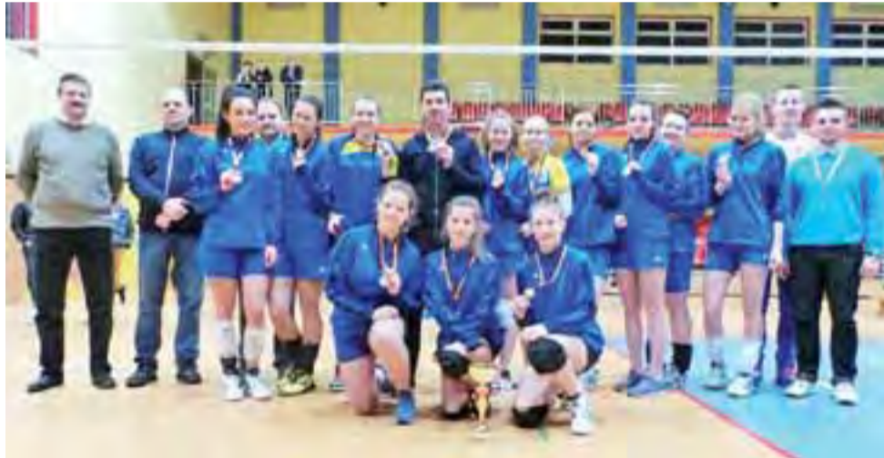
Drużyna siatkarek z Głowna dumnie prezentuje puchar i medale za drugie miejsce, które Stalówki zdobyły w tegorocznej imprezie.

dze są tuż przed głowniankami, na 2. miejscu z zaledwie 1 pkt. przewagi. O tym, że zmagania turniejowe rządzą się swoimi prawami dobitnie świadczy postawa Energii Pabianice. Drużyna, która spośród czwórki uczestników była najniżej notowana od początku rywalizacji w Głownie prezentowała fantastyczną siatkówkę. Pabianiczanki w swoim pierwszym spotkaniu nie dały szans ŁKS Głuchych, gromiąc w każdym z dwóch setów. W następnej kolejce spotkań kolejne zwycięstwa odniosły Stal i Energia, zgodnie wygrywając po 2:0, dzięki czemu jasne stało się, że te dwie drużyny w decydującym starciu powalczą o 1. miejsce w Turnieju. O 3. miejscu zadecydował pojedynek łódzkich ekip Salos Wodna i ŁKS Głuchych. Lepsze były łodzianki z Salos, które po tie-breaku zapewniły sobie zwycięstwo w meczu