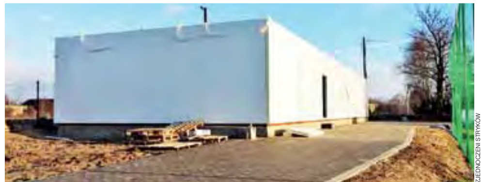
Nowy budynek na obiekcie Zjednoczonych Stryków zostanie oddany do użytku na wiosnę.

kowie kibice mogą zauważyć już w części północnej nowy budynek z szatniami dla piłkarzy, sędziów oraz pomieszczeniami socjalnymi. W tej chwili prace są na etapie robót wewnątrz budynku i ocenia się je na 60% wykończenia całości. Do zrobienia jest jeszcze wstawienie okien i wyposażenie wnętrza. Budynek ma zostać oddany do użytku na przełomie marca i kwietnia. Po przeniesieniu w nowe miejsce, dotychczasowy i wysłużony już budynek będzie zburzony. wp