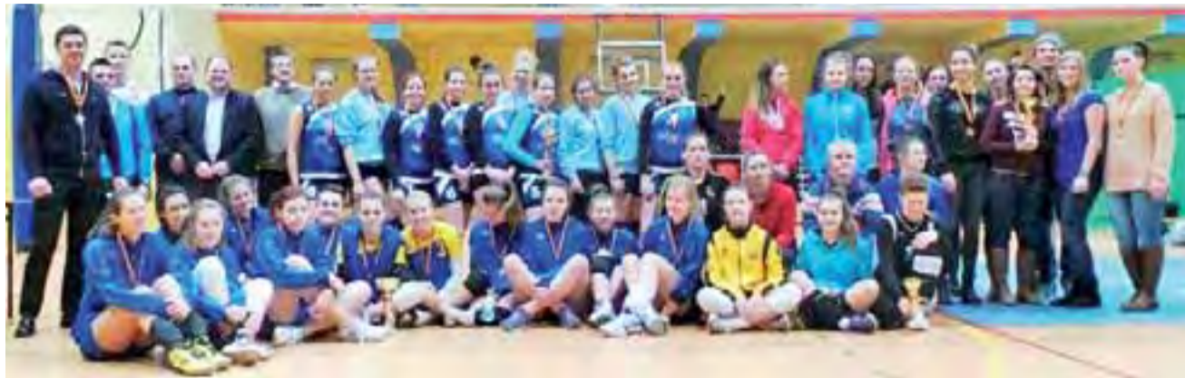
Uczestnicy II Noworocznego Turnieju Siatkówki w Głownie zgodnie przyznali, że chętnie wrócą do Hali Sportowo-Widowskiej przy ul. Andersa 37 także w przyszłym roku.

W turnieju obowiązywał system każdy z każdym do dwóch wygranych setów. W spotkaniu inauguracyjnym zawody gospodynie Stal Głowno pewnie pokonały Salos Wodna Łódź 2:0, w obu setach prezentując efektowną grę w ataku i obronie. Warto dodać, że łodzianki w li-