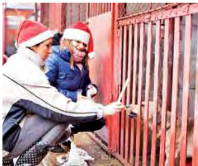
Mikołaj u czworonogów. Finał akcji „Paczka dla zwierczaka” w przytulisku w Głownie.

Orszak to nie jest dobry pomysł, to jest nawet bardzo dobry pomysł. Przede wszystkim ze względu na dzieci, które później inaczej na to wszystko spojrzę.