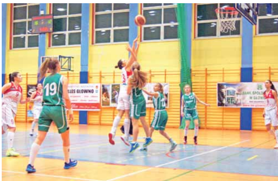
Głowieńskie koszykarki TK Alles (białe stroje) grają niesamowicie w tym sezonie. Przekonały się ostatnio o tym zawodniczki z SMS-u Łomianki, które nie tak wyobrażały sobie początek finałów strefy.

“Głownianki dyktowały tempo i wytrwale powiększały prowadzenie, które do przerwy wynosiło aż 28 pkt.”