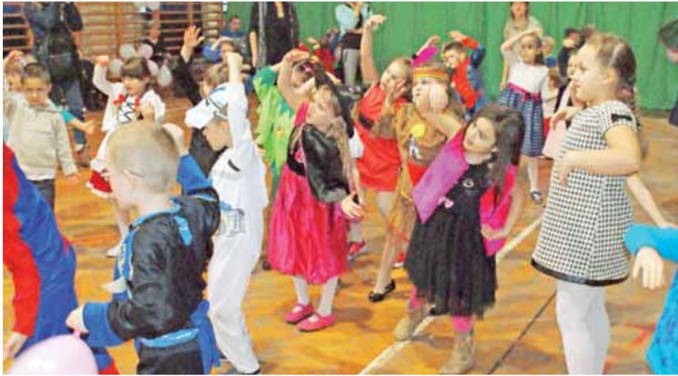
Przedzskolaki na parkiecie. Bal karnawałowy w szkolnej sali gimnastycznej w Bielawach.

Kreatywność w wymyślaniu strojów była ogromna: – Na sali królowały wróżki, czarodziejki, motyle, Spidermeni, strażacy, policjanci oraz bajkowe postaci zwierząt. Rada Rodziców zadba-