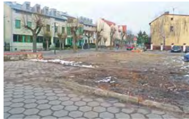
Na tym terenie Zdzisław Wróbel chce wybudować nowy budynek.

Krzysztofa Wawrzyna nie przekonuje też to, że powiększo-