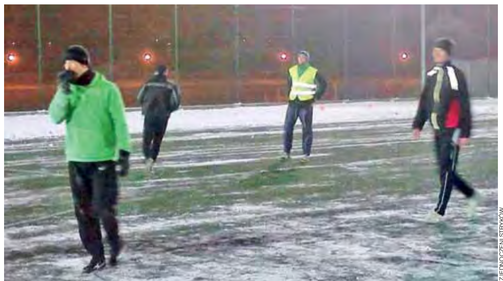
Strykowie ze Zjednoczonych przespali pierwszą połowę meczu z Sokółem, co było przyczyną porażki.

Doprowadzić do remisu niestety strykowianom się nie uda-