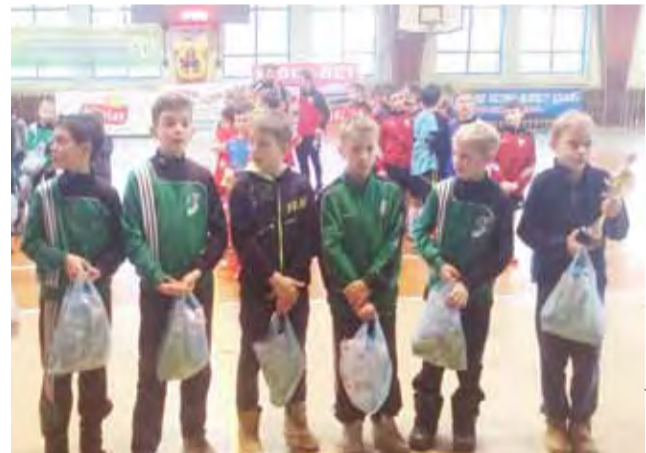
Gracze Pelikana I odebrali Puchar za czwarte miejsce w turnieju.

W ostatnim meczu w grupie nasz zespół pokonał 2:0 Borutę Zgierz i ostatecznie zajął trzecie miejsce w swojej grupie i czekał na pojedynk o miejsce piąte. Pierwszy zespół Pelikana rywalizował natomiast w półfinale z Mazovią Tomaszów. Niestety po bardzo wyrównanym spotkaniu