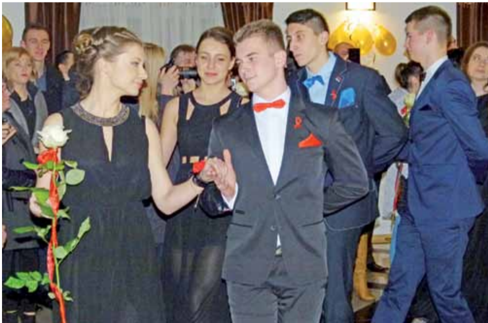
Po staropolsku. Studniówkowy polonez uczniów klas trzecich Publicznego Katolickiego LO w Głownie.