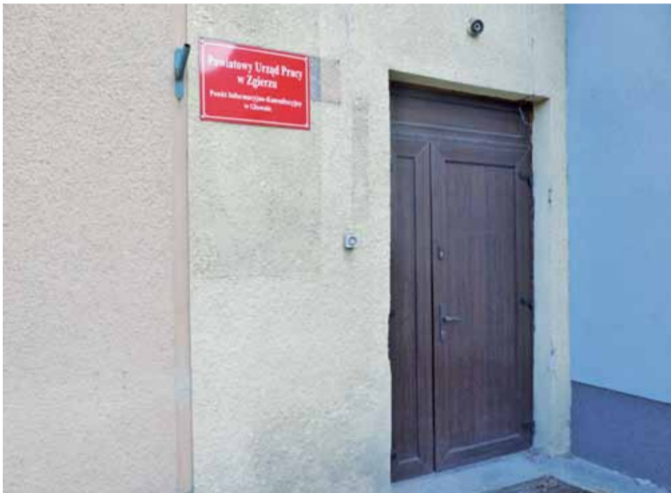
Sprawy będzie można załatwiać w punkcie informacyjnym PUP.

Jak powszechnie wiadomo, mieszkańcy z tęsknotą wspominają czasy, w których z załatwieniem dowodu rejestracyjnego czy też prawa jazdy nie musieli wybierać się do Zgierza, czasem nawet kilka razy w jednej sprawie.