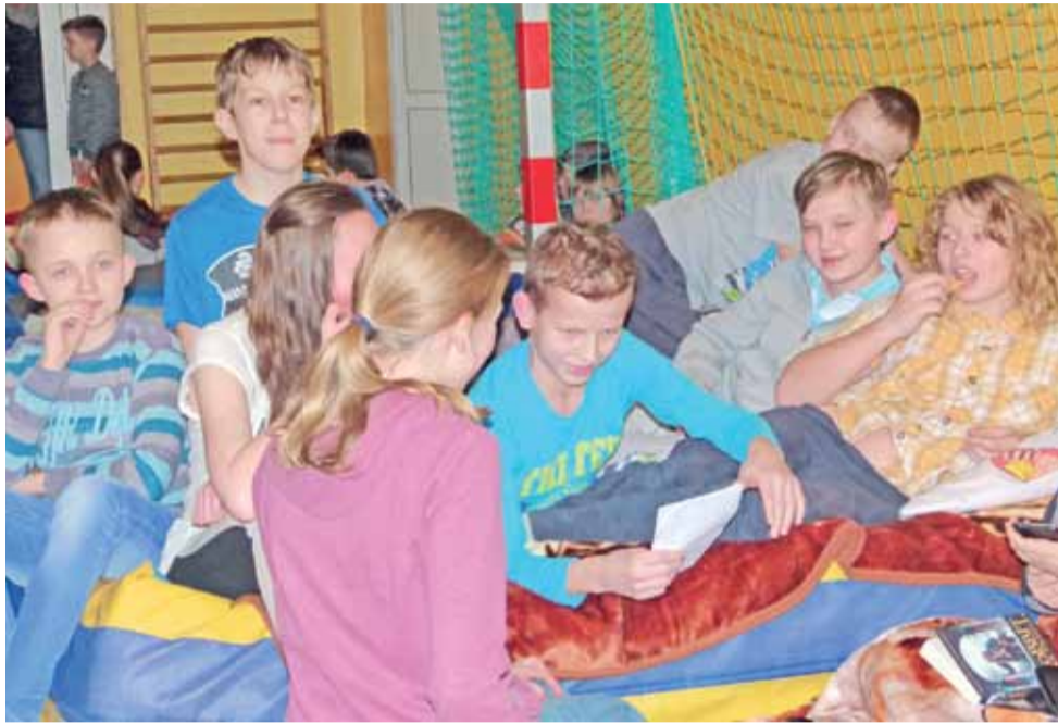
Noc w szkole. Na największych materacach w sali gimnastycznej rozłożyła się klasa VI.