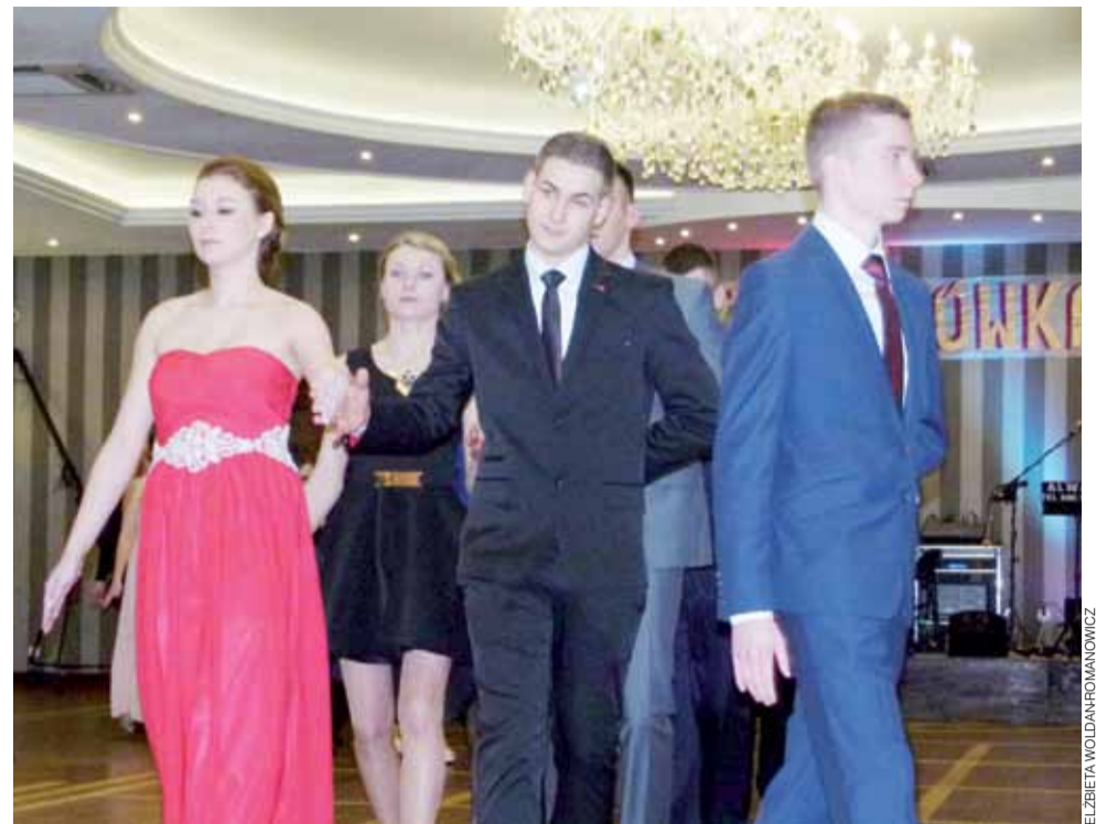
Polonez w Soplicowie. Studniówka Zespołu Szkół Nr 2 w Bratoszowicach.