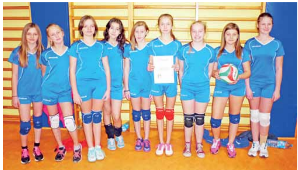
Uczennice Szkoły Podstawowej nr 3 w Głównie zwyciężyły w międzyszkolnych siatkarskich mistrzostwach.

Zwycięzcy Mistrzostw Główna będą reprezentować miasto podczas zawodów powiatowych, które odbędą się po zimowych feriach w hali MOSiR w Zgierzu. wp