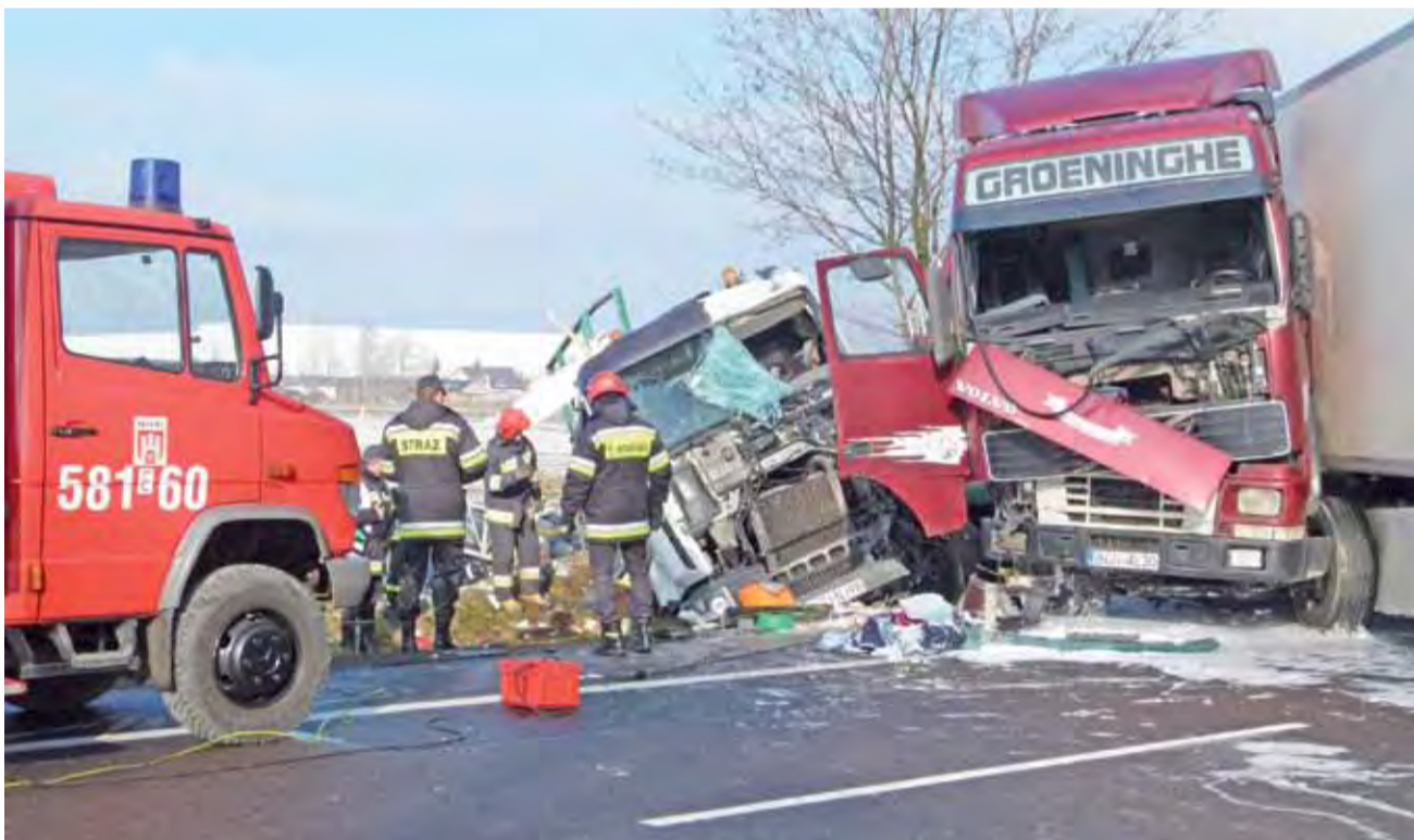
Wypadek na krajowej 14-tce w Sosnowcu. Jeden z uszkodzonych tirów długo blokował drogę.

My dotarliśmy na miejsce zdarzenia około godz. 11.00. Zjazd z ronda w Sosnowcu