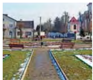
Miejsce, w którym zostanie ustawiony postument dzika, jeszcze nie zostało wybrane. mak

Umowa na dofinansowanie z Lokalną Grupą działania Gniazdo z siedzibą w Skierniewicach