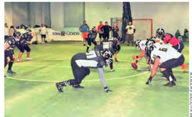
Zawodnicy Wilków Łódzkich trenują w trakcie off-season, by jak najlepiej przygotować się do startu w I PLFA.

szlifują umiejętności techniczne i podnoszą kondycję we wtorki i czwartki od godz. 19:00 oraz soboty od 11:00 w Vera Sport w Łodzi. Wciąż można dołączyć do klubu i sprawdzić się w dyscyplinie dla twardzieli, która z roku na rok zyskuje w Polsce coraz większą popularność i dogania pozostałe sporty. wp