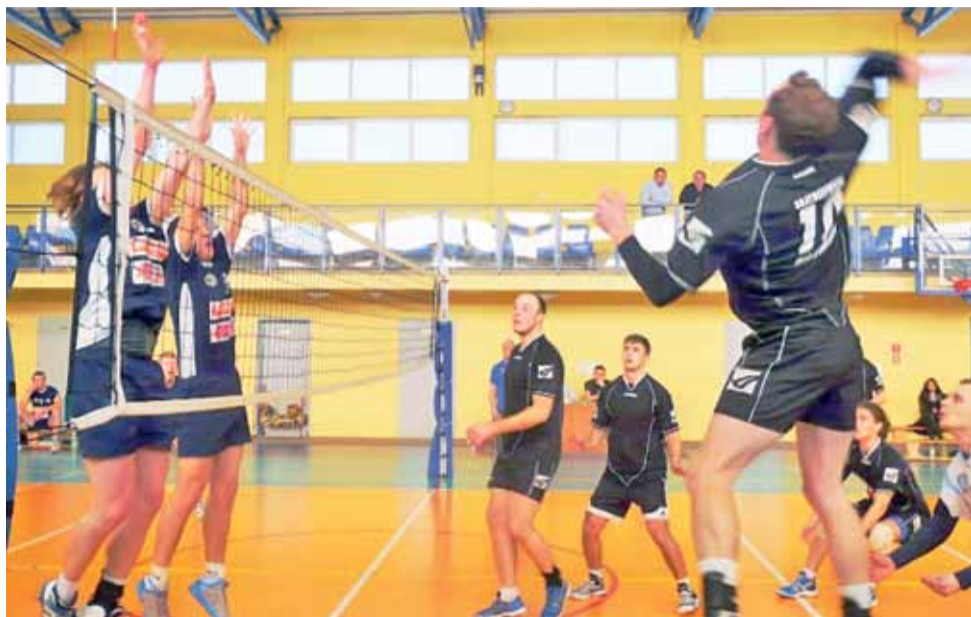
Mimo usilnych ataków siatkarze Bratoszewic (czarne stroje) zatrzymywali się na bloku Gladiatora.

Tym razem było jednak inaczej. W niedzielnym pojedynku znacznie lepiej radzili sobie liderzy z Parzęczewa. Tylko w pierwszym secie BKS postawił rywalom trudne warunki. Gladiator wygrał jednak 25:23 i dalej spokojnie rozgrywał kolejne akcje. Zapał siatkarzy Bratoszewic gości z każdym kolejnym przegranym punktem. Gdy w drugiej partii Gladiator zwyciężył do 20 niemal pewne stało się, że BKS tego spotkania nie wygra. W trzecim secie lider dopełnił formalności i po zwycię-