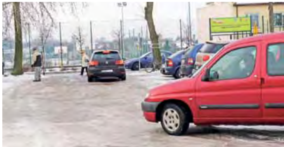
Wjazd i wyjazd z parkingu nieopodal targowiska to górki i dołki, które przy oblodzonej nawierzchni i bliskości chodnika dla pieszych stają się szczególnie niebezpieczne.