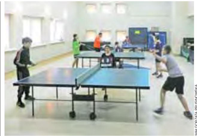
Tenis stołowy w Domu Kultury w Niesułkowie od lat jest priorytetem. wp