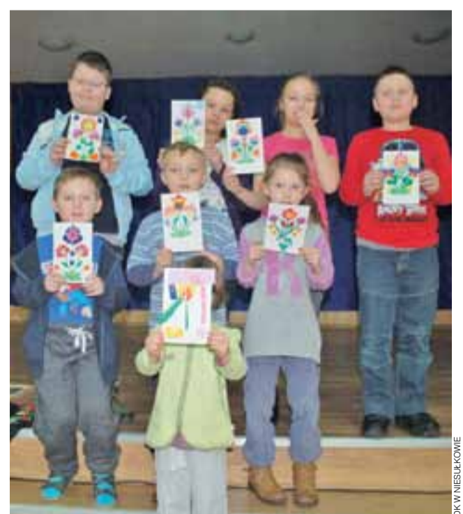
W Niesułkowie odbyły się warsztaty, na których powstały te łowickie wycinanki.