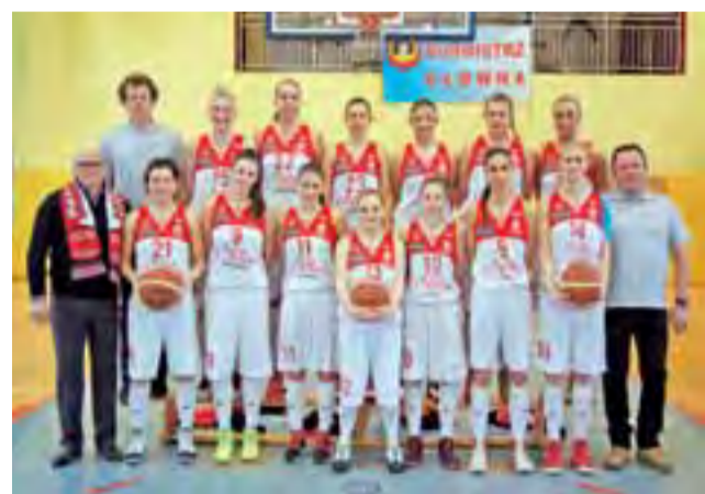
Drużyna TK Alles Głowno prezentuje nie tylko efektowny styl gry, ale również świetnie wygląda przy wspólnym zdjęciu.

Do końca sezonu pozostało już bardzo niewiele. Wydaje się nieradne, by TK Alles nie zdołał awansować do półfinałów ogólnopolskich o wejście do I Centralnej Ligi. Najbardziej adekwatnym pytaniem do obecnej sytuacji w II Lidze Koszykówki Kobiet strefy łódzko-mazowieckiej by-