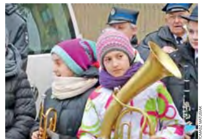
Z bełchowską orkiestrą strażacką gra też młodzież.