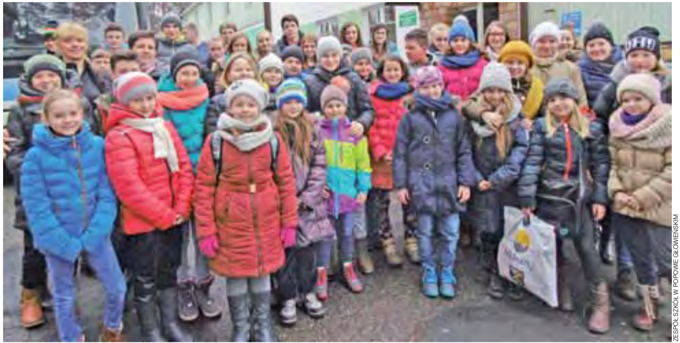
Zimowiska w Ręcznie. Na zdjęciu uczestnicy wyjazdu przed ośrodkiem.