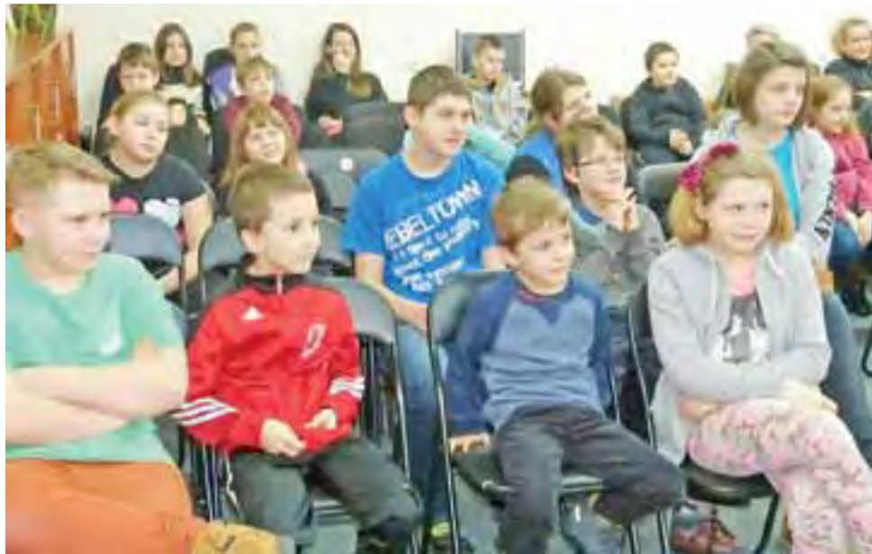
Dzieci z zainteresowaniem śledzili perypetie Maxa i żywo reagowali na to, co działo się w spektaklu.

Treść nie byłaby może dla dzieci tak porywająca, gdyby