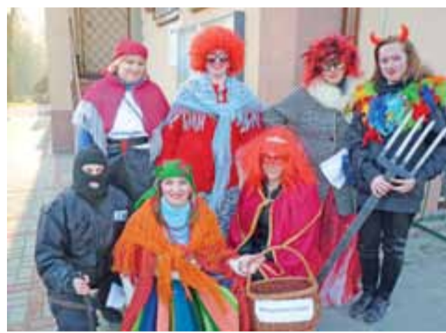
Panie z KGW Krepa przed Urzędem Gminy.