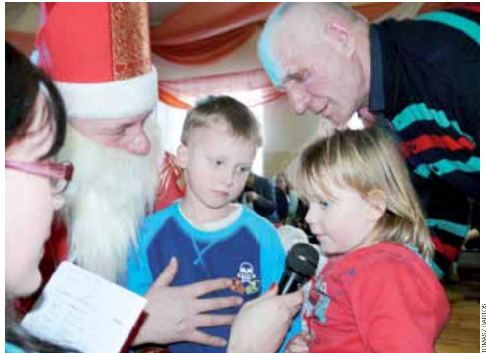
Jedną z atrakcji choinki w OSP w Sierzchnicach była wizyta Mikołaja, który rozdał dzieciom paczki ze słodyczkami. W zamian dzieci recytowały wiersze i śpiewały piosenki.