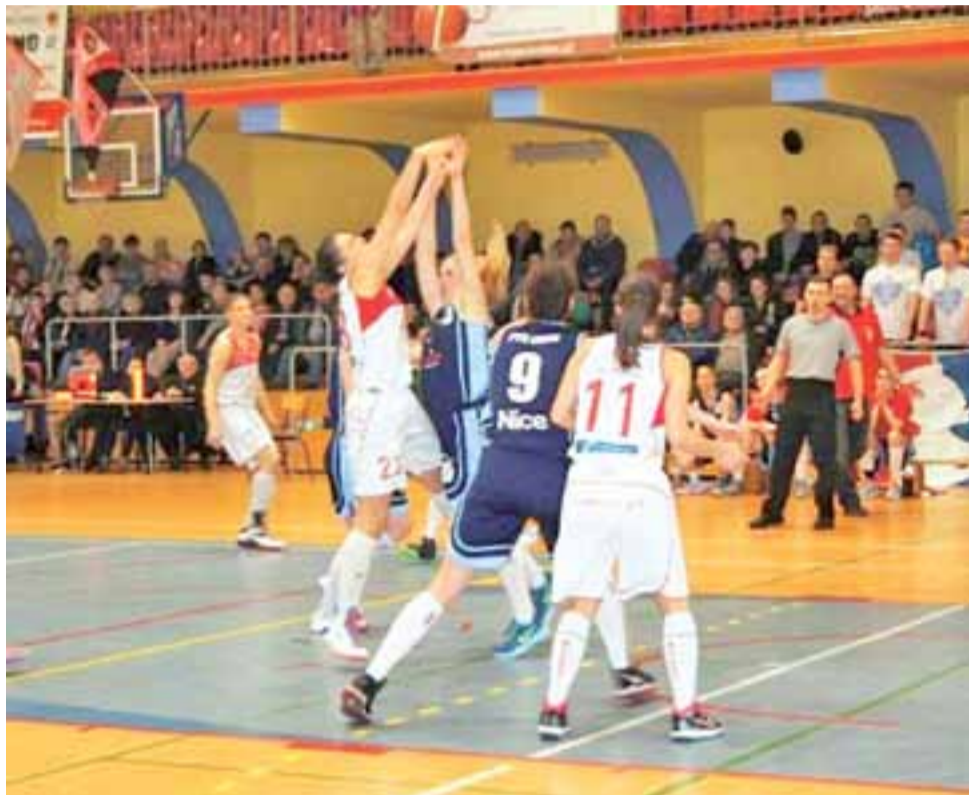
Koszykarki TK Alles Głowno (białe stroje) po raz kolejny pokazały niezwykle wysokie umiejętności i gładko pokonały najgroźniejszego rywala w walce o mistrzostwo II Ligi Koszykówki Kobiet.