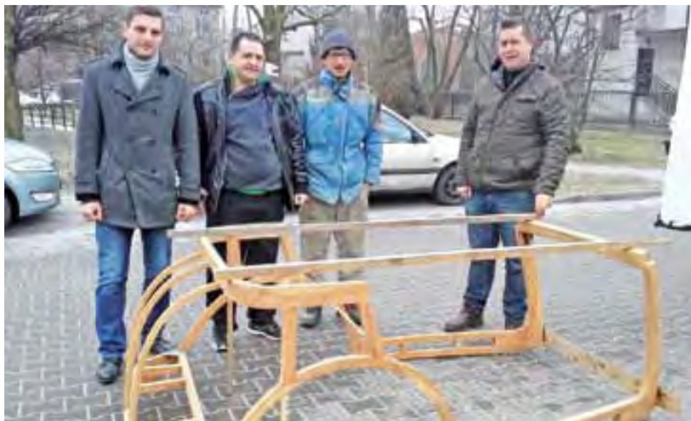
Członkowie Stowarzyszenia Historycznego im. 10 Pułku Piechoty przed drewnianym stelażem odbudowywanego przez nich łazika.

Każdy może pomóc w odbudowie łazika. Wystarczy wpłacić