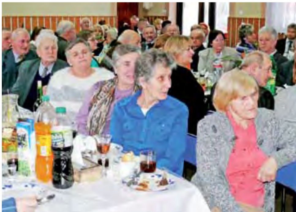
Seniorzy z Bednar Kolonii przysłuchujący się występowi młodzieży z Gimnazjum w Kompinie.

li na spotkanie, dziękowali im za owocne życie.