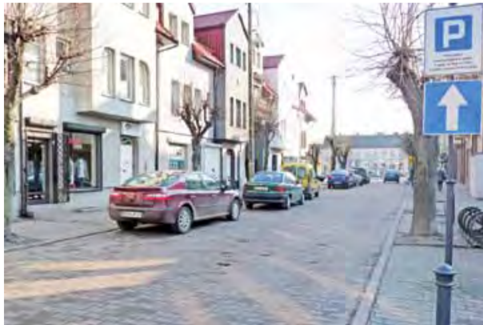
Ulica Strażacka często bywa zastawiona samochodami.

Strefa płatnego parkowania miała z placu i sąsiadującej z nim ul. Strażackiej wyeliminować przypadki, w których ktoś stawia samochód, przesiada się w busa i jedzie do Łodzi czy Łowicza, blokując przy tym miejsce na cały dzień.