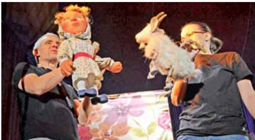
10 lutego licznie zgromadzona w Miejskim Ośrodku Kultury w Głównie publiczność obejrzała lalkowy spektakl w wykonaniu łódzkiego Teatru Pacuś. Przedstawienie pt. „O niesfornej Kózce i skromnej Anulce” oparte było na motywach bajki Janiny Porazińskiej „Kozucha Kłamczucha”. Opowieść o losach małej Anulki oraz mającej sporo wad kózce, pogłębiona była o wątki edukacyjne, dotyczące stereotypowych zachowań dzieci. Zwracała najmłodszym uwagę na negatywne konsekwencje kłamstwa, przechwalania się i nadmiernej pewności siebie. kl