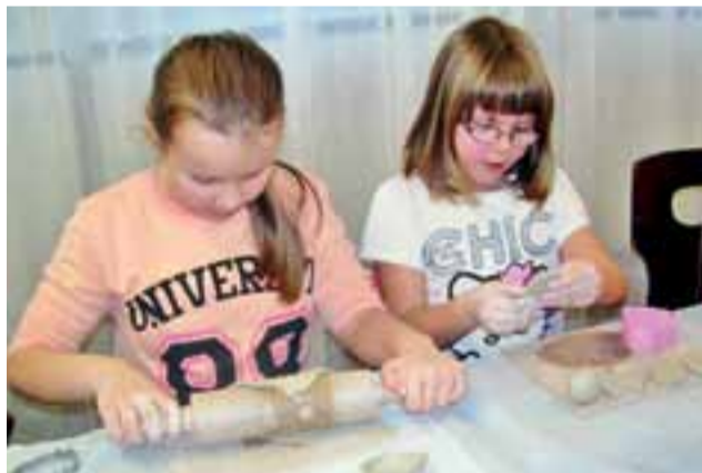
Dziewczynki z Kiernozi lepią małe dzieła sztuki.

niu stworzone wcześniej przedmioty zostały ozdobione farbami podszkliwymi. Wykonane prace dwukrotnie wypalono w piecu ceramicznym. Po wystawie, którą obecnie można oglądać w GOK, wykonawcy będą mogli zabrać swoje dzieło do domu. mm