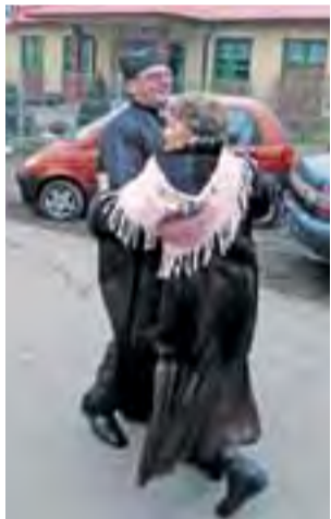
Niektórzy nawet zaczęli tańczyć.