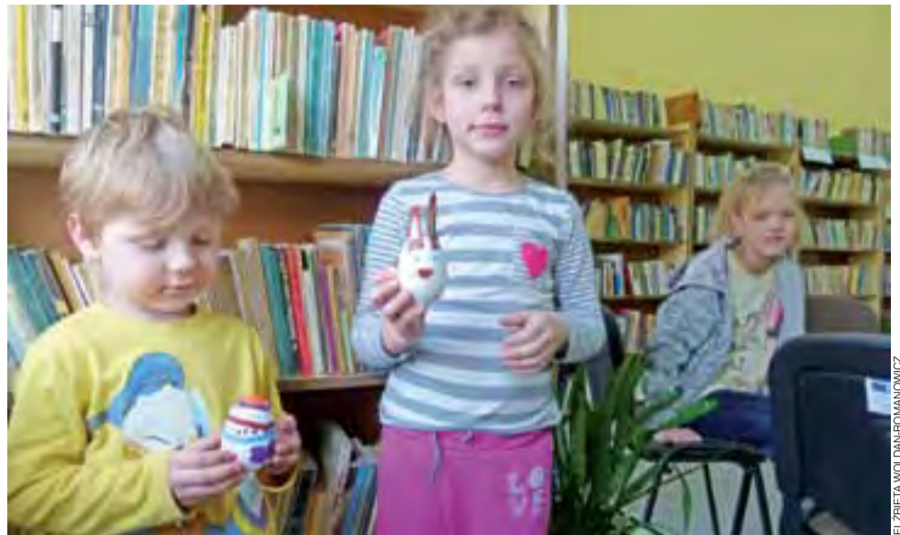
Ozdabiali jajka ze styropianu. Na pierwszym planie najmłodszy uczestnik zajęć feryjnych w Gminnym Ośrodku Upowszechniania Kultury w Bronisławowie.