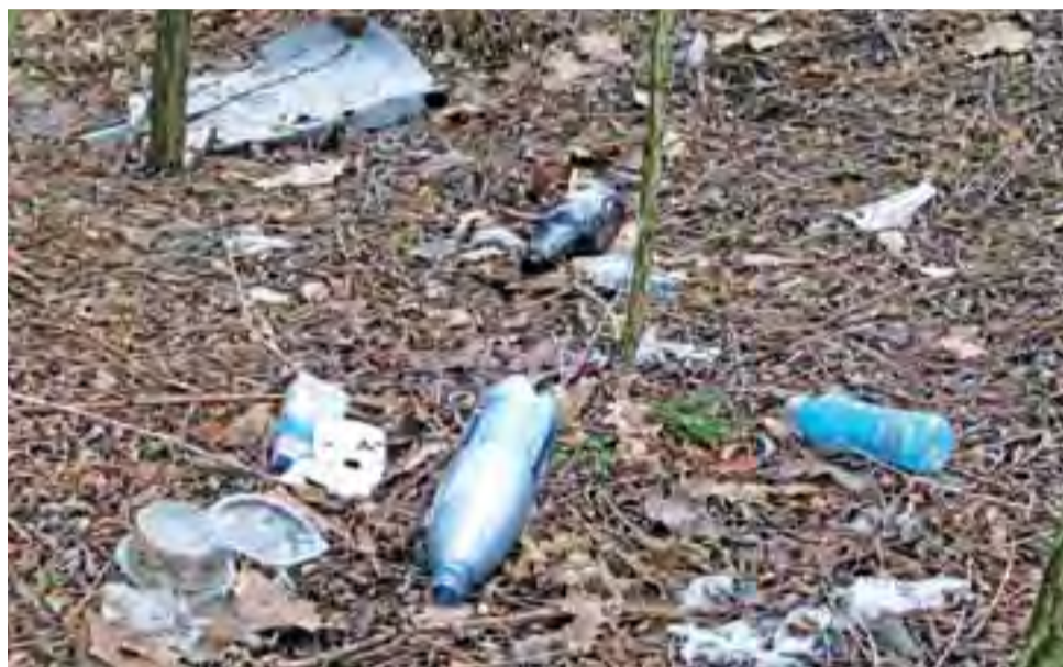
Co krok odpadki. Tak wygląda pierwsze kilkadziesiąt metrów po obu stronach leśnej ścieżki.

Nie jest to głos odosobniony. W sprawie notorycznie zaśmiecanego lasu głos nie raz zabierała już miejska radna i miesz-