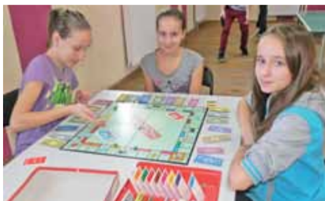
Gry planszowe od zawsze cieszą się dużym powodzeniem.

Jak na OSP przystało, na feriach było przede wszystkim bezpiecznie: każdego dnia dyżur pełniło dwóch strażaków, w tym jeden ratownik medyczny. Półkolonie zostały zgłoszone