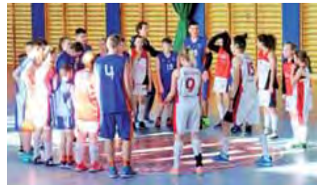
Koszykarki TK Alles i zawodnicy GTK razem spędzili końcówkę ferii.

TK Alles ogłosił już datę III Turnieju "Koszykówki z jajem". Tegoroczna rywalizacja odbędzie się w dniach 13-15 marca i będą mogli wziąć w niej udział zawodniczki z rocznika 2003 i młodsze. Koszt udziału w imprezie to 160 zł od uczestnika i 250 zł wpisowego od zespołu. Zgłoszenia do Turnieju przyjmowane są do 28 lutego pod adresem basket@tkalles.pl. wp