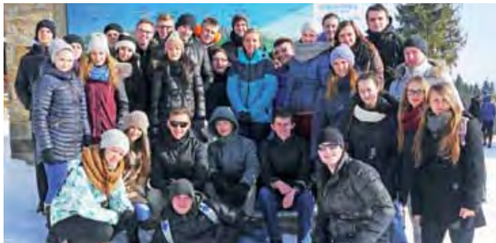
Członkowie zespołu Blichowiacy na szczycie Gubałówki, jak widać pogoda w czasie wyjazdu im dopisywała.