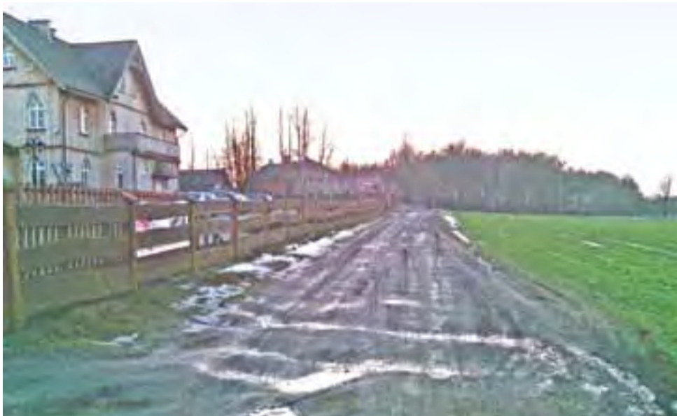
Droga Lubowidza – Nagawki. W tle skansen w Nagawkach.