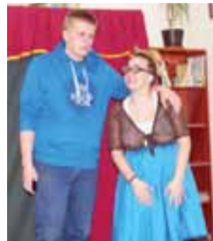
Marika z Maksymem nie mieli wspólnych tematów do rozmowy.

– Ja nie siedzę dużo przy komputerze, tylko czasami oglądam bajki – powiedziała nam 8-letnia