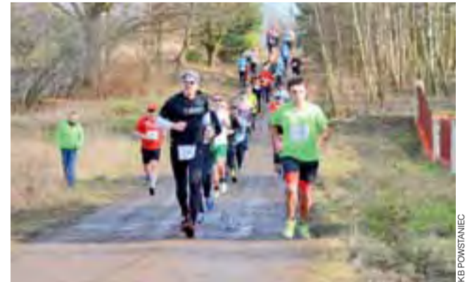
Start III Biegu Powstańca w Dobrej zbliża się wielkimi krokami

152. rocznicy powstańczej bitwy pod Dobrą. O godz. 10.00 zaplanowano mszę świętą w kościele rzymskokatolickim oraz kościele mariatów. Stamtąd wyruszy przemarsz na cmentarz. Szczegółowy harmonogram Biegu Powstańca: 12.00 – start marszu na dystansie 6 km, 13.10 – start biegu na dystansie 10 km, 14.15 – start biegu dla przedszkolaków na dystansie 100 m, 14.25 – start biegu dla dzieci w wieku 7-11 lat na dystansie 400 m, 14.35 – start biegu dla dzieci w wieku 12-15 lat na dystansie 800 m, 14.50 – uroczysta dekoracja zwycięzców biegów i marszu. aa wp, aa