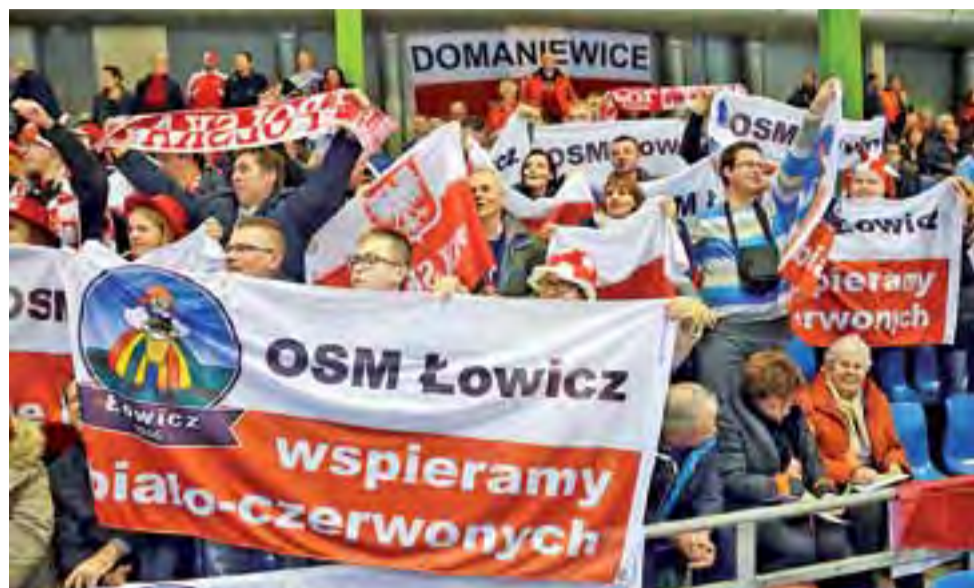
Polska, Domaniewice, OSM Łowicz - takie napisy widoczne były podczas zawodów w Heerenveen.

Łyżwiarstwo szybkie | Mistrzostwa Świata w Heerenveen