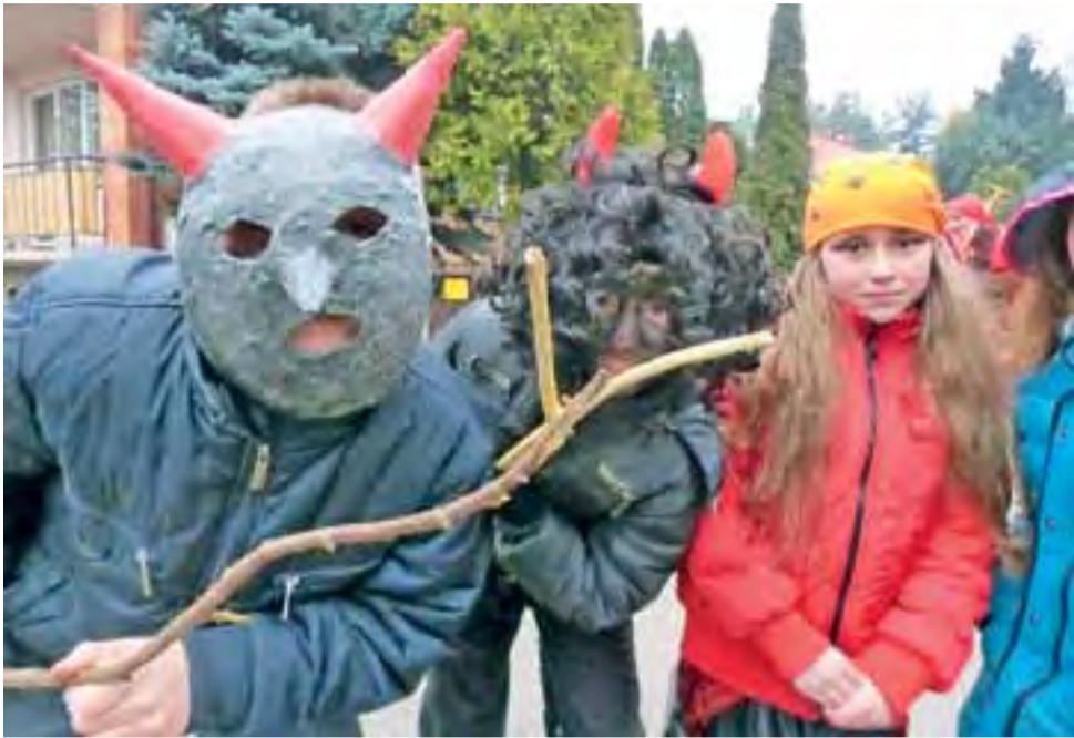
Obiekt naszego aparatu zainteresował miejscowe diabłki.

O cyber-pułapkach w bibliotece, o hafcie w muzeum. str. 23 i 24