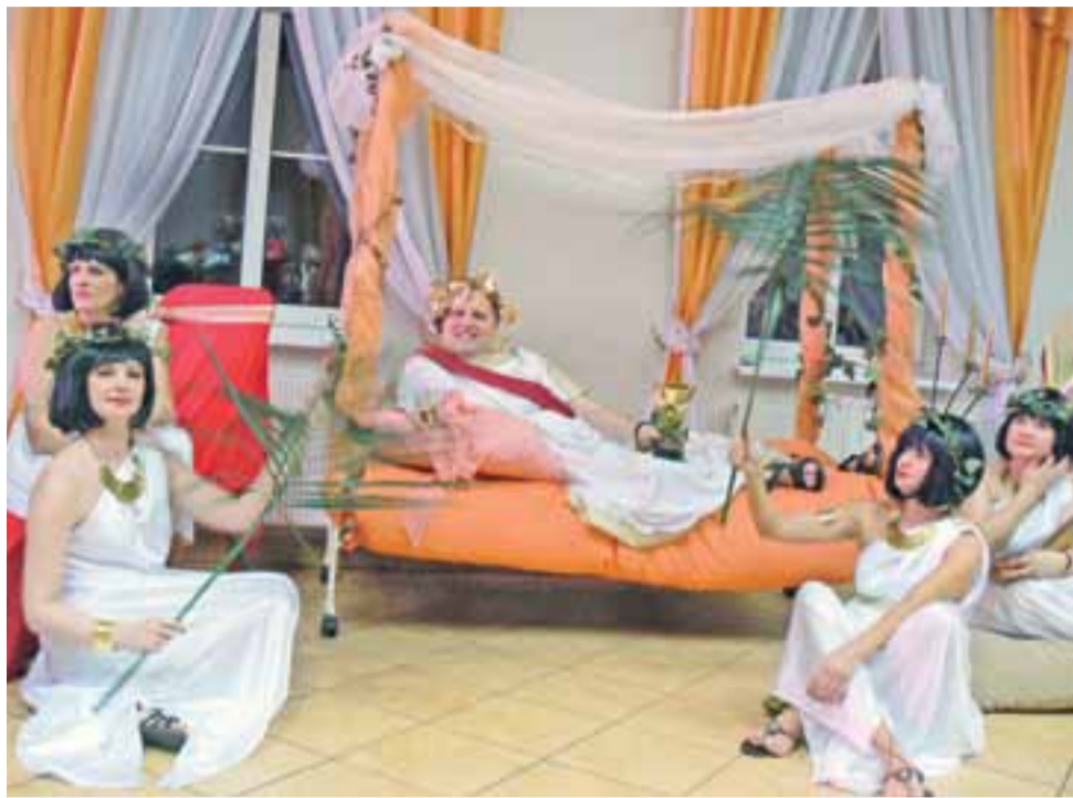
Gminny Dzień Kobiet w OSP w Nowostawach Dolnych. Koło Gospodyń Wiejskich ze Szczecina przygotowało inscenizację nawiązującą do starożytnego Rzymu.

Potem było jeszcze ciekawiej. Po krótkiej przerwie technicznej na scenie wyrosło starożytne Cesarstwo Rzymskie. Uroczyste Rzymianki wprowadziły w lekturę Cezara, który nakładał wieńce oliwne na głowy najważniejszych osób w gminie. I w ten sposób do inscenizacji włącz-