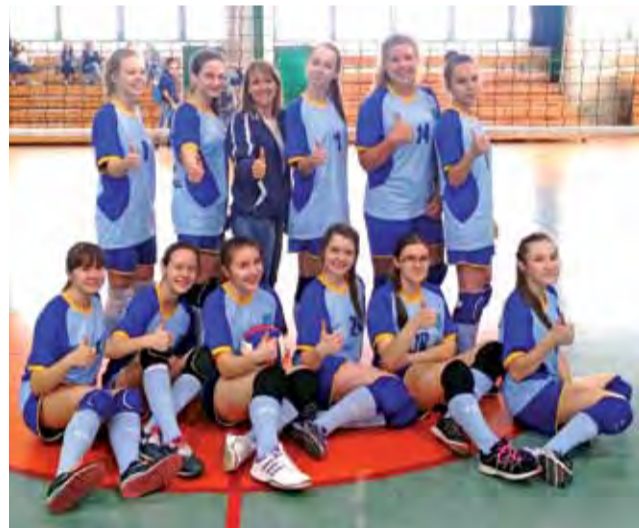
Dziewczyny z Pijarskiej po raz pierwszy wygrały mistrzostwa Łowicza.