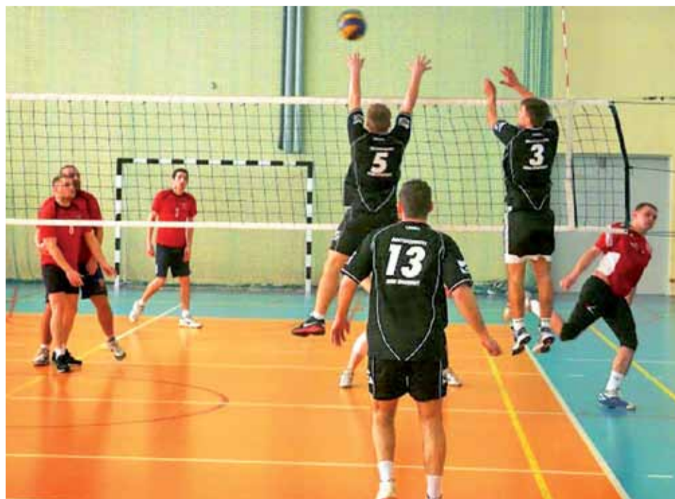
Siatkarze BKS Bratoszewice (czarne stroje) przetrwali trudny początek spotkania ze Szczawinem i ostatecznie wyszli z pojedynku zwycięsko.

BKS nie zmienił swojej pozycji w ligowej tabeli po niedzielnej wygranej. Bratoszewiczanie zajmują 5. miejsce, ale wciąż mają