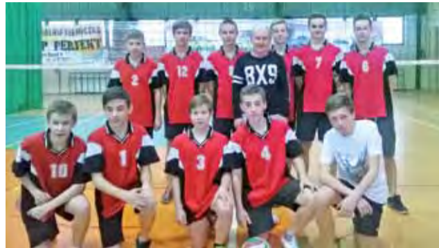
Siatkarze z Gimnazjum nr 3 zostali mistrzami Łowicza w piłce siatkowej.

Wyniki: Grupa A: G 2 Łowicz – Pijarskie GKP Łowicz 0:2 (15:25, 24:26); G 1 Łowicz – G 2 Łowicz 0:2 (21:25, 20:25); Pijarskie GKP Łowicz – G 1 Łowicz 0:2 (21:25, 19:25). Grupa B: G 4 Łowicz – G 3 Łowicz 0:2 (12:25, 23:25).