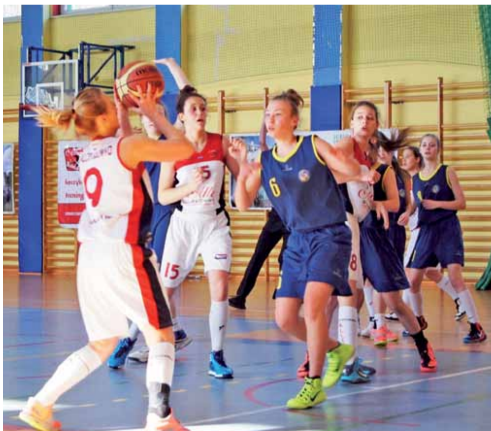
Kadetki TK Alles Główna (białe stroje) radzą sobie znakomicie w ligowych rozgrywkach w 2015. We wszystkich meczach od stycznia głównianki są niepokonane i notują serię czterech zwycięstw z rzędu. Podopieczne trenera Piotra Neydera liczą na podtrzymanie znakomitej passy.