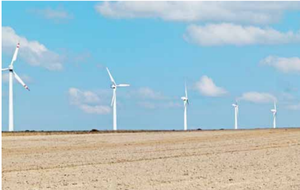
W Kraszewie w gminie Dmosin obok siebie stoi pięć wiatraków. Mieszkańcy Główna nie chcą oglądać w swoim mieście nawet jednego.

Jednocześnie burmistrz wyraził zdziwienie faktem, że miasto przystępowało do prac związanych z ustaleniem nowego studium zagospodarowania przestrzennego w 2008 roku, a jednak nikt nie wnioskował o wprowadzenie zapisów blokujących powstanie siłowni. Mieszkańcy tłumaczyli, że wówczas jeszcze wielu z nich nie mieszkało w obecnych lokalizacjach, a o prawdopodobieństwie powstania wiatraków też się nie mówiło.