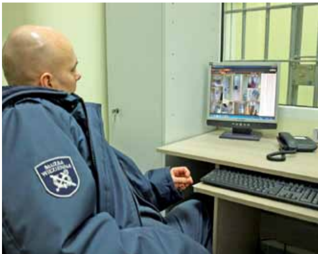
Funkcjonariusze Służby Więziennej będą oczywiście mieć ambulatorium pod stałym nadzorem.

Prace nad ambulatorium trwały od sierpnia ubiegłego roku. Wcześniej sama izba przyjęć mieściła się w dwóch odrębnych pomieszczeniach, a izby chorych znajdowały się na innym oddziale. Teraz, po remoncie, wszystkie pomieszczenia medyczne mieszczą się w zwar-