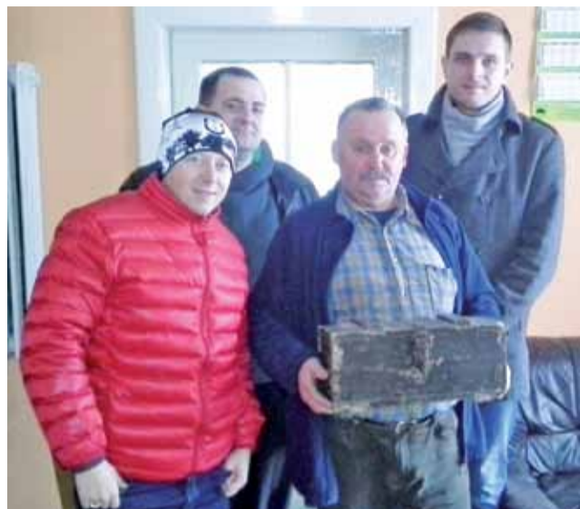
Dziesiątacy z drewnianym skarbem.

Lowicz | Stowarzyszenie Historyczne im. 10 PP