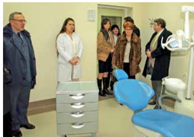
Otwarcie ambulatorium. Na pierwszy rzut oka nie widać, że to pomieszczenie więzienne.

tym kompleksie o powierzchni 300 m 2 . Są to trzy zupełnie nowe izby chorych, w których można umieścić osiem osób jednocześnie. Są też dwa gabinety lekarskie, gabinet stomatologiczny, gabinet do zabiegów specjalistycznych, magazyn leków, dwie poczekalnie, dyżurka oddziałowa z sanitariatem, toalety i cztery pomieszczenia gospodarcze.