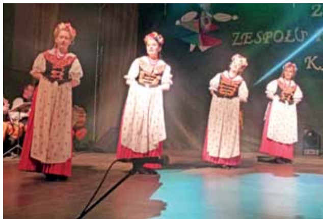
Występ jubileuszowy, tym razem tylko panie.