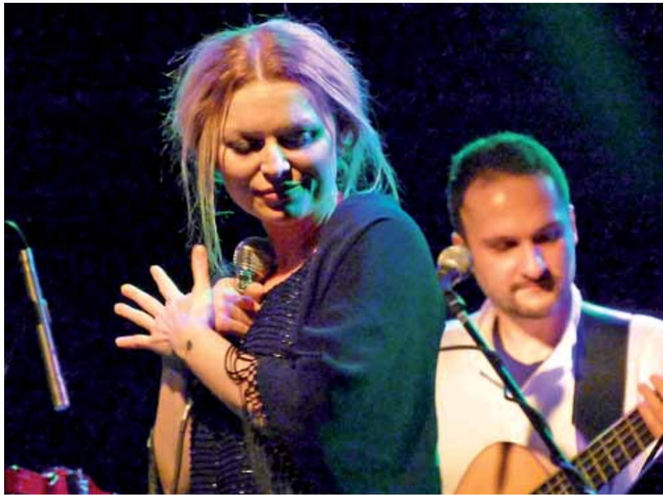
Anna Maria Jopek dała koncert bardzo różnorodnej muzyki – jak sama określiła „od Sasa do lasa”. Dużo improwizowała, a na sobie miała haftowaną łowicką chustę, którą dostała w Łowiczu po poprzednim występie.

Rekordowa była nie tylko widownia, ale też ilość sprzedanych karnetów – 95.