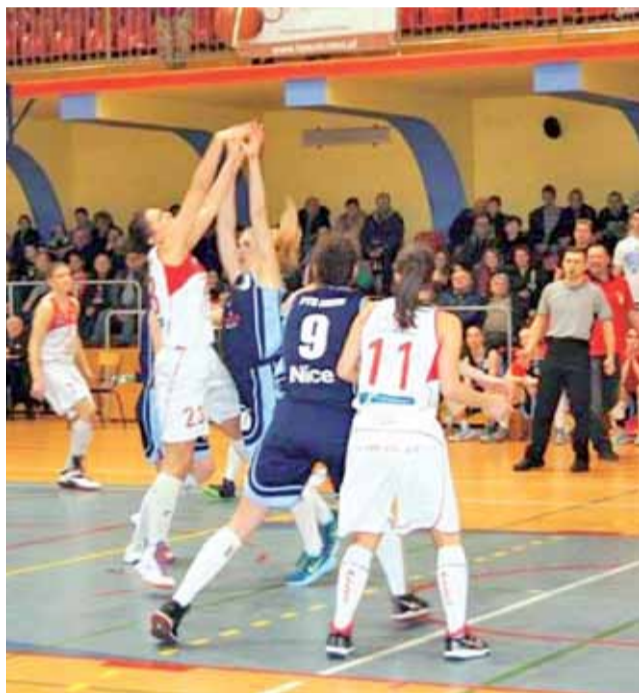
Koszykarki TK Alles Głowno (białe stroje) sięją postrach w II Lidze Kobiet. Głównianki nie przegrały ani jednego z czternastu spotkań i są na najlepszej drodze do zakończenia rozgrywek z kompletem zwycięstw.