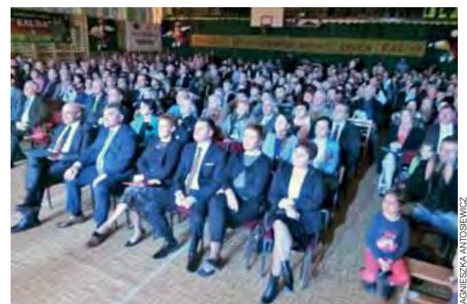
25-lecie zespołu zgromadziło w sali kilkaset osób.

Domaniewice | 25-lecie Zespołu Pieśni i Tańca „Kalina”