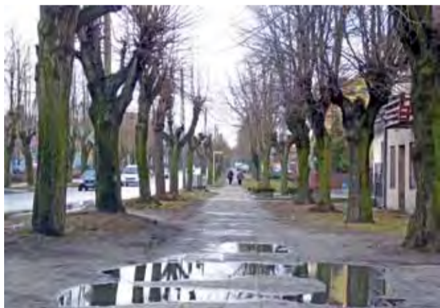
Stan chodnika na Swobodzie pozostawia wiele do życzenia.

Władze powiatu zwróciły się do Urzędu Miejskiego z propozycją partycypowania w tej inwestycji, dzięki czemu byłoby możliwe doprowadzenie chodnika do drogi krajowej nr 14.