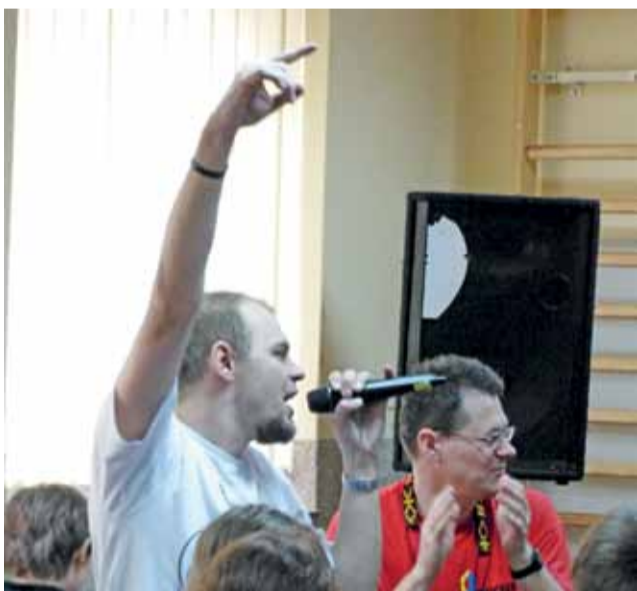
Członkowie radomskiej Szkoły Nowej Ewangelizacji podczas „Balu świętych”.

– Chcemy przemawiać do młodych ludzi w ich języku – mówił nam przedstawiciel wspólnoty