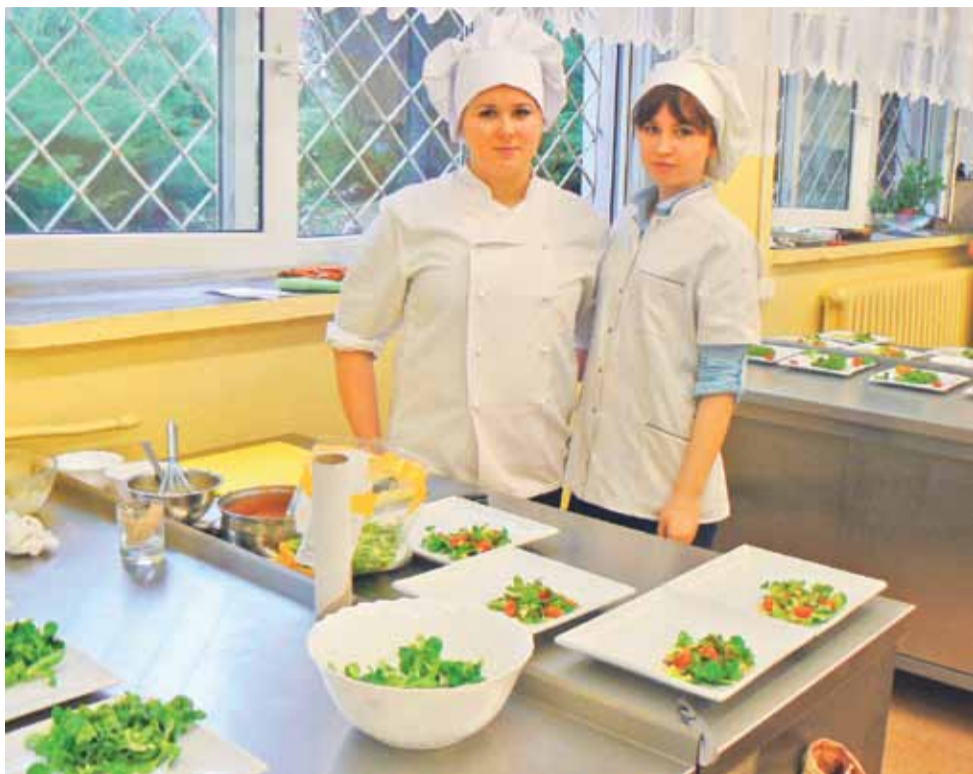
„Szkolny Master SzeF”. Na zdjęciu uczniowie wraz ze swoim daniem konkursowym.

Gmina Stryków | Konkurs „Szkolny Master SzeF”