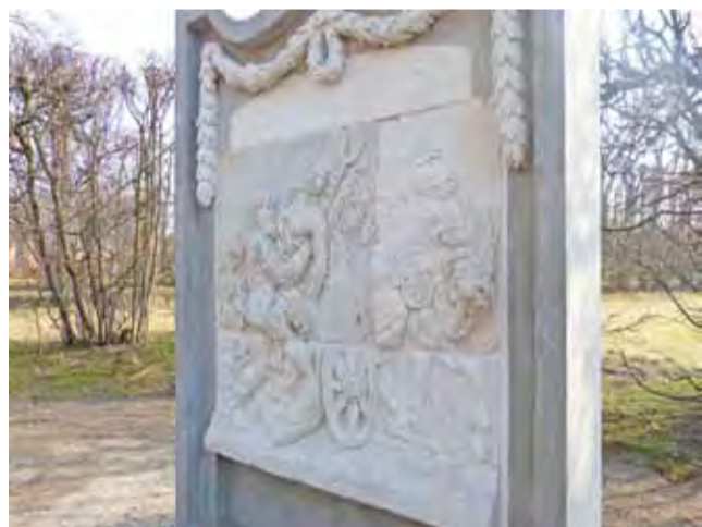
Hades i Persefona w całej krasie. Płaskorzeźbę wykonaną w III-II wieku p.n.e. w Grecji ponownie można podziwiać w parku w Nieborowie.

10-osobowa grupa dzieci miała zajęcia poświęcone sztuce antyku. Uczestnicy spacerowali w pałacu oraz parku, szukając takich elementów i poznając ich historię, potem miały za zadanie uzupełnienie kart na ten temat w książeczce edukacyjnej. mwk