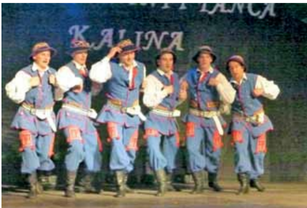
Panowie z grupy kadrowej podczas jubileuszowego występu.