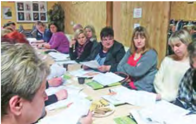
DK w Strykowie – spotkanie informacyjne dotyczące konkursu „Działaj Lokalnie”.