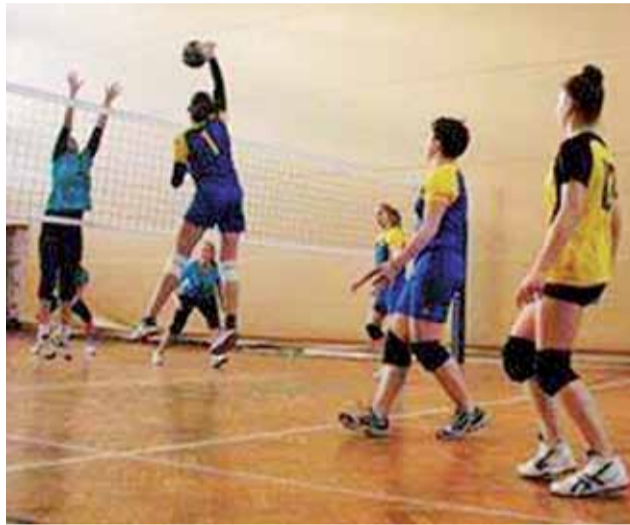
Siatkarki Stali Głowno często atakowały na pojedynczym bloku dzięki świetnemu rozgrywaniu akcji.

że Stal wypadnie poza podium, choć na dwie kolejki przed końcem istniała jeszcze minimalna szansa na takie rozwiązanie. Głowniankom wystarczyło 2 pkt. w starciu z Energią Pabianice, by móc rywalizować w play-offach z będącym w zasięgu Salo, ale Stal chciała odnieść pewne zwycięstwo nad dobrze znanym, aczkolwiek trudnym rywalem. Oprócz rozgrywek ligowych siatkarki Energii dwukrotnie brały udział w Turnieju Noworocznym w Głownie i dwukrotnie triumfowały. Pabianiczanki także miały szansę na awans do play-off, więc chciały pokazać się z jak najlepszej strony.