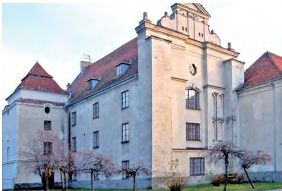
Budynek jest niewątpliwie cenny jako zabytek, ale nikt na razie nie ma pomysłu na jego zagospodarowanie.

Do likwidacji kolegiów nauczycielskich rząd dążył od kilku lat. W 2009 roku ministrowie edukacji, szkolnictwa wyższego i pracy ogłosili zakaz tworzenia nowych kolegiów, zapowiedzieli też zaprzestanie naboru na istniejące kolegia od 2011 roku (co jednak zostało później odłożone). Głównym powodem była niemożność przystosowania kolegiów do obowiązującego w Unii Europejskiej systemu bolońskiego (trzyletnie studia licencjackie i dwuletnie magisterskie). Uznało, że kolegia nie są szkołami wyższymi, nie mają więc prawa do nadawania tytułów naukowych, a takim jest licencjat. Rząd podkreśla też zbyt dużą liczbę nauczycieli na rynku pracy. Projekt nowelizacji reformy oświaty z 1991 de facto likwidujący ko-