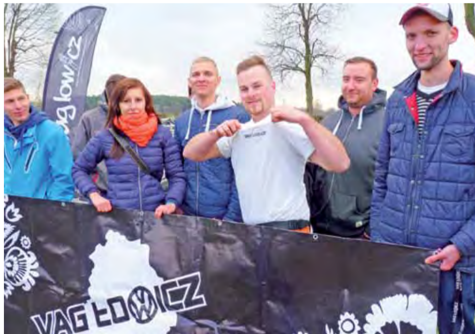
Silna grupa VAG Łowicz. Łowiczanie przyjechali na zlot do Głowna i zapraszali na ten, który zorganizują u siebie w sierpniu.

Co łączy uczestników zlotu, co ich „kręci”? Tuning samochodowy, czyli – w uproszczeniu – modyfikacje, dzięki którym uzyskuje się polepszenie parametrów technicznych pojazdu oraz jego wyglądu. Samochody z grupy VAG są bardzo podatne na tuning. Standardem jest obniżenie samochodu, uzyskiwane przez wymianę fabrycznego zawieszenia na gwintowane lub pneumatyczne. Do tego dochodzi koło z dość nisko profilowaną oponą i „naciąganiem”, w którym rant felgi wy-