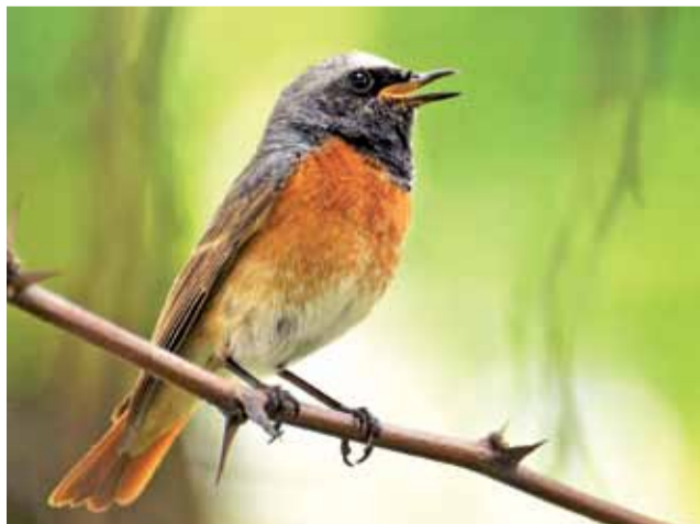
Nawoływanie pleszki. Pleszka wycieczna ( Phoenicurus phoenicurus ) jest gatunkiem wędrownym o smukłej budowie i długich nogach.