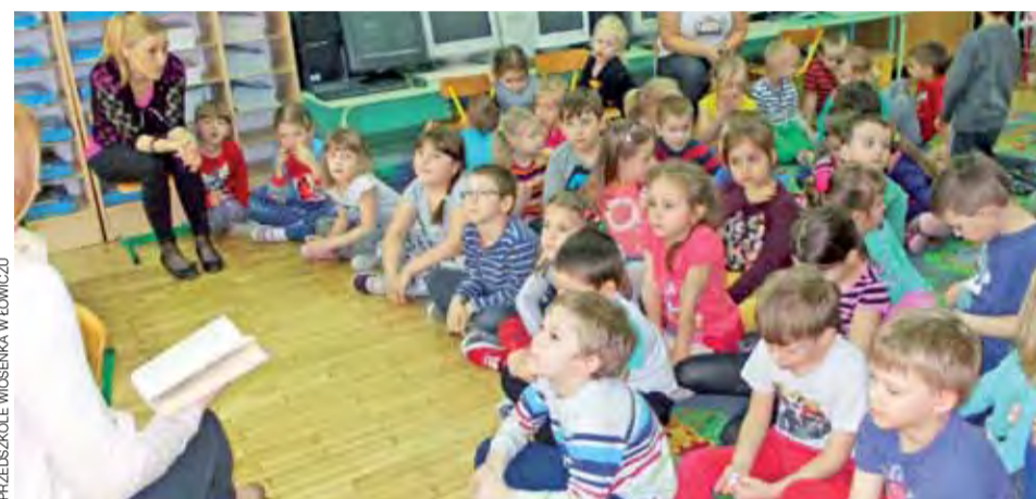
PRZEDSZKOLE WIOSENKA W ŁOWICZU

ne Urzędu Miejskiego w Łowiczu. Autorzy najlepszych prac w każdej kategorii otrzymali książki. mak