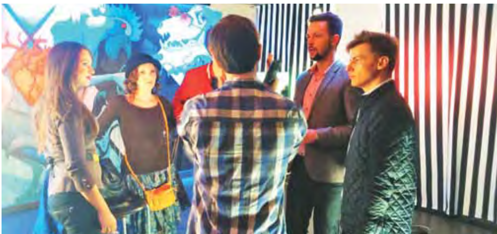
Reżyser z firmy Tomorrow, kręcącej film, objaśnia aktorom, jak ma wyglądać scena ze statystami.

Łowicz | Zdjęcia do filmu dokumentalnego „Tu jest kino”