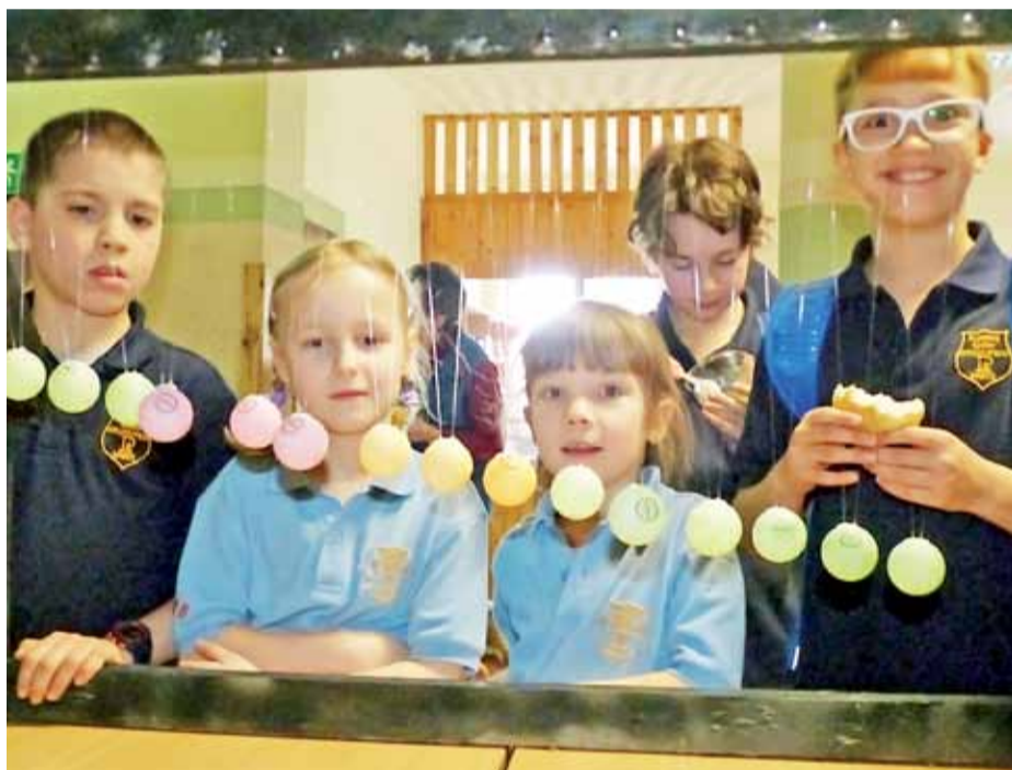
Kolorowe kule wyglądają trochę jak świąteczne ozdoby, ale to tak naprawdę doświadczenie pokazujące działanie dynamiki Newtona.

Uczniowie podstawówki mieli niezłą frajdę, poznając pozornie trudne zagadnienia w prosty sposób. tm