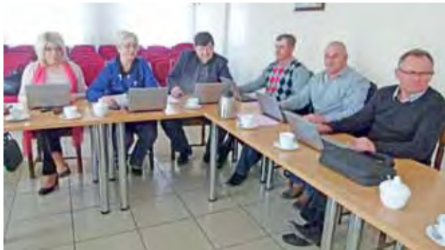
Na poniedziałkowej komisji budżetu i mienia komunalnego radni pracowali już na nowych netbookach.

Ta nowoczesność, zdaniem władz gminy, jak i pozostających radnych, ma obniżyć koszty funkcjonowania Rady Miejskiej (tj. kserokopie, wysyłanie