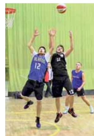
Waleczni koszykarze BKS Lalalilo Bratoszewice (czarne stroje) po raz drugi z rzędu zagrają w ćwierćfinałach I Ligi CNBA.

Zawodnicy Lalalilo zdołali awansować jednak do ćwierćfinałów I Ligi CNBA i nadal mają szansę walki o Superligę. Trzeba będzie jednak stoczyć niezwykle ciężką walkę. W ćwierćfinale BKS trafił bowiem na pierwszy zespół gr. A Gromar Bad Boys, z którym w poprzednim sezonie także toczył pojedynki i również na tym samym etapie play-off i niestety przegrał. Spotkanie