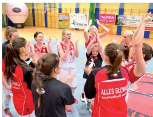
W drużynie TK Alles po wygranym spotkaniu radość była wielka.