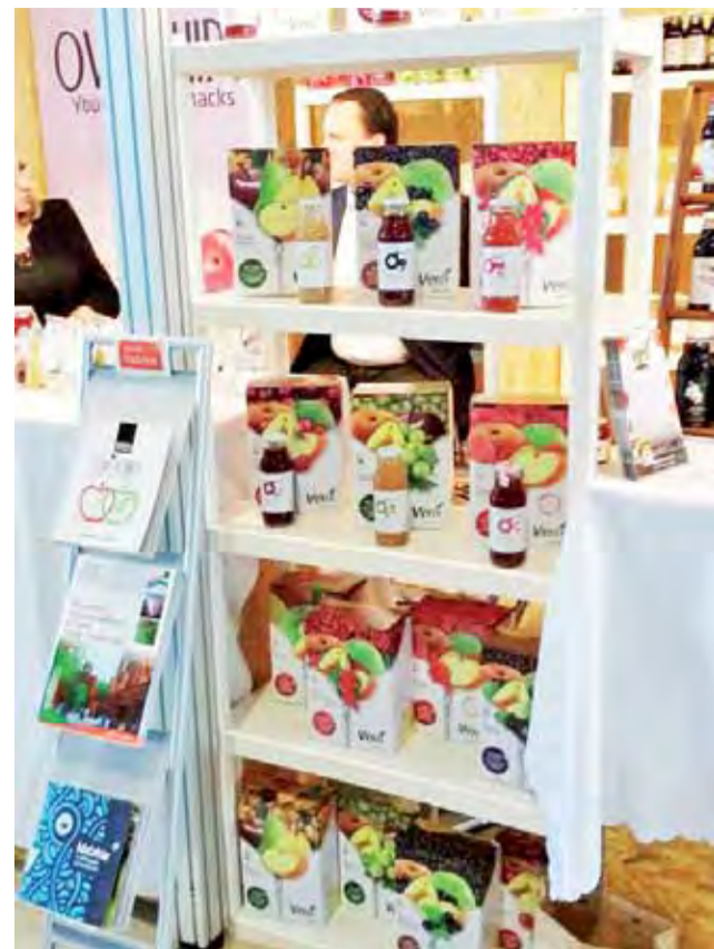
Stoisko firmy „VERO”.

Głównym założeniem targów jest promowanie regionalnej, naturalnej żywności, będącej przeciwieństwem produktów typu „fast food”. Partnerem targów jest włoska organizacja „Slow Food”, która promuje ideę zdrowego, naturalnego odżywiania oraz czerpania radości z jedzenia świeżych produktów. Prezentowane wyroby charakteryzują się tradycyjną metodą produkcji. Targi są skierowane do wszystkich tych, którzy cenią zdrową i smaczną żywność, bez konserwantów. Dla przedsiębiorców jest to doskonała okazja do zaprezentowania swoich produktów oraz nawiązania kontaktów handlowych. aa