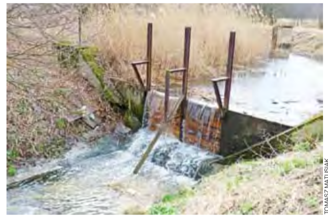
Nowy dzierżawca już zadbał o odbudowanie zniszczonej tamy.

Na terenie gminy – w Łyszkowicach – znajduje się jeszcze jeden zbiornik wodny doprowadzony przez lata do fatalnego stanu. Jego zagospodarowaniem ma się zająć Urząd Gminy, powierzając obsługę Gminnemu Ośrodkowi Kultury i Sportu. W tym roku ma powstać dokumentacja, która umożliwi pozyskiwanie środków na inwestycje. W planach jest ścieżka pieszo-rowerowa dookoła zbiornika. tm