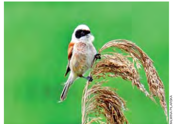
Remiz. Ptak rzadko spotykany, a więc to zdjęcie jest jednym z najcenniejszych fotograficznych trofeów głównianki.