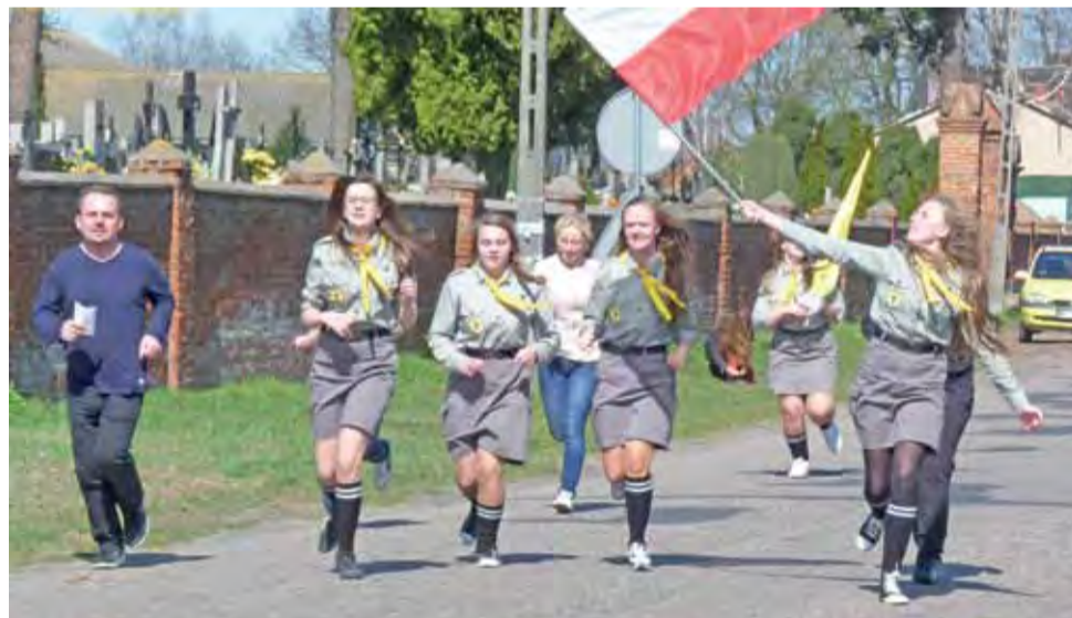
Biegna harcerki. Sztafeta dotarła już do Starego Waliszewa.