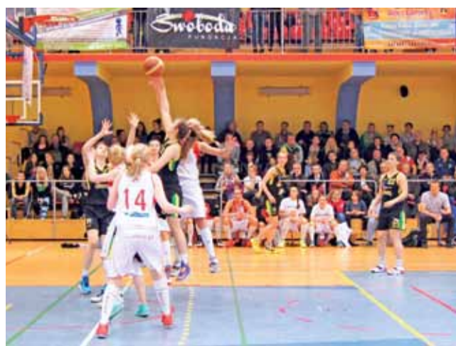
Skuteczna gra w obronie TK Alles (białe stroje) kluczem do sukcesu.