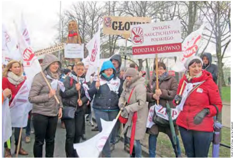
Kukła „baby z worem” wyraża obecny stan niedoinwestowanej oświaty w Polsce.