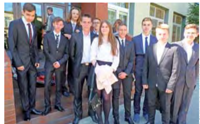
Stresu nie widać. Uczniowie Gimnazjum Miejskiego po części humanistycznej spotkali się przed szkołą, by podzielić się wrażeniami.

W tym roku organizatorzy nieco zmienili zasady udziału w dyktandzie, zapraszając do wspólnej zabawy nie tylko współpracujące z biblioteką instytucje, ale również osoby indywidualne z terenu miasta i gm. Stryków. Organizatorzy czekają na zgłoszenia do 6 maja, do godz. 17.00: drogą telefoniczną pod nr (42) 719-80-94 lub osobiście w lokalu biblioteki.