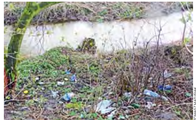
Zdjęcie wykonaliśmy na początku kwietnia. Ilość śmieci była miejscami zatrważająca.