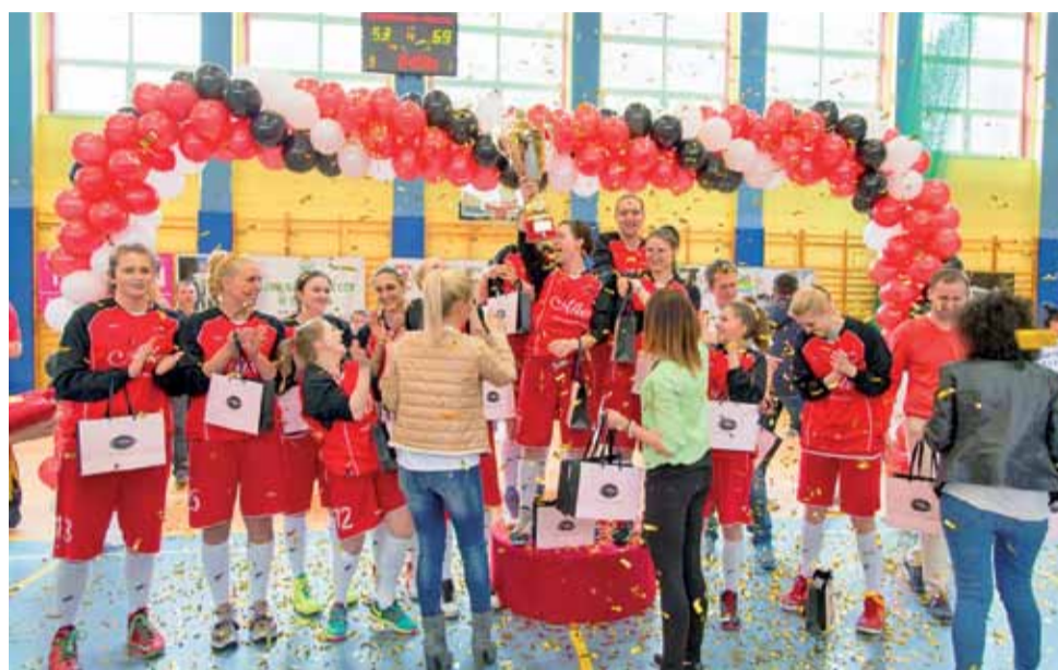
Radość głowieńskiego zespołu TK Alles po zwycięstwie w finałach i awansie do I Centralnej Ligi Kobiet.

Koszykarki biorące udział w zawodach miały udostępnione wszystko, czego potrzebowały. Czwórka finalistów postarała się więc, by Turniej stał na wysokim poziomie sportowym. Miejscowi kibice liczyli, że jednym z dwój-