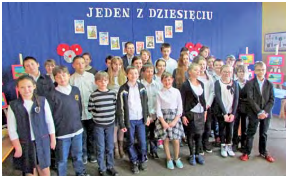
W konkursie matematycznym wzięło udział aż 30 uczestników ze szkół podstawowych.

Podczas trzech etapów konkursu uczniowie zaprezentowali wysoki poziom wiedzy z zakresu matematyki, udzielając trafnych i wyczerpujących odpowie-