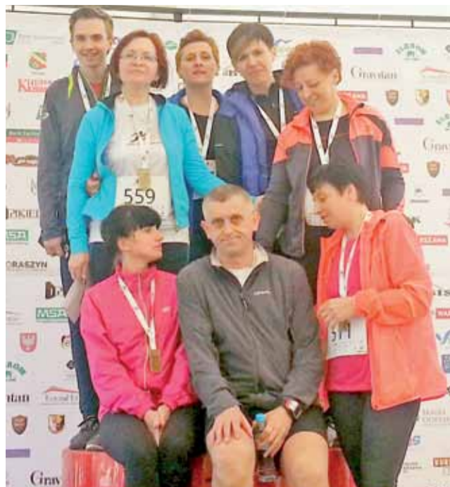
Grupa z osiedlowej inicjatywy Starzyńskiego Biegów na podium biegów w Raszynie.