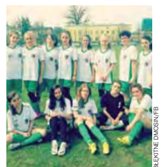
Piłkarki drużyny Błękitnych Dmosin umiejętnościami nie ustępują chłopcom w swoim wieku i udowadniają, że piłka to też sport dla kobiet.