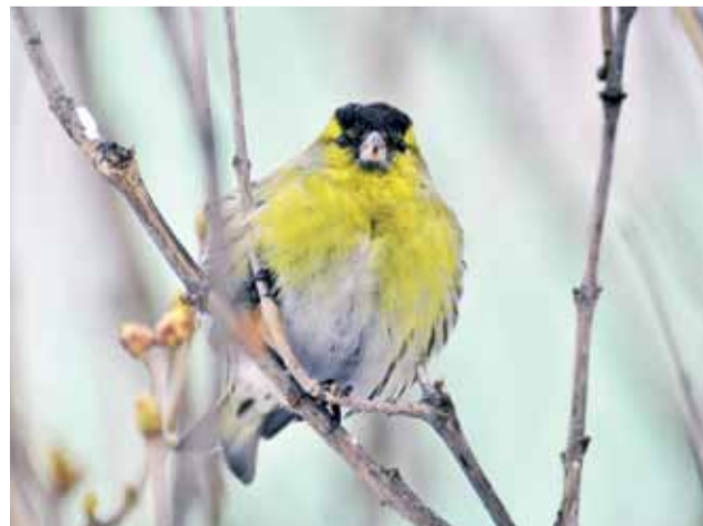
Czyżby czyżyk? Czyż pospolity ( Spinus spinus ) – mniejszy nawet od wróbla, jasno upierzony ptak.