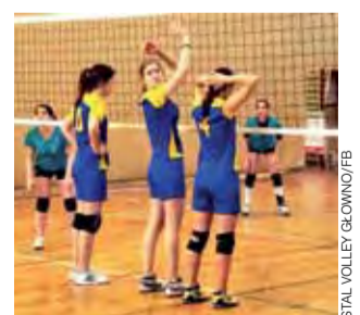
Siatkarki Stali Głowno tym razem nie miały wesołych min. Głownianki przegrały w barażach.

11 kwietnia w hali SP nr 205 w Łodzi głowieniejskie zawodniczki w meczu barażowym o Ekstra-