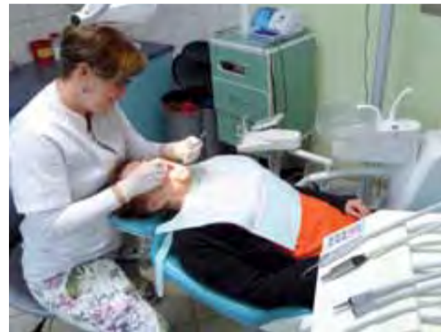
W ramach niedzielnej akcji można było skorzystać m.in. z bezpłatnej kontroli stomatologicznej w gabinecie Hollydent.