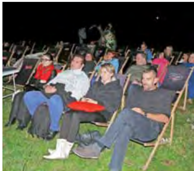
Sobotni wieczór zakończył się projekcją filmu nad rzeką, widownia miała do dyspozycji 50 leżaków.

jącymi w rzece i pływającym po wodzie łabędziem.