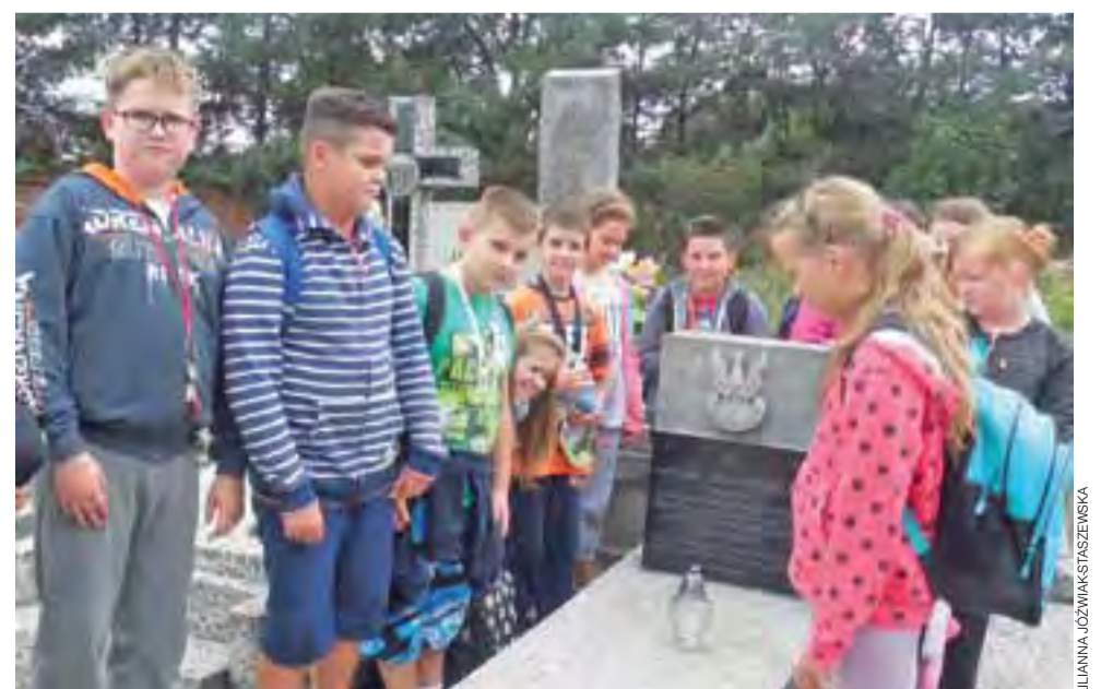
W Zespole Szkół Nr 2 w Bratoszewicach tradycją stało się już, że na pierwszych wrześniowych lekcjach uczniowie większości klas podstawówki i gimnazjum wraz z wychowawcami wybierają się na pobliski cmentarz, by tam złożyć wiązanki kwiatów i zapalić znicze na grobach żołnierzy poległych w obronie Ojczyzny. Na zdjęciu uczniowie z kl. VI SP, która odwiedziła cmentarz w Bratoszewicach 2 września. ■