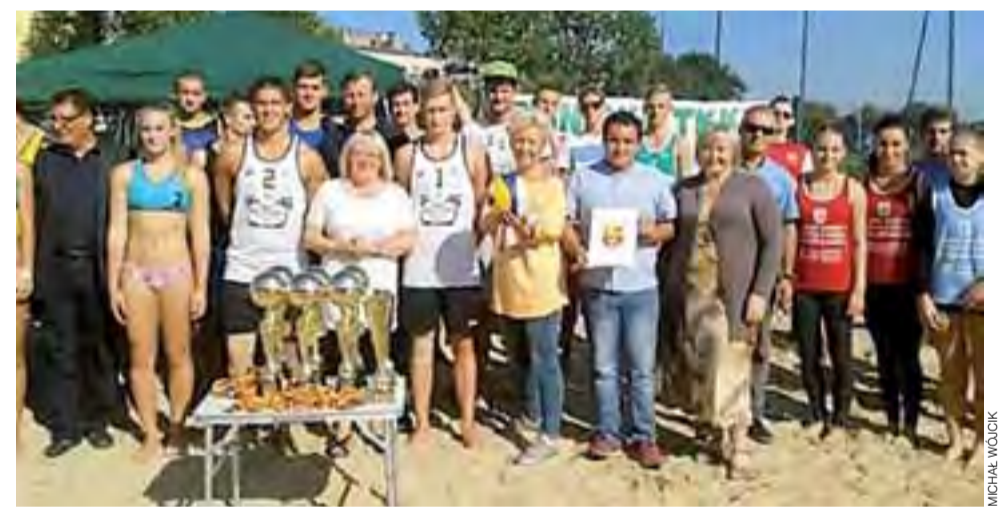
Uczestnicy pożegnalnego Turnieju MRM w Głownie po zawodach otrzymali wspaniałe nagrody.

Zdecydowanie bardziej zajęta rywalizacja towarzyszyła zmaganiom chłopców do lat