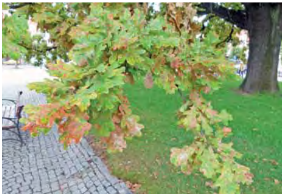
Tak wyglądają liście dębu rosnącego na placu Wolności. Stan na 4 września.