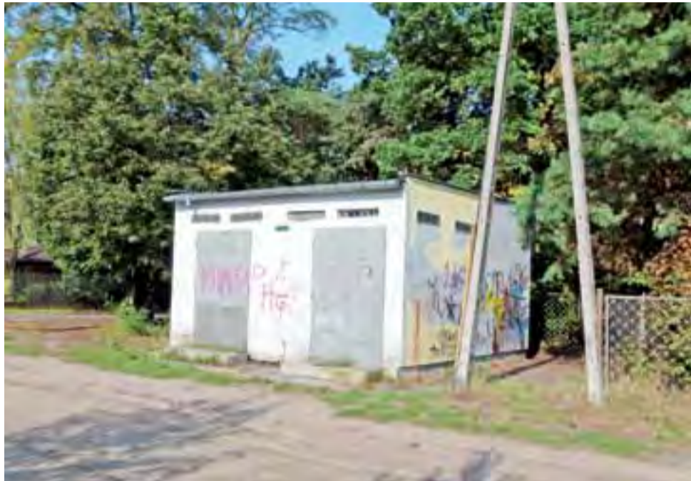
Mieszkańcy niekiedy boją się przechodzić w okolicach tego transformatora.

Innym problemem są piraci drogowi, którzy upodobałi sobie kręcenie kółek, tzw. bączków na skrzyżowaniu Spacerowej z ul. Zacisze. Trzecią sprawą pozostają biesiadnicy. W pobliżu znajduje się transformator, przy którym „na papieroska” (według mieszkańców może tam również dochodzić do zażywania dopalaczy – przyp. red.), a nie raz na coś mocniejszego do picia zbierają się uczniowie pobliskich szkół oraz inni młodzi ludzie.