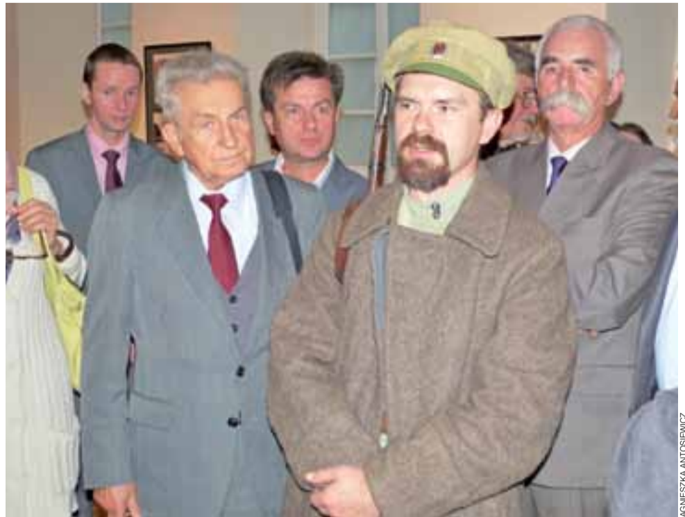
Przybyli na wystawę goście z zacięciem słuchali ciekawostek o eksponatach znajdujących się w zbiorach skierniewickich kolekcjonerów.