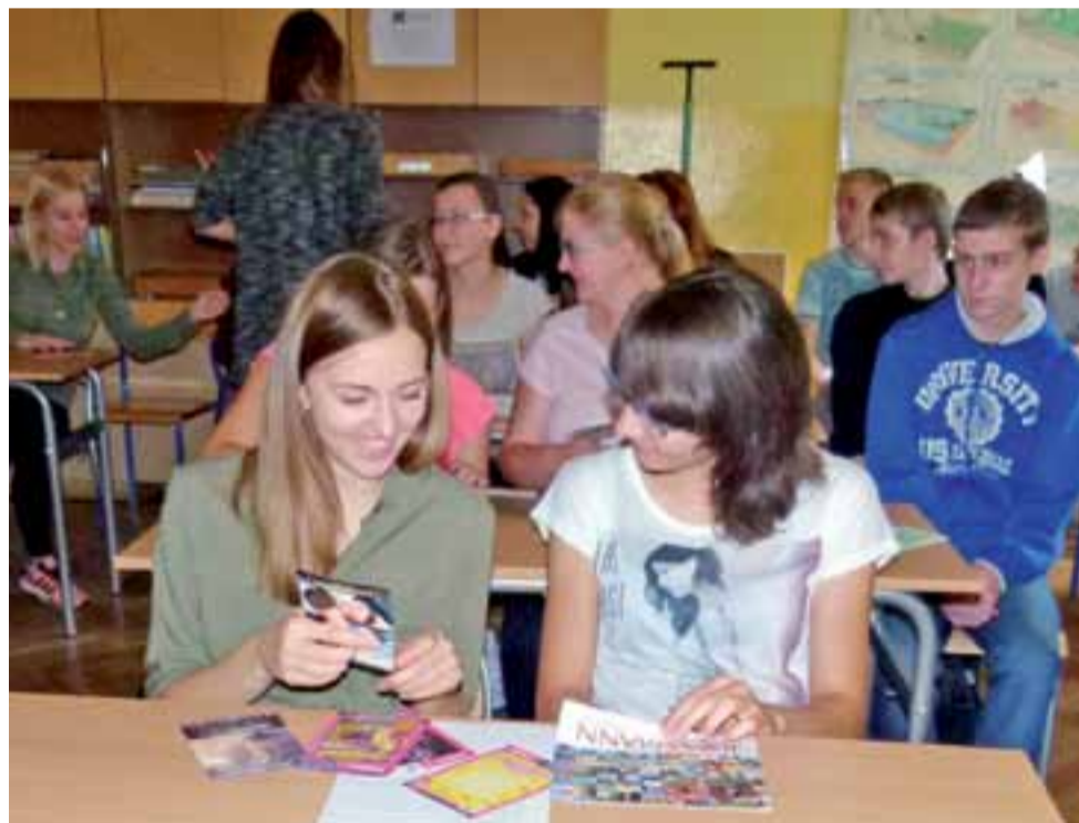
Jak działa język reklamy? Licealiści w trakcie analizy haseł marketingowych wykorzystywali ogólnodostępne materiały promocyjne.

Obydwa konkursy trwają od 22 września do 16 października. Prace i fotografie można dostarczać do Domu Kultury w Niesułkowie lub do Domu Kultury w Strykowie. Na zwycięzców czekają nagrody, które zostaną rozdane 30 września, o godz. 12.00, w Domu Kultury Niesułków. ljs