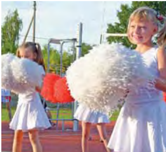
Uczennice „Jedynki” w roli cheerleaderek.