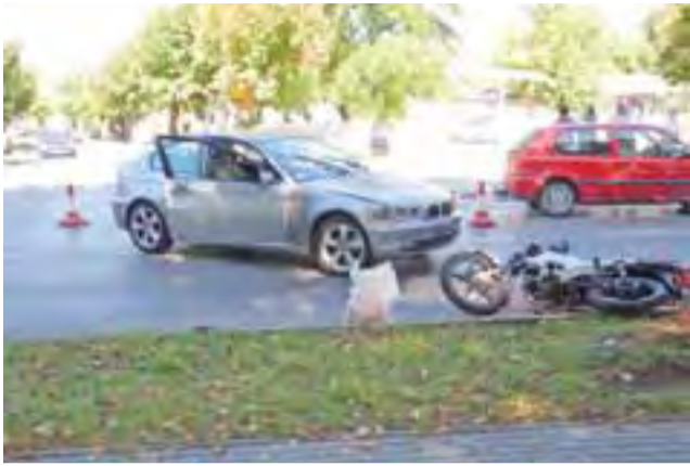
Wypadek na skrzyżowaniu Zgierskiej i Piątkowskiej.