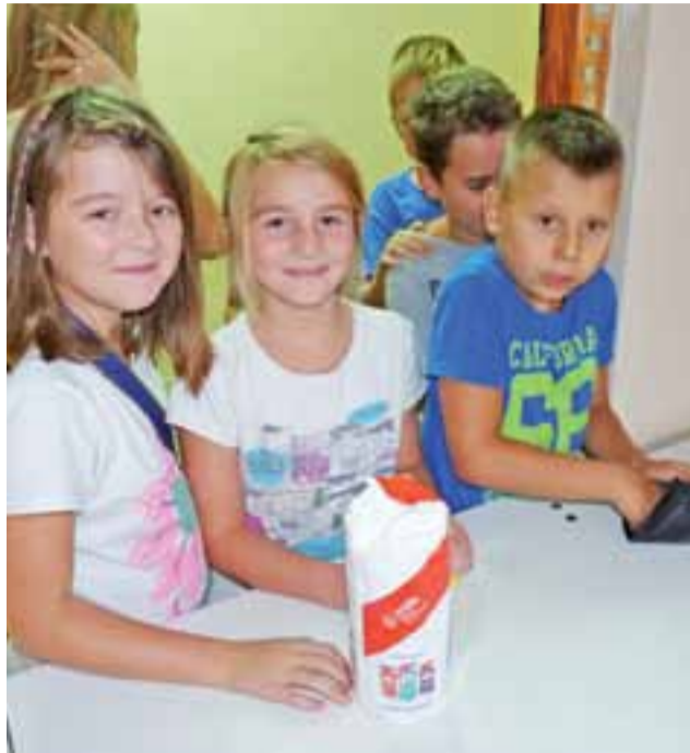
Wafle ryżowe to jedna z bardziej konkretnych przekąsek, jakie dzieci mogą teraz kupować w szkolnych sklepikach.

z ryb, jaj i serów (ale nie topionych), wyrobów z roślin strączkowych, orzechów, oleju, masła i miękkiej, niearomatyzowanej margaryny, wszystko bez soli i sodu, ale za to z innymi przyprawami. Nie ma mowy o majonezie, natomiast jeśli ketchup, to tylko taki, którego 100 g produktu wyprodukowano z nie mniej niż 120 g pomidorów. Napoje gazowane i słodzone mają zastąpić soki owocowe, warzywne lub mieszane, bez dodatku cukru i substancji słodzących oraz o niskiej lub obniżonej zawartości sodu i soli. Mile widziane są również niedosłodzone jogurty, kefir czy maślanki, a do pochrupania suszone owoce, warzywa i nasiona, oczywiście również bez dodatku cukru i substancji słodzących. Niby proste, a jednak – jak wynika z naszych rozmów z dyrektorami niektórych szkół – nie do końca. Diabeł tkwi w szczegółach. Układanie sklepowego asortymentu po nowemu w praktyce musiałby się sprowadzić do analizowania zawartości składników poszczególnych produktów pod kątem wytycznych, a to jest trudne. – Wiele lubianych przez dzieci produktów jest na granicy normy, natomiast przynajmniej te przepisy, które obowiązują na chwilę obecną, nie są