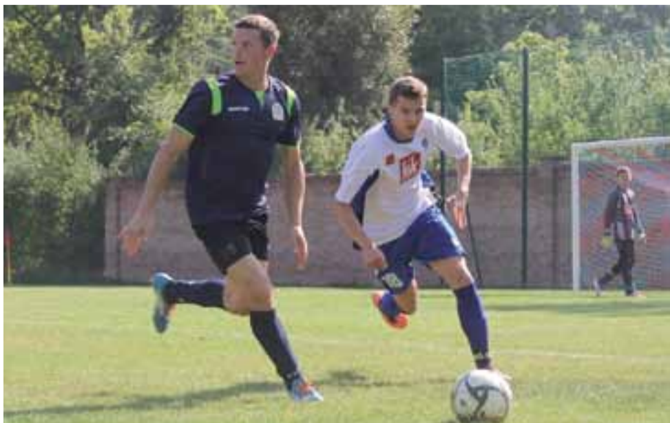
Struga Dobieszków (ciemne stroje) zdejmuje się w końcu zatrzymała regres i ruszyła do przodu.