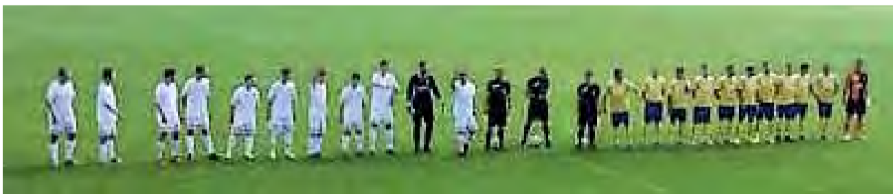
Drużyna Stali Głowno (białe stroje) fatalnie zaprezentowała się na stadionie w Radomsku.