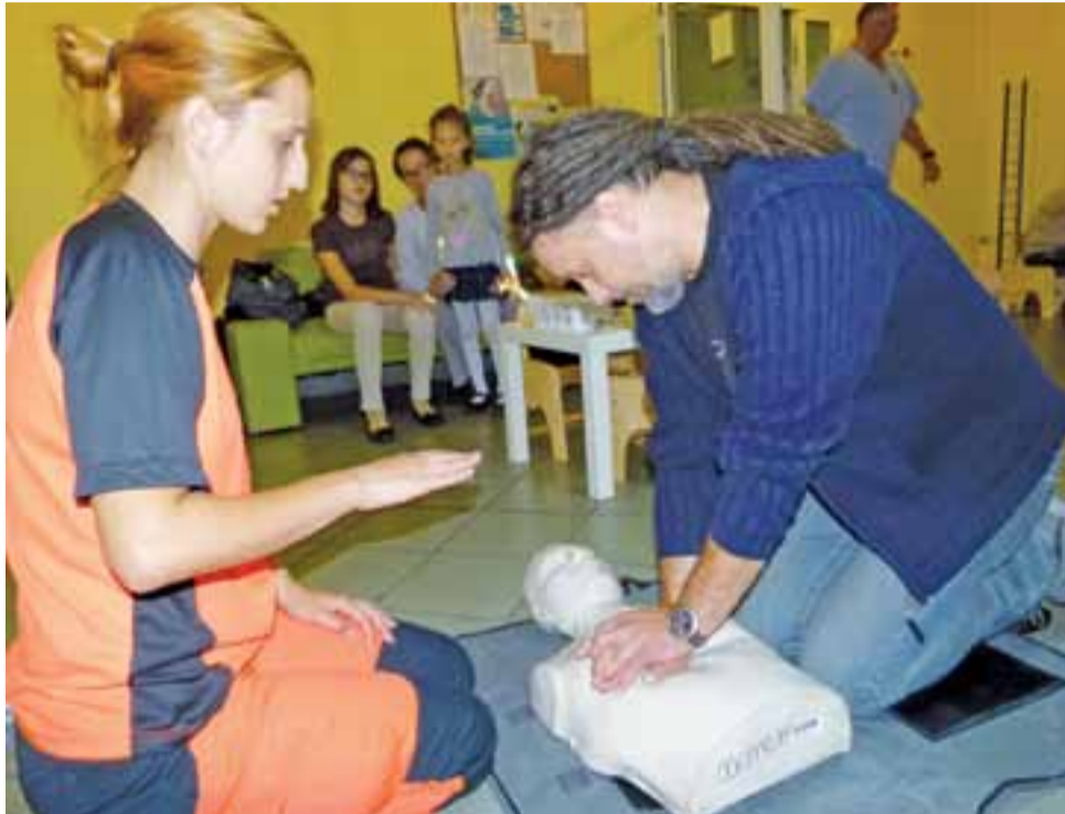
W szpitalnym holu można było pocwiczyć wykonywanie resuscytacji krążeniowo-oddechowej.

Taka akcja to bardzo dobry pomysł, dlatego, że gros pacjentów trzyma się kurczowo jednego lekarza. Wzbogacenie oferty o badanie słuchu czy densytometrię, które nie w każdej poradni jest wykonywane, albo trzeba gdzieś dalej się na nie dostać, to już dużo. Podobne kłopoty mają pacjenci z dostaniem się do poradni leczenia osteoporozy czy poradni laryngologicznej z niedostłuchem, zaburzeniami słuchu. Osoby starsze najczęściej z nich nie korzystają, ze względu na kolejki. Odwleczony czas wizyty działa zawsze na niekorzyść. Tymczasem u nas dzisiaj wszyscy mogą poddać się pierwszej konsultacji i albo uspokoić, że wszystko jest w porządku, albo zostać pokierowanym na dalszą ścieżkę leczenia.