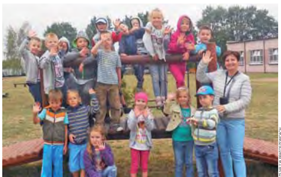
O tym, że szkoła to nie tylko nauka, ale również czas na zabawę, mogły przekonać się w pierwszych dniach września pierwszaki z Zespołu Szkół nr 2 w Bratoszewicach. Korzystając z pięknej pogody, najmłodszy uczniowie podstawówki wyszli na szkolny plac zabaw, by tam wziąć udział w zabawach integracyjnych przygotowanych dla nich przez nowych wychowawców. ijs