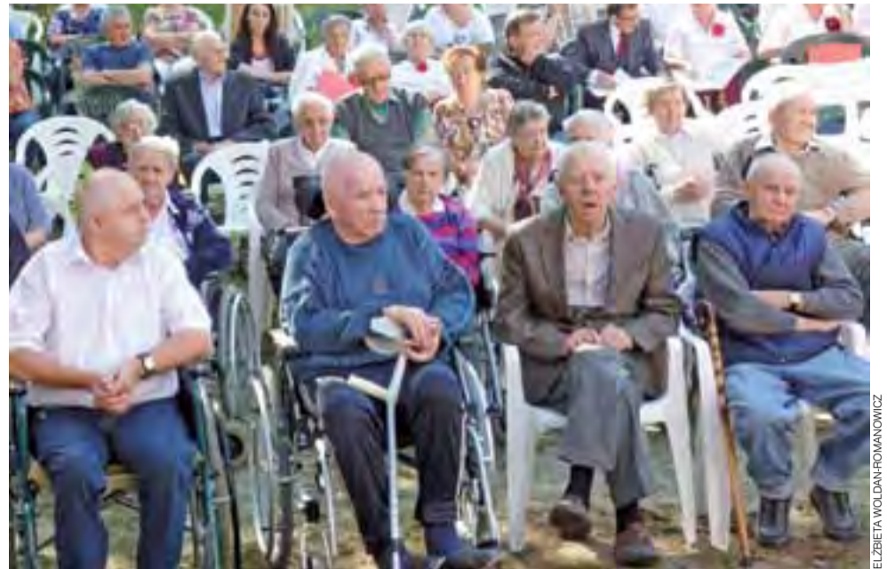
Po prostu Dom. Mieszkańcy DPS w Głownie i goście jubileuszowej uroczystości.