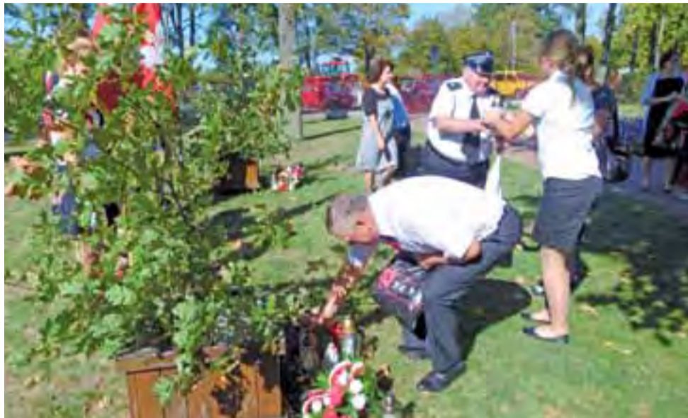
Jak co roku, przy Dębach Katyńskich zapalono znicze i złożono kwiaty. W uroczystości brali udział m.in. członkowie rodzin pomordowanych.

sposób możemy uczcić nie tylko pamięć naszego wujka, ale również innych, którzy zostali pomordowani przez NKWD. Nie mieszkam tutaj na co dzień, ale jak tylko przejeżdżam koło szkoły, to na sercu zawsze robi mi się milej. To symboliczne miejsce pomaga zachować pamięć nie tylko w naszych rodzinach, ale również w całej społeczności lokalnej. Jesteśmy za to ogromnie wdzięcz-