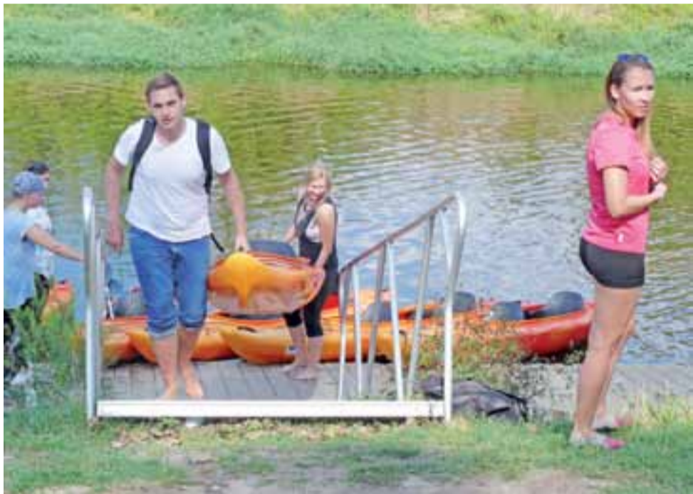
Blisko 20-osobowa grupa kajakarzy pokonała odcinek Bzury od Strugienic do Łowicza w 2,5 godziny.

się płynęło, choć miejscami wody w Bzurze nie było zbyt dużo, a w kilku miejscach koryto przegradzały powalone drzewa. Nieco zaskoczeni byli jednak spotkany mi w czasie splywu krowami, sto-