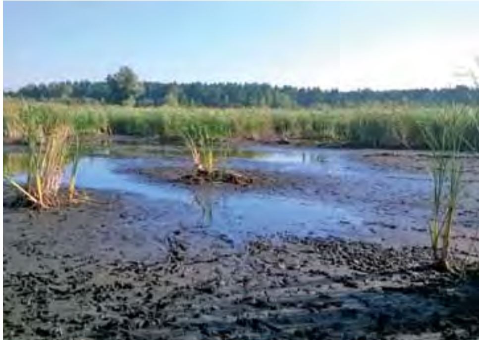
Najgorzej sytuacja wygląda na Rydwanie Górnym, gdzie z lustra wody, które normalnie zajmuje 50 ha, zostało błoto i kałuża.

Gospodarze stawów z przyduchą nie mogą zrobić praktycznie nic. GR Łyszkowice jedynie na jednym z największych swoich stawów, czyli liczącym 150 ha „Okręcie”, próbowała zwiększyć poziom wody, poprzez rozmieszczenie czterech aeratorów, czyli urządzeń pompujących wodę z dna, na zasadzie podobnej do gejzerów. Takie rozwiązanie moż-