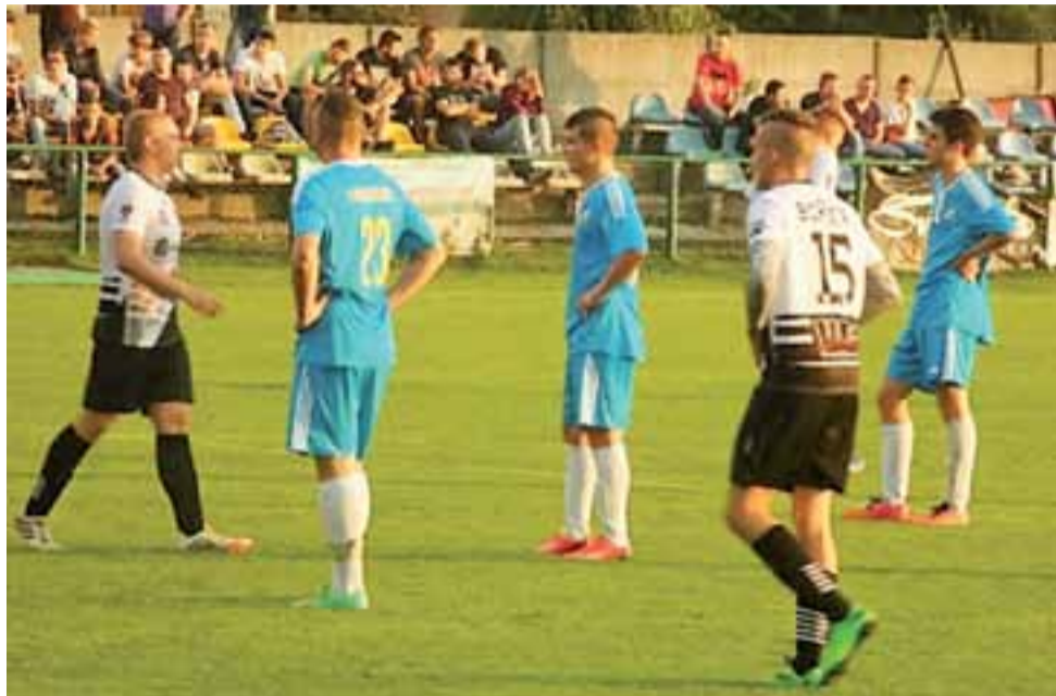
Głównianie ze Stali (niebieskie stroje) z niedowierzaniem patrzyli na to, że na ich boisku wygrywają rywale.

szczególnie z drużynami w zasięgu głównian. Takim rywalem wydawał się zgierski Boruta, który tegoroczną kampanię rozpoczął słabo. Gospodarze wyszli z nastawieniem walki o komplet punktów, ale dobrych chęci i woli walki wystarczyło tylko na kilkanaście minut spotkania. Po niezłym w wykonaniu gospodarzy początku meczu później lepiej radzili sobie zgierzanie, którzy jeszcze przed przerwą mogli pokusić się o strzelenie bramki, ale po serii rzutów różnych piłkarzy Stali najpierw urato-