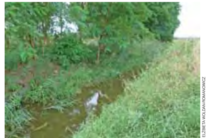
Koryto Moszczenicy. To tutaj znaleziono zwłoki mężczyzny.