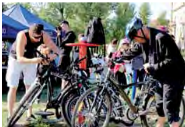
Przygotowanie sprzętu przed startem jest równie kluczowe do odniesienia zwycięstwa, jak dobra forma fizyczna.