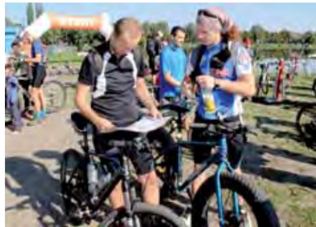
Uczestnicy rajdu przed wyruszeniem uważnie przeglądali mapę z punktami kontrolnymi, by jak najszybciej odszukać je później na trasie.

Wśród miłośników rowerowych zmagani nie zabrakło gospodarzy z Głowna, ale do rajdu przystąpili także zawodnicy m.in. ze Strykowa, Warszawy, Skierniewic, a nawet Tarnowa. Start i meta rajdu na orientację mieściła się na terenie rekreacyjnym nad zalewem Mroźyczka w Głownie. Na trasie Mega uczestnicy mieli do odnalezienia maksymalnie 19 punktów