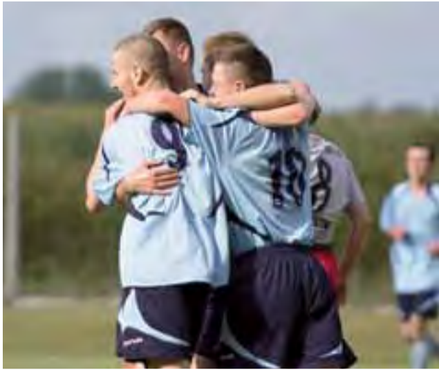
Radość piłkarzy Błękitnych z pierwszego zwycięstwa w sezonie.

Jedyną drużyną z kompletem punktów jest lider Orlik Sobień, który ma na swoim koncie już pięć zwycięstw z rzędu. Z kolei na przeciwnym biegunie znajduje się Kotan Ozorków, który nie zdobył jeszcze ani jednego punktu, a w minionej kolejce po-