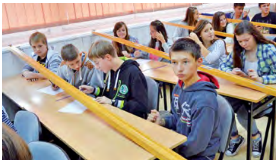
Uczniowie Gimnazjum w Popowie mogli poczuć się jak prawdziwi studenci.