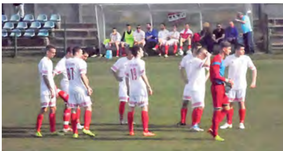
Piłkarze Stali Głowno zastanawiają się teraz, w którą stronę pójdzie ich ukochany klub.

Po zmianie stron paradyżanie rozkręcili się na dobre i szybko strzelili kolejne bramki. Kluczowy okazał się okres między 55 i 65 min., w której gospodarze zanotowali aż trzy trafienia. Po stracie drugiego gola głownianie kompletnie spuścili z tonu i definitywnie pozabawili się szans na choćby remis w tym spotkaniu. Ostatecznie lider rozgromił Stal 4:0 i powięk-