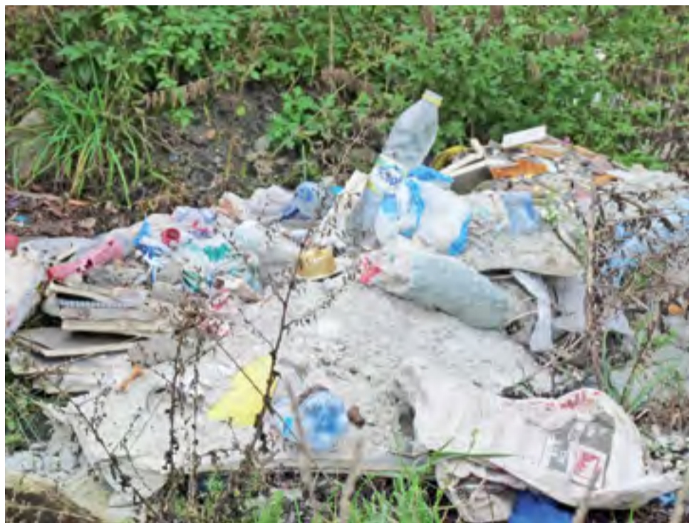
Na gminnym gruzowisku natknąć można się nie tylko na to, co wyrzucono z domu w trakcie remontu, ale również na to, co jadła i piła ekipa remontowa.

Sprawdziłiśmy. Gminne gruzowisko rzeczywiście staje się śmietniskiem. Na znajdującej się na uboczu nieogrodzonej i nieoznakowanej w żaden sposób gminną działkę na tyłach ulicy Ozorkowskiej trafia w tej chwili wszystko. Z zarośli w pobliżu torów kolejowych wyziera nie tylko górkę gruzu, ale również potłuczona tetrakota, odpady styropianowe, opakowania tekturowe, plastikowe rury, kable, opakowania po żywności i napojach oraz czarne wor-