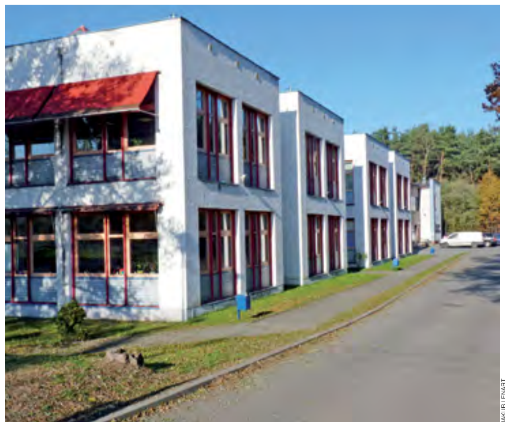
Jedną z inwestycji ma być termomodernizacja Szkoły Podstawowej nr 2.

W temacie inwestycji zapowiada się więc, tradycyjnie już, kolejna ciekawa dyskusja. ■