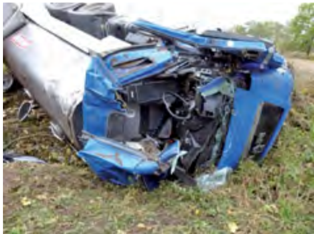
Kabina cysterny uległa niemal całkowitemu zgnieceniu.

Kierowca w stanie ciężkim został przetransportowany śmigłowcem LPR do szpitala w Łodzi, gdzie pozostał. Do zdarzenia doszło w piątek, 23 października, około godz. 14.30, na drodze pomiędzy miejscowościami Sobota a Sobocka Wieś. Kierujący samochodem ciężarowym marki MAN z cysterną, 53-letni mieszkaniec powiatu sierpeckiego, na prostym odcinku drogi zjechał na pobocze – pojazd zsunął się do rowu i przewrócił na bok. Auto i cysterna wypełniona mlekiem należały do OSM w Sierpcu. W wyniku zdarzenia kabina cysterny została niemal całkowicie zmiądzżona. Strażacy przy użyciu sprzętu hydraulicznego uzyskali dostęp do uwięzionego w niej kierowcy i na desce ewakuowali go na zewnątrz. Mężczyzna trafił pod opiekę zespołu Ratownictwa Medycznego. Jego stan został określony jako poważny. Na miejsce zadysponowano śmigłowiec LPR „Ratownik 16”, który przetransportował uszkodzonego do szpitala w Łodzi, gdzie mężczyzna pozostał.