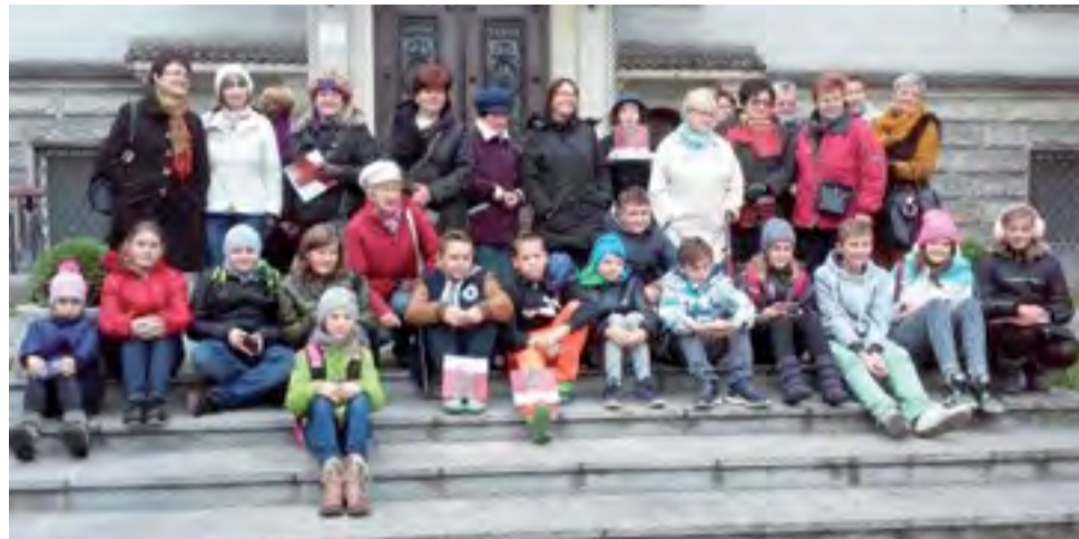
Międzypokoleniowa integracja. Wspólna wycieczka głowieńskiego Stowarzyszenia „Senior” z dziećmi objętymi działaniami Stowarzyszenia „Zabrzeźnia”.

odwiedziło Eksperymentarium w Manufakturze w Łodzi. – Naszą ofertę opracowaliśmy przede wszystkim z myślą o tych dzieciach, które w czasie wakacji nigdzie nie wyjechały, choć nie był to warunek konieczny. O planowanych wyjazdach informowaliśmy uczniów poprzez szkołę pod koniec roku szkolnego i tą drogą zbieraliśmy chętnych. Udział w obydwu wycieczkach był dla dzieci nieodpłatny, myślę, że wszyscy bawiliśmy się na nich doskonale, zwłaszcza wizyta w eksperymentarium okazała się