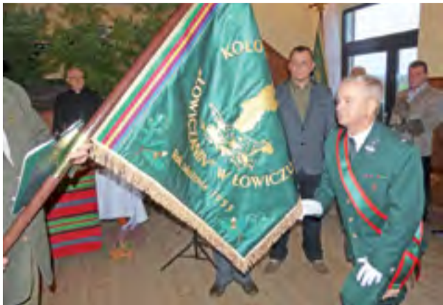
Sztandar Koła Łowieckiego „Łowiczanie” już poświęcony i nadany. Czas odnowić myśliwskie ślubowania.

Msza św., uroczystość poświęcenia i nadania sztandaru oraz bal myśliwych odbyły się w Domu Ludowym w Klewkowie. Myśliwi odnowili słowa swojego ślubowania na sztandar, obiecując praktykowanie dobrego myślistwa, przestrzeganie praw łowieckich, postępowanie zgodne z zasadami