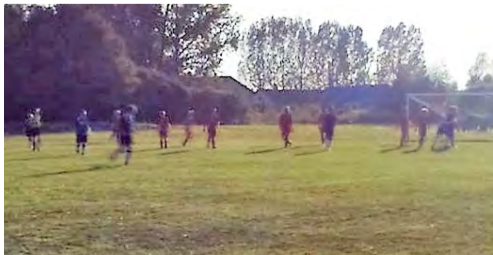
W spotkaniach A-klasy dzieją się niekiedy ciekawsze rzeczy niż na boiskach Ekstraklasy.

■ Następna, 11. kolejka odbędzie się w dniu 31 października: Huragan Śwędów - Sport Perfect, LKS Dąbrówka - Orlik, Boruta II Zgierz - Kotan, Kobra - Błękitni, LKS Kalonka - SMS Łódź, Orzeł II - Zjednoczeni II, LKS Sarnów - KS Gozdów.