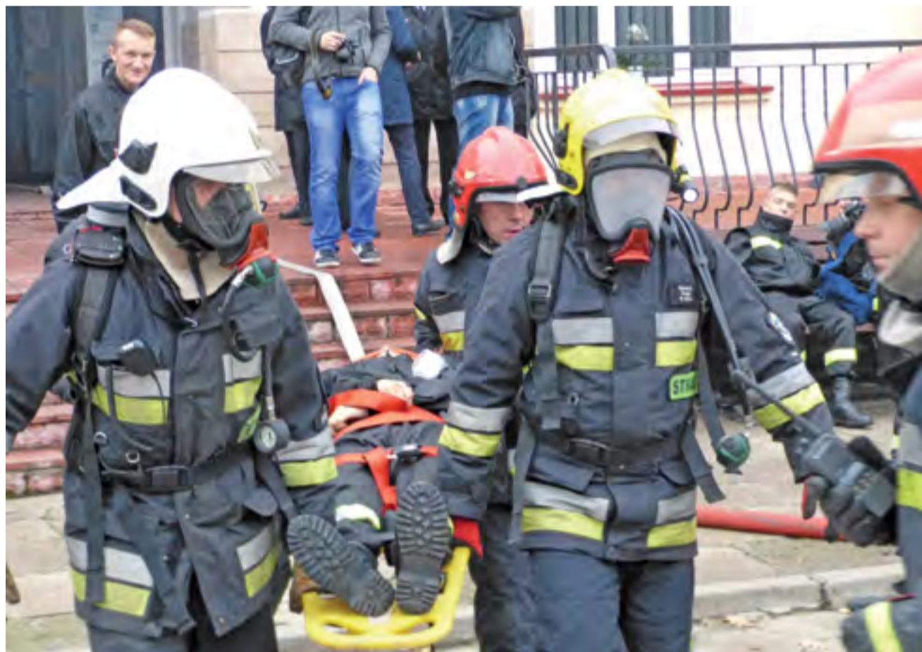
Strażacy na noszach ewakuują „poszkodowanych” z budynku szkoły.