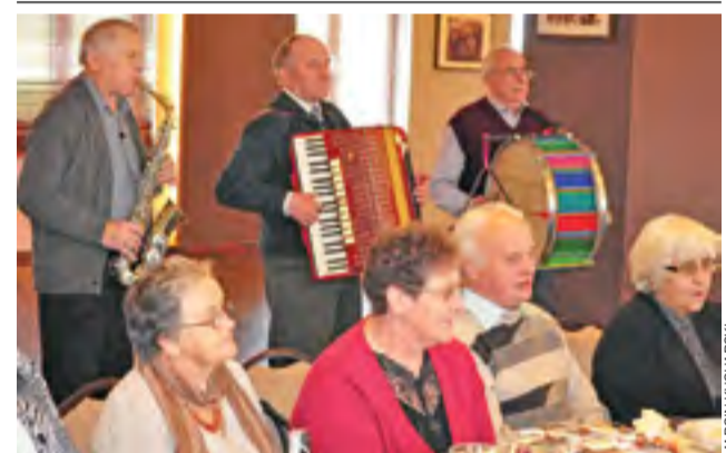
Na Klubowym Dniu Seniora spotkali się 22 października w sali bankietowej w Kiernozi seniorzy z gminy Kiernozia. Spotkanie uświetniła Kapela Ludowa zespołu Kiernozianie. mak