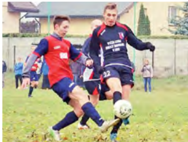
Walcząca drużyna Iskry Głowno (czerwone koszulki) jest w tym sezonie wysoko notowana i ma szanse nawet na awans do A-klassy.

Powodów do zadowolenia nie miały inne zespoły z naszego regionu. Sokół Popów uległ na własnym boisku Victorii Rąbień 2:4, Powstaniec niespodziewanie przegrał u siebie z Hetmanem Łódź 0:1, a Struga Dobieszaków mimo ambitnej walki nie zdołała powstrzymać niepokona-