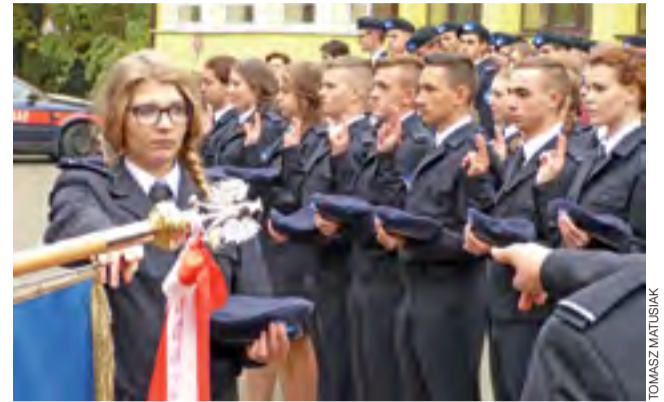
„Ślubujemy kształcić w sobie cechy, które posiadał nasz patron!” – fragment tekstu ślubowania w II LO w Łowiczu.

Na koniec odbył się bal, który trwał do północy. W przerwach między biesiadą a tańcem uczestnicy imprezy mieli możliwość obejrzenia wystawy fotograficznej Błażeja Manelskiego, pracownika Ośrodka Hodowli Zwierzyny PZŁ w Sadłowie, przedstawiającej obrazy przyrodnicze i myśliwskie. mwk