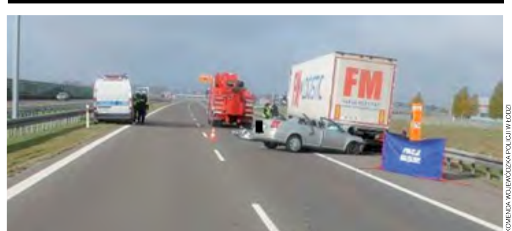
Miejsce tragedii. Niewiele zostało z Toyoty, która w poniedziałek rozbiła się o naczepę ciągnika siodłowego na autostradzie A2.

zabezpieczono 44,5 litra bezbarwnej cieczy o zapachu alkoholu o wartości rynkowej oszacowanej na 3,5 tys. zł, a także 555 paczek papierosów bez polskich znaków akcyzy o wartości oszacowanej na 7.135 zł, jak również 6 kg suszu tytoniowego o wartości 3,5 tys. zł. Materiały dowodowe zabezpieczyli celnicy. oprac. ewr