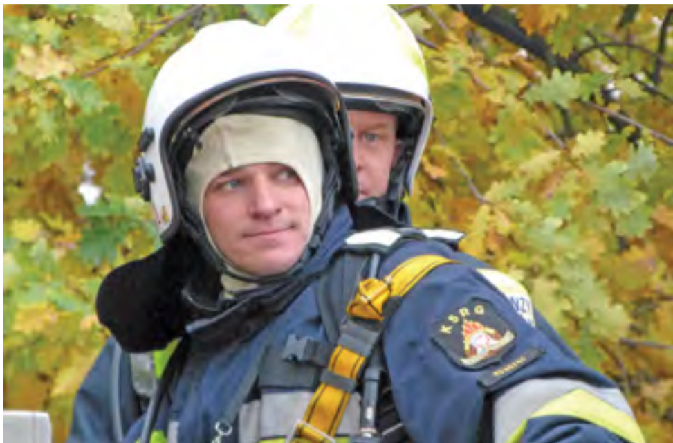
Druhowie z OSP Rogóżno na podnośniku, podczas imitacji akcji gaśniczej.