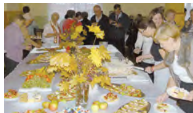
Jesienny stół obfitości z tortem w roli głównej zaufundowały dmosińskim seniorom lokalne firmy.