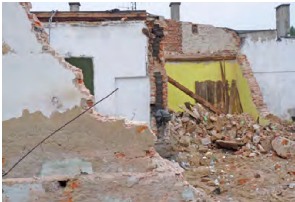
Budynek zniknął cegła po cegle, pozostawiając pustą przestrzeń w narożniku ulicy Kolejowej.