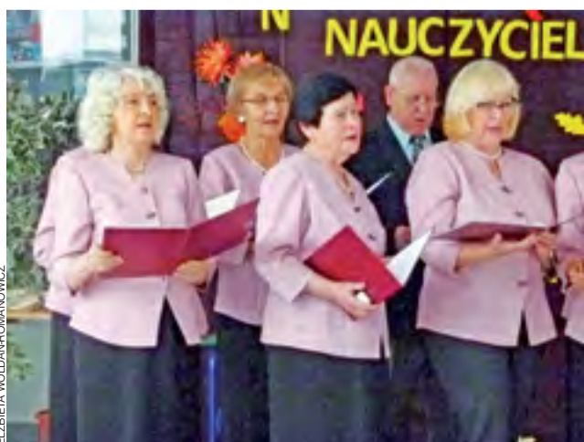
Dzień Nauczyciela. Na uroczystości śpiewał chór „Stoneczny Krąg”.

17 uczniów I klasy SP w Bratoszewicach ślubowało być dobrym, sumiennym i grzecznym uczniem, szanować kolegów, nauczycieli i pracowników szkoły oraz przyrodę wokół siebie. Akademia w bajkowej oprawie odbyła się 15 października. Dzieci złożyły przysięgę pierwszoklasisty w obecności: rodziców, dyrekcji szkoły, wychowawców i kolegów ze starszych klas. Uczniowie klas II-VI przygotowali wesoły program artystyczny i drobne prezenty, zaś rodzice – słodki poczęstunek. Ijs