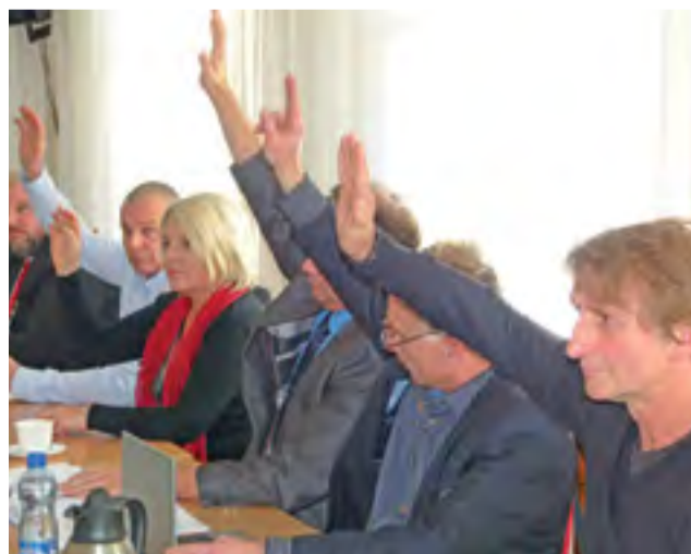
Las rąk strykowskich radnych będących na „Nie” dla zakupu posiadłości w Bratoszewicach.

w ciągu tygodnia podpisane zostałoby porozumienie z konserwatorem zabytków, że ten obiekt po zakupie gmina mogłaby odrestaurować przez 10 następnych lat, a więc nie burzyć inwestycji, które mamy już zaplanowane, a jednocześnie zrobić wszystko, aby pozyskać środki zewnętrzne na modernizację całego tego obiektu, podejmując się tego zadania – powiedział burmistrz. str. 10