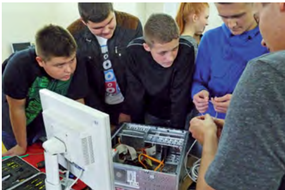
Podczas warsztatów gimnazjaliści mogli dokładnie obejrzeć pracownię ZSP nr 1 i zgromadzony w nich sprzęt.