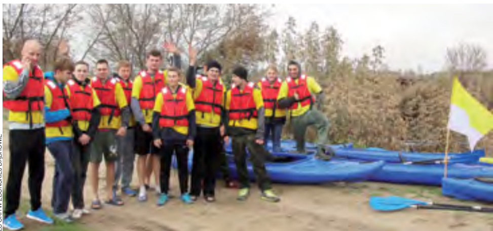
Splyw kajakowy w październiku , młodzież w krótkich spodenkach i klapkach? – jak widać można. Niektórzy wprawdzie ubrali się cieplej, ale odwagi w tej grupie chyba nie zabrakło.