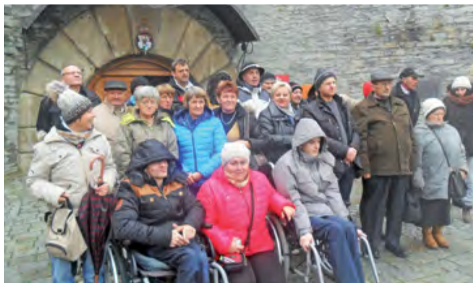
Zobaczyli, jak warzono piwo. Uczestnicy wycieczki przed wejściem do Muzeum Browaru w Żywiec.

Na miejscu, w Niepokalanowie, zwanym też „Grodem Maryi”, wszyscy wzięli udział we mszy św. odprawionej w intencji pielgrzymów w bazylice. Uczestnicy wyjazdu byli pod dużym wrażeniem architektury świątyni. Kolejnym punktem progra-