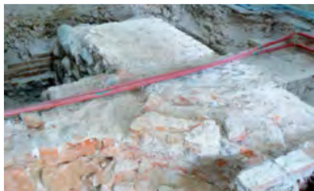
Fragment odkrytego muru z XIV wieku – najstarsza pozostałość po dawnym kościele.

Największym wydarzeniem było odkrycie relikwii najstarszego, istniejącego w tym miejscu murowanego kościoła. W zachodniej części nawy uchwycono mur biegnący na osi wschód-zachód z przyporą w jego części zachodniej. Na podstawie wstępnych wyników badań architektonicznych prowadzonych przez krakowskich badaczy ustalono, że mogą to być pozostałości świątyni gotyckiej z XIV wieku. Dostawione do niej późniejsze mury, również odsłonięte w trakcie badań, pozwalają przedsięwziąć dalszą rozbudowę kościoła, związaną prawdopodobnie z jego podniesieniem do rangi kolegiaty w 1433 roku. Odkrycie średniowiecznych murów jest kluczowe dla odtworzenia najstarszych faz wznoszenia obecnej katedry. Odkryty został też średniowieczny cmentarz, który uchwycono w kilku miejscach na północ od najstarszych murów. Na podstawie odkrytych