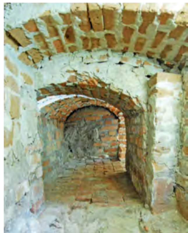
Krypta nr 8. Wiele ciekawych rzeczy znajdowało się w jej wschodniej części. Znaleziono tam pochówki wielu osób, a w nich m.in. kielich z pateną (wstępnie datowany na XVIII wiek) i cynowy świecznik.

Nie we wszystkich z otwartych krypt prowadzone były prace wykopaliskowe. W kryptcie