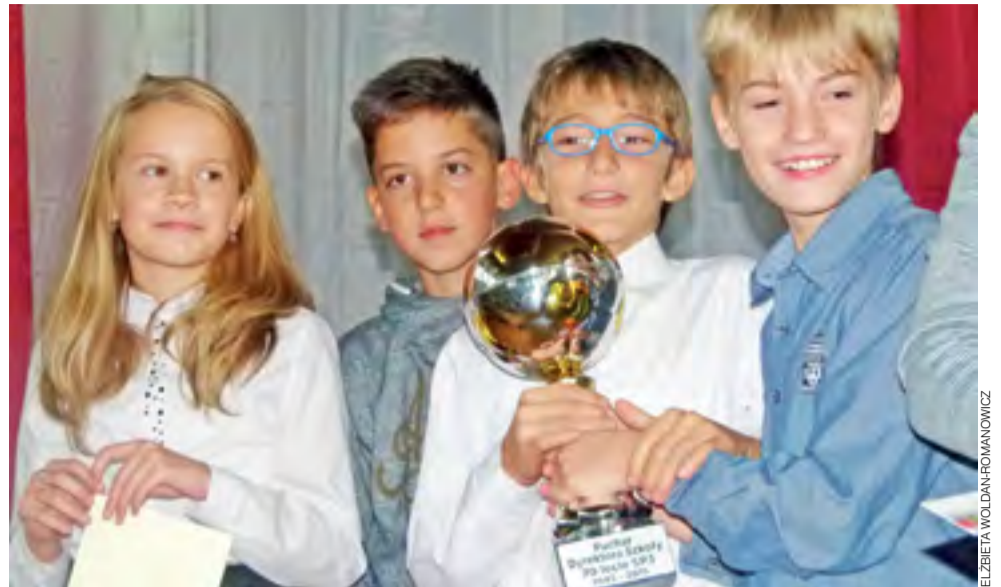
Puchar Dyrektora Szkoły za zwycięstwo w turnieju w mini piłkę nożną trafił do reprezentacji klasy V b.