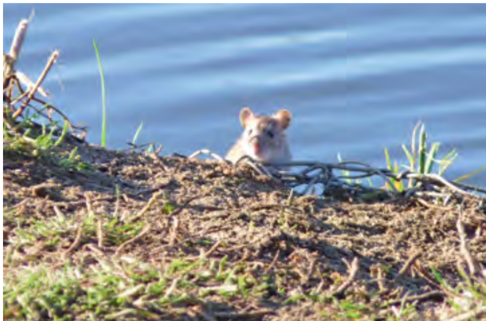
Początkowo gryzoń zdawał się być nieufny, później poczuł się dużo pewniej.

Szczury zamieszkują tam, gdzie mają łatwo o dostęp do jedzenia, np. nadających się do spo-