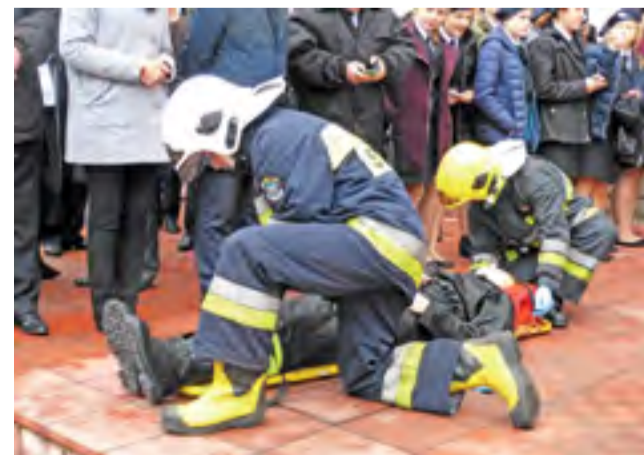
Pierwsza pomoc. Udzielanie jej ćwiczą druhowie z OSP Łowicz.