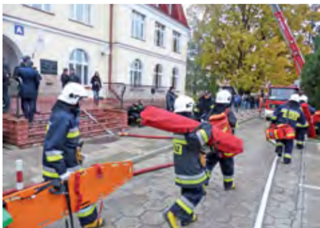
Dla młodzieży i 9 innych osób obserwujących ćwiczenia były okazją do zapoznania się z różnego rodzaju sprzętem ratowniczym i gaśniczym.

cowanych sytuacjach. Bardzo dobrym pomysłem okazało się po raz kolejny zaangażowanie w ćwiczenia młodzieży. tm