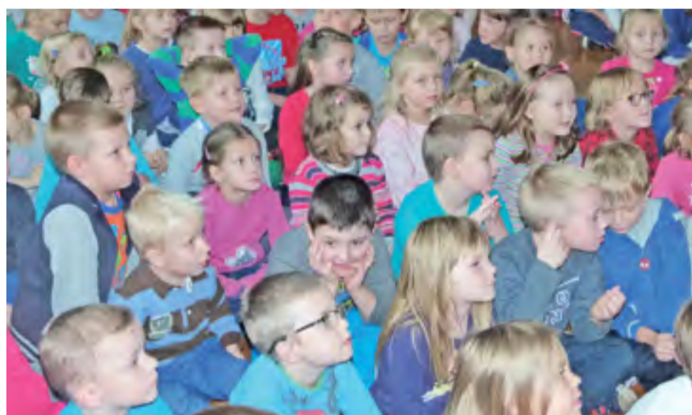
Uczniowie „Trójki”. Obecnie w szkole uczy się 295 dzieci.

Powstała w 1945 r. i początkowo zajmowała drewniany budynek przy ul. Skokowskiego 3, wyposażony w takie meble i pomoce naukowe, jakie podarowali jej mieszkańcy dzielnicy.