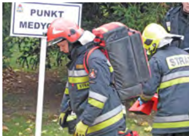
Starszy sekcjny Janusz Kielbasa (w czerwonym helmie), jeden ze strażaków PSP zaangażowanych w ćwiczenia.